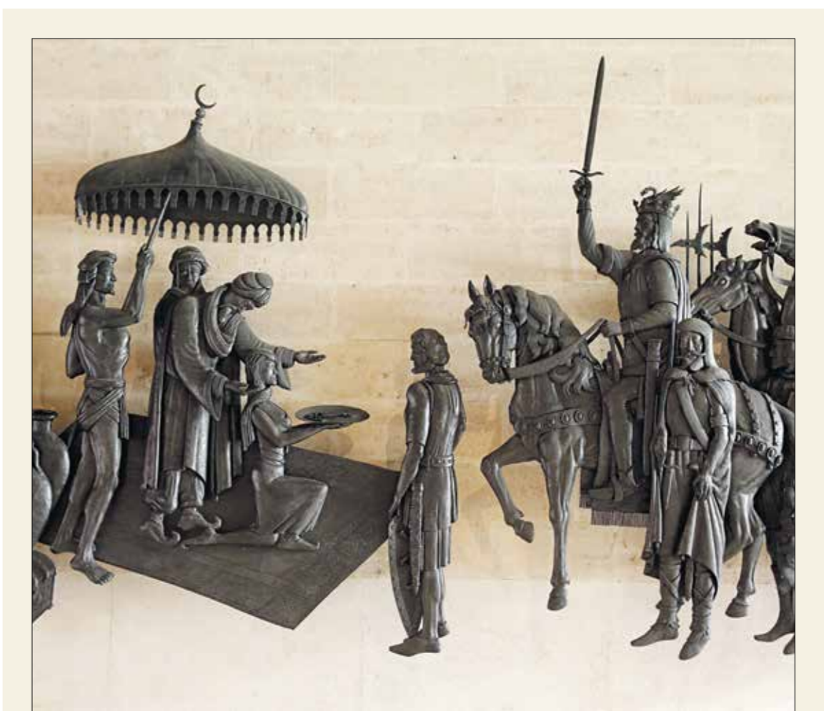
ملحونة إسبالية لجسد تسليم مفاحي مدينة بالما للمسلمين