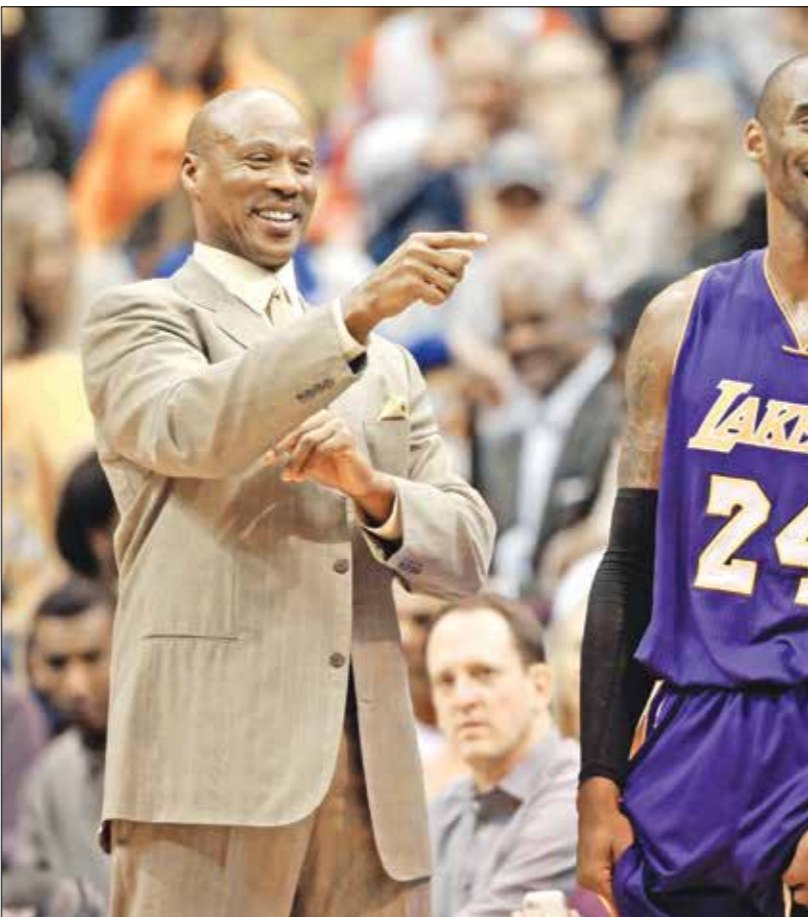
براينت يلقي الشلّة بنجاحه اللابحج الجديد

كما ساهم اللاعب البالغ من العمر (36) عاماً