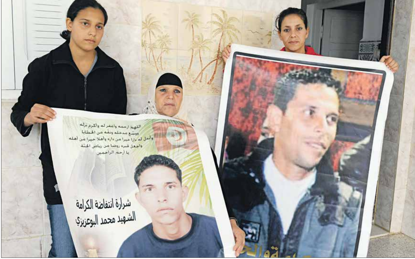
والدة بوعزيزي، منوبة وشقيقته ليلى وبسمة يتذكرن الظلم الذي تعرض له

أضرم محمد بوعزيزي في مثل هذا اليوم 17 ديسمبر/ كانون الأول، قبل أربع سنوات، النار في جسده، احتجاجاً على الظلم، تاريخ لا يزال عالماً في ذاكرة عائلته. تاريخ غير وجه تونس والمنطقة العربية