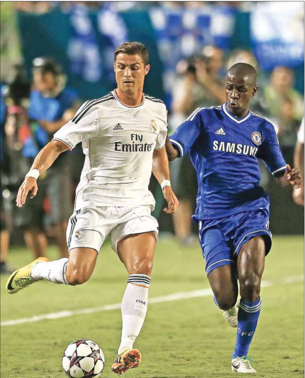
هاربط ريال مدريد الإسباني وتشيلسي الإنجليزي للنهائي دوري أبطال أوروبا

ريال مدريد وتشيلسي وبارن ميونخ أقوم المرشحين لخطف لقب «الأبطال»