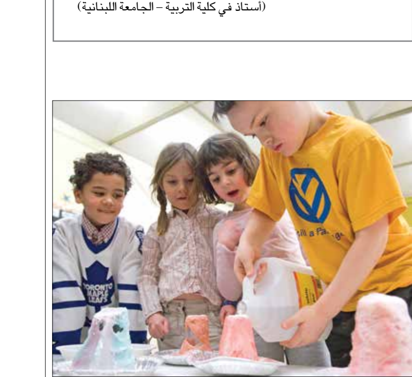
تتعلم استخدامات الخبز الأبيض لصدا ع الطعام

يبقى الوجه الكفني إلى حرمة ظهورهما. وذلك يطالب التنظيم المرآة انتقاماً لاعتقال مطلقة وزوجة الغبادي والشيشاني؟ أم إن ذلك يندرج في أداء تنظيمي الضمرة وداعش في إرهاب وإخضاع المجتمعات العربية؟! (استاذ في كلية التربية – الجامعة اللبنانية)