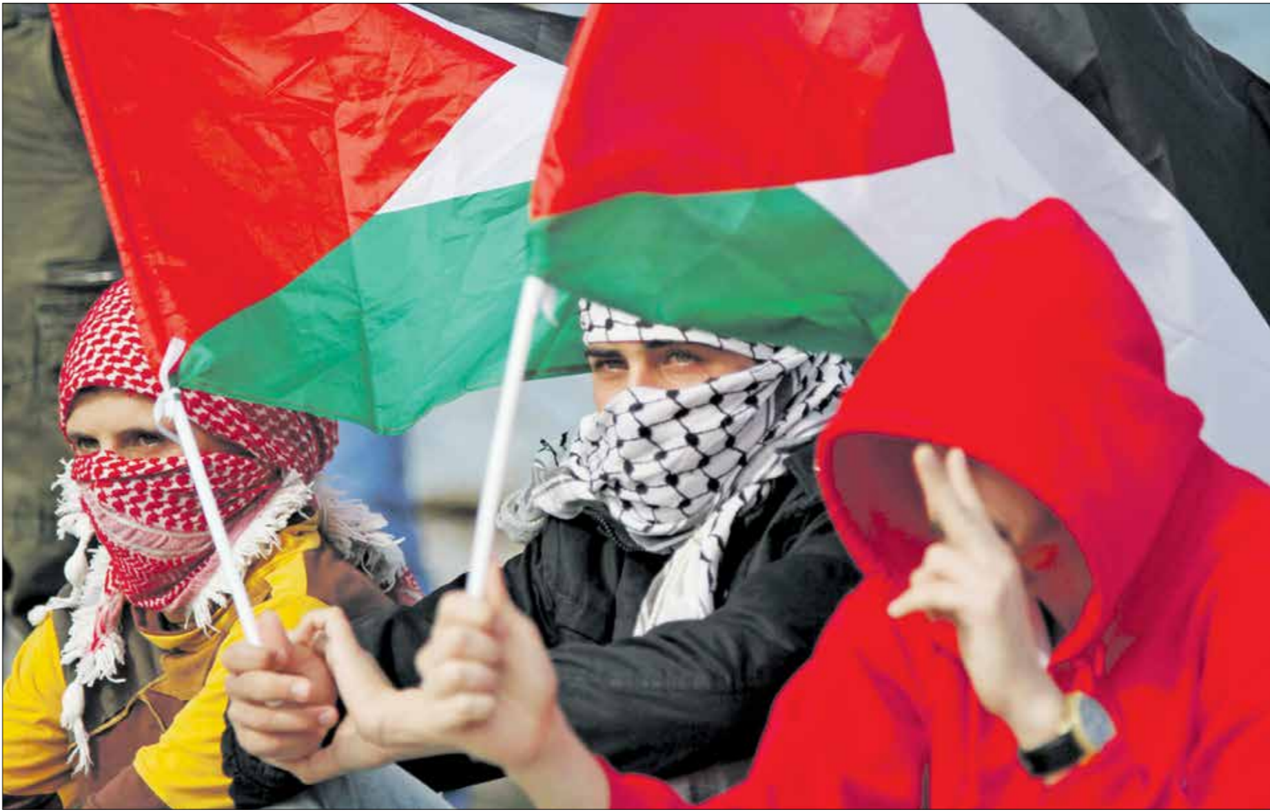
تكرار في تصريحات المسؤولين الفلسطينيين (الناظر)

وفي موزاة إشارته إلى أنّه لا يعتقد بأنّ «الحراك الدولي الأخير واعتراف البرلمانات الأوروبية بنا يجعل الإدارة الأميركية تقدم جديداً لم تقدمه من قبل»، بلفت إلى أنّ صيغة القرار الفلسطيني العربي، هي التي ستقدّم حتى الآن إلى مجلس الأمن، موضحاً أنّه «لم يتغيّر شيء من هذا القرار الذي تبنته جامعة الدول العربية»، وفي حين أنّ تقديم مشروع قرار فرنسي عربي محتل، رهن بموافقة «الفرنسيين والأوروبيين على ملاحظتنا»، تبدي مصادر تحوّلها من نجاح الإدارة الأميركية في جز الفلسطينيين إلى اومامة التناجل والمعاطلة مرة ثانية، فضلاً عن تحوّلها من أن تكون الاجتماعات المتتالية التي أجراها كيري مع وزراء خارجية روسيا وفرنسا وبريطانيا والمانيا، قد قادت فعلاً إلى تغيير في موقف هذه الدول، بما يحول دون أخذ الملاحظات الفلسطينية العربية على مشروع القرار الفرنسي الأوروبي وتعديل صيغة القرار على أساسها.