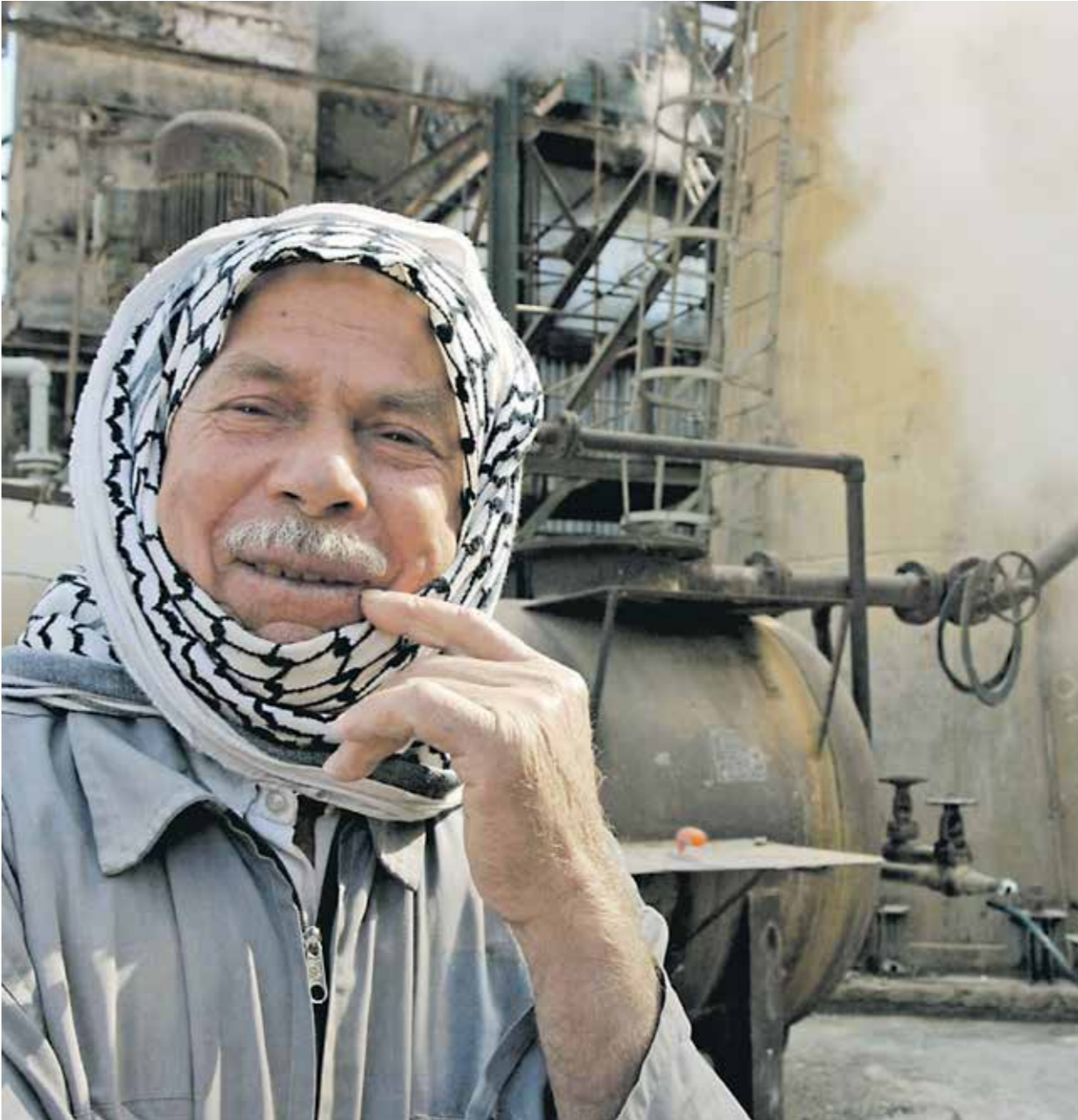
تدهور اسعار النفطيجبر الدول العربية للالجاه نحو الوحدة الاقتصادية

أمس، ولكنه اضاف ان السوق مستقر في النهاية. وفي رده على سؤال إن كانت «أوبك» متحمسة بشكل كبير على سعر الخام في الحفاظ على توازن ميزانيتها، بجانب الاحتفاظ باحتياطيات كبيرة من النقد الاجني والذهب، لوقيتها من آثار التقلبات السعريّة. (رويترز)