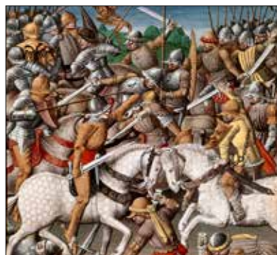
ممنعة هرقل ضد المانحين المسلمين

ما يشاع حول كون النص في الإسلام نضاً محكماً، ليس دقيقاً. تثبت الروايات والأحداث ومجريات الواقع الاجتماعي أن التعقيدات التي واجهته جعلته امام أكثر من خيار، لم يكن التشدد الخيار الوحيد خلال التاريخ الإسلامي