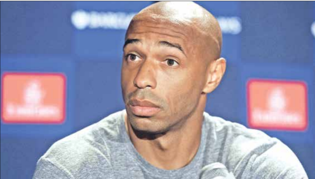
تيري هنري مع الطاقم الرياضي

ونقلت الصحيفة أن مهاجم أرسنال السابق، والذي غادر إلى نيويورك ريد بولز في الموسم على أن يتجه إلى العمل في وسائل الإعلام للعبقاء قريباً من عالم كرة القدم، وأكدت الصحيفة أن اللاعب سبق وأن ساعد مواطنه المدرب الفرنسي، أرسين فينجر، على الترويج مع أرسنال بلقب الدوري الممتاز وكأس الاتحاد الإنجليزي