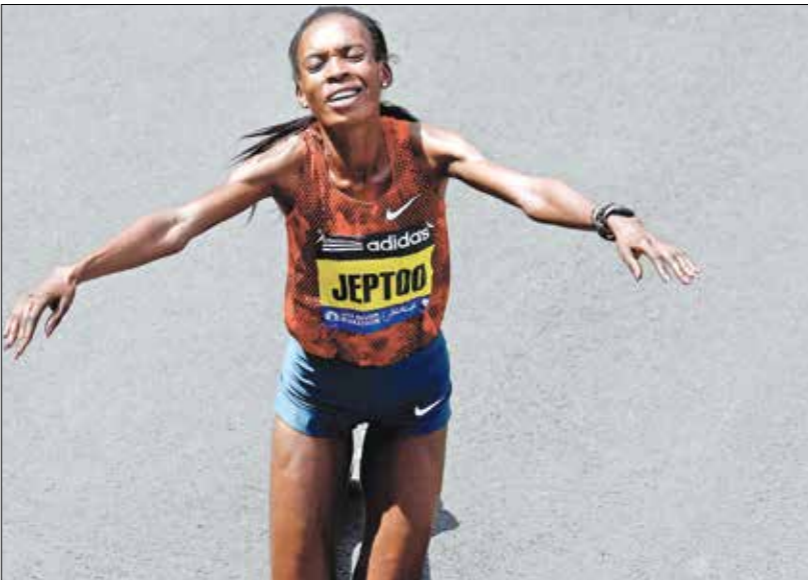
العداءة الكيبكية ريتا جيلو

في المسافات المتوسطة والطويلة، وهو ما جعلها عرضة للكثير من الاتهامات، إذ ظهرت ادعاءات بحدوث مخالفات تتعلق بالمنشطات مع طرف الرياضيين الكنديين، وهو ما رفضه الاتحاد، ولجأ فيما بعد إلى خطوة إنشاء هذا المركز، نقاديا لكل الإشاعات المرفوضة.