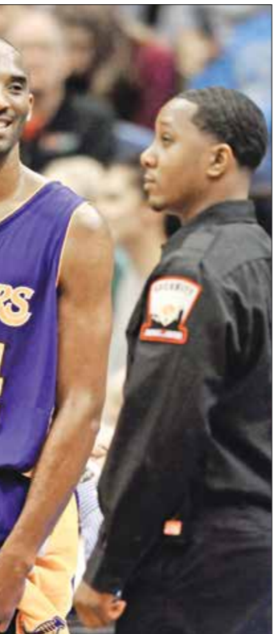
براينت يلقي الشلّة بنجاحه اللابحج الجديد

ورغم قلة مشاركته مع الأتلتيكو حيث إن سيمبوني يعتمد على الخنثائي جودين و ميداناً فإن خيمينيز حضر بشكل مفاجئ في قائمة الـ 23 لاعباً لموندنال مع زملاء لويس سواريز. يذكر أن سان سيني كان تعادف مع المدافع الفرنسي الشاب الياكويم الفريق الذي يقوده التشيلي مانويل بيليجريني قدم عرضاً قيمته 22 مليون يورو مقابل ضم اللاعب. وانتقل خيمينيز الذي لم يتجاوز عمره 19 سنة للفريق المرديدي قادماً من دانونيو الأوروغوياني في أبريل/ نيسان الماضي وشارك هذا الموسم في سبع مباريات.