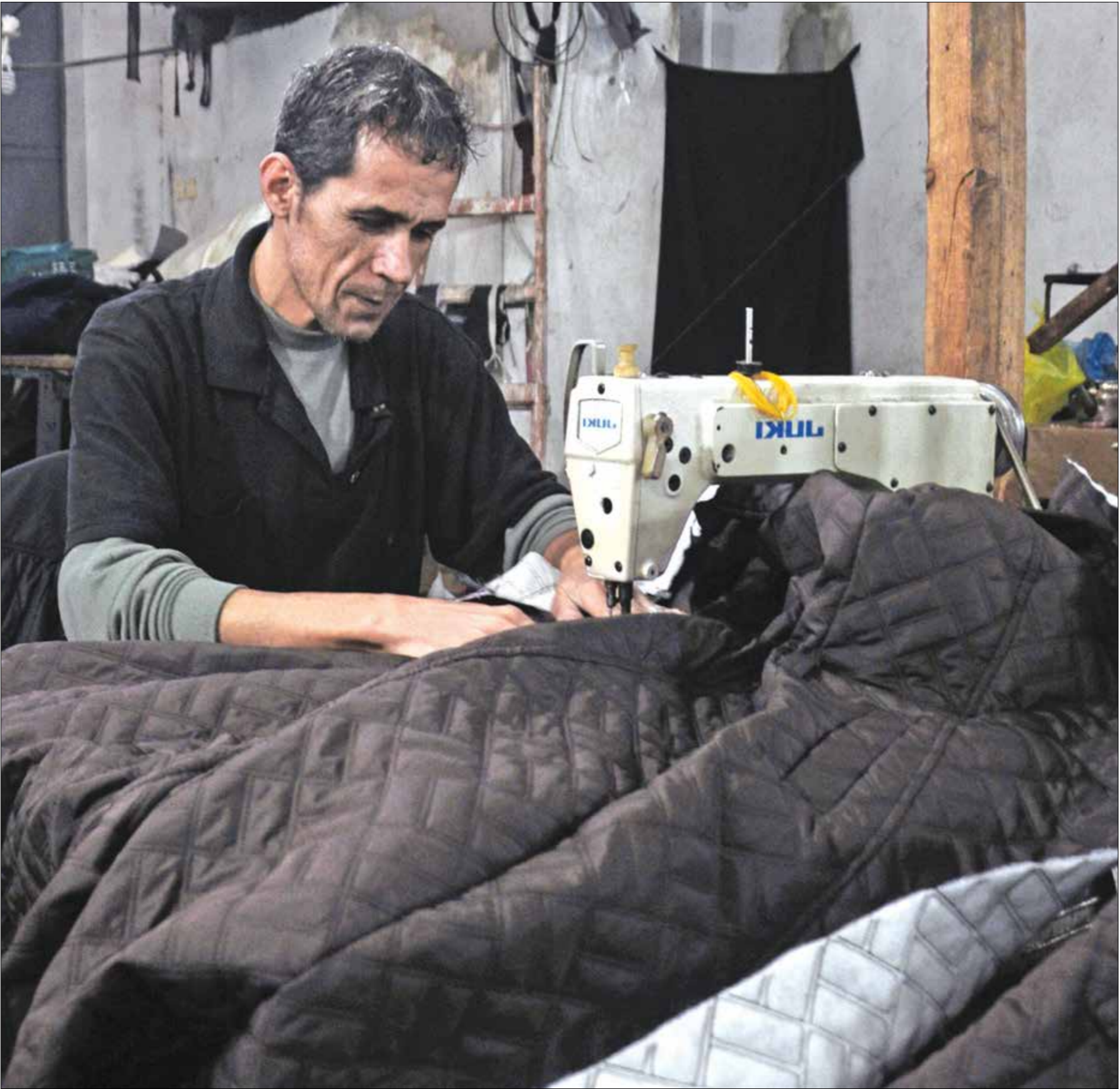
8 ملايين دولار خسرها مصانع الملابس في غزة

وأظهر التقرير السنوي السادس للمؤسسة، أن الأموال غير الشرعية التي نزحت من الدول النامية بين 2003 و2012 بلغت نحو 6,6 تريليونات دولار، وارتفعت 94% سنويا، مع أخذ التضخم في الحسبان، وهو ما يعادل نحو مئتي معدل نمو الناتج المحلي الإجمالي، وأكثر من عشرة أضعاف حجم العمولة الأجنبية التي لتفتقا تلك الدول. وأضاف أن