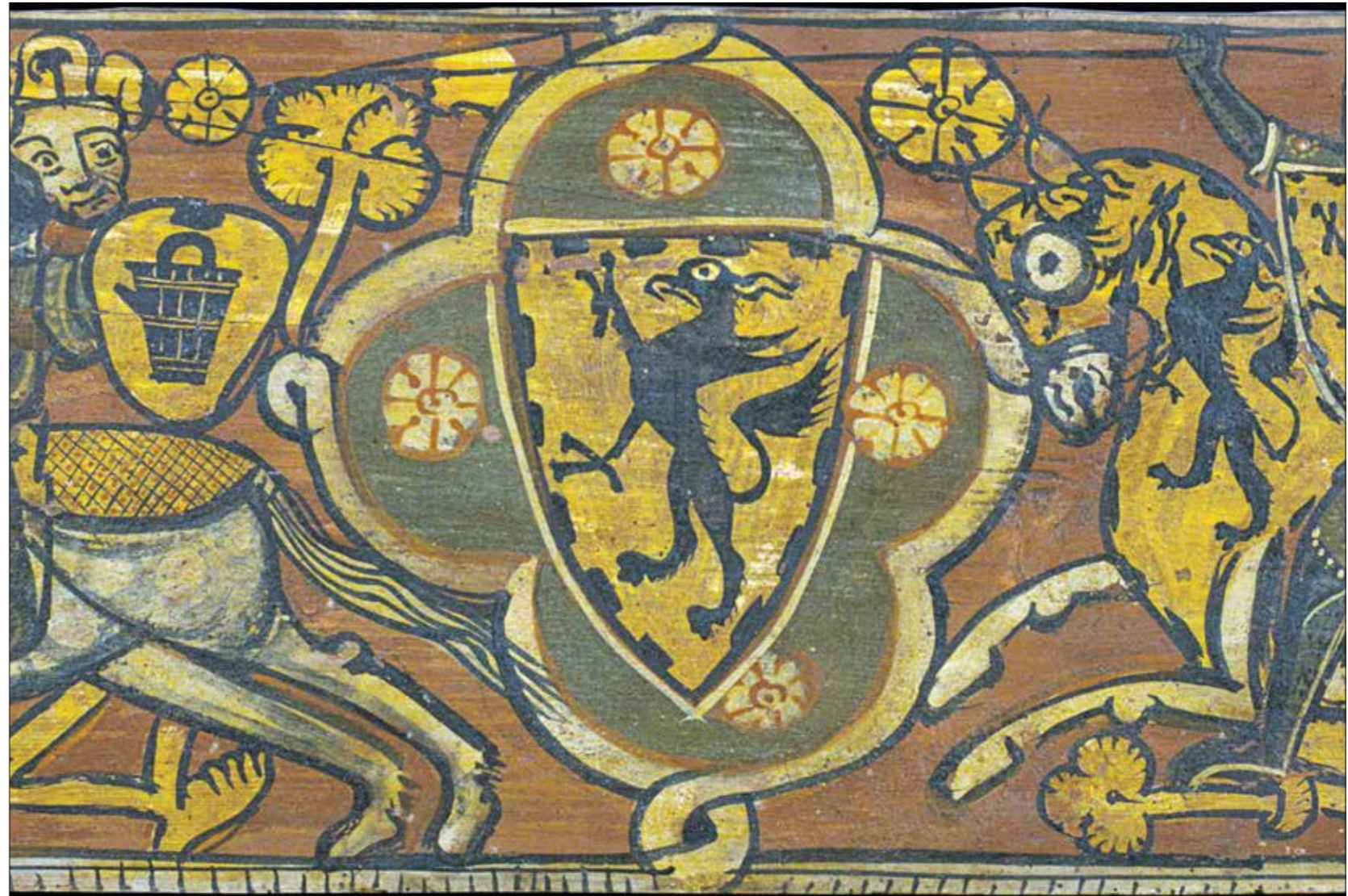
جزء من لوحة إسبالية تصوّر عراكاً بين فارس مسلم وآخر مسيحي

يخفي أن تطالع أخبار خلفاء المسلمين وحكامهم لنتبين بعض المواقف المرنة التي احتكموا إليها، إبان توضع امبراطوريتهم، فحة طرائق ونوادير ترويبها أذهت الكتب