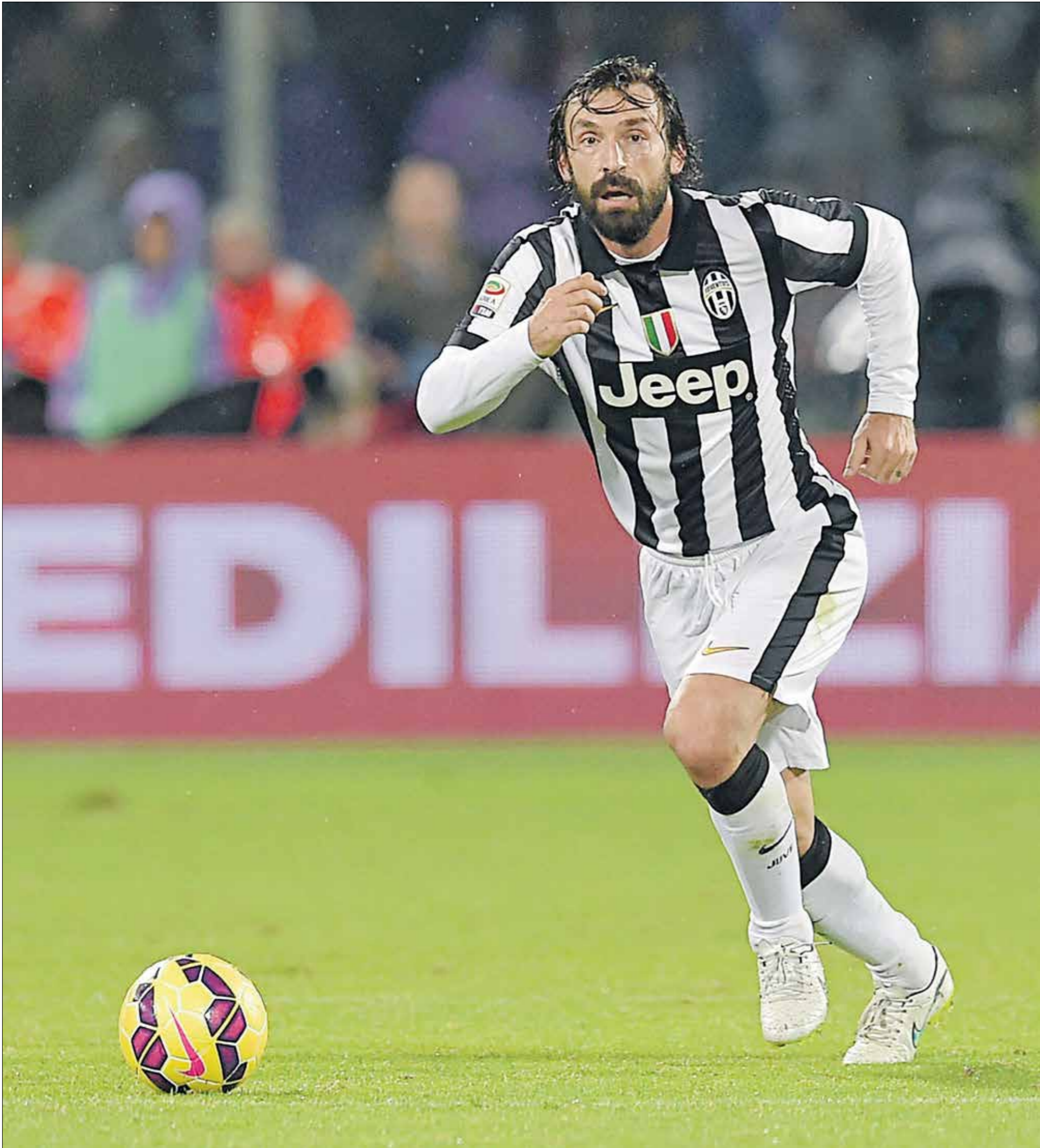
اندريا بيرلو يواصل إحداه في إيطاليا ويحطف لها اسلحة بجدارة

اخير نجم يوفنتوس والمنتخب الإيطالي المخضرم اندريا بيرلو افضل لاعب في الدوري الإيطالي لموسم 2013-2014، وذلك خلال حفل اقامته رابطة اللاعبين، وهي المرة الثالثة على التوالي التي ينال فيها بيرلو جائزة افضل لاعب وفي موسمه الثالث مع اليوفي الذي توج معه بلقب الدوري خلال هذه المواسم.