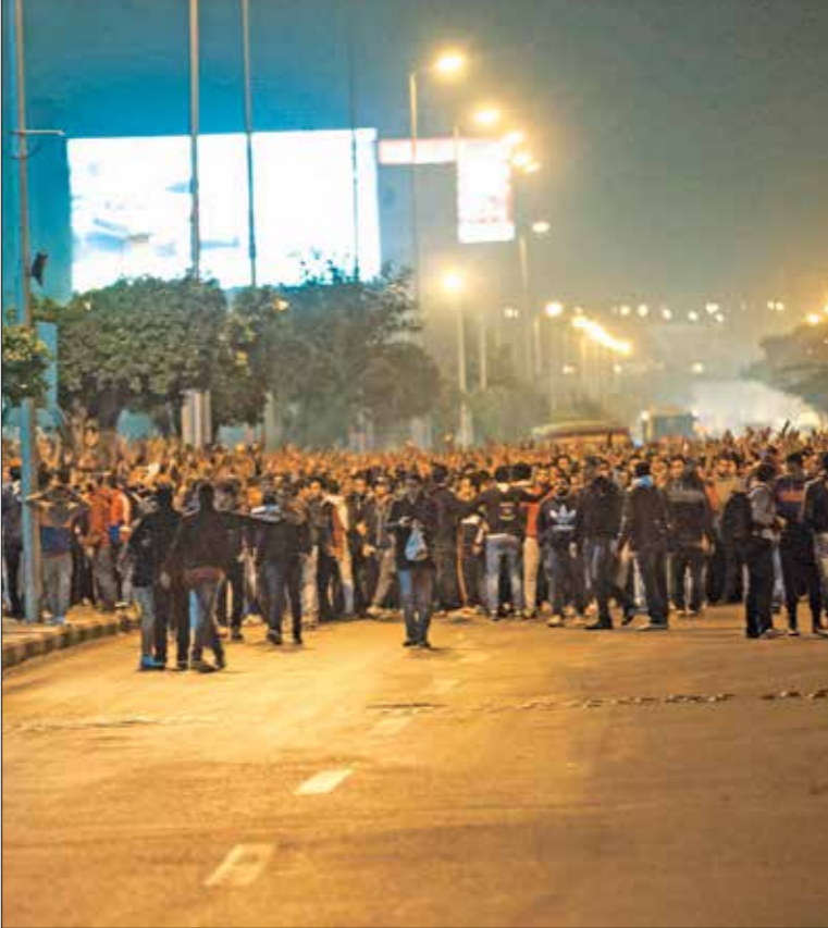
جماهير أولتراس خارج الملعب العربي الجديد