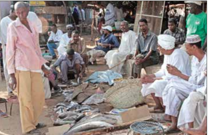
ياتمو اساءك يروضون متبلاتهم بأحد أسواق الخرطوم

41,8% في نهاية العام الماضي، يتسم بالواقعية.