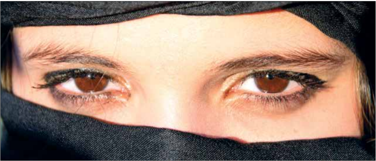
قارئات الحظ يصلحن على سالك حنلة لمرأة الطالع (حديثه الطب)