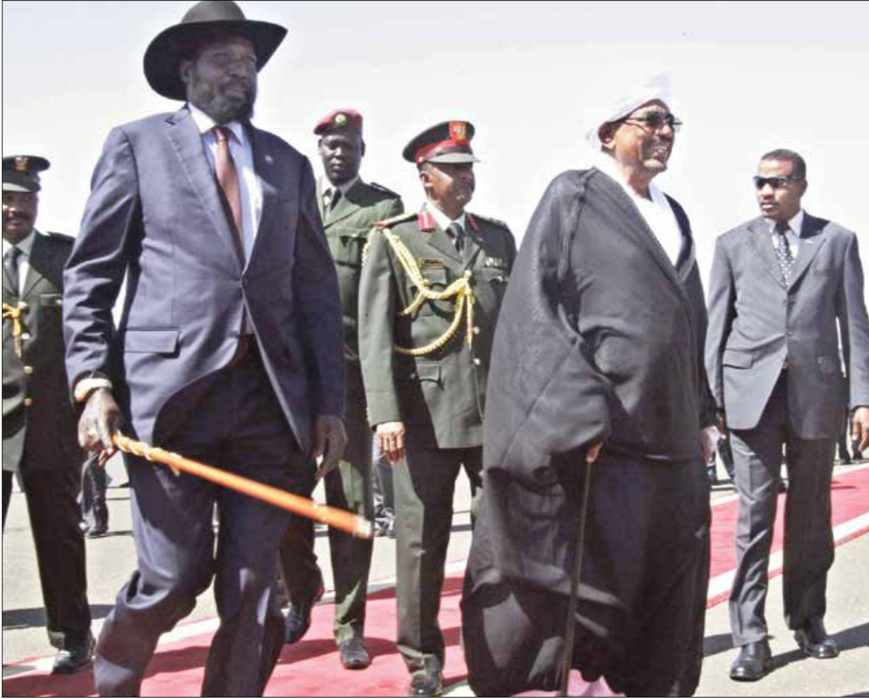
يحيى البشر استخدام الجنوب ورقة الحركات المسلحة ضدّه (الناظر)

صعد المسؤولون في السودان، في الأيام القليلة الماضية، من لهجتهم تجاه جارتهم جنوب السودان، مهذّبين بالقتحام أراضيها لملاحقة الحركات المسلحة التي تقائلته في إقليم دارفور، والتيل الأزرق وجنوب كرهفان، انطلاقاً من الأراضي الجنوبية. وتبعّد هذا التهديد، الأول من نوعه، منذ اندلاع الحرب الأهلية في الدولة القذفية، منتصف شهر ديسمبر/كانون الأول الماضي، أي قبل عام كامل، إذ ظلت الخرطوم، طيلة تلك الفترة، تتجنّب إلى المهادنة، حتّى إنّها لم تتخذ مواقف مستهدّدة حيال اتهامات جوبا المتكررة لها، بدعم مجموعة ريك مشار، التي تقود عمليات عسكرية ضدّ النظام في جوبا. ولمرّة الأولى، تطالب وزارة الخارجية السودانية، الحكومة في جوبا باتخاذ خطوات عملية وفورية لوقف دعم وإيواء الحركات المنهزمة على الحكومة في الخرطوم، قاطعة باهمة أن تستند مصلحة البلدين على أسس واضحة ومصيحة لحماية الاستقرار فيهما، وتتهم الخرطوم جوبا، منذ انفصال الأخيرة وتكوين دولتها المستقلة قبل ثلاثة أعوام، بدعم وإيواء الحركات المسلحة المغلّقة في الحركات الشعبية، قطاع الشمال، والتي كانت في الأصل جزءاً من الحزب الحاكم في الجنوب قبل الانفصال، فضلاً عن حركة «العدل والساواة»، بزعامة جبريل إبراهيم، والتي كانت تقاقل الحكومة في إقليم دارفور، وكانت كلٌ من نشاد وليبيا خليفتيْن استراتيجيَّتيْن للحركة وبقطة انطلاقها، لكنّ التقارب والمصالحة بين اجتماعيا والخرطوم، وسقوط نظام معمر القذافي أفقدها الحليّتين معاً، وتمتلك حكومة الخرطوم، وفق وزارة الخارجية السودانية، معلومات موثّقة تؤدّد استمرار جوبا، في تقديم الدعم اللوجستيّ والمادي للحركات المسلحة السودانية