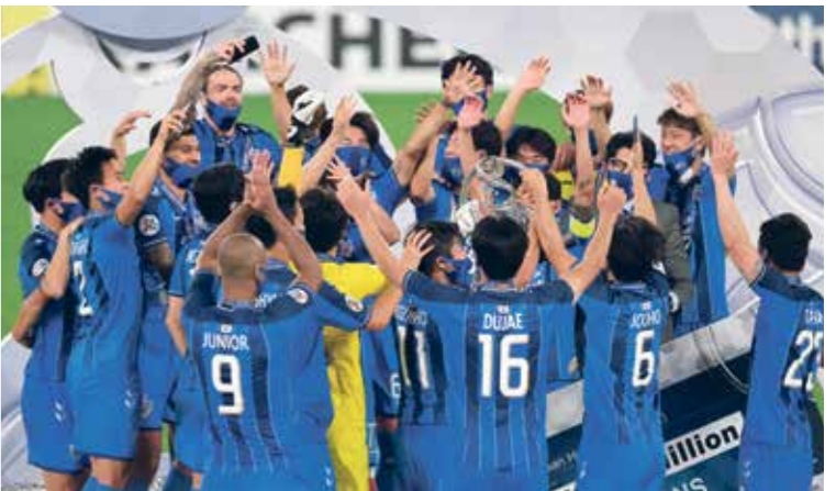
أبطال آسيا جرت في الدوحة بنجاح لافت

ولا يخفى على المتابع للمشهد الرياضي اصداء النجاح الذي حققته الدولة العربية ودورها المحوري في استضافة سلسلة من الاستحقاقات المحلية والإقليمية والدولية خلال عام 2020، لتتصدر بذلك موقع الريادة