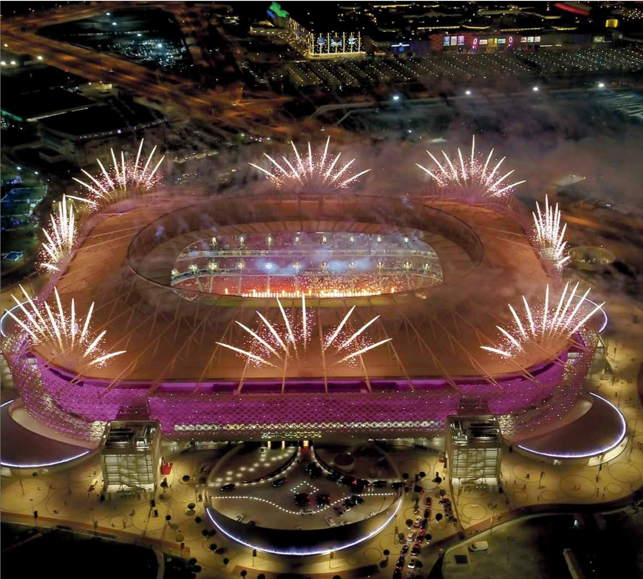
استاد أحمد بن علي الجديد يستعد لاستضافة مونديال 2022

القدم والسلطات والهيئات القطرية وكافة الاتحادات الأعضاء والفرق المشاركة على نجاح استضافة دوري أبطال آسيا». وأكد رئيس الاتحاد الآسيوي أن هذه البطولة ما كانت لترى النور لولا تكاتف جهود كافة الأطراف المعنية، وقال «لقد جسدت هذه البطولة بما لا يدع مجالاً للشك وحدة وتماسك وصمود الكرة الآسيوية واستعدادها للوقوف في وجه التحديات». كما حضر نهائي أغلى الكؤوس الكسندر تشيفيرين، رئيس الإتحاد الأوروبي، والذي تحدث عن أهمية ما بذلته قطر من جهود لتقديم نموذج يحتذى به في عودة كرة