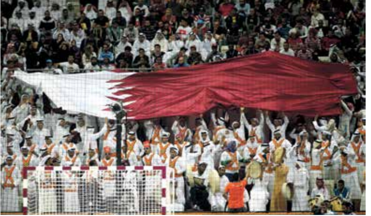
الجماهير عادت للمدرجات في المناسبات التي استضافها قطر

حيث تستهدف اختبار جاهزية مختلف استادات البطولة ومراقفها، عبر استضافة عدد من الأحداث الرياضية الكبرى، وتعزيز تقديم تجربة مميزة للمشجعين وزوار قطر خلال المونديال الأول من نوعه في منطقة الشرق الأوسط والعالم العربي. ودوري النجاح في استضافة منأاسات بطولة دوري أبطال آسيا لمنطقتي شرق الفارة وغربها، وتحديداً نهائي البطولة الذي شهد حضور 10 آلاف مشجع، والتنظيم المتميز لكاس الأمير بحضور 12 ألف مشجع، نتحدث هنا لغة الأرقام عن إنجاز مبهر؛ فقد شارك في منافسات دوري أبطال آسيا وحدها ما يقرب من 900 فرد من اللاعبين والطواقم الفنية من 30 فريقاً خاضت 76 مباراة على عدد من استادات مونديال قطر 2022، شكلت خلالها أكبر حيز آمن من نوعه منذ ظهور الوباء، فيما يعرف باسم «الفقاعة العلية».