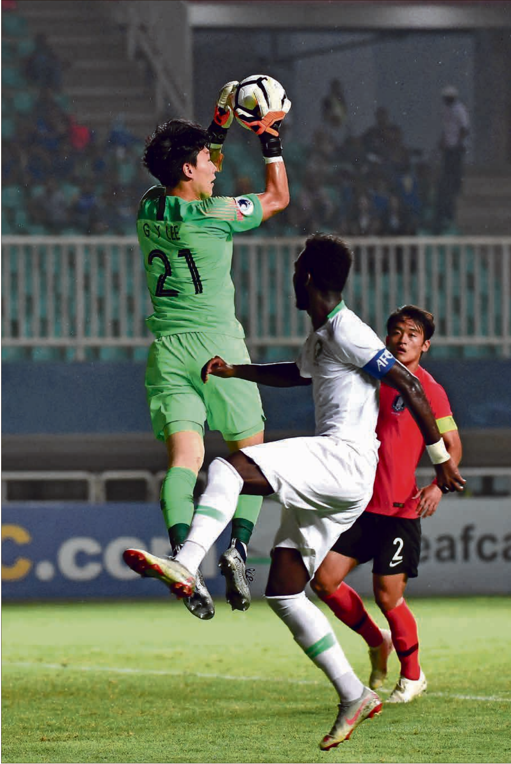
توجت السعودية باللقب في آخر نهائيات عام 2018

أكد نائب رئيس الاتحاد الآسيوي لكرة القدم، القطري سعود المهندي، إلغاء مسابقتي كأس آسيا للشباب والناشئين 2020 المقررة إقامتهما في أوزبكستان والبحرين توالياً، وذلك بسبب تداعيات انتشار فيروس كورونا. وأشار المهندي في تصريح لوكالة «فرانس برس»: «قرار إلغاء بطولتي آسيا تحت 16 عاماً وتحت 19 عاماً جاء بناء على توصية من لجنة المسابقات».