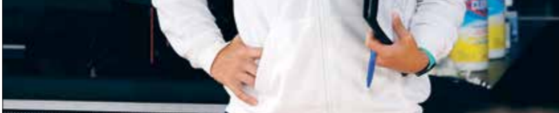
بيكي هامون اول سيدة تقود فريق سلة أمريكية

وأصبحت هامون مساعدة للمدرب في سبيرز منذ شهر آب/سبتمبر عام 2014 وخاضت مسيرة في اللعب لمدة 16 سنة ومنتلت فريقتي نيويورك ليبرتي و سان أنطونيو ستارز. وبهذا الإنجاز، فتحت هامون الباب أمام دخول المرأة بقوة إلى عالم التدريب في كرة السلة الأميركية. وواصلت هامون في حديثها «التأكيد هذه خطوة كبيرة ولحظة محورية، وأنا جزء من هذه المنظمة منذ عام 2007 وقضت 13 سنة في مؤسسة سبيرز، وهذا وقت طويل، كما استمتع الفريق وقتنا طويلاً في تأسيسي وتطورتي».