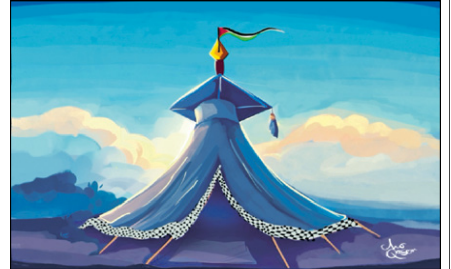
خيام الاعتصام في الجامعات رمز الحرية (مو قاسم، كار تون موفمنت)

عمت حركة الاحتجاجات الطلابية في عديد من الجامعات الأميركية، وطاول حريق الحرب في غزة ثوب العم سام. وبالرغم من القمع البوليسي والتجيش والشيطنة من قبل وسائل الإعلام الأميركية لتلك الاحتجاجات، إلا أن صوت الطلاب كان قوياً ومسموعاً في كل أرجاء الأرض منحازاً لأصحاب الأرض في فلسطين وصادحاً بأصواتهم وحقهم. إليكم باقة من الكاريكاتير العالمي حول هذا الحدث المهم.