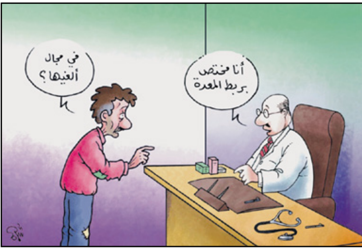
الجوع في سورية