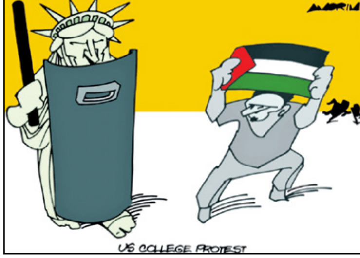
بلد الحرية يجمع حرية الفلسطينيين في التعبير (أموريم، كار تون موفمنت)

والحال أن حسده كان صادقاً، فالبلد الذي هاجر إليه معروف بأن أهله جميعاً أثرياء، ولا يسمعون عن الفقر إلا في حكايات «ألف ليلة وليلة»، ولذا حالما رأوه بهيئته تلك بينهم، رقصوا فرحاً وهم يهزجون: «واوو.. فقير.. فقير»، وراحوا يتحلقون حوله بدهشة لم يعرفوها من قبل، وهم يصفقون لهذه «التفاحة» التي سقطت على بلدهم بغتة، فاکتشفوا جاذبية الفقر الغريبة عليهم. ثم جاء القرار صادقاً لصاحبنا، عندما فوجئ بمن يشد وثاقه على الرصيف الواقف عليه تماماً، ويمن بحبسه في بيت زجاجي من دون أي تغيير على هيئته وأسماله البالية؛ لأنهم أرادوا المشهد كاملاً غير منقوص، وبلا أي تبديل عليه، فقد كانوا يخشون انقراض «آخر الفقراء».