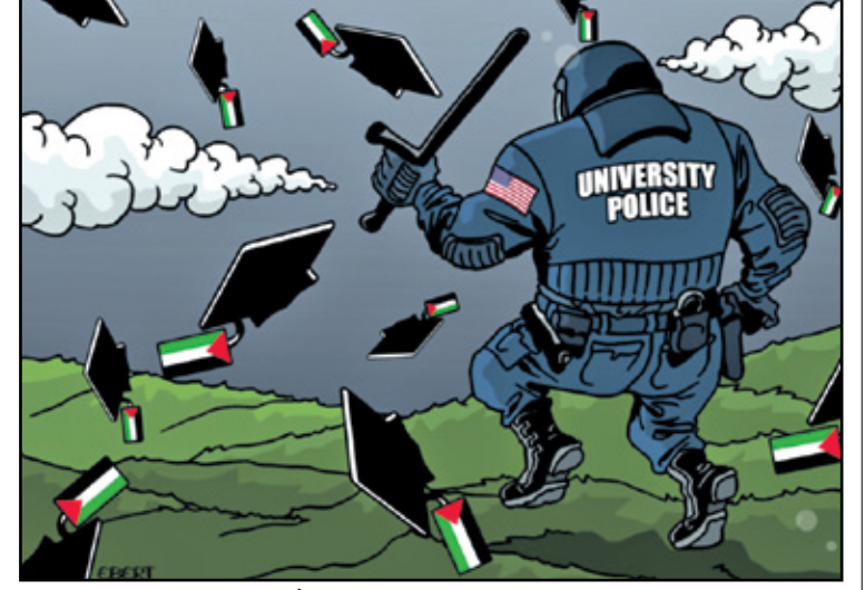
بوليس الجامعة يصطاد الفلسطينيين (الريكو بر تشيولي، كار تون موفمنت)