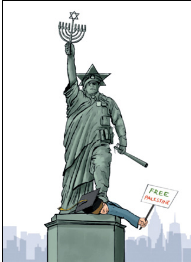
قمع الفلسطينيين باسم حماية اليهود في اميركا (ميكايل شفقجي، كار تون موفمنت)