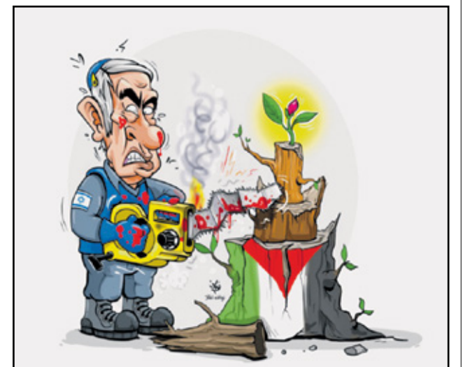
نتنياهو سيفشل في حربه (تواف الملا، البلاد البحرينية)