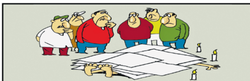
شريط (جيه بوسكو، كار تون موفمنت)