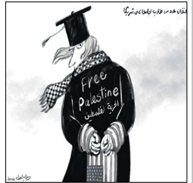
اعتقال الطلبة في اميركا