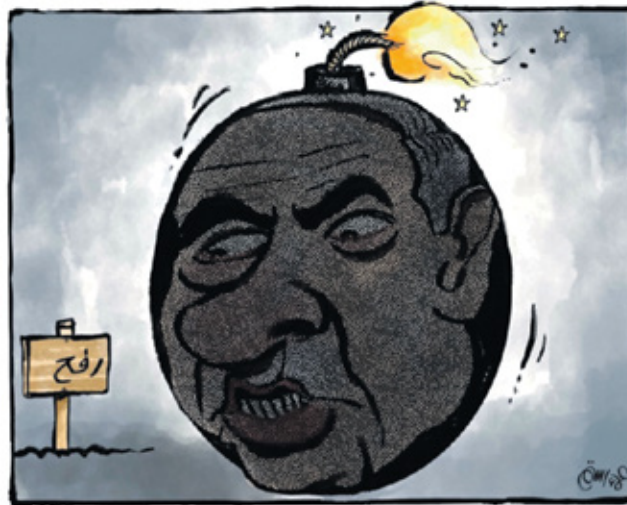
نتنياهو المتدحرج إلى رفح