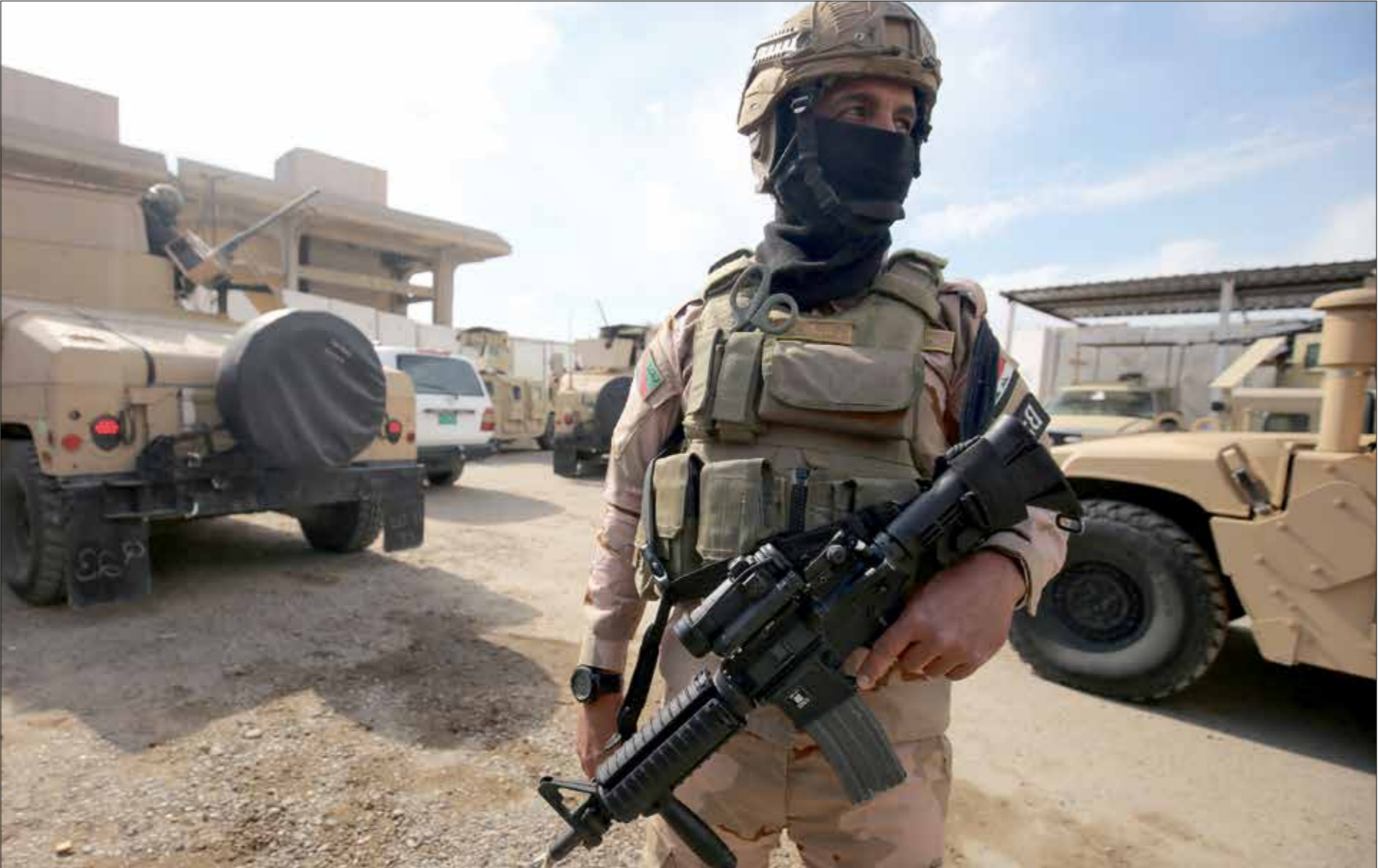
تقف القوات العراقية عاجزة إلى الآن عن حماية الارتال (أحد الرتلين)

هذه الخطة تأميت الارتاك ومساراتها عبر الجيش والشرطة، واتخاذ إجراءات عقابية ضد أي مسؤول تشهد منطقتها خرقاً امنيا. وبينما تقف القوات الامنية إلى الآن عاجزة عن التصدي لهذه الهجمات، يامل مراقبون بان تسلك الخطة الجديدة طريقها نحو التنفيذ