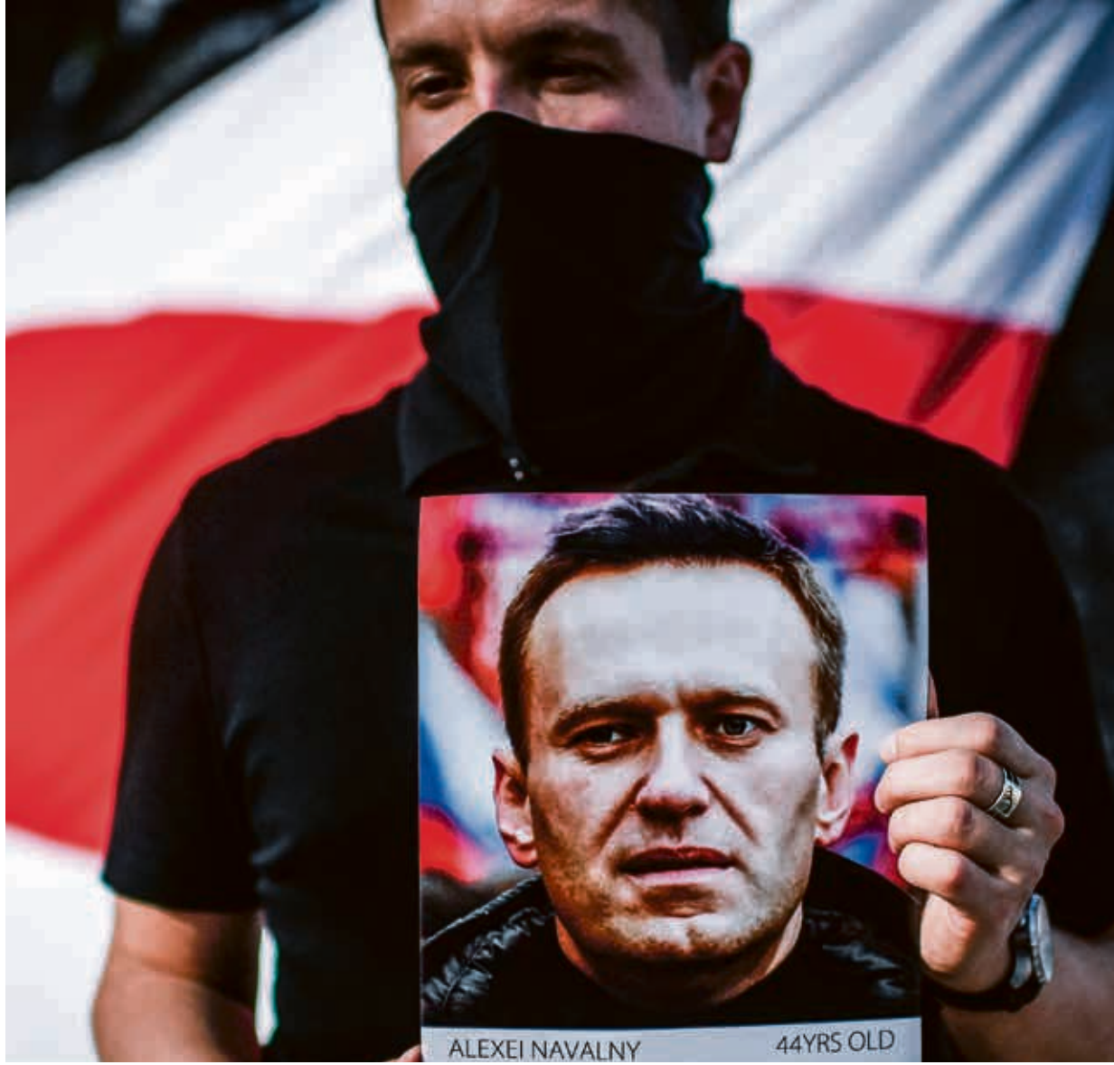
هناك خشية من تدهور وضع نافالني الصحى