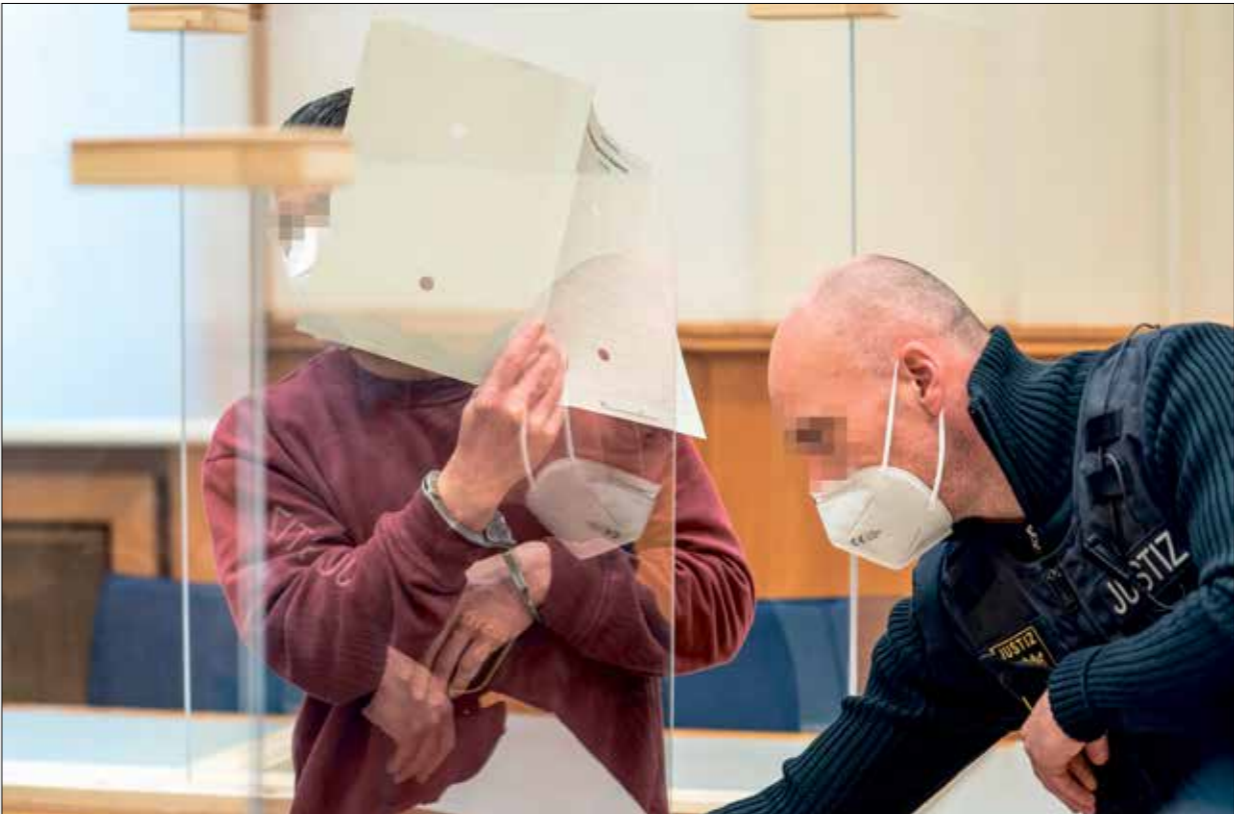
استضافات حول قدرة المحاكم الوربية على تحفيظ العدالة اللسويت

تصاعدت الضغوط الدولية على السياسيين اللبنانيين من أجل تشكيل حكومة «ذات مصداقية»، مع ربط برلين إعادة بناء مرفا بيروت بها