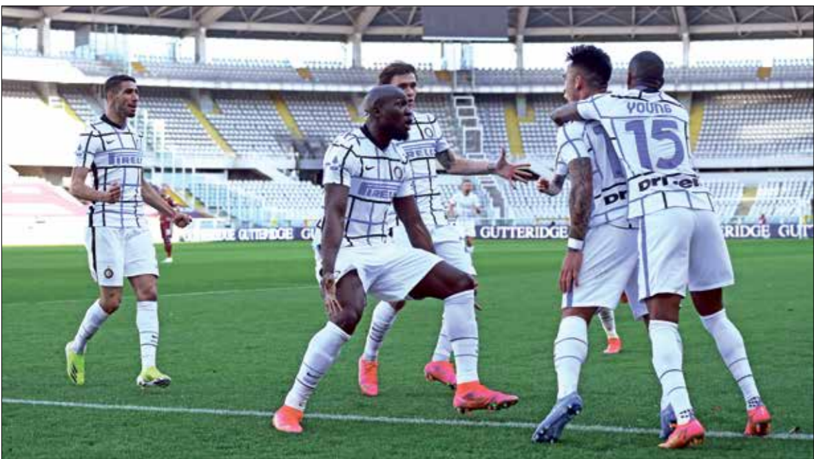
يسعى إنتر ميلان لاستعادة لقب الثالث منذ عام 2010

الكبير له في «الليغا» واحتلاله المركز الخامس بالجول خلف الرباعي أنتنكسو مدريد وبرشلونة وريال مدريد وإشبيلية، بينما خاض منتخب «أسود الباسك»، صاحب الـ23 لقباً للكأس، مشواًراً أصعب صاحب الـ23 لقباً للكأس، مشواًراً أصعب صاحب الـ23 لقباً للكأس، مشواًراً أصعب صاحب الـ23 لقباً للكأس، مشواًراً أصعب