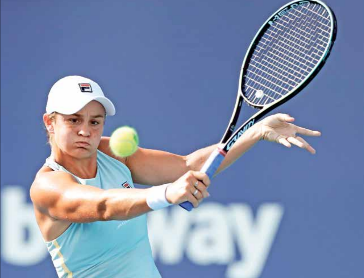
اشلي بارتي تستمتع بحفوية لقب جديد في عالم التنس

وعدت الهمزة المؤلمة لنادي ليفربول الإنجليزي في ملعب «أنفيلد»