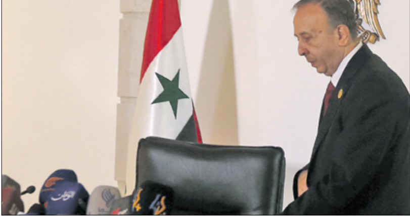
علي محام رفض الطابا بحد استيفائها الشروط الدستورية