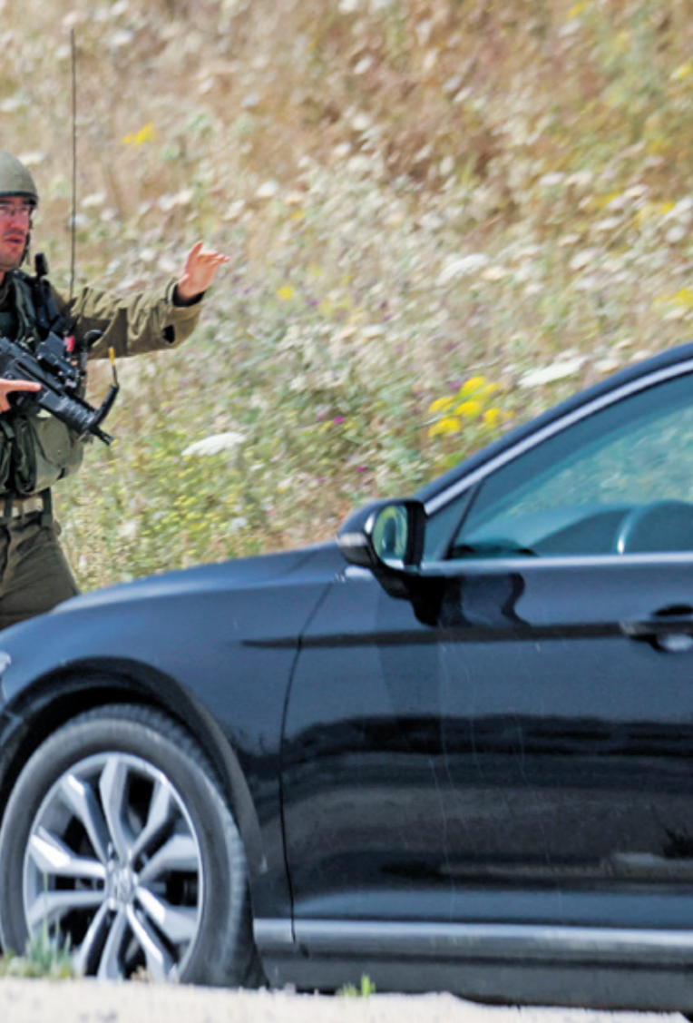
نصبت قوات الاحتلال حواجز عسكرية على كافة مداخل نابلس

ادت عملية إطلاق النار على حاجز زعترة جنوب نابلس، والتي اصيب فيها 3 إسرائيليين، إلى حالة استفار في صفوف جيش الاحتلال الذي عزز وجوده في الضفة الغربية، بينما كان المستوطنون نفذون اعتداءات بالجملة على قرى نابلس وبلداتها