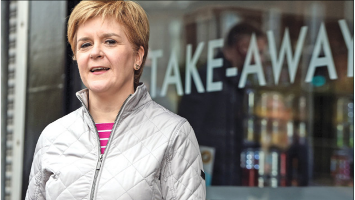
لجاون ستورجيت الاستفادة من شعبيتها في محاربة ياء كورونا لطرش استفتاء اسكتلندا