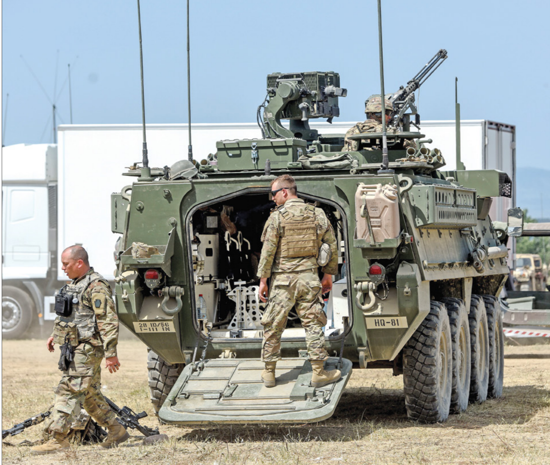
يشارك في المناورات 3 آلاف جندي اميركي

اميركا والناتو ليسا فقط مستعدين لمواجهة اميركا روسي، بل لإظهار استعداد لعمل عسكري مبادر لمواجهة روسيا». ويحسب الأوروبيون حساسا جدا لتدخلات روسيا في الدول الحاذية للقارة الحجون، حيث لا يرغب عن حديثهم وتحليلهم أن يشار إلى أنه حتى الربع الأول من 2021، كلف بوتين تدخل إثر ثورة شعبية في كييف ضد الرئيس الأوكراني الأوكراني فيكتور يانوكوفيتش، المدعوم من الكرملين، والمهم في وقتها، الذي بدأ زعيمها الجديد، وراي ترينين، في تحليل نفس على موقع مركز «كارنيغي» في 14 إبريل/نيسان الماضي، أن زيلينسكي ربما حاول استفزاز بوتين عسكريا «من أجل حصد تعاطف شعبي واستدعاء لولائف غربية أكثر قوة». واعتبر أنه من المهم السياسيين في كييف «إظهار أنفسهم في السياسة الخارجية ضحايا لعدوان روسي، وتقديم أوكرانيا على أنها