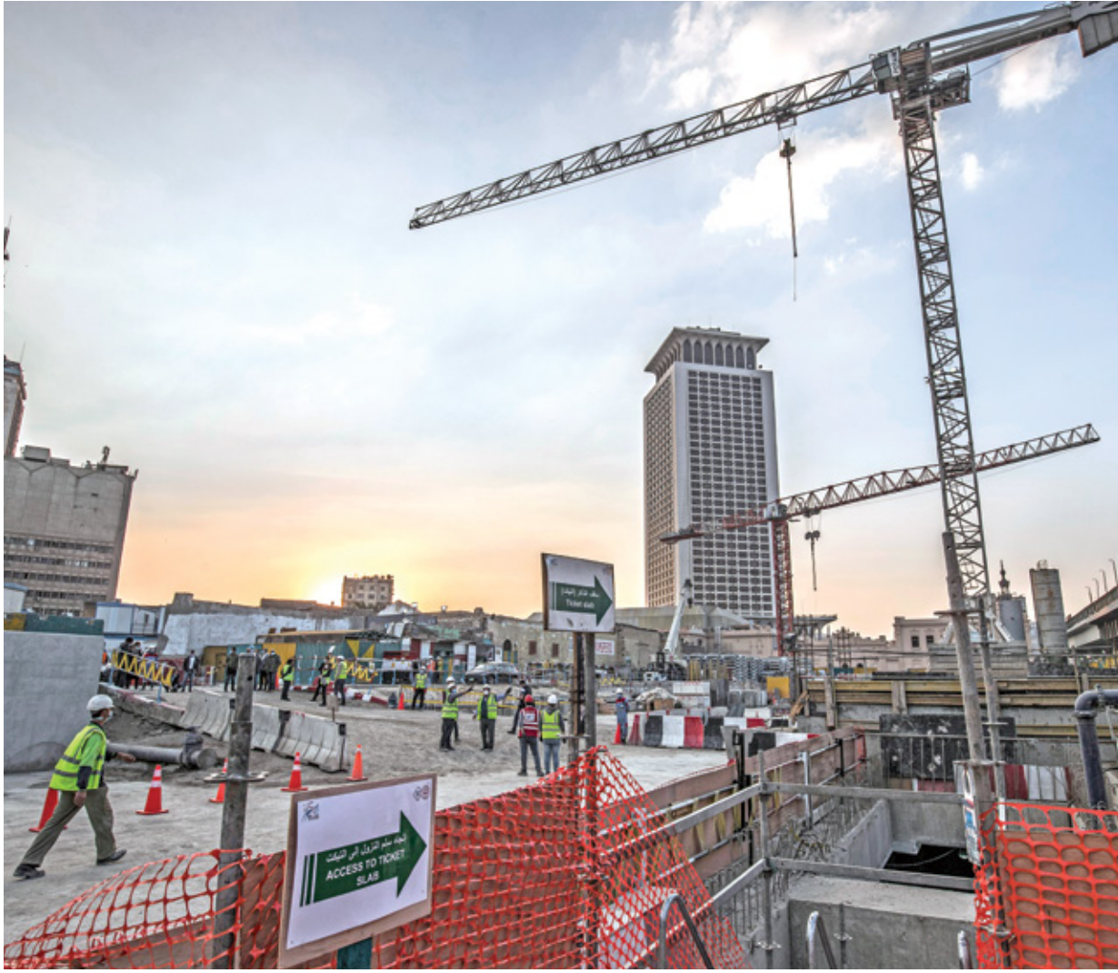
ينوي النظام ان تشمل زيارة الوفد الامريكى المنشآت الجديدة

واشنطن. ومن المقرر أن يلي ذلك تنظيم زيارة مماثلة وموسعة لوفد أميركي، يضم قيادات ونوابا بالحزب الديمقراطي والجمهوري وعددا من الإعلاميين لمصر، بما في ذلك نواب سبق أن هاجموا السياسات المصرية والعلاقة بين الرئيس عبد الفتاح السيسي والرئيس الأميركي السابق دونالد ترامب. وسيلتقي الوفد الأميركي في مصر السيسي وعددا من المسؤولين التنفيذيين والبرلمانيين. وستضمن برنامج الزيارة فعاليات عدة، مثل زيارة قناة السويس وبعض المواقع الإنشائية والسكنية الجديدة كالعاصمة الإدارية والعلمين الجديدة والأسمرات، عكس ما حدث مع الوفود السابقة التي زارت مصر للقاء السيسي فقط بين عامي 2015 و2018. وينوي النظام خلال الزيارة المصرية تقديم صورة كاملة عما يرغب في إيصاله من رسائل، تركز في الأساس على «تحقيقه تقدما كبيرا على صعيد التنمية والحالة الاقتصادية للمصريين»، وأن «المشاكل الخاصة بالأوضاع الحقوقية والحريات السياسية لا تمثل الأولوية للغالبية العظمى من جموع المصريين». وذكرت المصادر أنه بمناسبة التنسيق المستمر بين النظام وشركة العلاقات العامة في واشنطن حول التحركات في ملف سد النهضة، تلقى النظام نصائح جديدة من بعض النواب والسياسيين من جماعات الضغط التي تكثف مصر التعاون معها، وكذلك من المتعاملين مع الشركة، بضرورة اتخاذ إجراءات تعكس رغبة النظام في تحسين أوضاع حقوق الإنسان خلال الفترة المقبلة. وتركزت النصائح على مستويين؛ أولهما بحث إمكانية الإفراج عن معتقلين ومحكومين من حاملي الجنسية الأميركية، وثانيهما الانفتاح على التواصل والإلحاح عليه، في ظل حالة البرود والتجاهل التي تسيطر على العلاقة بين واشنطن والقاهرة منذ تولي جو بايدن الرئاسة.