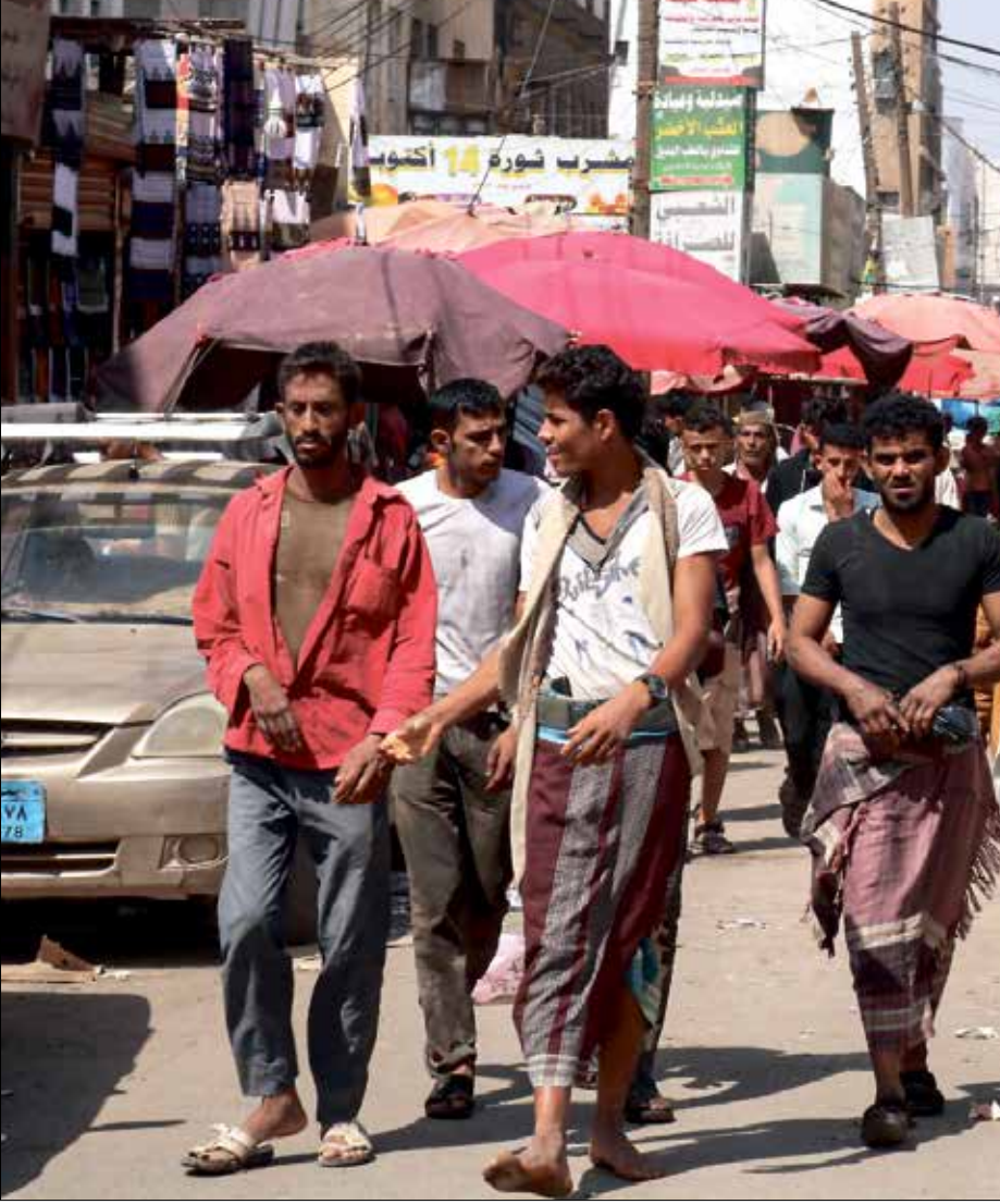
سوق الشيخ عثمان في عدن

وحذر البنك، في بيان، من شركات ومنشآت الصرافة المرخصة من التعامل مع أية محلات صرافة غير مرخصة، أو تسهيل عملهم في تزويدهم ب ابية خدمات أو أنظمة تمكنهم من العمل في سوق الصرافة، كما شدّد على