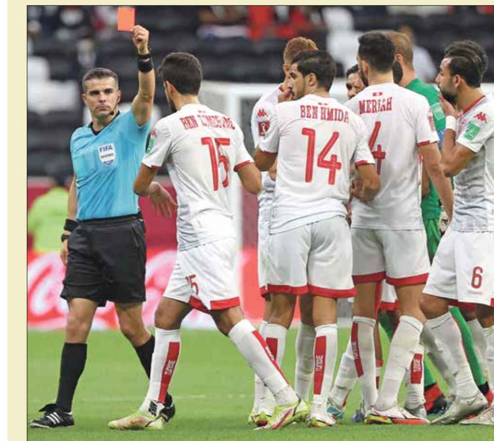
ظرد الر على تونس كثيرا في المباراة