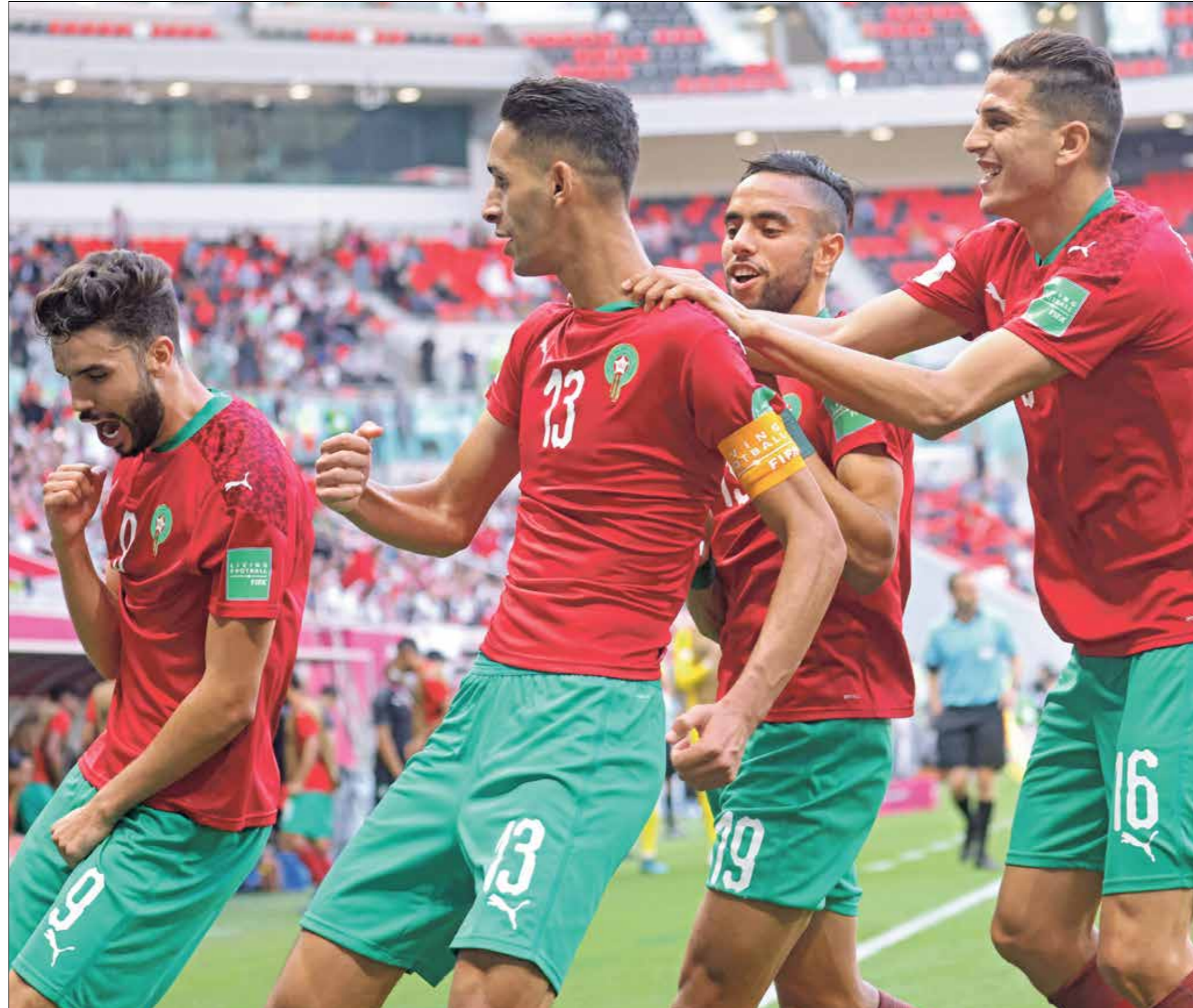
المغرب اقترب من التأهل إلى الدور ربع النهائي

خسارة تونس امام سورية تصعد مهمة التأهل من الدور الاول