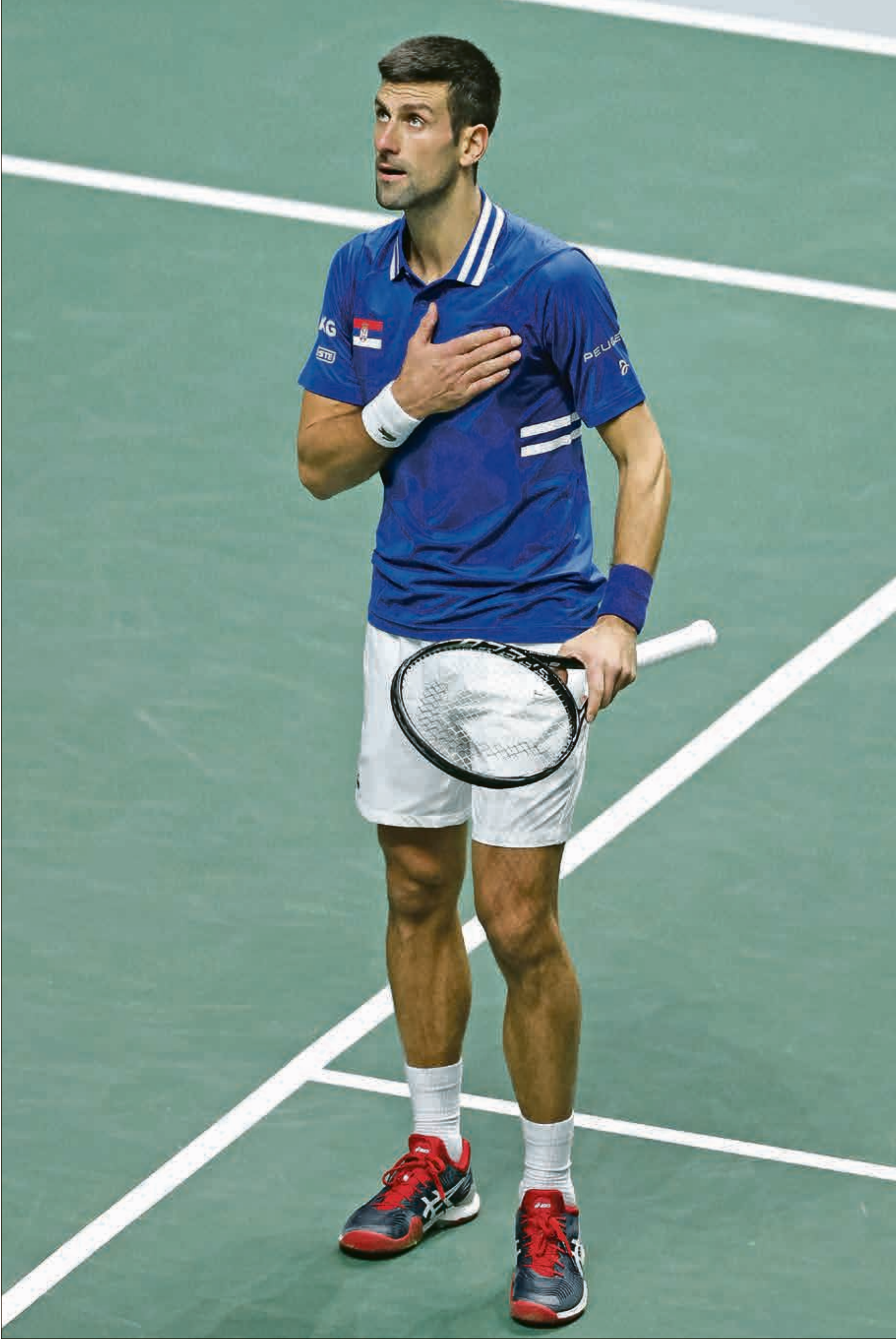
مشاركة ديوكوفيتش في بطولة استراليا المفتوحة محل شك

وعد الصربي، نوفاك ديوكوفيتش، المصنف أول عالمياً، بعد خروج بلاده من نصف نهائي بطولة كأس ديفيز للتنس، باتخاذ قرار بشأن مشاركته في بطولة استراليا المفتوحة. وقال ديوكوفيتش أمام الصحافيين: «أفهم أنكم تريدون إجابات حول اين وكيف سأبدأ الموسم الجديد، لكن سنرى ما يخفيه المستقبل. لا يمكنني تحديد موعد لكم، لكن من الواضح أن بطولة استراليا المفتوحة باتت قريبة، وعليه ستعرفون قراري قريباً».