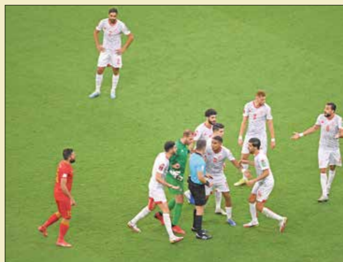
عالم المنتخب التونسي من ضغط كبير في المواجهة