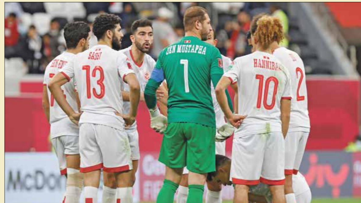
حسرة كبيرة للمنتخب التونسي بعد السقوط