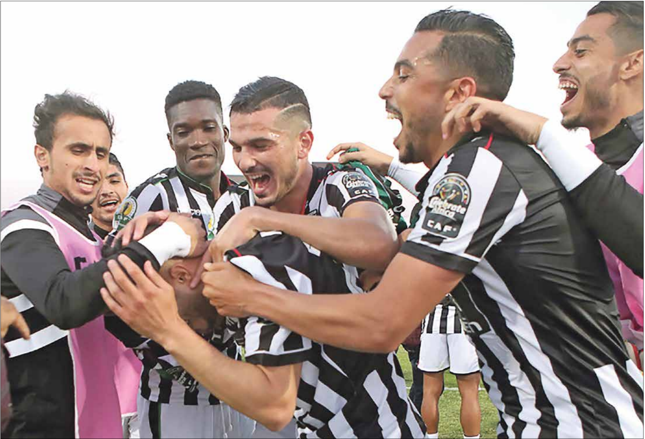
بواجه صوابين لوسين نظيره لوسين الكيني

المدرجات، وفقاً للإجراءات الاحترازية المفروضة حالياً لمواجهة تفشي فيروس كورونا، وهو الأمر الذي يراهن عليه الجهاز الفني للأهلي كثيراً في تحفيز لاعبيه أمام بطل مالي، وتعويض خسارة الذهاب بهدف من دون رد.