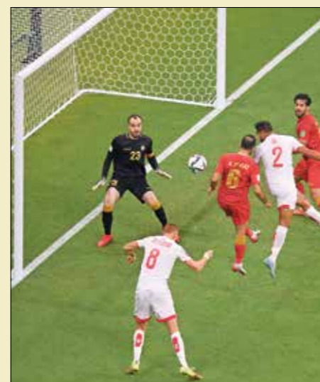
تونس قدمت أداء دفاعيا متواضعا