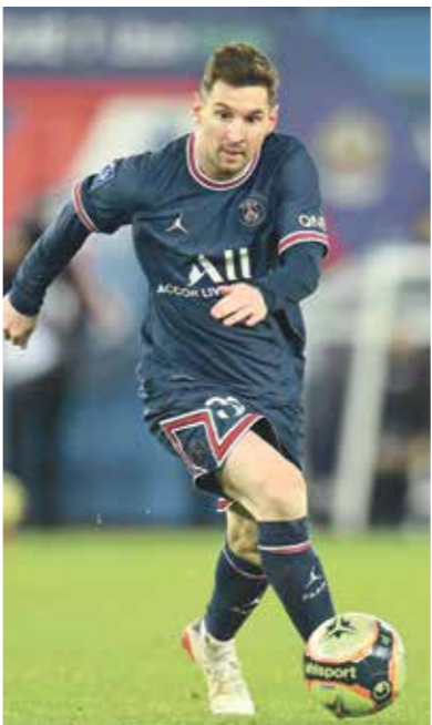
ميسي يواجه صعوبات كبيرة مع باريس سان جيرمان

لكن صديق فريق باريس سان جيرمان ماوريسيو بوكيتينو لم يبدو قلقاً حيال