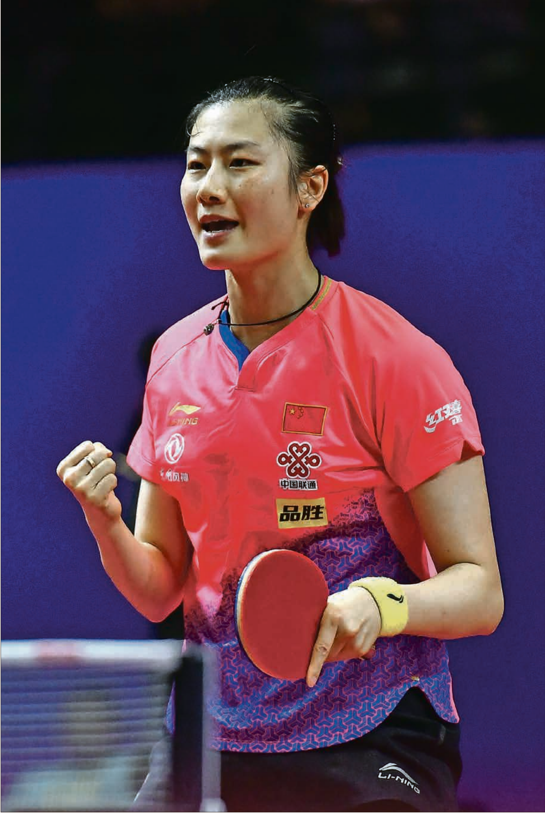
نهاية رحلة واحدة من أفضل لاعبات تنس الطاولة

أعلنت الصينية دينغ نينغ، اعتزال لعبة تنس الطاولة عن عمر 31 سنة، وذلك بعد تتويجها بطلة أولمبية في أكثر من مناسبة. وحصدت اللاعب أول ميداليتين لها في أولمبياد لندن 2012، بإحرازها فضية منافسات الفردي وذهبية الفرق. وبعدها بربع سنوات، في ريو دي جانيرو، تفوقت اللاعب الصينية على نفسها وتوجت بالذهبية في كلتا المنافستين أيضاً.