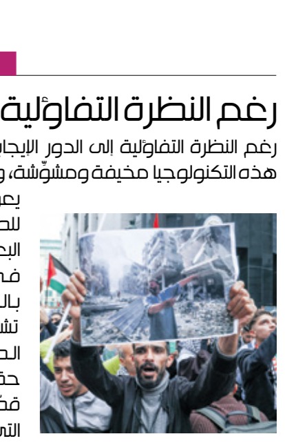
من ربح، 2 آذار/ مارس 2024

لقد لعب مصوّرون كانوا موجودين في ساحات المعارك وفي المدن والبلدات التي تعرّضت للقصف دوراً استثنائياً في صناعة الرأي العام، بحسب مناطق العدوان، وما يميّز عصرنا عن العصور السابقة هو أنّ الجميع يمكن أن يُصبحوا مصوّرين ولو لم يقصّوا