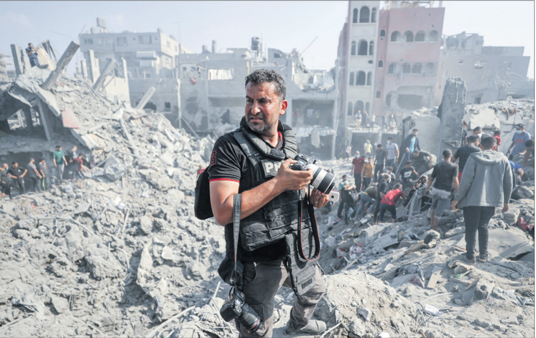
مصوّر فلسطيني يلتقط صورة للثالب المدمّرة بعد قصف إسرائيل على مخيم البرج، 2 لشربث الثاني، نوفمبر 2023