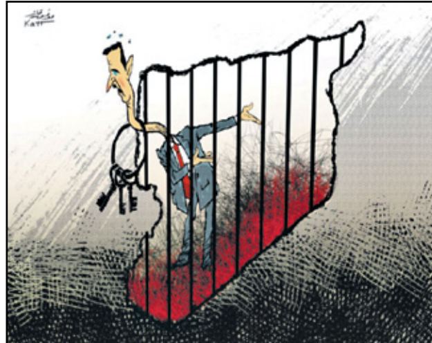
بشار الاسد في معتقل سورية