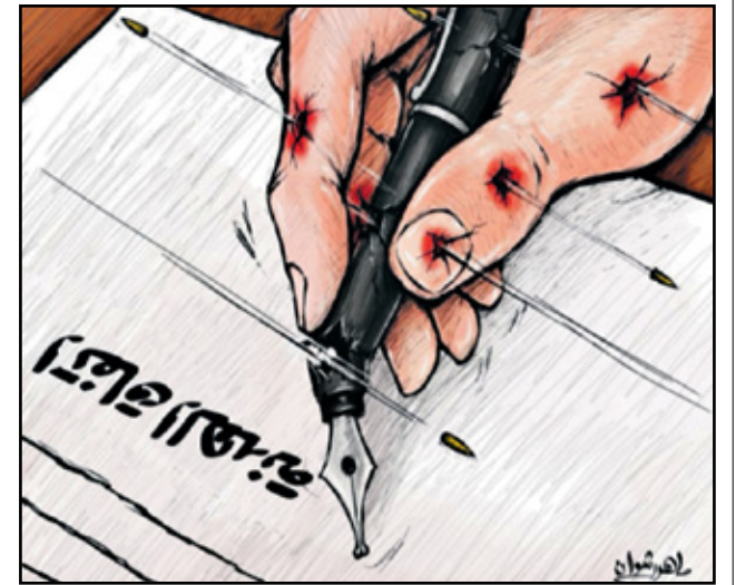
اتفاق الهدنة في مرمب النيران