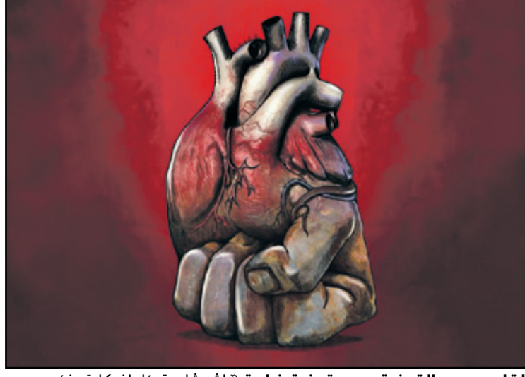
القلب بحجم القبضة وهو قبضة ضاربة (الرائل شايسته/إيران كار تون)

شعر الزعيم بعدها براحة غامرة، وراح يستأنف السحت عن «صورته» في الأخبار، فيما كان القرد النعاس على الشجرة ينظر إليه ويبتسم.