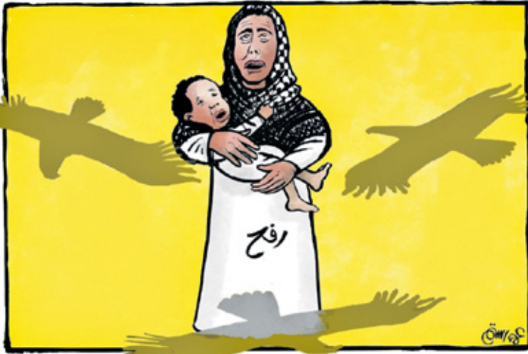
رفح تحيف بها عقبات الاحتلال