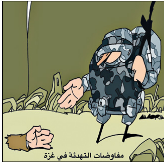
مفاوضات التهدة في غزة (اموريم/كار تون موفمنت)