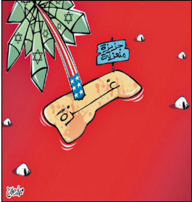
غزة جزيرة الموت المعزولة