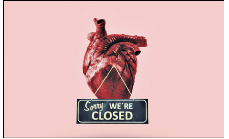
عندما يغلق القلب كمكان صغير (محمد غرين/إيران كار تون)