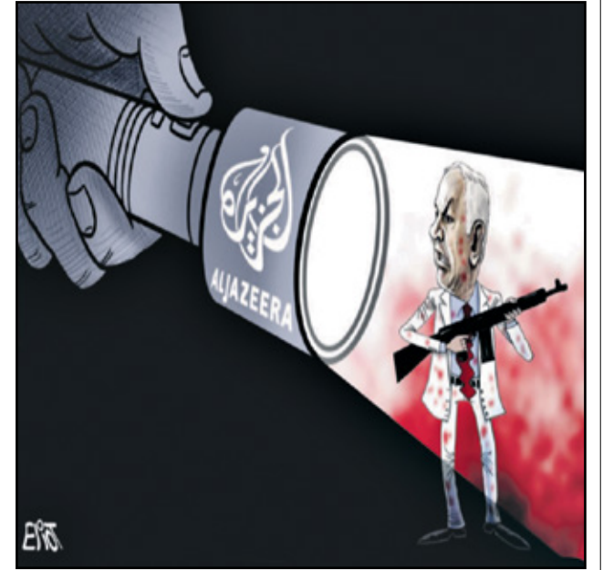
نتباهو وفتاة الجزيرة (اليوت/الوطن القطرية)