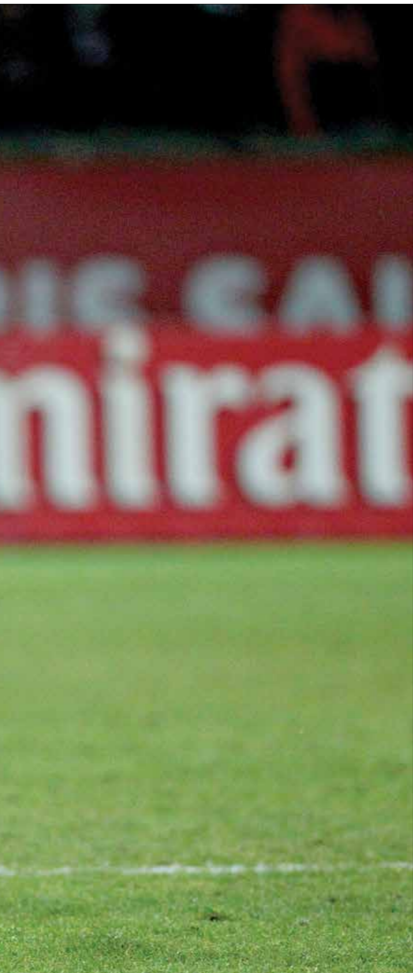
احترف التوسب لمباركي مع نادي إيتيان الفرنسي

جميع البطولات المحلية والقارية، وسجل له 4 أهداف، وقبل النادي الصفاقسي، يعد حمزة المثلوثي أحد أبرز الأظهرة المثنى الذين مروا على فريق المنزري التونسي، هدفين بجميع البطولات المحلية في بلاده. وتضم الأندية المصرية حالياً لاعبين توناسة محترفين، هم علي معلول ظهير الأيسر الأعلى، وفرجاني ساسي لاعب وسط الزمالك، ورفيق كابو هديف وادي دجلة، الرائحة في عالم كرة القدم، بعدما خلف الأظهار إليه، عندما كان يلعب في النادي الصفاقسي، الذي خاض معه 79 مباراة في