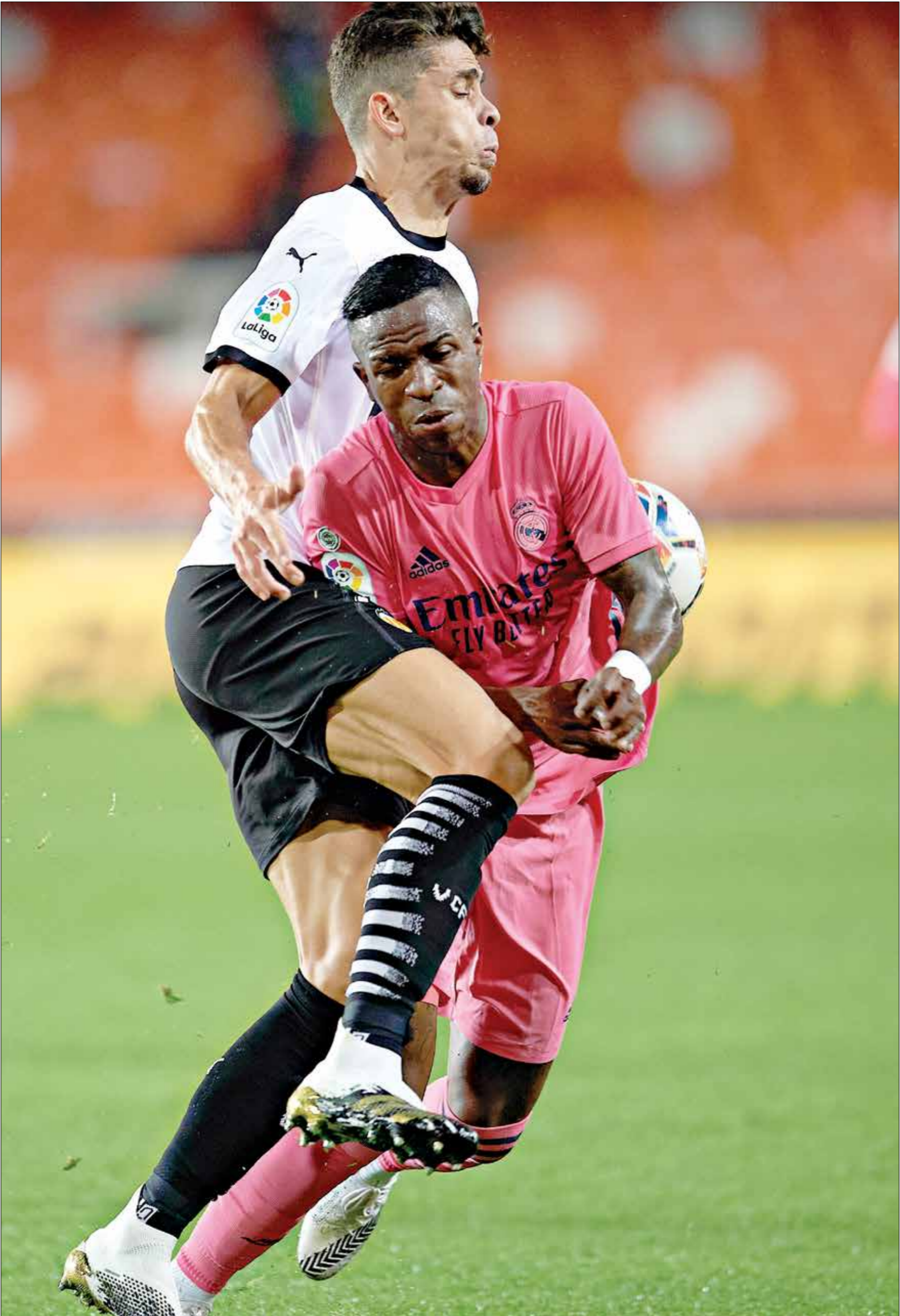
ريال مدريد واحد منأنديةالخصم الجانبالخصم الجانبي(الخصم البرازيلوي)