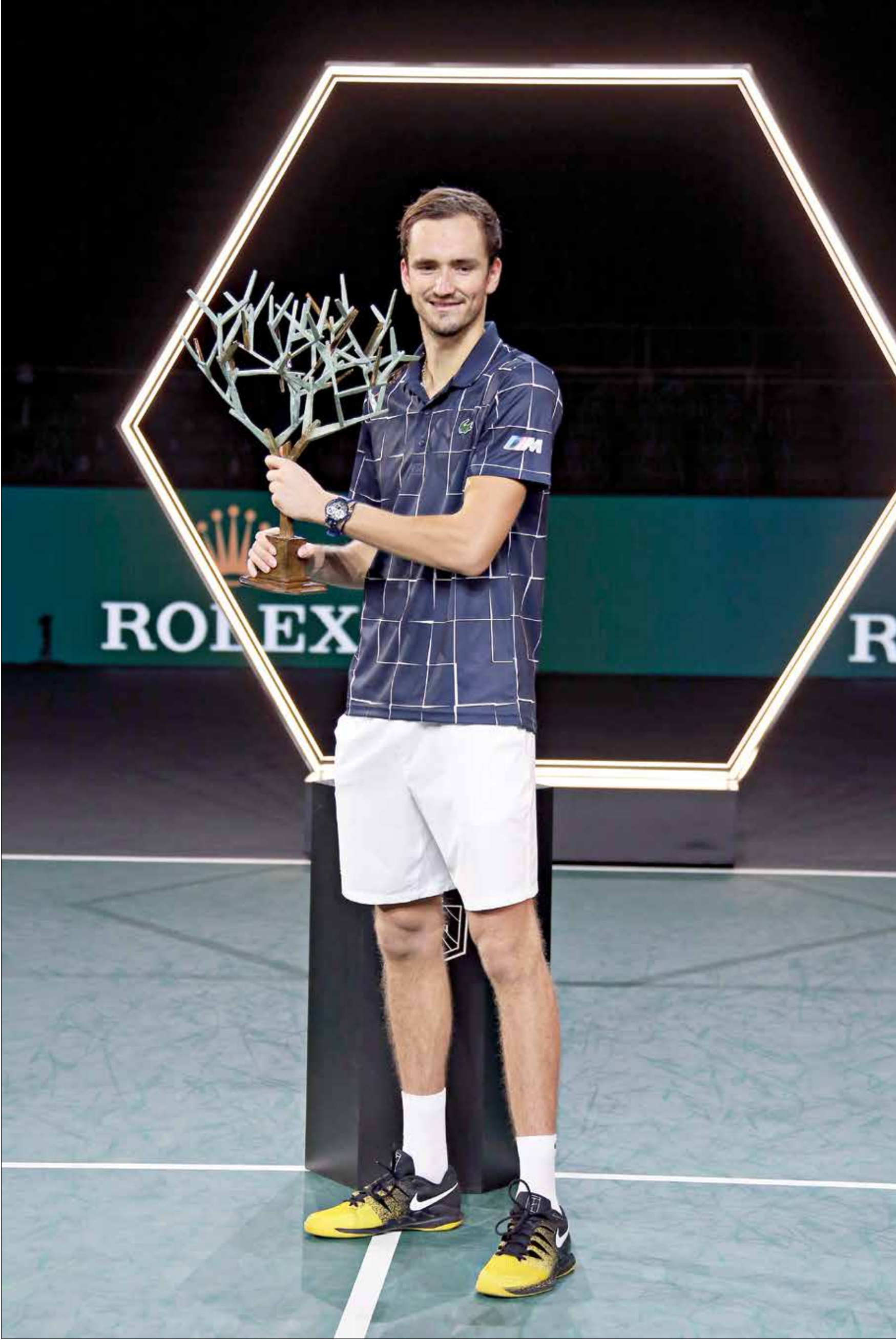
ميدفيديف أصبح الرابع عالمياً

أحرز الروسي دانيال ميدفيديف باكورة القاب هذا العام بعد تتويجه بدورة باريس لكرة المضرب، آخر دورات الماسترز لآلاف نقطة، بفوزه على الألماني الكسندر زفيريف 7-5 و6-4 و1-6 في المباراة النهائية. وسمح هذا التتويج لميدفيديف بالصعود إلى المركز الرابع في التصنيف العالمي على حساب السويسري روجيه فيدرير.