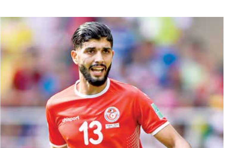
خطف ساسي انظار مع نادي الزمالك المصري

لاعبين دفعة واحدة، بعدما فتحت أبواب الانتقالات الصيفية أبوابها بشكل رسمي. وشهدت التعاقدات الصيفية حتى الآن في الأندية المصرية صفقات تونسية قوية وتخطى رقم الـ10 محترفين في الموسم المقبل بعد البداية القوية، واستخدام 4