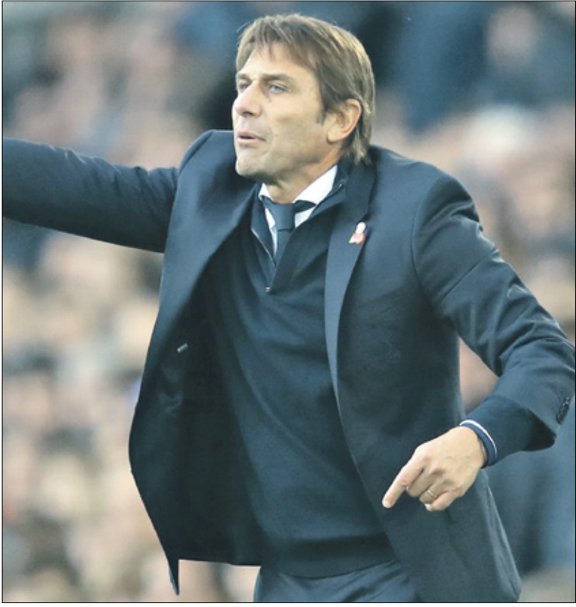
كونتي، الشرف، موزر على تدريب توتنهام