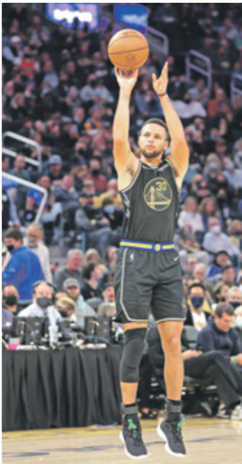
يُحصد كوري ستونم راندا حله الآن

في المباراة الأولى، بات كوري أول لاعب يصل إلى حاجز الـ 50 نقطة هذا الموسم ليقود فريقه ووريترز إلى فوزه التاسع في 10 مباريات معززا صدارته للمنظمة الغربية، وهي المرة العاشرة التي يسجل فيها كوري، البالغ 33 عاماً، 50 نقطة في مسيرته، متجاوزاً الأسطورة ويلت تتشامسراين ليصبح أكبر لاعب في الدوري الأميركي يسجل هذا القدر من النقاط إضافة إلى 10 تمريرات حاسمة، علماً أن لاعب فيلادلفيا سفنتي سيكسنز ولويس أنجيليس لكرز السابق حقق هذا الإنجاز في سن الـ 31 سنة والتقط كوري 7 مرندات وسدد 9 رميات ثلاثية ناجحة من أصل 19، مع نسبة نجاح