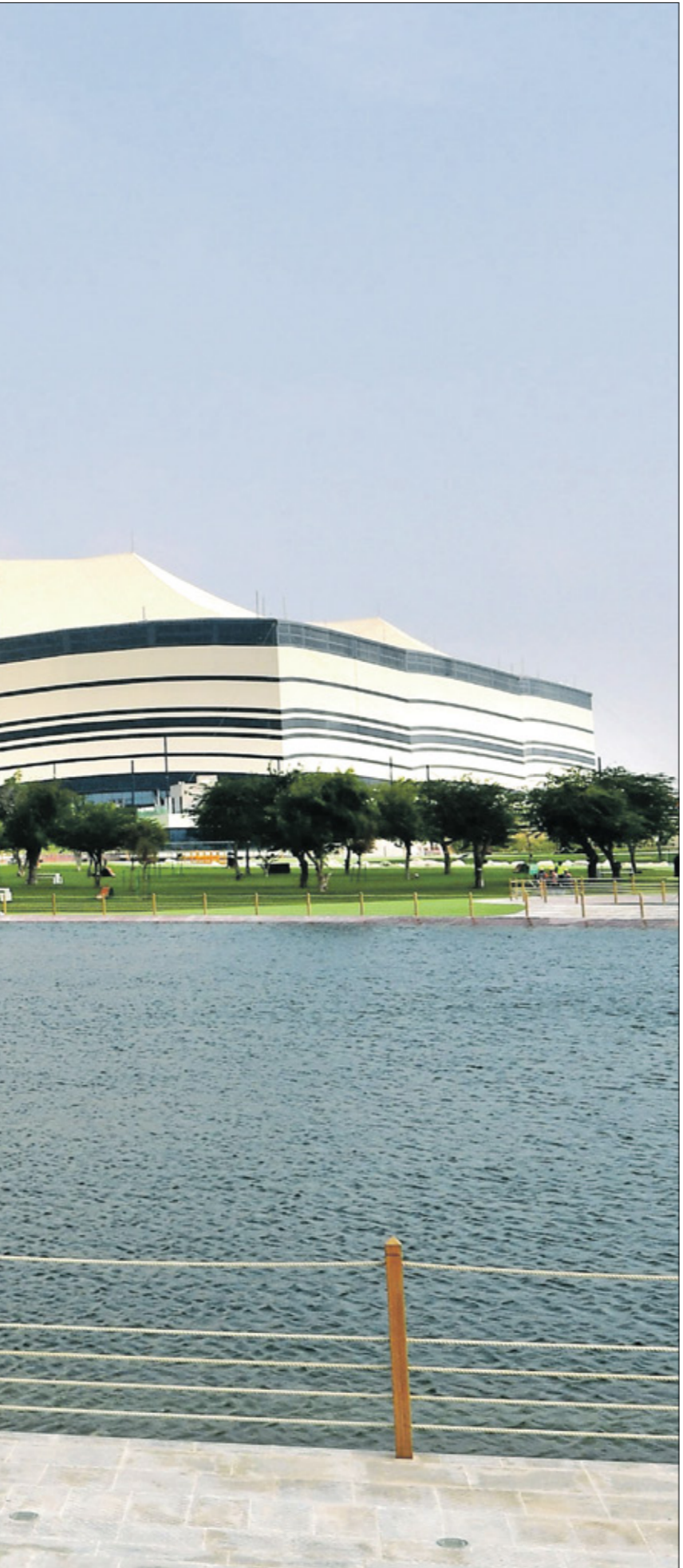
تتربص الجماهير بفتح استاد البيت بكأس العرب