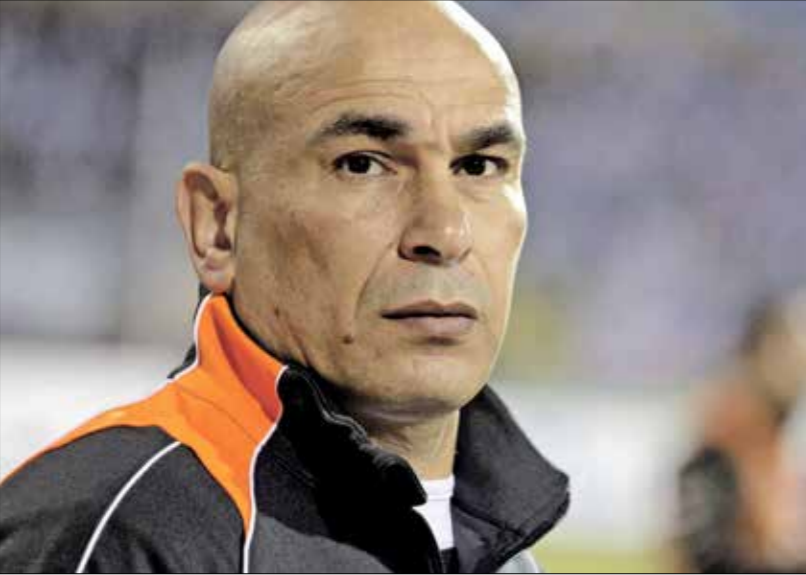
يصعد حسام حسن إلى تحفيز تلاحج جديدة مع منتخب مصر

وكانت علاقة حسام حسن توترت مع محمد صلاح قبل تعيينه مدرباً لمنتخب مصر، عندما انتقد اللاعب بقوة على هامش كأس الأمم الأفريقية 2023 في ساحل العاج. كما شهدت قائمة المنتخب المصري ظاهرة أخرى مثيرة للجدل، تمثلت في عدم اختيار حسام حسن، سوى لاعب واحد من نادي الزمالك، وهو محمد عواد حارس المرمى، وتجاهل عدد كبير من النجوم الذين تلقاوا في الفترة الأخيرة، مثل أحمد فووح ومصطفى سلطمة وعمر جابر ونيل دونغا، فضلا عن إصابة أحمد مصطفى القمة الأخيرة بين الزمالك والأهلي، وأشار قرار حسام حسن غضب جماهير الزمالك على خلفية صدمة استبعاد شنه جماعي لنجوم الفريق الأبيض القطب الثاني، مقابل سيطرة الملاوية على اختيارات معسكر منتخب مصر. ومن العناوين التي ظهرت الفني عن تهديدات استدعاء محمد صلاح على مشارفته مع ليفربول الإنكليزي في حل مباراة قبل التجمع الجديد، وهو ما حدث بالفعل، فإجأ حسام حسن للجمع بين التراجع عن ضم محمد صلاح وخسارة أول مباراة له مع اللاعب الكبير، في ظل توتر العلاقات بينهما منذ فترة وانتصار لريال مدريد الإنكليزي في مركزه زعيم الموسم الجاري.