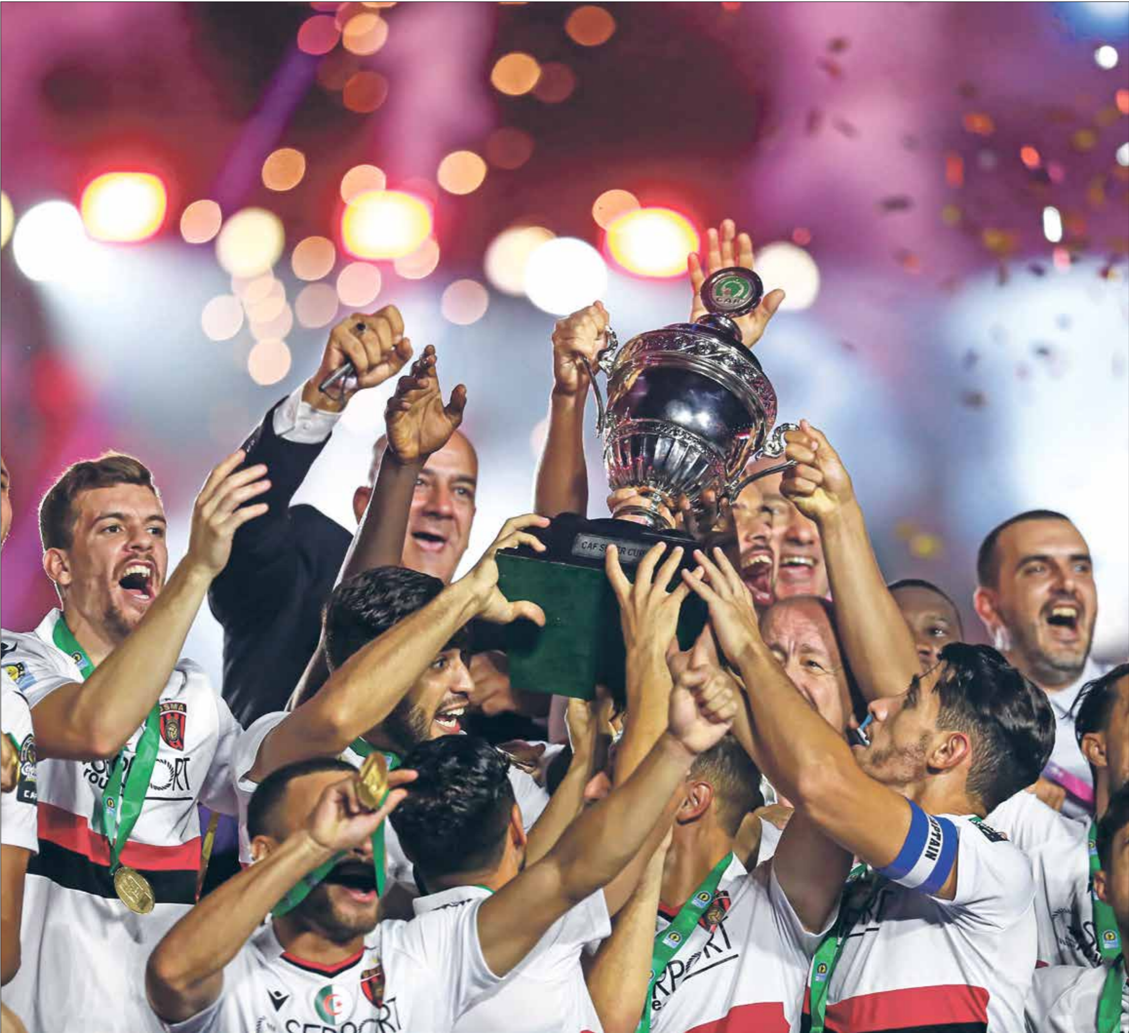
اتحاد العاصمة وطموحات كبيرة في الكونفيدرالية

والاحتل نادي يونغ أفريكانز وصافة الترتيب في نفس المجموعة، رغم خسارته خارج أرضه أمام البطل الأهلي المصري، وفاز نادي شباب بلوزداد الجزائري، داخل دياره بنتيجة 0-3 أمام نادي ميدياما الغاني، في اللقاء الثاني ضمن نفس المجموعة، وأنهى نادي ماميلودي صن داوتز، دور المجموعات في صدارة المجموعة الأولى، برصيد 13 نقطة، بعد فوزه على نادي تي بي مازيمبي بنتيجة 0-1 في بريتوريا، ورغم الخسارة، احتل نادي تي بي مازيمبي المركز الثاني برصيد 10 نقاط. وتصدر نادي اسكيجيمورا الإفريقي هو