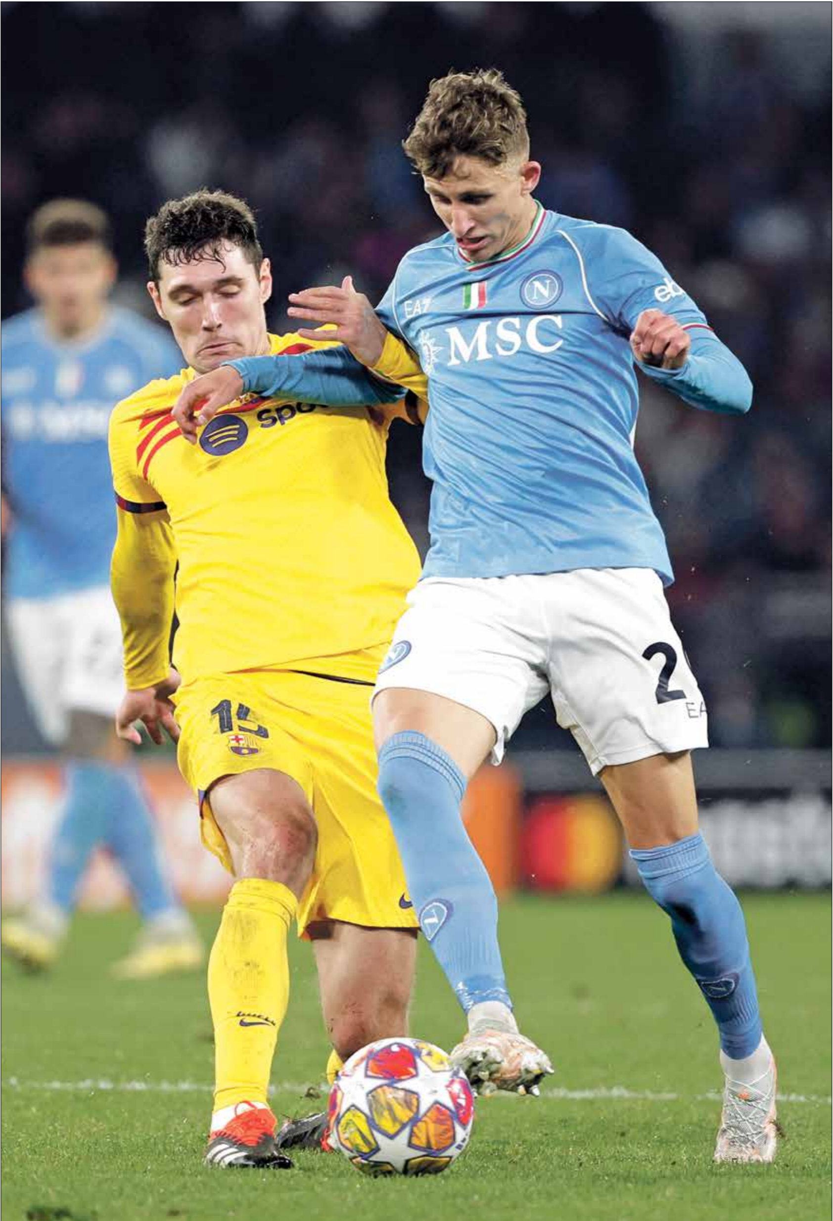
برشلونه خرج بتعادل مهم في لقاء الذهاب الجديد