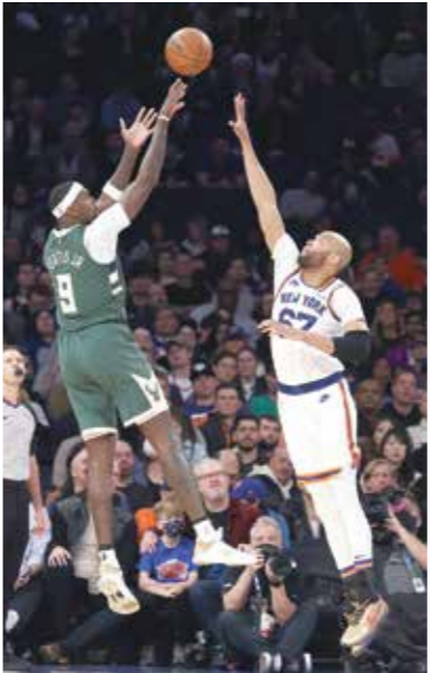
علي باكس امام نيويورك نيكس المباراة

وبدا باكس في طريقة إلى فوز مريح على منافسه بعد أن خطف العملاق اليوناني، يانيس أنتيتوكونيمو، الكرة قبل أن يسجل سلة ساحقة، رافعاً تقدم فريقه إلى 24 نقطة منتصف الربع الثالث، إلا أن بدلاء