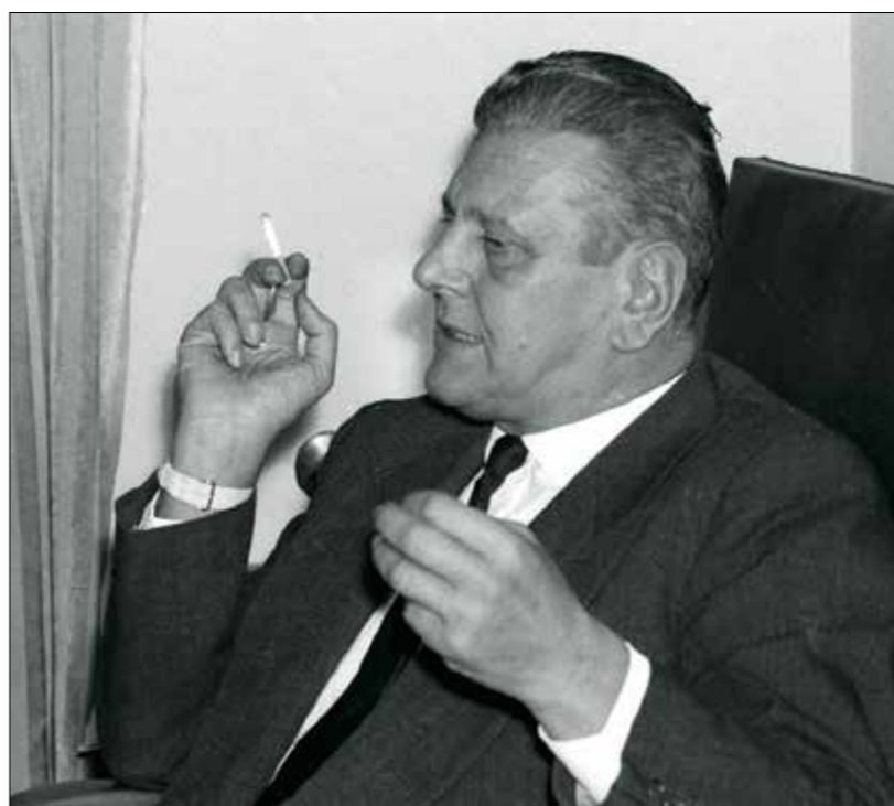
أوتو سكورزيني، في مدريد، 15 نوفمبر 1962، نازي يتعامل اعدائه معه

دون جدوى، قبل طرحها في المراء العلني، ووصولها إلى الجندي الأميركي السابق والمؤرّخ الحالي رالف بي غيمبس، الذي لا يزال إلى الآن يُلقّب فيها، تحللاً وناقشاً ما تحويه من أسرار.