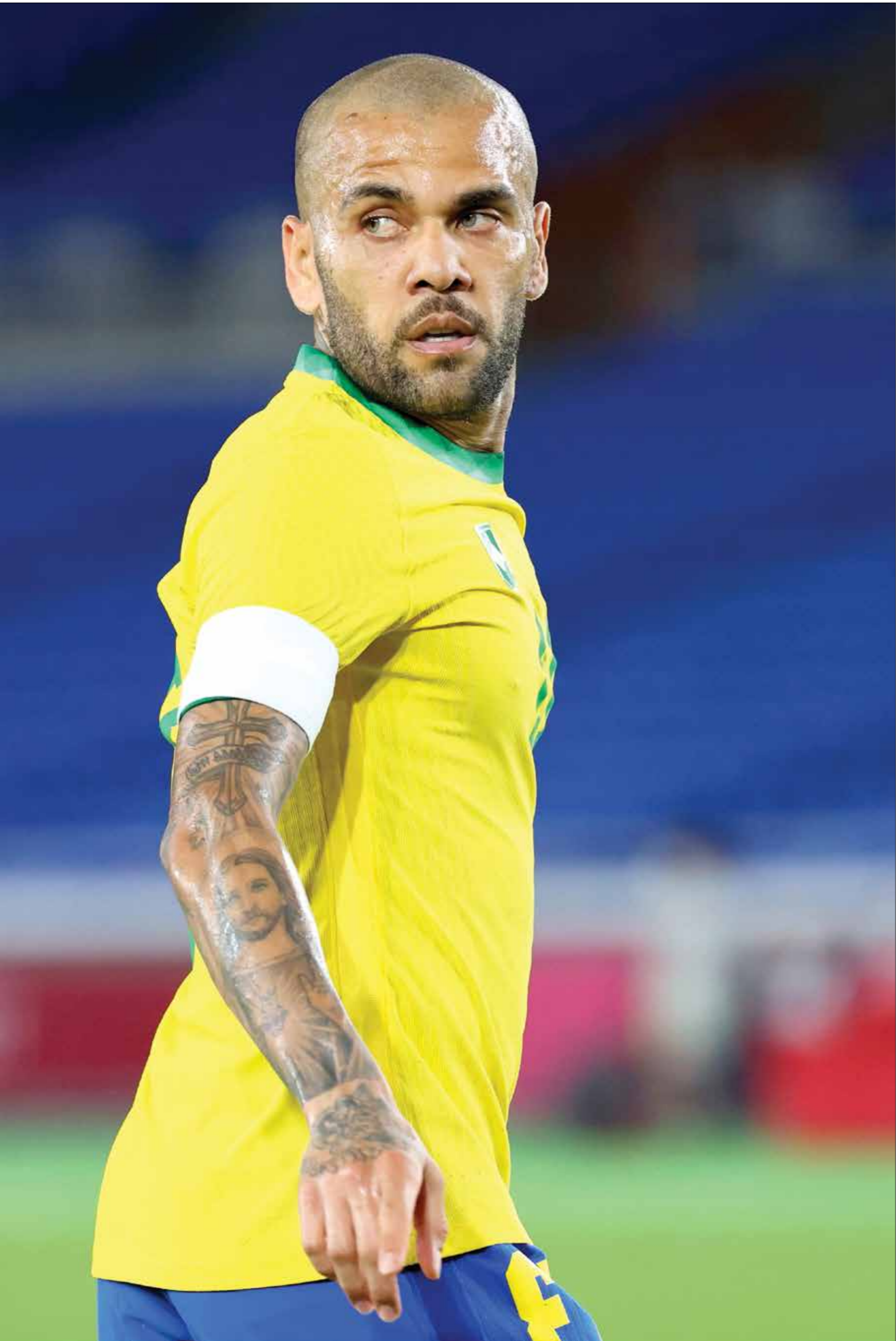
بريد الفيثال الموحدة لبرشلونة