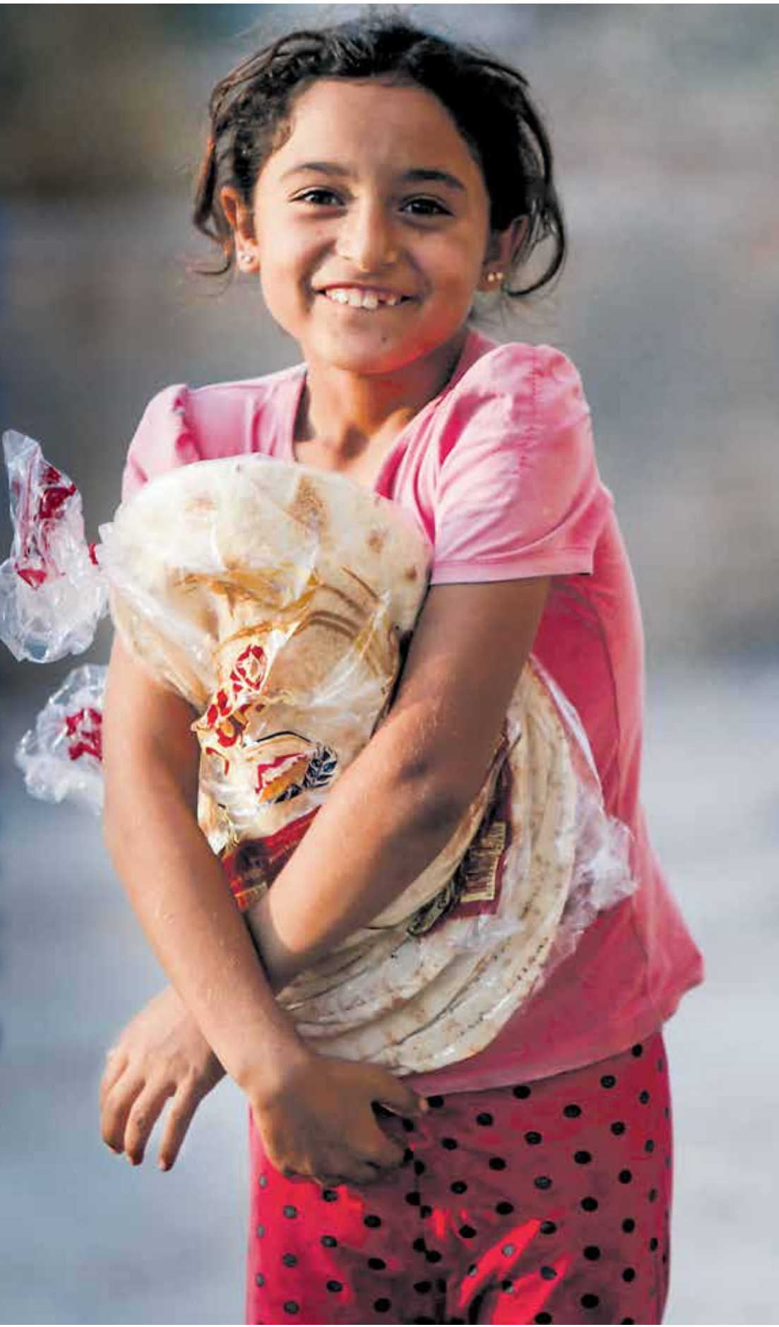
قرب تك ابيض، سورية