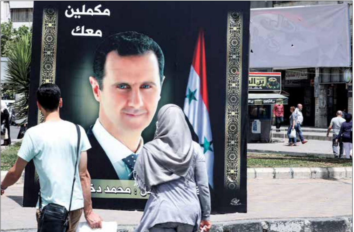
سجريو الانتخابات الرئاسية في 26 مايو (فرانس برس)

شكلياً، وأن النظام يدفع لاستمرار الوضع لما هو عليه، ونُوه عبد العظيم في تصريحات تلقها موقع «روسا اليوم»، بأن هذا الموقف يستغفات منذ عامربناً الجبهة الوطنية التقدمية في عام 1973، ترشحاً أو انتخاباً، وتلك الأخيرة عرقل النظام انعقاد مؤتمرها التأسيسي في دمشق.