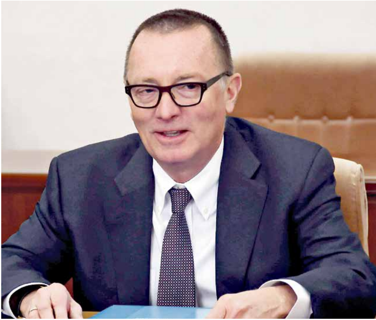
بدا فيلتمان غير ملم بكامل تفاصيل سد النهضة

لا يبدو أن مباحثات المبعوث الأميركي للقرن الأفريقي جيفري فيلتمان بشأن سد النهضة قد تمكنت من حلحلة العقد التي تحيط بالملف في ظل استمرار التباعد في مواقف الأطراف المعنية