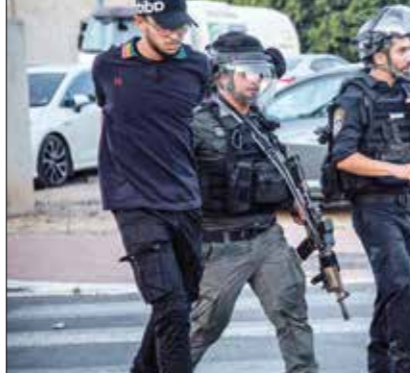
اعتقالات شرطة الاحتلال 200 مواطء من فلسطينيي الداخل (إب بظوم)للانوار)

أجبرت هبة فلسطينيي الداخل، إسناداً لغزة التي تتعرض لعدوان، وإتصاصاً للقدس والمسجد الأقصى، الاحتلال الإسرائيلي على نشر 16 فرقة في اللد، التي تجرت فيها وفي العديد من المدن التي يقطنها فلسطينيون المحتجزات، واعلنت السلطات الإسرائيلية، مساء أمس الأول الثلاثاء، حالة الطوارئ في اللد، لإحتواء التفارطرات التي نظمتها المواطنين الفلسطينيين في المدينة، التي تعد من المدن المختلفة التي يقطنها اليهود والعرب، ويعد هذا التطور سابقة لم تقدم عليها إسرائيل منذ انتهاء الحكم العسكري في 1966، وصيغ إعلان حالة الطوارئ شرطة الاحتلال لصاحبة فرض حظر التجول في تنفيذ المواطنين، إلى جانب التوسع في تنفيذ عمليات الاعتقال. وتدل هذه الخطوة على أن إسرائيل تنظر بخطورة بالغة إلى اتضام فلسطينيين داخل البلدا لمواجهة، إذ إنها جاءت بعد أن عجزت شرطة الاحتلال عن وضع حد لشهوات تفارطرات الأمتا التي شملت الحياة فيها، وبعد ما جرى في اللد المفتش العام للشرطة الإسرائيلية كوبي شفاقي التي اتخذ قرار بدفع الكثير من القوات إلى المدينة، لمحاولة السيطرة على الأحداث، ونقل مقر إقامته شخصياً إليها، وأعلن مسؤولون إسرائيليون أنهم استدعوا 16 سيرة من «الشرطة الحدود» من الضفة الغربية إلى المدينة لمواجهة العنف، وقال رئيس بلدية اللد وحيفا، جيسر الزرق، وعبرها، ولم تشمل اقتطعات التي نظمتها المستوطنات داخل فقط مواجهات مع الشرطة، بل أيضا اشتباكات مع المستوطنين، في ظل مزاعم أيضا بسبب انعكاساتها المتوقعة، في حال