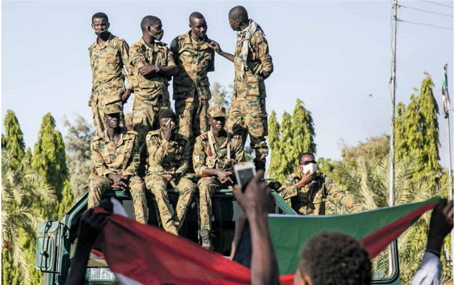
حائل الجيش لبرنة نفسه من سقوط المئات والجرحه

«قوى إعلان الحرية والتغيير»، والحركات المسلحة الموقعة على اتفاق السلام. من جهته، حفل «المبعث العربي الاشتراكي الأصل»، في بيان، «الامة القومي»، أمس الأربعاء، أن «ما حدث يوجب ضرورة هيكلة الأجهزة الأمنية وإعادة تأهيلها بالشكل الذي يجعلها تحافظ على الحقوق والحريات العامة»، وقدر «المؤتمر السوداني» سببح رئيسه عمر الدقير من عضوية مجلس الشراكة الذي يتترسه البرهان، و29 عضواً من الحكون العسكري