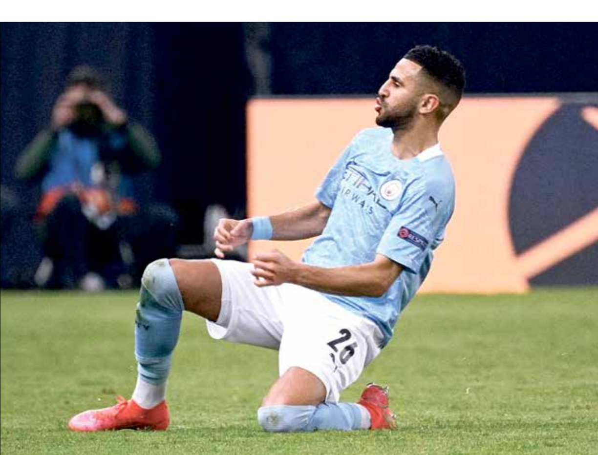
محرز فُذم مسلوباً محمراً ووضع الفارغ في الحيد من الوضات

الطريق إلى اللقب الجديد في رصيد الفريق كان صعباً في بدايته، ولكن الفريق عاد بقوة، بما أنه ضمن المركز الأول، كما بلغ نهائي دوري أبطال أوروبا للمرة الأولى في تاريخه، وهو ما يجعل هذا الموسم تاريخياً بالنسبة إلى رفاق رياض محرز. فكيف نجح سيتي في قلب المعادلة؟