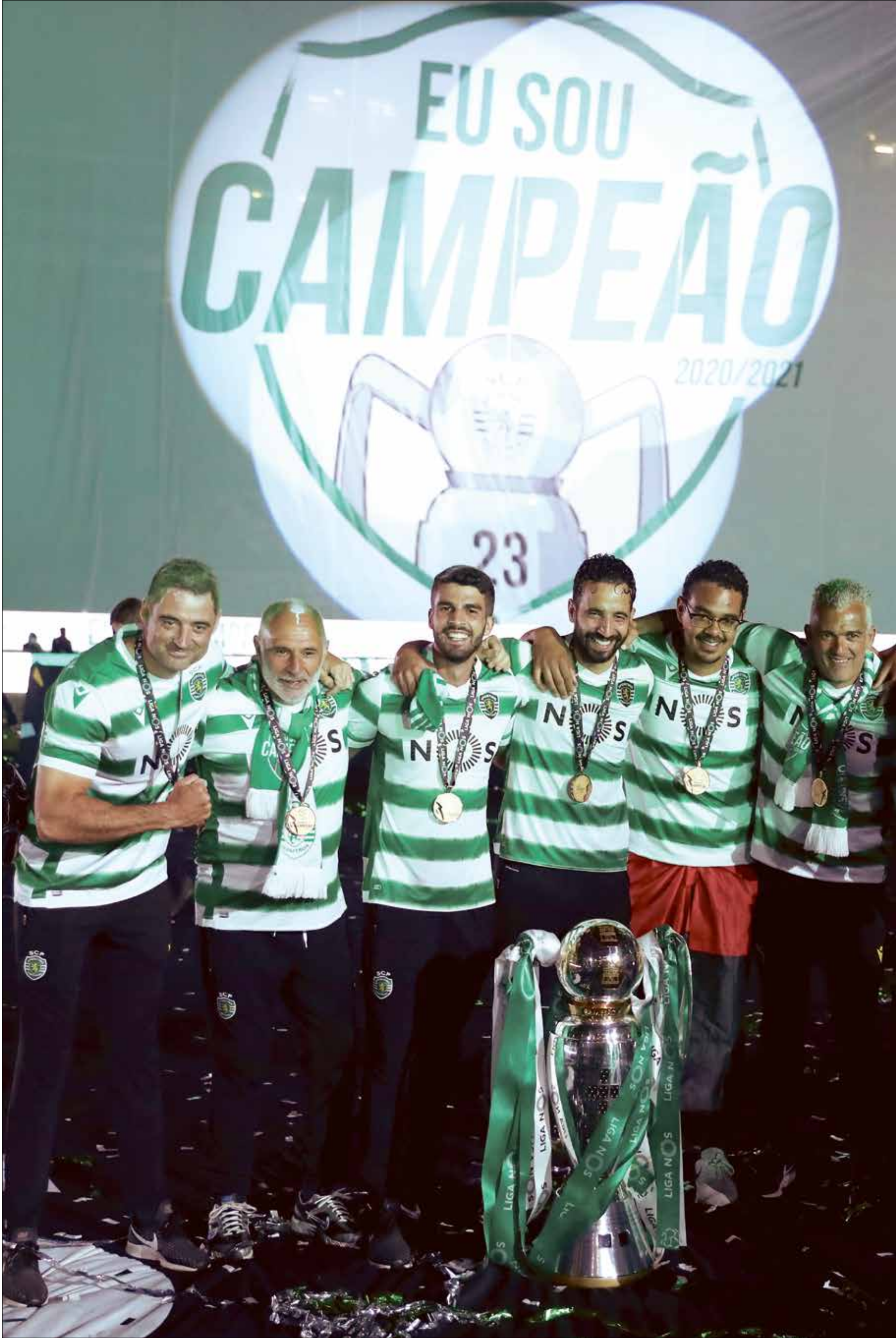
سبورتنغ يخطف اللقب بعد طول غياب

تُوج فريق سبورتنغ لشبونة بلقب الدوري البرتغالي لكرة القدم للمرة الـ 19 في تاريخه والاولى بعد غياب 19 سنة إثر فوزه الصعب والثمين على ضيفه بوافيشنا بهدف نظيف في اللقاء الذي اقيم ضمن الجولة الـ 32 من المسابقة. وبهذا الفوز يُتوج فريق سبورتنغ رسمياً بلقب الدوري بعد انتظار دام 19 سنة وتحديداً منذ موسم (2001-2002) الأخير الذي عرف فيه الطريق للقب، وهي المرة الـ 19 في تاريخه.