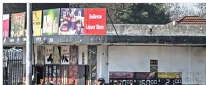
المواجهات المستمرة في الشوارع تسبب اضطرابا في أسواق الماء والتملح

مطلبية الشركات التي تطرح أسهمها للاكتتاب العام باستخدام «هيكل كيان المصلحة» المغفّرة» للحصول على الموافقة