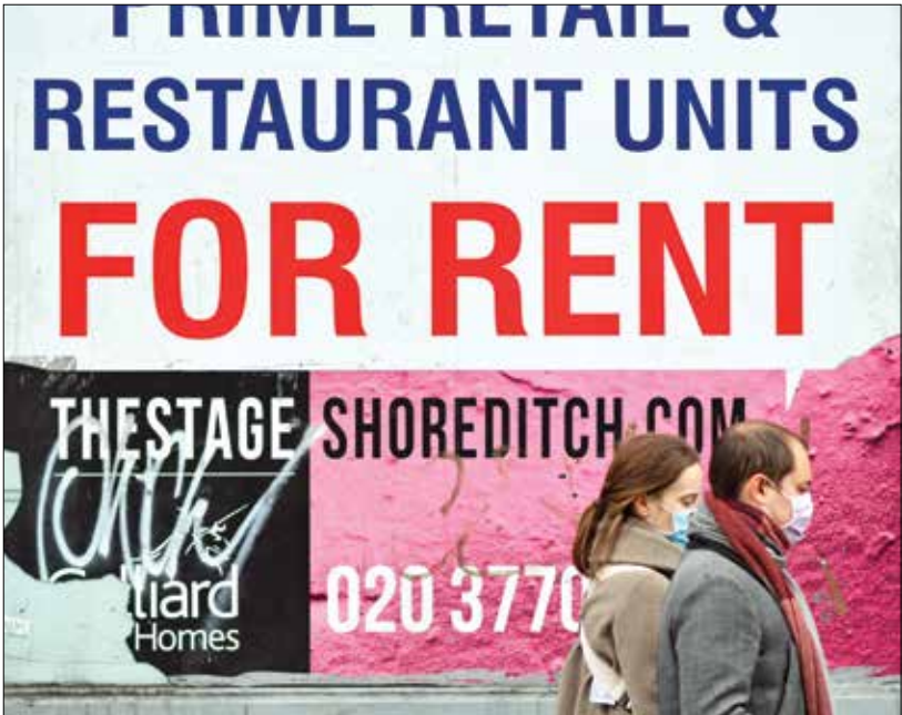
أسعار المنازل زادت 9,9% خلال عام حتى مارس الماضي في أكبر ارتفاع منذ 2007

مذ عشرات الأعوام، يدفع الاقتصاد الأفغاني ثمن الاحتلال والاقتتال الداخلي، مما يُفقد البلد الغني بالموارد الطبيعية