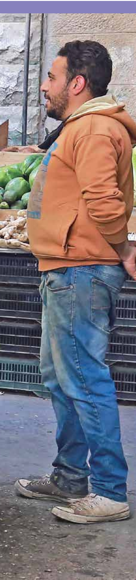
الشارع يلبث موجات غلاء جديدة (فهراس برس)

ويبتد دائرة الإحصاءات العامة الحكومية أن نسبة البطالة ارتفعت خلال الربع الأول من العام الحالي إلى 22%، وتوقع أن تواصل الارتفاع بسبب تداعيات كورونا.