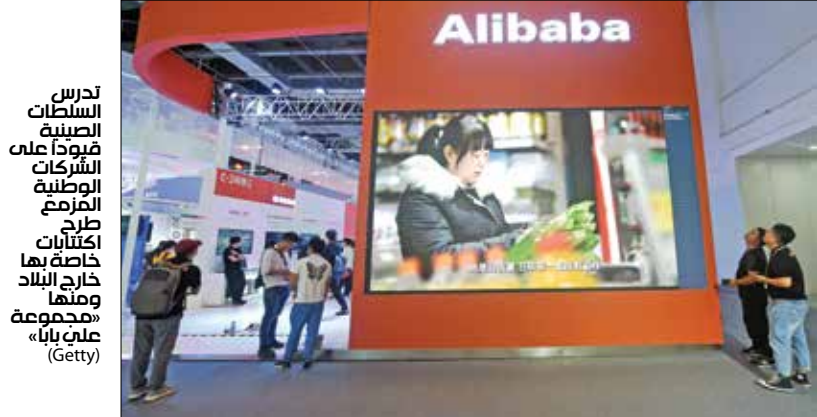
تجسس الشركات الصينية عبروات على الشبكات الوطنية للرفع طرح البورصة خارج البلاد، وهذا مجموعة «جيتي» علي بابا

يركزون على تلك المجالات، وأوضح أحدان أن تطوير مثل هذا الإطار هو على الأرجح إشارة إلى بيع سندات دولارية بعدة مليارات من الدولارات، ستكون الأولى للصندوق السعودي.