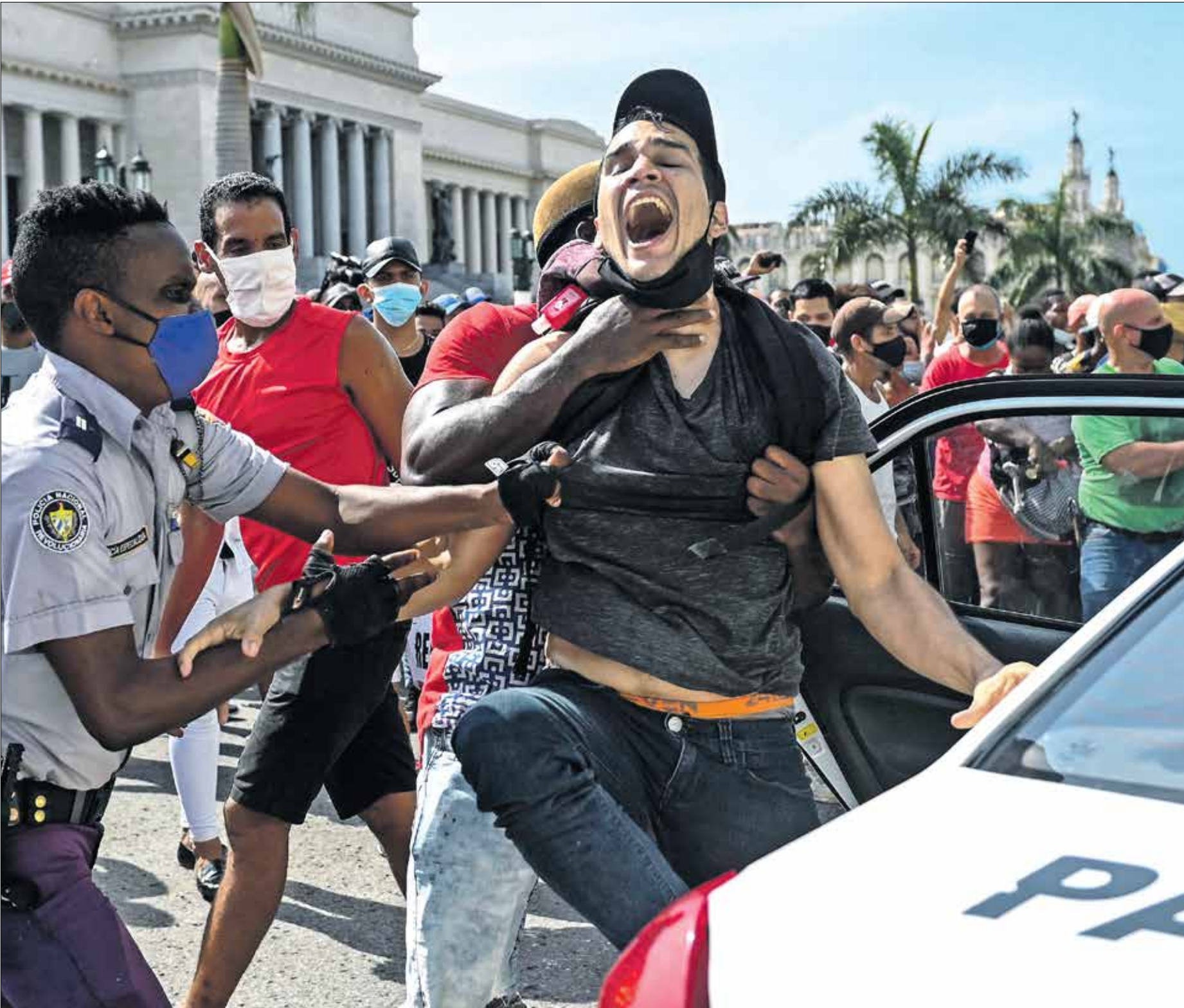
واجهت السلطات التظاهرات بالقمع

في أعقاب الانتخابات التشريعية، وندعت نفسها أساسا في عام 2023، بعدما وجدت نفسها