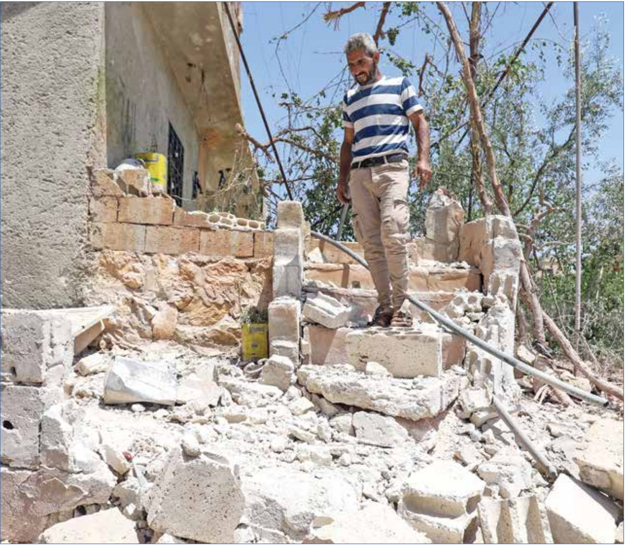
عاد التصعيد لمعظم محاور الاشتباك بجدة الزاوية (بعد التراجع فيمعرض الراس برين)

نقلت المليشيات المدعومة من إيران، في اليومين الماضيين، معدات عسكرية وقواهم انطلاقاً صوب ريف حلب، الزور الشرقي إلى ناحية معدات شرقي الرقة، وأوضحت مصادر مطلعة أن انتشار تمّ في منطقة تبرز فيها قوات النظام والمليشيات الحزمت، «اعلان».