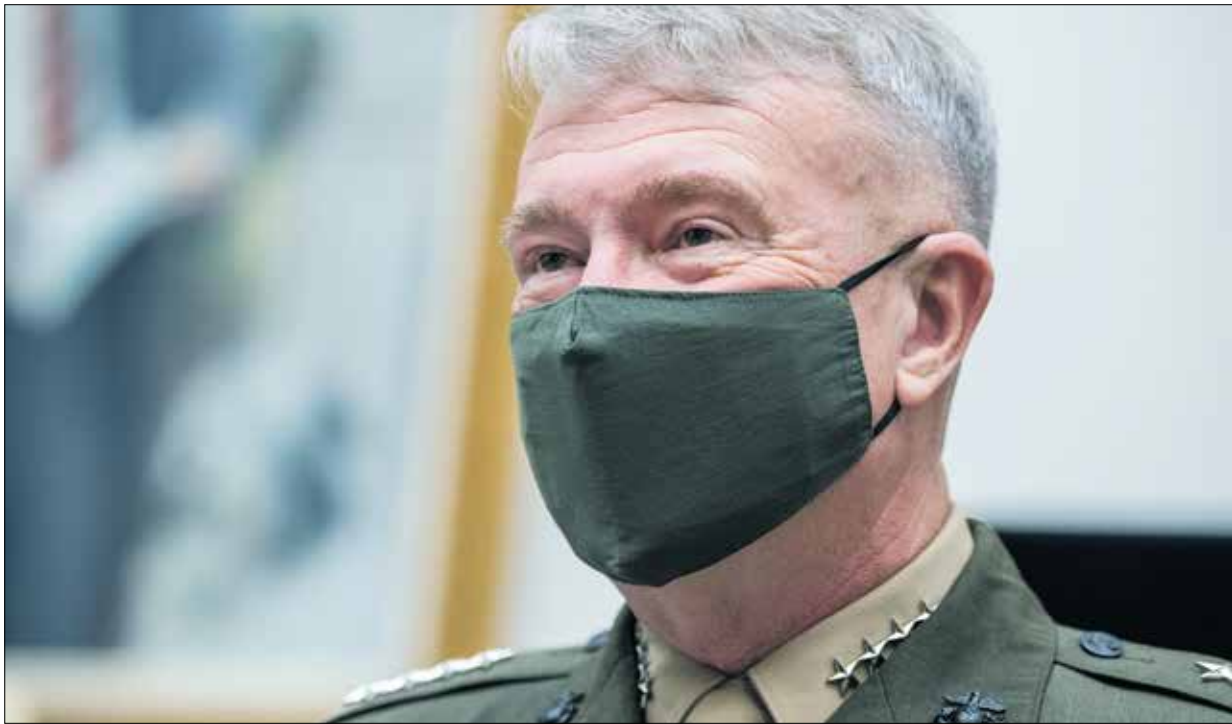
بإمكان ماكينزي إصدار أوامر بضربات ضد «طالبان»، حتى نهاية أغسطس

فيما تستمر المواجهات بين قوات الحكومة الأفغانية و«طالبان» في أنحاء مختلفة من أفغانستان، تقوم واشنطن بمحاولات جديدة لإنقاذ السلام الأفغاني، بانتظار رد الطرفين على المبادرة القطرية