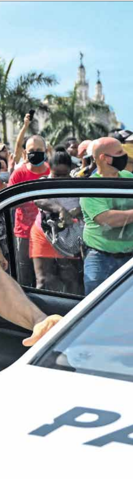
واجهت السلطات التظاهرات بالقمع

حين واجه الزعيم الكوبي الراحل فيدل كاسترو، خلال النصف الأول من تسعينيات القرن الماضي، تداعيات الأزمة الاقتصادية التي أصابت كوبا مع انهيار الاتحاد السوفييتي، وكانت قد سبقت تظاهرات الأحد حركات متفرقة وتظاهرات خلال الاعوام الماضية، لا سيما في 2020، كان إبطائها حركتها على عكف الشرطة والقمع والملاحقات، إلا أنها لم تصل في العدد إلى حدّ ما شهدهت تظاهرات أول من أمس. ولا يزال مكرراً الجزء أو الدهاب بعيدا في التنبؤ بمالات هذه التظاهرات، إذا ما استمرت، وهو ما توقع النظام حصوله، لا سيما لجهة خطرها على الحزب الحاكم الذي تحثى عن قيادته راؤول كاسترو في إبريل/ نيسان الماضي، ففي مقابل «الجيل الخاني» من الثورة الكوبية، قد لا يكون بمقدور الرئيس ميغيل دياز كاتيل، السير على خطى فيدل وشقيقه، حين عملا على قمع حركة المنشقين والمعارضين، ودفعهم إلى عبور المياه إلى ميامي الأميركية، والتي ساهمت أسوال الكوبيين فيها بشكل غير مباشر، برفد الجزيرة ببالغ المالي خلال سنوات الحصار. وإذا كان دياز والطبقة الحاكمة قد رفعوا سريعا الاتهامات الكلاسيكية للولايات المتحدة «المخايف المعارضة» في أمريكا، بالوقوف وراء الحراك، إلا أن أعيانهم ستظل مسئلة لوقت طويل على مواقع التواصل الاجتماعي، والتي تعد من أبرز محركات تظاهرات الأحد، بعدما ساهم الإنترنت في هذا البلد، اعتبارا من 2018، في نقل مطالب المجتمع المدني، ويغض النظر عن سجال ما إذا كانت التظاهرات غفوية أم لا، فإن قلق النظام الكوبي يبدو كبيرا، وهو ما يفسر إسرعه إلى سلاح التعبئة «النصر» من أجل الدفاع عن الثورة». عبر تحريك الشارع المضاد، في مقابل مسارعة روسيا والولايات المتحدة إلى توجيه الرسائل بشأن تظاهرات كوبا.