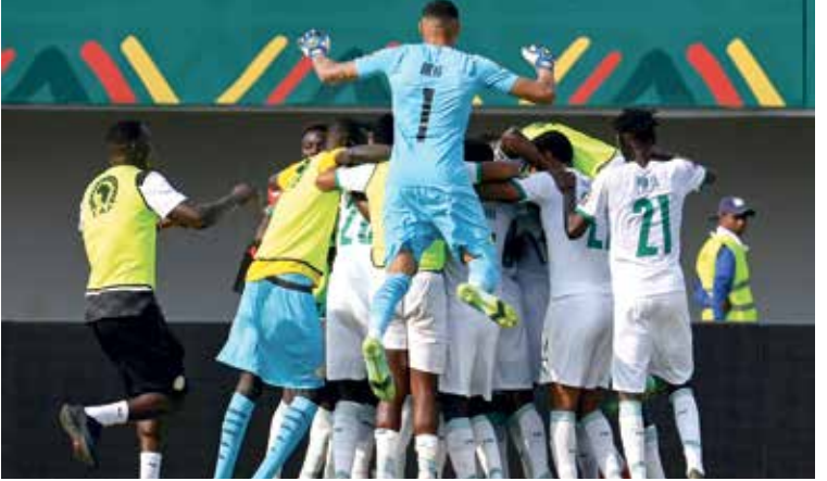
السنغال تسحق للتأهل والتأهل

من شأنه أن يفتح الباب أمام المغرب في مواجهة جزر القمر، بعد الفوز القوي في ظروف صعبة للغاية، في وقت سابق من مزاولة أي نشاط رياضي، عقب مباراة الترجي التونسي وبريميرو دي أوستو الأنغولي في نصف نهائي دوري أبطال أفريقيا سنة 2018، بعد أن رفض أحساب هدف للفريق الأنغولي في شباك الترجي، ليصعد الأخير إلى المباراة النهائية. في نهائي دوري أبطال أفريقيا نسخة 2019، تكرر نفس الموقف بين الترجي التونسي والوداد المغربي في الوعة الشهيرة، التي غاب عنها حكم الفيديو «الغار»، حيث كان الحكم الزامبي جاني سيكازوي متواجداً على تقنية الفيديو المساعد حينها، في المباراة «الفضيحة» التي شهدت جدلاً واسعاً في ذلك الوقت. ومنع هذا الحكم نجم فريق