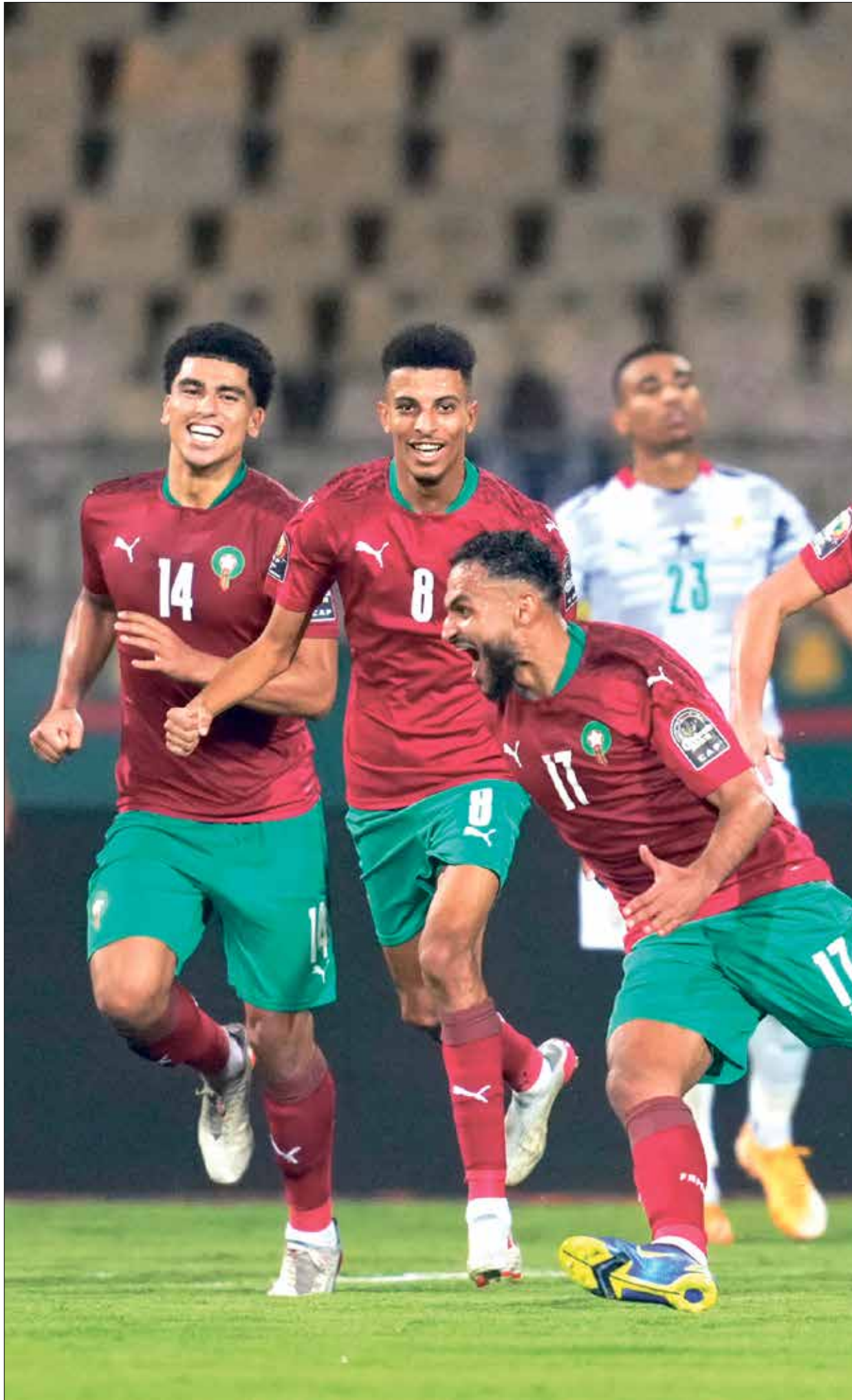
المنتخب المغربي وطموحات بحسم التأهل المبكر

جديو، قبل أن يخرج الطاقم التحكيمي بمرافقة أمنية.