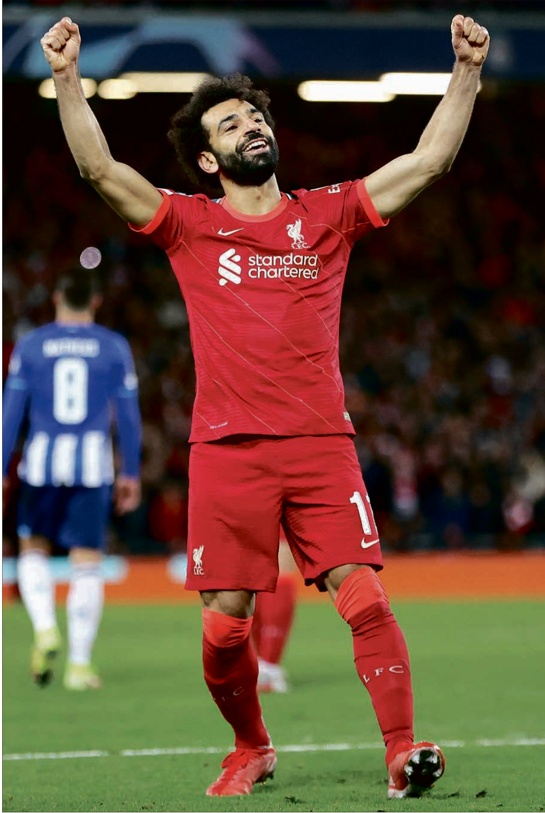
هل يُجدد صلاح عقده مع ليفربول؟

كشفت صحيفة «تيليغراف» البريطانية ان النجم المصري محمد صلاح، طلب مبلغ 400 ألف باوند أسبوعياً من أجل تجديد العقد مع فريقه ليفربول، إلا ان إدارة الفريق لم توافق على متطلبات صلاح المالية، والرقم المرتفع لا يتناسب مع سياسة النادي المالية حالياً، ما يعني ان عملية تجديد العقد مع «الريدز» دخلت في تعقيدات جديدة ومن الممكن الا تكتمل.