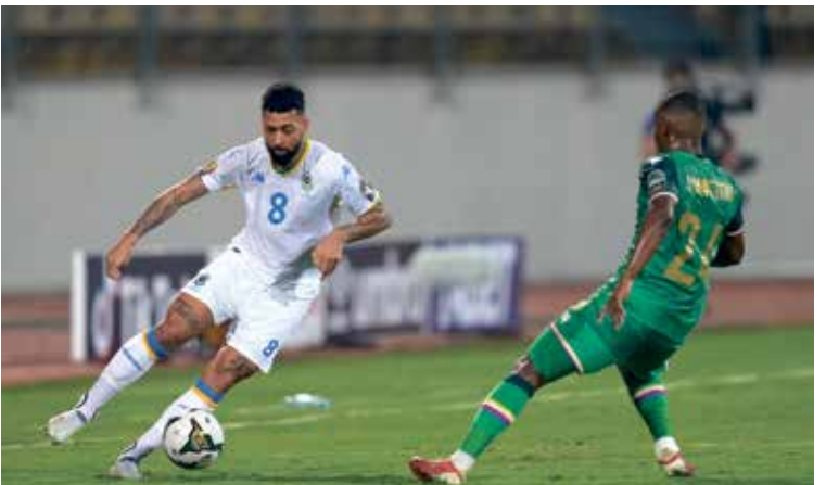
جزر القمر ومشاركة السائح في الكان الأوليت بجزر فرانس برس

المغرب مع نظيره في جزر القمر في الجولة الثانية من عمر المجموعة الثالثة في سياق الدور الأول، لبطولة كأس الأمم الإفريقية لكرة القدم المقامة حاليا في الكاميرون، وتستنصر حتى 6 فبراير/ شباط القادم، ويمثل اللقاء فرصة لحسم التأهل المبكر لمنتخب «أسود الأطلس»، كذلك فإنه الفرصة الأخيرة لفريق جزر القمر في سياق الوصول إلى الدور ثمن النهائي من عمر البطولة القارية. ويدخل