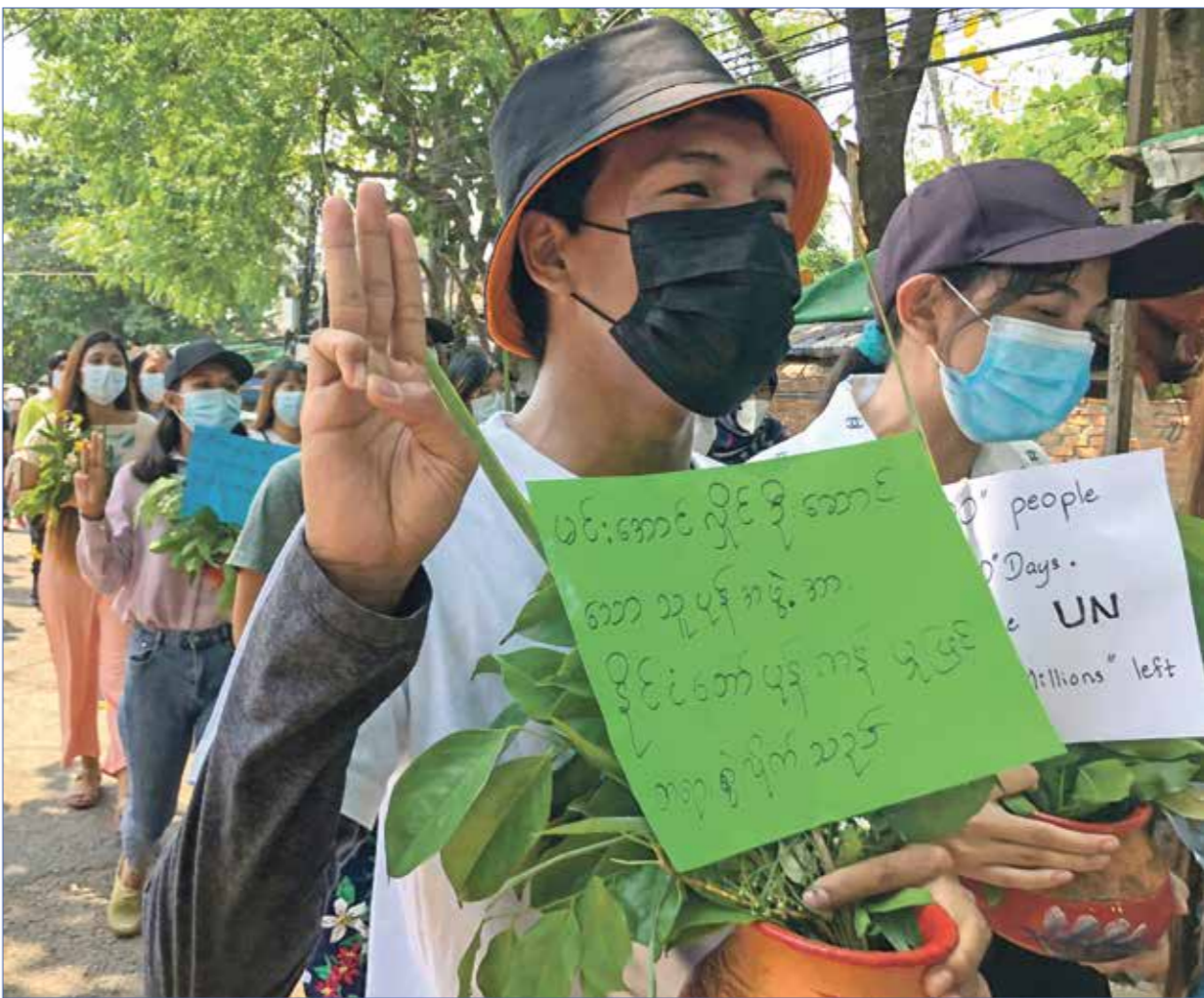
لا يزال الحراك الشعبي سلميا معظمه

تتصاعد التحذيرات الاممية من إمكانية اتجاه ميانمار إلى حرب أهلية طويلة الأمد، على غرار سورية، جراء انقلاب الجيش على الحكومة المدنية واستمرار حراك المعارضة، وهو ما يحتاج حكما إلى تدخل الأقاليم الأينية المسلحة، في النزاع الدائر