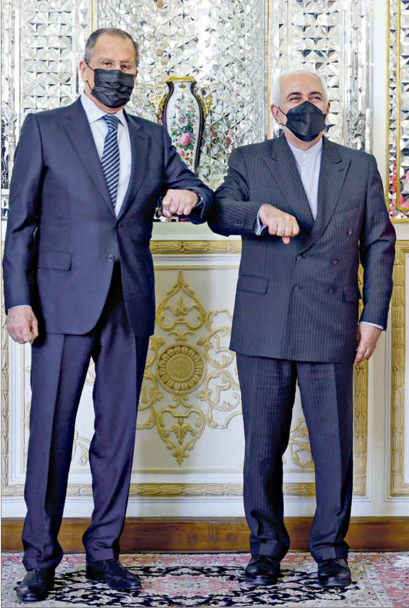
أكد طهران، أن استهداف نظنر سيعرّف موقف طهران