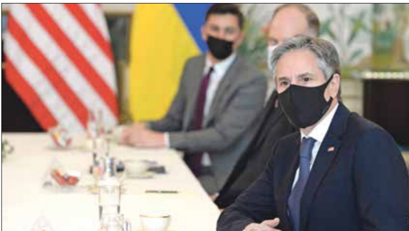
أكد بليكوف ومفوضا الولايات المتحدة نائب ووكرايا