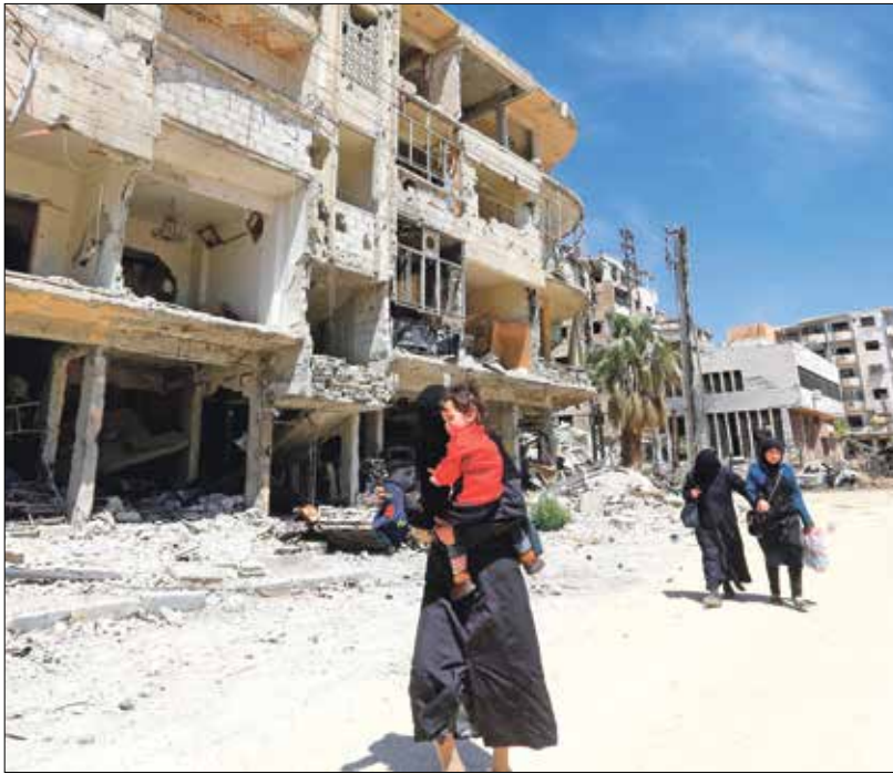
قصف النظام دوماً بالكيميائي عام 2013