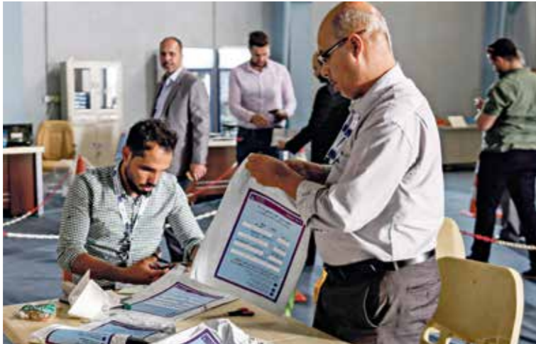
لبحث موضعية الانتخابات وفقا لدراسة اسماء المرشحية

المفوضيّة لعدم الإعلان عن أسماء المرشحين «أمر مرعب»، مبينا في حديث لالعري الجديد»، أن «هناك احتمالات عديدة تقضي في إطار تفسير هذه الدعوية، ومنها الخوف على حياة المرشحين، فضلا عن عدم الثقة بين الأحزاب السياسية والمرشحين أنفسهم، وهو احتمال يأر وازدا واضحا»، لكنه لفت إلى أن المفوضية «سجلتها «غير ملزمة قانونيا بالمحافظة على السرية في ما يتعلق بإعلان عن أسماء المرشحين، خصوصا أنه من المفروض أن تقوم في 17 إبريل بإعلان باب الترشيح، من 15 يوما إضافيا لإعداد أوصيا بالمرشحين خصوصا مع استمرار المفاوضات حول تشكيل التحالفات الانتخابية»، مبينا أن «هناك خشيّة على المرشحين، خصوصا أن الانتخابات المقبلة ستعقد في حرك الحرك الشعبي، فواضح التناطح مع محمد ن هذه الكليات» لا ترتب في الإعلان عن أسماء مرشحين في الانتخابات المبكرة، خشيّة تعرضهم أو تعرض بعضهم لعمليات اغتيال، إذ سيما أن الجماعات المسلحة والبعثيات تتعرض لتمهيد هذه الحركات السياسية بشتى الطرق، وبالتالي فإن إعلان أسماء مرشحين في الوقت الحالي يعدّ ذلك حملتها الانتخابية استعدادا ليوم الاقتراع.»