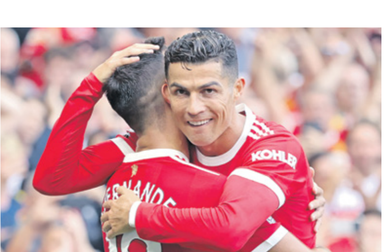
يمتد مانشلستر يونايتد على رونالدو

الدور المجموعات في دوري أبطال أوروبا لكرة القدم، ويدخل نادي برشلونة اللقاء وعينه على تحقيق الثأر من منافسه بايرن ميونخ الألماني، بعد الهزيمة المدوية للفريق الأكبر في تاريخ الفريق الكتالوني، الذي لم استطاع دك شباك الحارس مارك أندريه تير