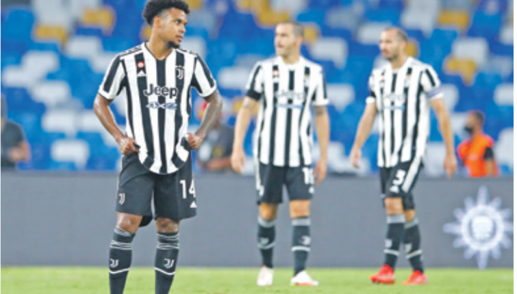
يعاتب يوهانوس بالموسس الحالي

شتمغن بثمانية أهداف، في لقاء ربع نهائي دوري أبطال أوروبا بموسم 2019/ 2020، الذي انتهى (2-8)، وتعد هزيمة برشلونة الإسباني على يد بايرن ميونخ الألماني هي الأكبر في تاريخ الفريق الكتالوني، الذي لم يخسر سوى بستة أهداف نظيفة أمام جاره