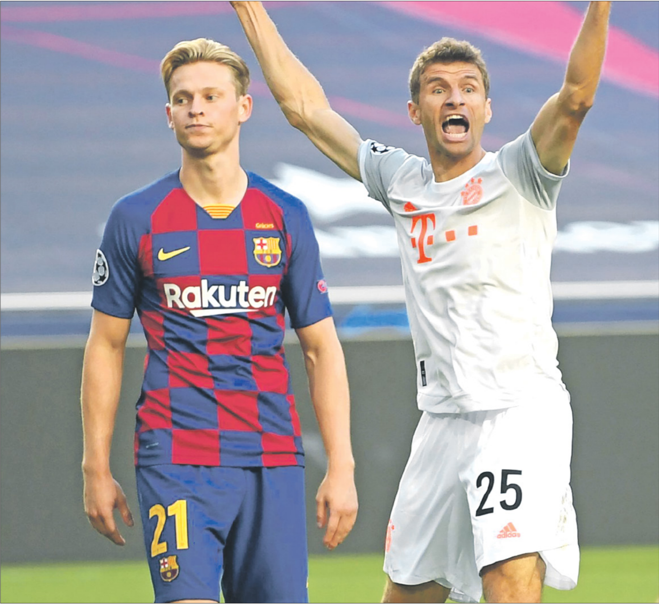
يرد بايرن ميونخ التصوف على برشلونة

وبالمجموعة نفسها، يلعب يوفنتوس الإيطالي ضد مالو السعودي، حيث تسعى