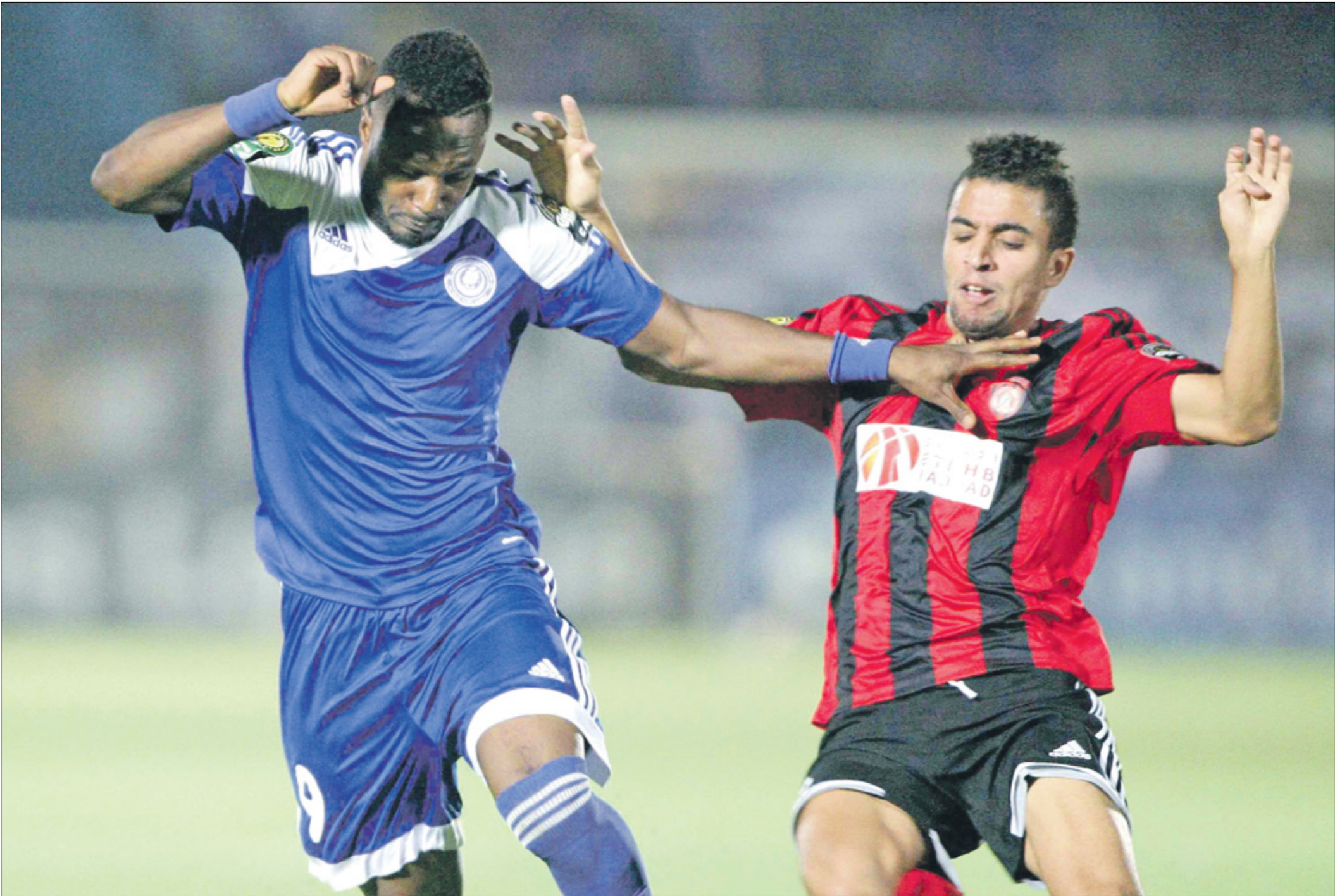
الهالاحذر فرصة العودة من ليبيا بفوز ثمين

بفارق 4 أهداف في الإياب من أجل إنقاذ فرصة والتاهل إلى الدور المقبل، في المقابل، قرر الاتحاد الأفريقي لكرة القدم تأجيل لقاء حي الوادي السوداني واهلي طرابلس الليبي على ملعب بديل لحل الأزمة، وإقامة المباراة المرتقبة بين الفريقين، وفاز فريق ديميارس على ملعب المباراة، والذي اعتبره غير صالح، بثلاثة أهداف مقابل لا شيء، فيما فاز إنتر كلوب الكونغولي على ماكونزو، بطل زنجبار، في مدينة الأبيض، ولكن قوبل الأمر بالرفض التوفغوي بثلاثة أهداف مقابل لا شيء في الإيابي بهدفين مقابل هدف وحيد.