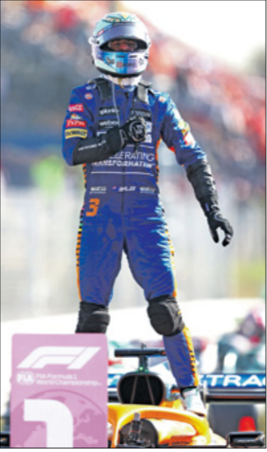
ريكياردو حصف المنظار التوك مع ماكلايرن

مرة كان الإسباني يتقدم فيها على منافسه الإيطالي، يعود بانيايا ليفتق المركز الأول، إلى أن نجح في اللغة الأخيرة من دفع منافسه الوحيد إلى الخطأ، وبالتالي إنهاء السباق متقدماً على واحد من أفضل الدراجين في العالم، وانتظر الذي أحرز معه سبعة سباقات، وهو حل أمام زميله البريطاني لاندو نوريس، فيما أكمل الفنلندي فالنتيري بوتاس (مرسيدس) عقد المنصة بحلوله تالفاً، وبعد عامين مع رينجو في 2019 و2020، انضمام الأسترالي البالغ من العمر 32 عاماً إلى فريق ماكلايرن في العام 2021، وقبل الفوز بالسباق، كانت أفضل نتيجة له حوله رابعاً في جائزة بلجيكا، وارتقى ريكياردو إلى المركز الثامن في الترتيب العام، متفوقاً على الفرنسي بيار غاسلي (الفا تاوري) الذي انسحب من