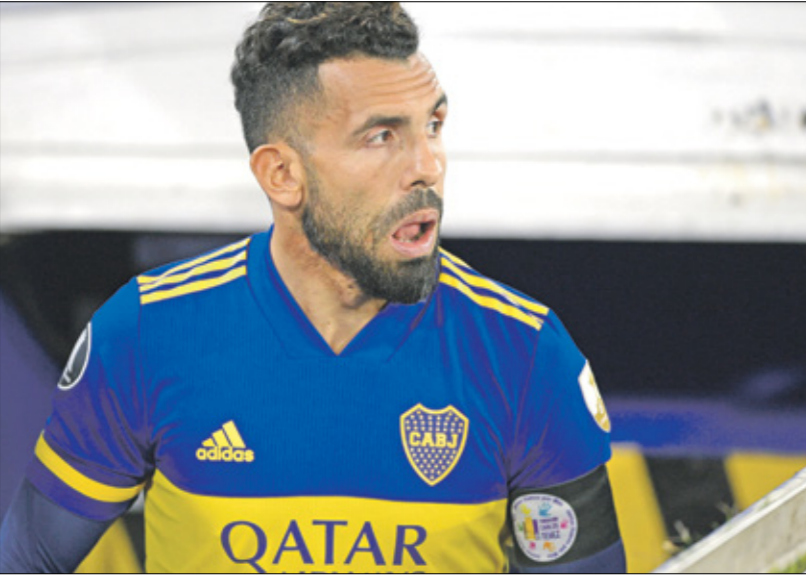
ليفر اصبح بلا فريق فيه انتظار العروض

لصالح عدة أندية مثل يوفنتوس وتوتنهام وإنشيلية ونابولي وأودينزي، وهناك عدة حراس مرمرى يصرون بنفس وهنأه عدة حراس مرمرى يصرون بنفس وضهيرورنسي إنينسطنرالدوسيان والبرازيلي ويسدر اللاعب عرضاً من سالرنيتيانا، الصاعد حديثاً لدوري الدرجة الأولى الإيطالي، ومن المحتمل أن يرازل الفرنسي فرانك ريبيري (38 عاماً) الذي كان هو الآخر ضمن اللاعبين الذين أصبحوا بلا فريق عقب انتهاء الميركاتو لكنه وجد بعدها بايام مكاناً له في النادي الإيطالي، كذلك أصبح لاعباً كان يتطلأ للتعالم مثل المهاجم الإسباني فيرماندو لورتتي (36 عاماً) بلا فريق بعدما رحل عن فريقه الأخير، أودينزي الإيطالي، ونشأ لورتتي، الذي توج بمونديال 2010 مع إسبانيا، بين صفوف أتلتيك بلباو ولعب بعدها