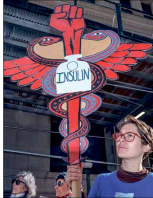
دعم لمرض السكري في نيويورك