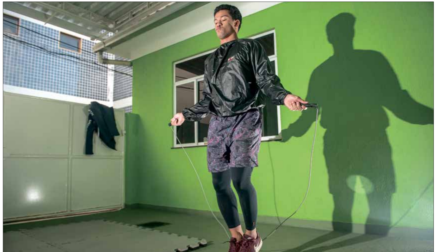
برازيلي يحصك على الأسوليت كلك أداء الرياضة

(العربي الجديد) (المصدر: فرانس برس، Getty)