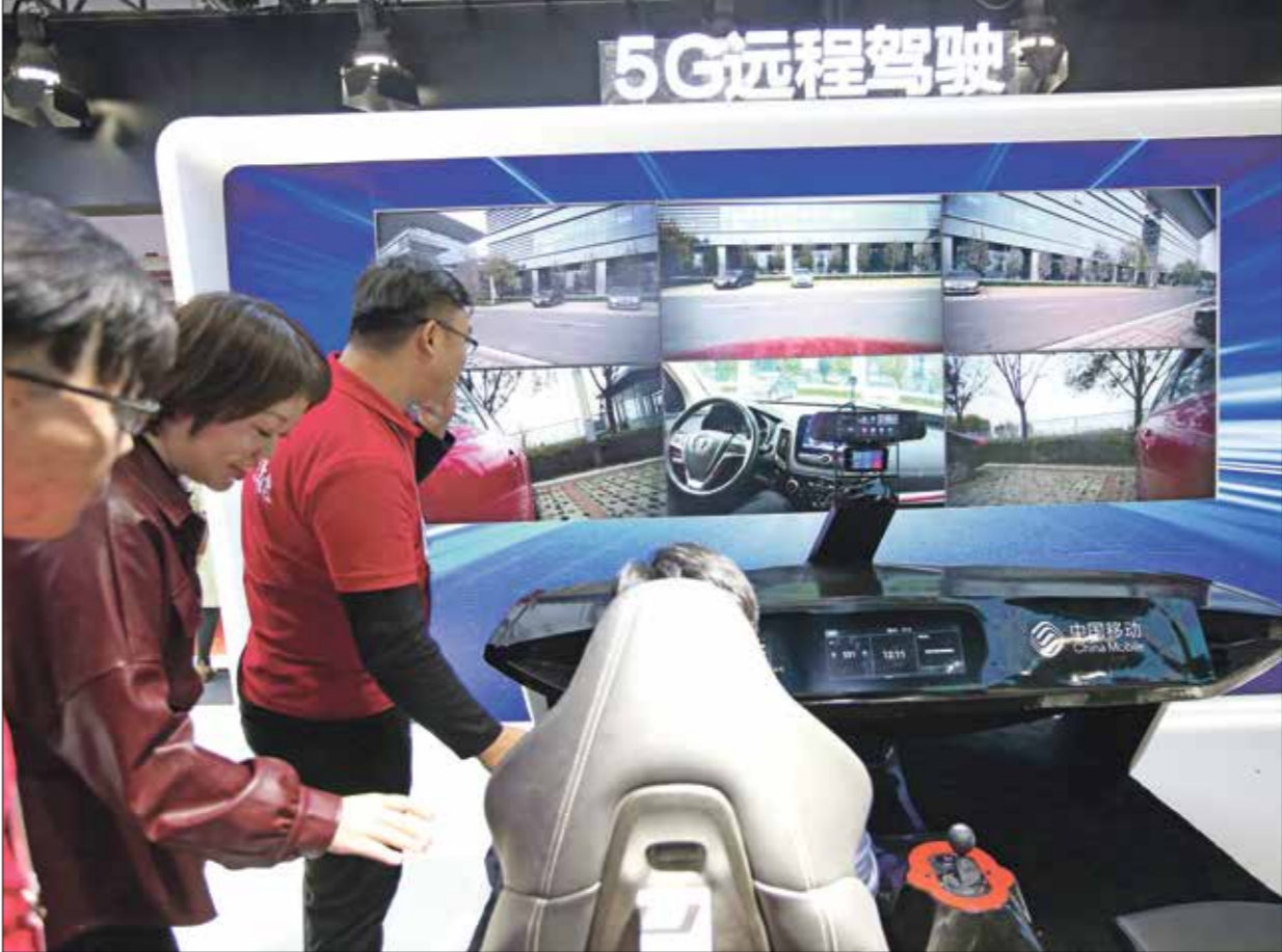
جيل الاتصالات الخامس 5G من أبرز مقومات وصل المركبات بشبكة الإنترنت

ويمكن اعتبار اتصال البنية التحتية بالبنية التحتية من خلال البنية التحتية للإنترنت (IoT) المتصلة بالمركبات إلى خلق فرصة للشركات لإرسال إعلانات مستهدفة إلى الركبات التي تسافر في المنطقة الجارية، كما يمكن تخصيص الإعلانات لكل شخص في السيارة، بما يسمح، مثلا، للمطاعم في خدمة أخصه ومنتجات في شارع رئيسي بإرسال عروض مستهدفة لكل شخص في سيارة قريبة بناء على ملف تعريف المستهلك الشخصي.