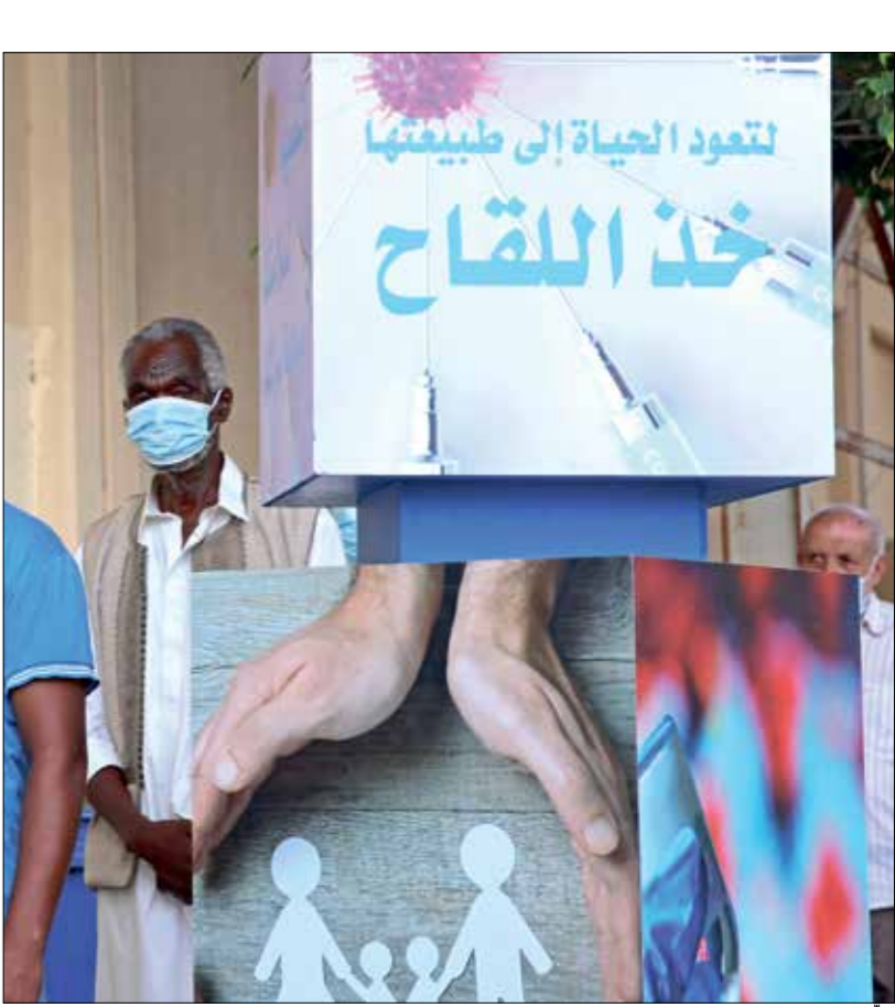
كانت المنطحات حملات التطعيم ضد الفيروس

المسجلة أسبوعيا، وأوضاع التقدير أن وضع الوباء في ليبيا ما زال بحسب التصنيف العالمي في حالة «الانتشار المجتمعي» على الرغم من ذلك، فإن استقرار تسجيل