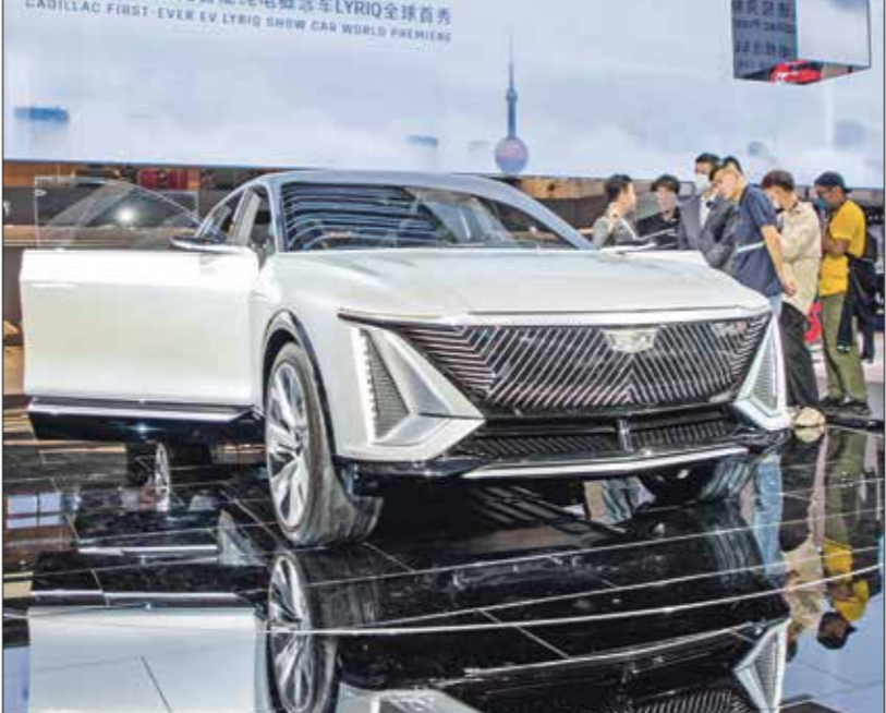
«كاديلاك ليريك» الكهربائية محطاة برواد «معرض شعهايم الدولي» في دبي، إماراتالبحرينالعربي

ويمكن اعتبار اتصال البنية التحتية بالبنية التحتية من خلال البنية التحتية للإنترنت (IoT) المتصلة بالمركبات إلى خلق فرصة للشركات لإرسال إعلانات مستهدفة إلى الركبات التي تسافر في المنطقة الجارية، كما يمكن تخصيص الإعلانات لكل شخص في السيارة، بما يسمح، مثلا، للمطاعم في خدمة أخصه ومنتجات في شارع رئيسي بإرسال عروض مستهدفة لكل شخص في سيارة قريبة بناء على ملف تعريف المستهلك الشخصي.