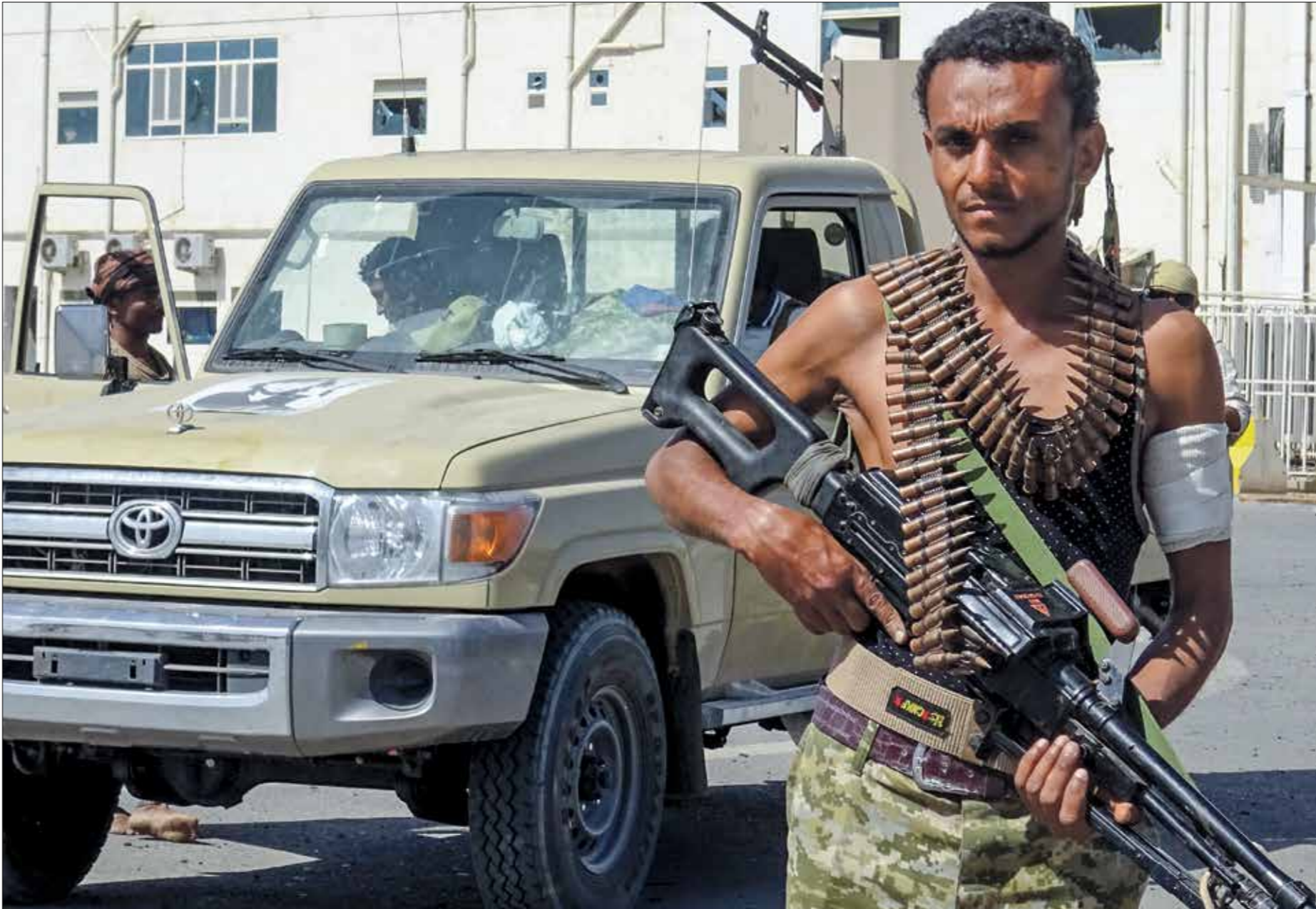
تضم القوات المشاركة قوات تابعة للحكومة

عبر «تويتر»، أول من أمس، ما حدث بأنه «خلاء للمناطق التي يحكمها اتفاق استوكهولم في محيط مدينة الحديدة»، مضيفاً أن الخطوة «جاءت لتصحح مسار العمليات العسكرية ولتزيل القيود من مهام القوات المشتركة، وتحزرها من سيطرة اتفاق السويد الذي عطل كل إمكانياتها المتكررة لكافة الأطراف الحريصة فعلاً على إلى أن قيادة القوات المشتركة «أخذت قراراً بإعادة الانتشار، في وقت تنقل فيه الخيارات العسكرية للشرعية، وسيكون له تأثيرات واضحة وفعالة لإستعادها». وأشار إلى أن قرار إعادة الانتشار «جاء لتلافي الأخطاء السياسية التي شابته بنود اتفاق