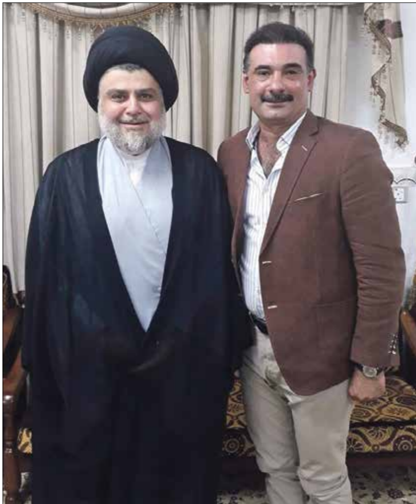
الممثل سنان العزاوي أعلن مناصرته لناب الصديري وزعيمه (يساراً)

إنه «بعد بلقي أي عروض فنية للتمثيل، بسبب مواقفه السياسية وتأييد لنشاط الصديريين السياسي»، وإضافة إلى العزاوي، هناك الممثلة العراقية عواطف السلطان التي بدأت نشاطها الفني الأول من أغنيات بدح الرئيس الراحل صدام حسين، خلال الحرب العراقية الإيرانية (1980 ـ 1988)، لكنها حالياً تمارس نشاطاً دفاعياً عن فصائل «الحشد الشعبي». ظهرت سابقاً في مقطع فيديو وهي تنكي بعد مقتل الجنرال الإيراني قاسم سليماني والقيادي في «الحشد الشعبي» أبو مهدي المهندس، عقب استهدافهما بغارة أميركية مطلع عام 2020.