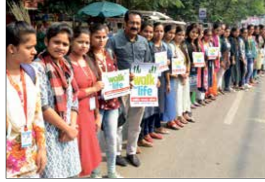
حملة في الهند حول مرض السكري ما قبل تشخيص كورونا