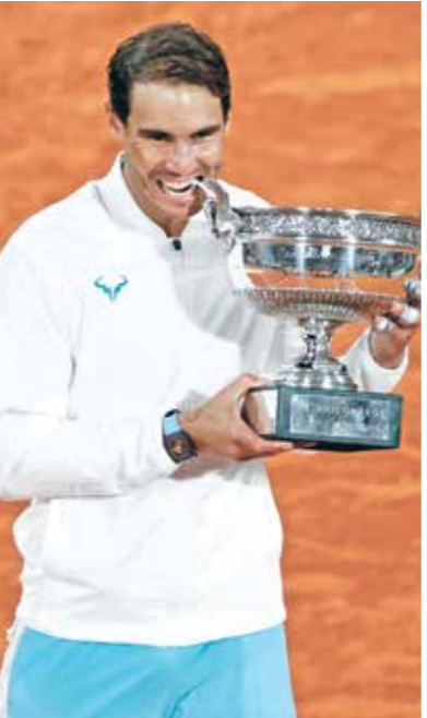
نادال أكثر من حصف لقب رولان غاروس

استطاع النجم السويسري روجر فيديرر تحقيق لقب بطولة فرنسا المفتوحة بمناسبة واحدة عام 2009 حين تفوق في النهائي على السويدي روين سوديرلينغ. خيبة فيديرير في رولان غاروس كانت