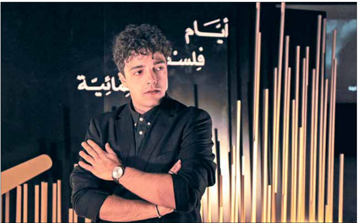
«العربيع» لمرح فخر الجديت يملكه سلطنت (يساراً)

يؤمنون قولها من دون أن يمتلكوا أدوات التغيير»، كما أوضح عوش في تصريحات إعلامية سابقة. أما فلسطين فأختارت لتمثيلها فيلم «كفرناحوم» ويقع فريسة كان فيلمها «كفرناحوم» والعصايات الغاشية المطارة للمهاجرين، ويعد نفسه وحيداً في غاية شاسعة لا نهاية لها.