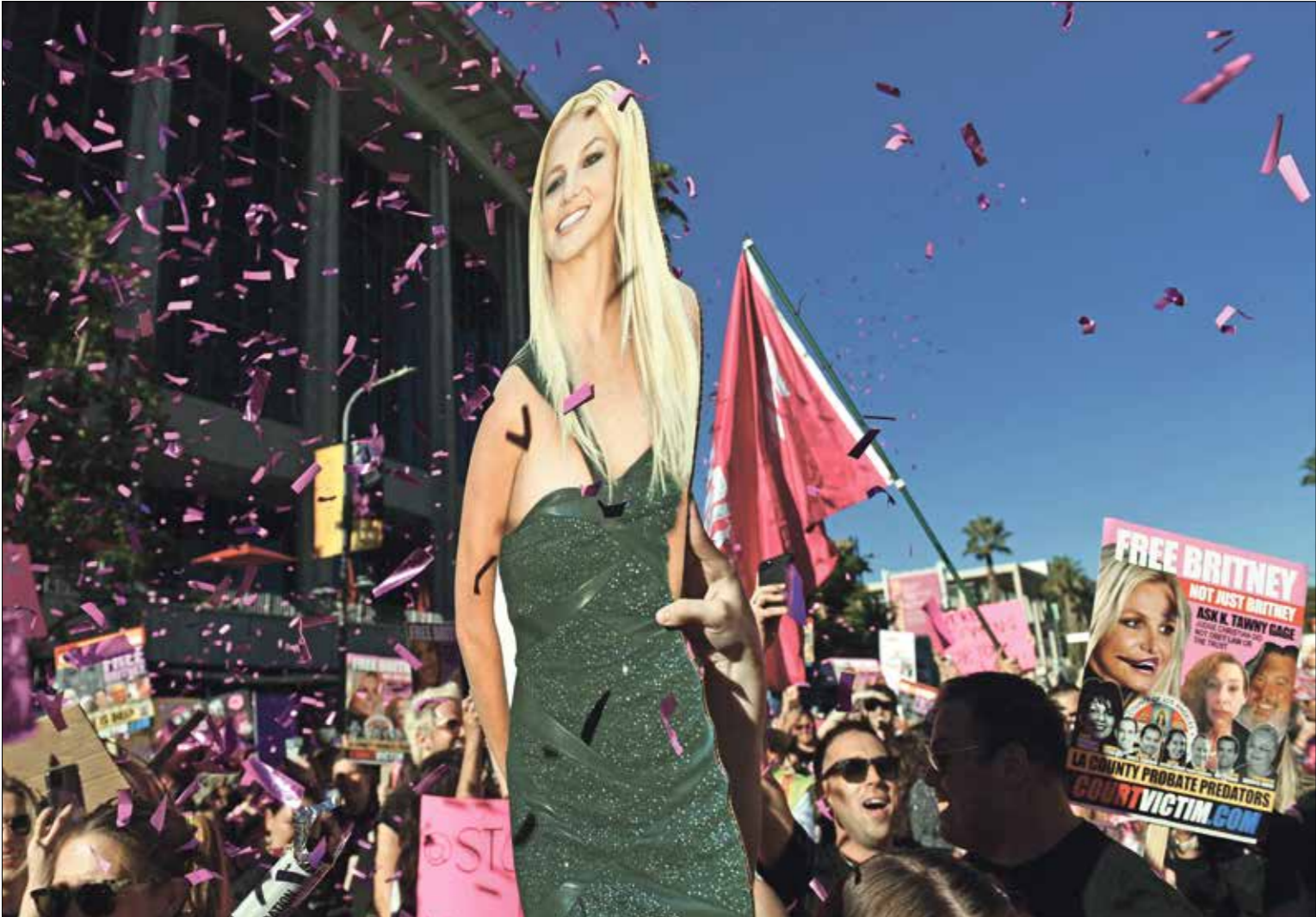
بريتنى سبيرز، حَزَنَ 13 سنة، ووضَحَ الكَلِمَةَ «أَرادته أنْ» «تأول/تفارس برين»