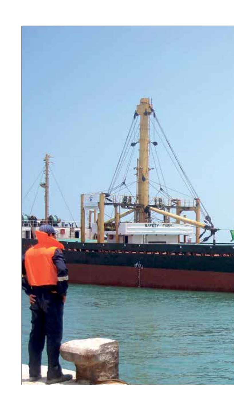
توسيع ميناء العريش على حساب المواطنين

المصرية أخذت بيتي لتوسيع الميناء، في حين أن الصحراء واسعة يا حضرة الرئيس»، وينقل القرار الجديد تبعية ميناء العريش إلى الجيش، ويخصص الأراضي المحيطة به اللازمة لتنفيذ أعمال التطوير إلى القوات المسلحة، ضمن إجمالي مساحة 541,82 فدانا (الفدان يعادل 4200 متر)، وقد استبدل فيه السيسي قرارا سابقا صدره عام 2019، وذلك في إطار توسيع النفوذ الاقتصادي للجييش المصري، وأوضح القرار الذي نشر حينها في الجريدة الرسمية لرتئاسة