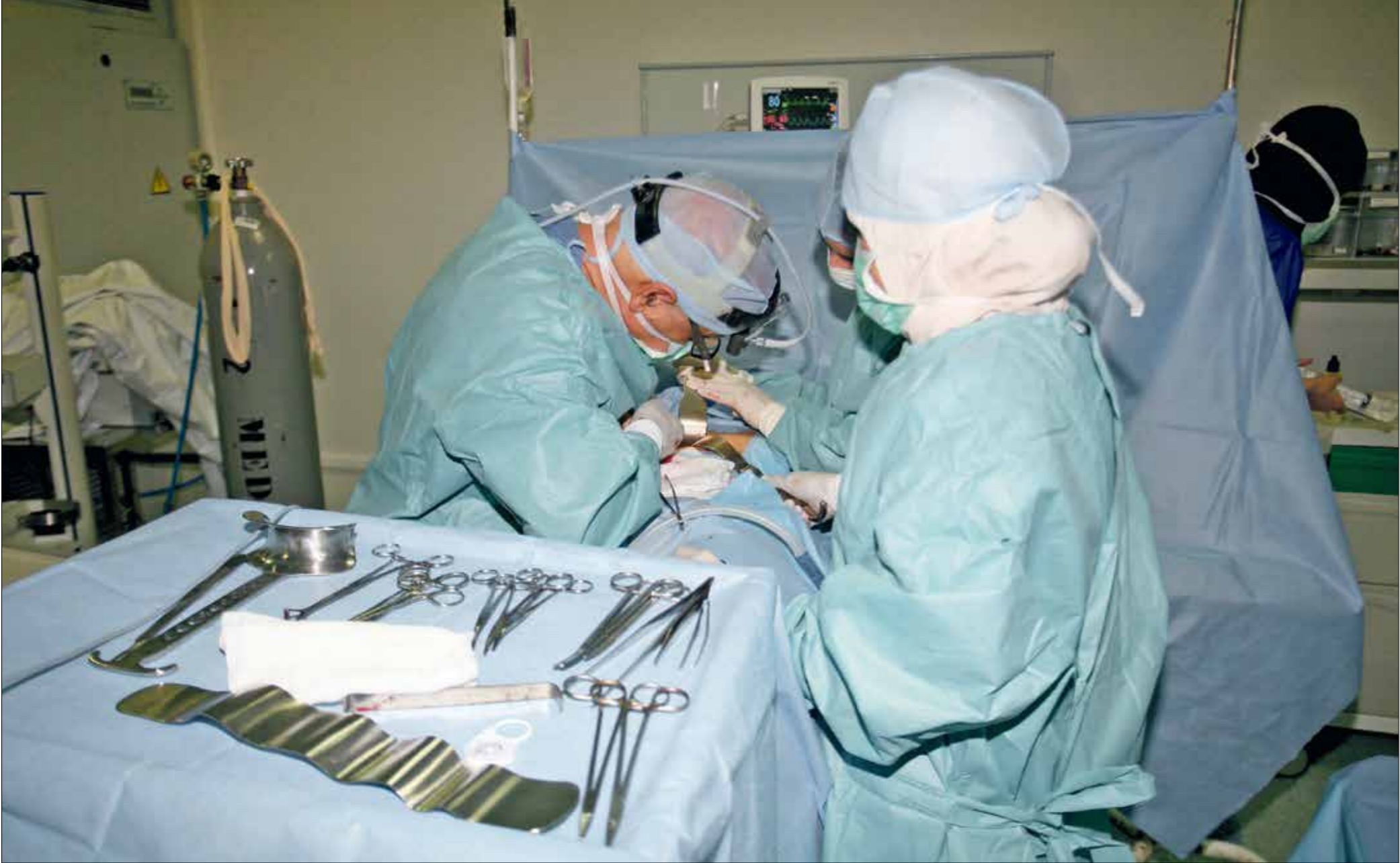
لريفك الدفعة في قطاع الصحة يتفاهم معاناة الجزائريين «الربيع الحرج» (الحج)

كشف تفشي فيروس كورونا، عن مشاكل بنيوية في النظام الصحي بالجزائر، إذ توقفت عمليات زرع الكبد لأسباب متنوعة من بينها عدم إمكانية حضور مختصين من الخارج، بينما لم يتم تكوين العدد الكافي من الأطباء في ظل هجرتهم للخارج