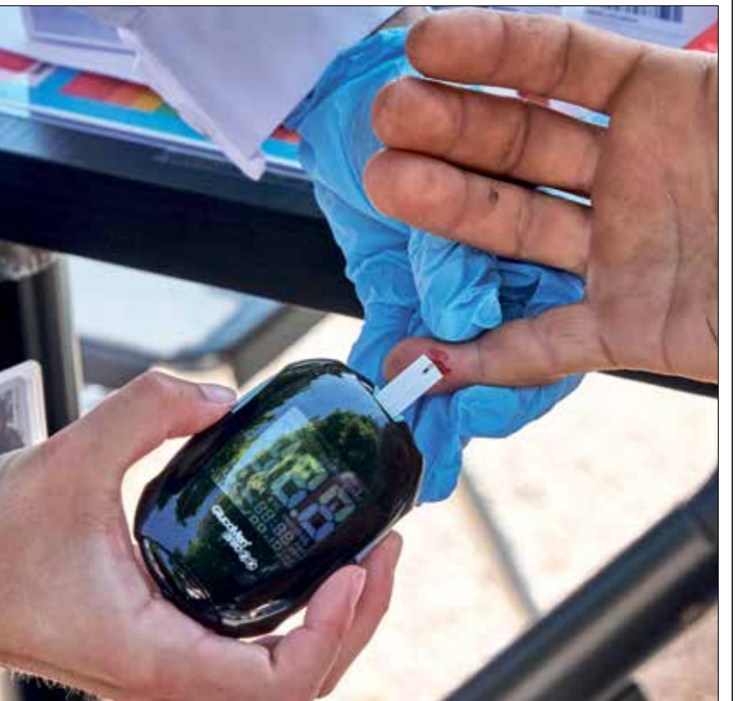
برتهالي يحصك نسبة الغلوكوز لديه