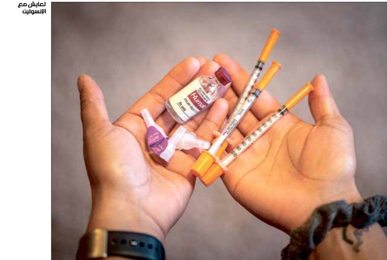
تصاليب مع الأسوليت