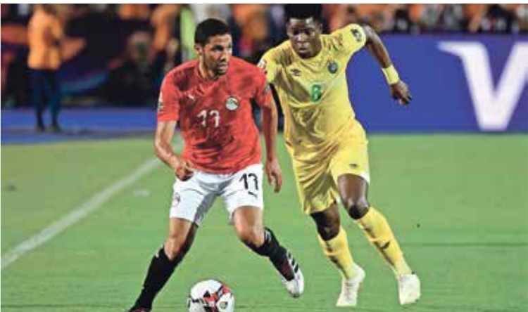
يلعب منتخب مصر الدور الحاسم من التصفيات

وسجل رباعية الجزائر كل من يوسف بلابلي، وسعيد بن رحمة، وسفيان فيغولي وإسلام سليماني ليصل الرصيد