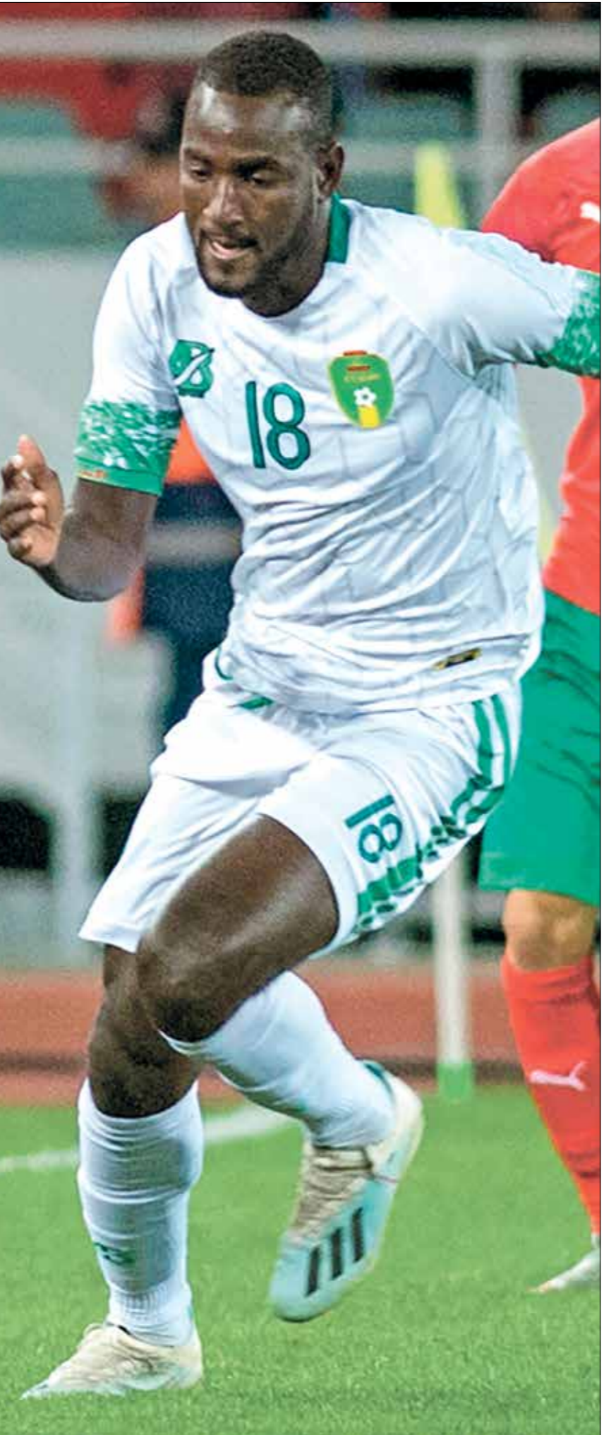
يواصل منتخب مصر تحطيف السالاج الراضة

وعانى الفريق المصري من غياب صانع الألعاب الحقيقي الفادر على منح صلاح الفرص السليمة. ولم يحدث تعاون مطلقاً، بينه وبين محمد شريف ومصطفى محمد شريكه في الهجوم، بطريقة 3-4-3، وكذلك تعرض أرقامه لتصفية من دفاع