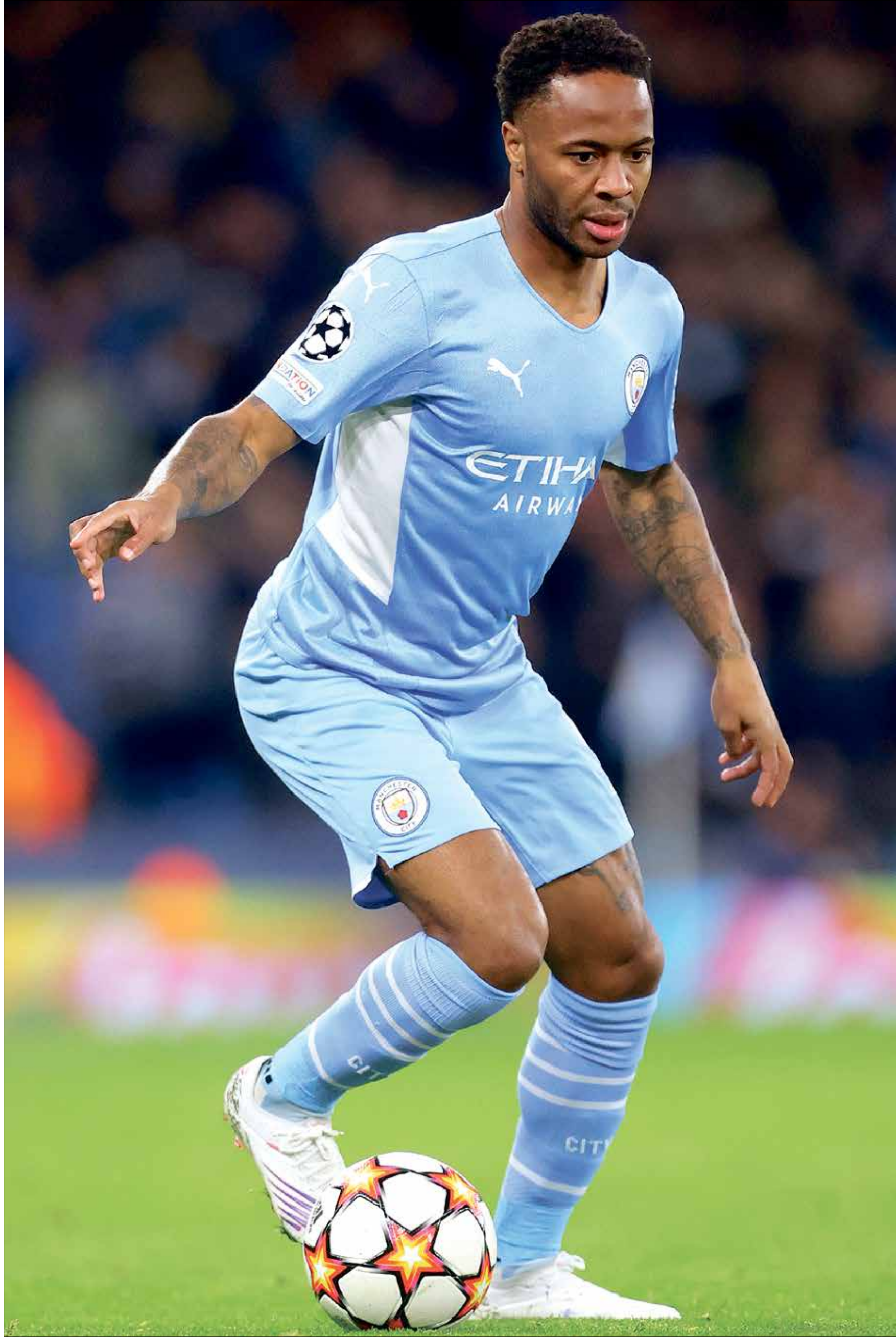
هل يُغادر ستيرلينغ بعد سنوات مُميزة مع «سيتي»؟

كشفت تقارير من الصحف البريطانية ان الجناح الإنكليزي رحيم ستيرلينغ يفكر في مغادرة فريق مانشستر سيتي في سوق الانتقالات الشتوية القادمة، ومن المتوقع ان تكون وجهته فريق برشلونة الإسباني وفقاً لما نوهت به صحيفة «سبورت» الكتلونية، خصوصاً ان المدرب الجديد تشافي لم يعارض فكرة التعاقد معه.