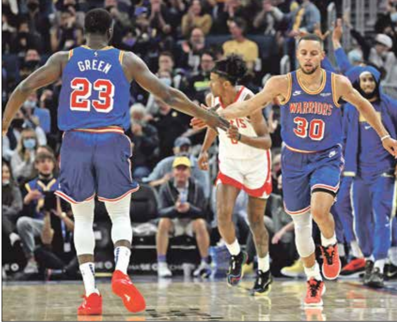
عوادة ستايت ووريزز... تلقى اللات موحرا

فريقه السابق مينيسوتا تمبروولفز يشكل مصدر قوة ووريزز، لكن كبر لم يكتس القدرات الفردية للاعبيه، ما سمح لهم بالتعجير عن مهاراتهم باستعراض هجومي، على غرار الضميرة التي قام بها كوري ضد تمبروولفز إلى نظيره غاري تاونز. صحیح ان الأداء الجماعي ما زال