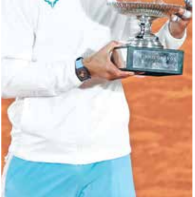
نادال أكثر من يحض لقب رولان غاروس

استطاع النجم السويسري روجر فيدريو تحقيق لقب بطولة فرنسا المفتوحة بمناسبة واحدة عام 2009 حين تفوق في النهائي على السويدي روين سوديرلينغ، خيبة فيدريبر في رولان غاروس كانت