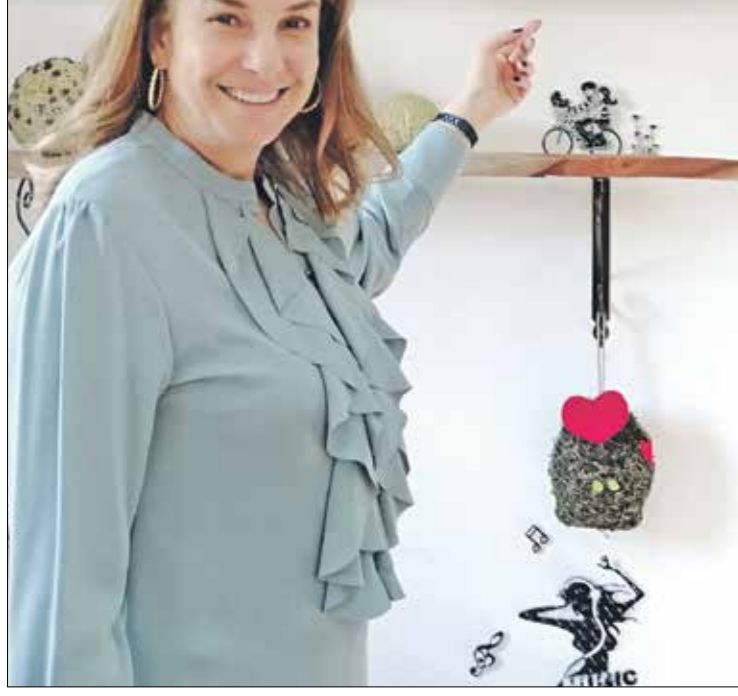
مبردا بيضاوي تعرض (أحد لوحاتها (العربي الجديد)

وتزويج زوج مثلت الشباب، وبحسب المودة»، الذي قدم مساعدات مالية لتأمين وترتيب زواج مثلت الشباب، وبحسب البرنامج، فإن قاعدة بياناته توفرت دعم 4500 مغفل على الزواج، جرى دعم أكثر من نصفهم بالتنسيق مع وزارتي الشؤون الاجتماعية والحكم المحلي.