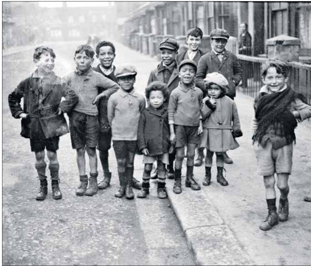
جرب توثيق شهادات هؤلاء الأبناء الذين أصبحوا في السبعينيات من أعمارهم الآن (المتحف المختلط)

ولا يزال تقرير «فليتشر» سيئ السمعة لعام 1930، الذي وصف الأزواج المختلطين في ليفربول وأبناءهم بلغة عنصرية وتحريضية، حاضراً في تاريخ العنصرية، حيث لمح فيه إلى «بيوت الدعارة»