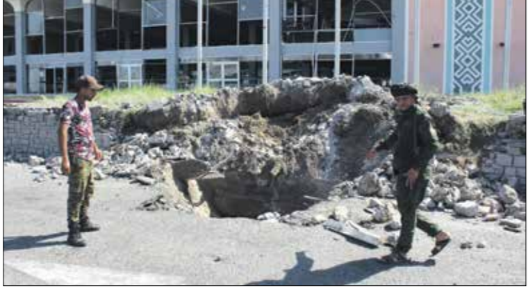
اسرار الهجوم عة 28 شباط واكلر مع 100 جريح

جددت الحكومة اليمنية، امس الخميس، اتهام الحوثيين بالوقوف وراء الهجوم على مطار عدن الدولي، بالتزامن مع وصول طائرة الحكومة اليمنية الجديدة من العاصمة صنعة.