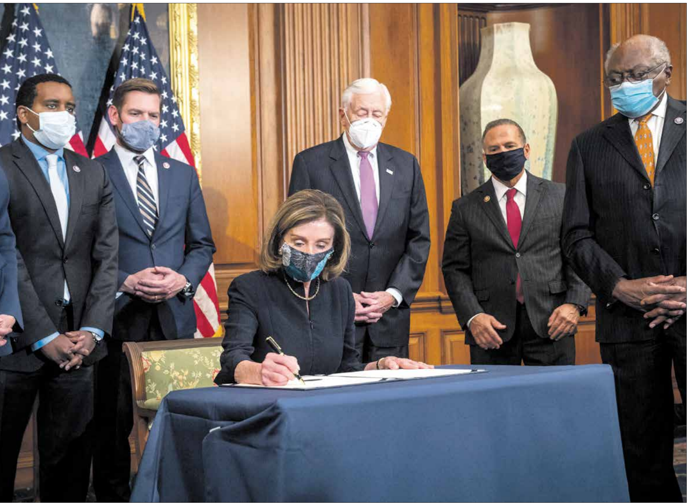
رئيسة مجلس النواب اميركية، بيلوسي، الماء لوضفها على وثيقة عزله يوم الأربعاء

الرئيس المنتخب بايدن». وتجدد أسواق المال تاريخيا أن يكون الكونغرس منقسما بين الحزبين حتى لتسفيد من الخلافات في تحرير أجندتها المالية مستفيدة من الخلافات بين أن ترامب سبق أن أعلن عن نيته الترشح مرة أخرى لمنصب الرئاسة الأميركية في الدورة الانتخابية المقبلة، وهذه ليست المرة الأولى التي تجاهل فيها أسواق المال عزل ترامب فقد سبق أن تجاهلته في العام 2019، خاصة وأن الرئيس الأميركي وعادة ما تقاس على أساسها قوة نفوذ الرئيس وقدرته على إدارة شؤون البلاد والتعامل مع قضايا المال والأقتصاد الملحة التي تشغل بال مجتمع الأعمال والصارف والشركات في الوقت الراهن، وعلى صعيد دعاوى التي تنتظر الرئيس ترامب، ذكرت مجلة «نيويورك» الأميركية في تقرير سابق، أن ترامب نجا خلال فترة