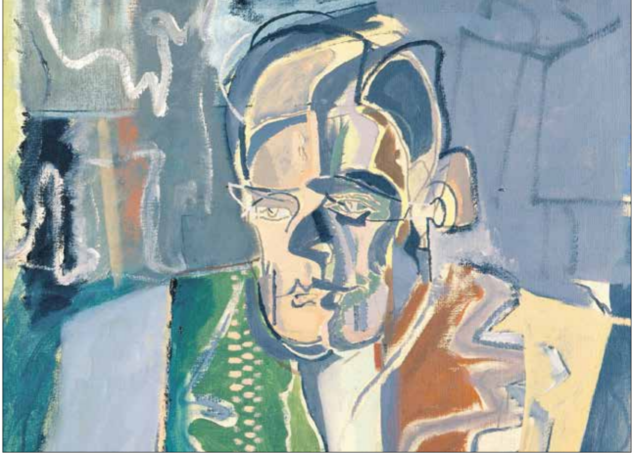
جزء من بورزيره ل.د.ت. س. البيوت، 1949. بارتيك هيرون