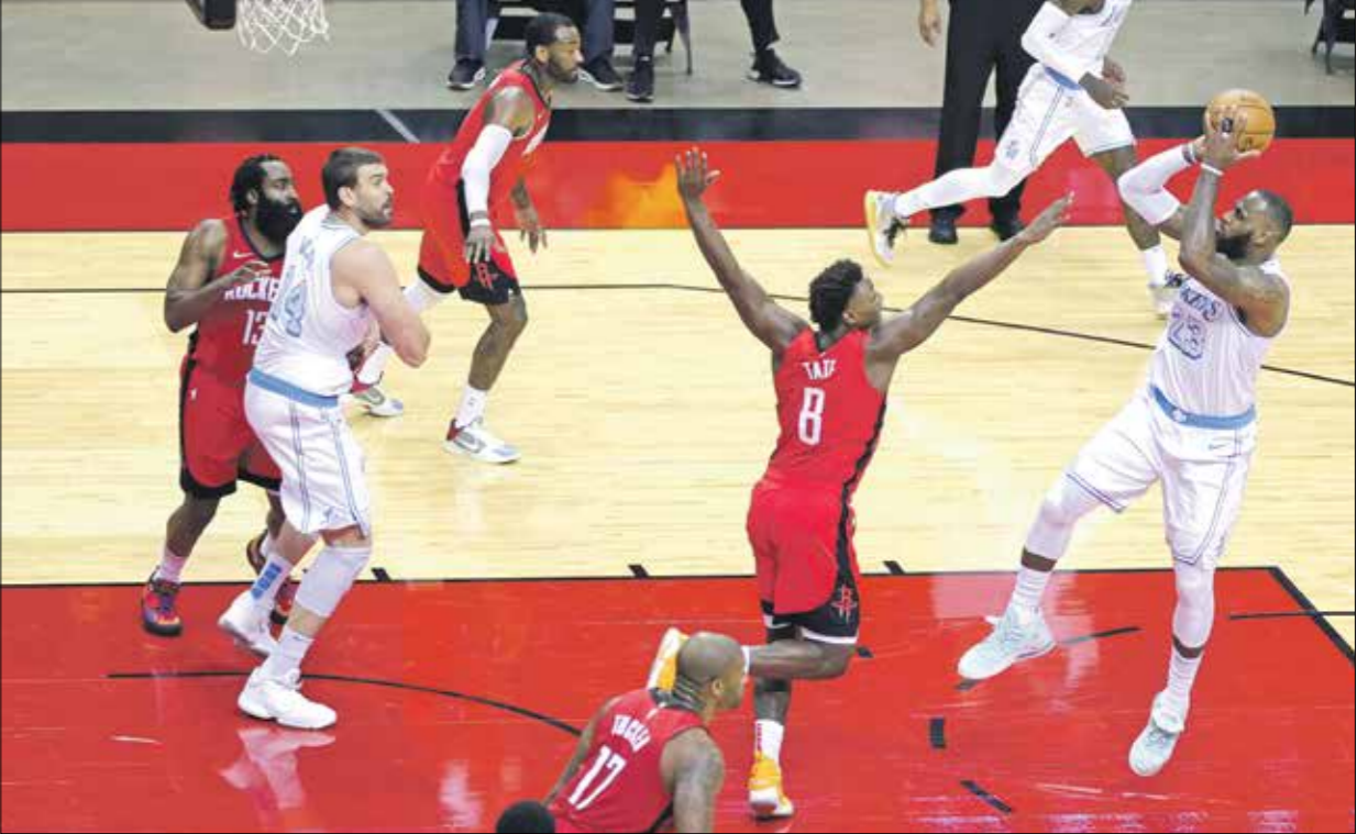
لايكرز يتابع عروضه القوية في السلة الأميركية (Getty)

تابع عروضه القوية في السلة الأميركية (Getty)