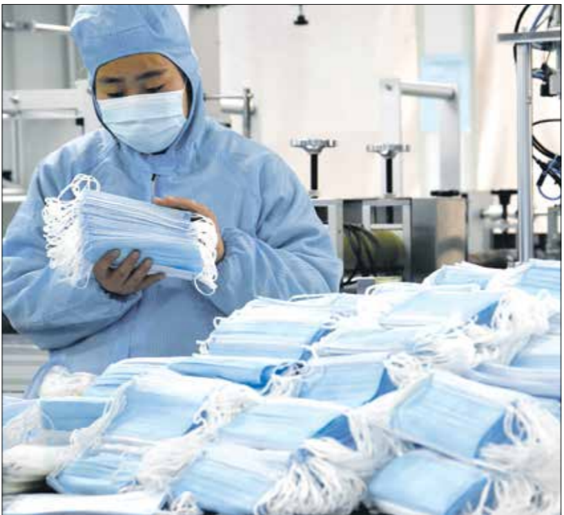
مصنع كمامات طبية في مقاطعة هيبينغ للصين

قالت وكالة فرانس برس، أمس الخميس، إن المبادلات بين البلدين إحدى أولويات التجارة أرتفع بنسبة 7,1%، إلى 317 مليار دولار في العام الماضي، 2020. وتأتي هذه الفجوة التجارية الصينية على الرغم من سياسات الحظر المكثفة التي نفذتها الولايات والشركات والمتحجات الصينية بشأن عقوبات جمركية مشددة على بضائع بقيمة مئات مليارات الدولارات، الذي جعل من إعادة التوازن إلى المبادلات بين البلدين إحدى أولويات سياساته المالية والاقتصادية. ويأشر ترامب في العام 2018 حربا تجارية على الصين، متتهما الدولة الآسيوية العملاقة بممارسة منافسة «غير نزيهة»، وتضمنت هذه الحرب تدابير عقابية في فرض رسوم جمركية مشددة على بضائع بقيمة مئات مليارات الدولارات،