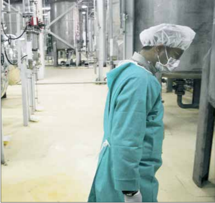
لرحلة إيران احتفالاً حول الناج اليورانيوم في مصنع بإصفهان