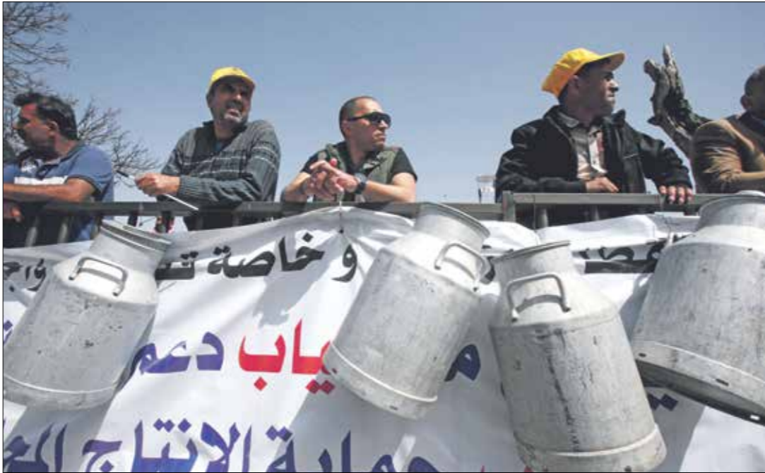
مشهد من احتجاج المزارعين على زيادة الضرائب العام البرلمان في 2018