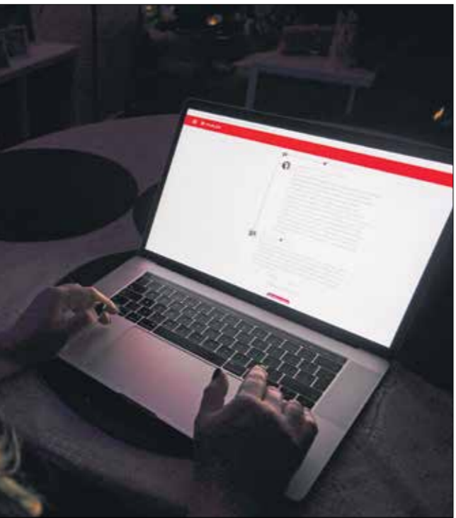
اصطر تطبيق، «بارلر»، المعطش لمناصري ترامب، للوقوف عب العنف (Gerty)

تطبيق «بارلر» من متجر التطبيقات الخاص بها يوم السبت. برز متحدت باسم شركة «ابل» للقرار بان التطبيق لم يلزم تعديل وزالة المحتوى الضار أو الخطير الذي يشجع على العنف والنشاط غير القانوني، ولا يحتفل لإرشادات مراجعة متجر التطبيقات.