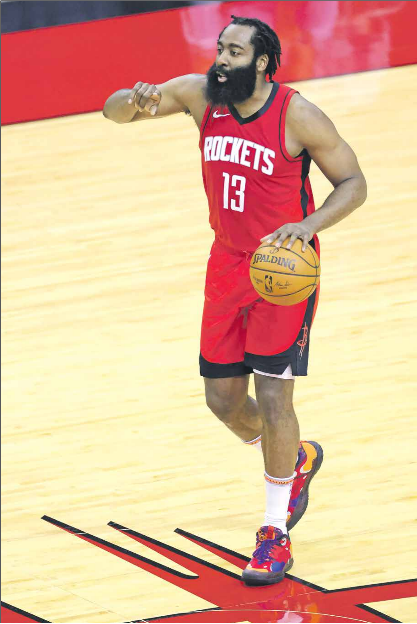
جيمس هاردن يبدأ رحلة جديدة في الدوري الأميركي