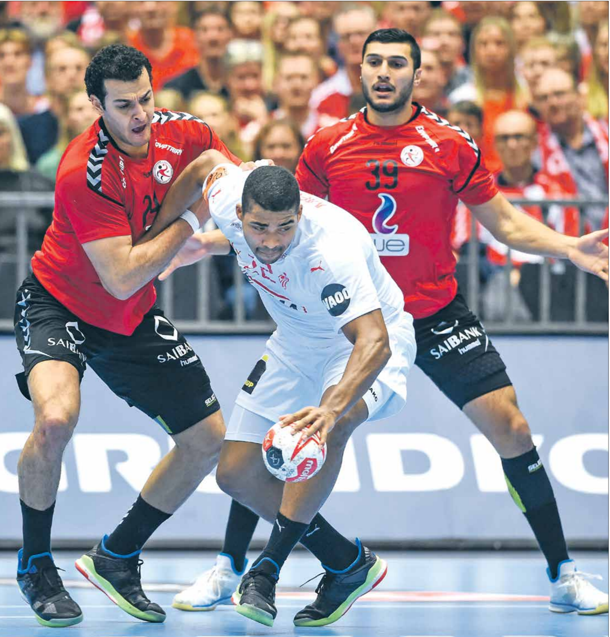
فحم منتخب «الفرانعة» عرضاً هجوماً

ينطلق مشوار المنتخب القطري في مونديال اليد اليوم بمباراة في المتأهل ضد منتخب انغولا المتواضع، وتملك قطر فرصة كبيرة لتحطيم رول انتصار في البطولة العالمية، كما ويلهذه نفس اليوم مباريات عديدة ستجمع بين الأرجنتين وكونغو الديمقراطية، ويواجه المنتخب الألماني نظيره النرويجي، في حين يلعب المنتخب البرازيلي مباراة قوية ضد منتخب إسبانيا وتواجه كرواتيا منتخب اليابان، أما المجر فتلعب مع منتخب الراس الأخضر.