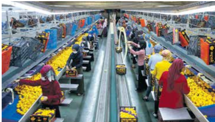
مصنع فوكس في مدينة (إزير التركية)

علت «متخلفة التعاون الاقتصادي والتنمية»، توقعاتها إيجابيا بشأن مقار الأزمات في الاقتصاد التركي لعام 2020، من 1,3 إلى 0,2 بالمائة. وأوضحته المنظمة في تقرير، أمس الخميس، أن الاقتصاد التركي شهد تعافيا قويا بعد الموجة الأولى من جائحة كورونا، وأضافت أن التوقعات تشير إلى انكماش الاقتصاد التركي بنسبة 0,2 بالمائة في 2020، بدلا من المتوقع سابقا بنسبة 1,3 بالمائة. كما توقع التقرير، بلوغ معدل النمو في الاقتصاد التركي 2,6 بالمائة في 2021، و3,5 بالمائة في 2022. ويشأن البطالة، توقعته المنظمة بلوغ المعدل 13,7 بالمائة في 2021، و14,5 بالمائة في 2022. وأشادت التقرير بالبنية