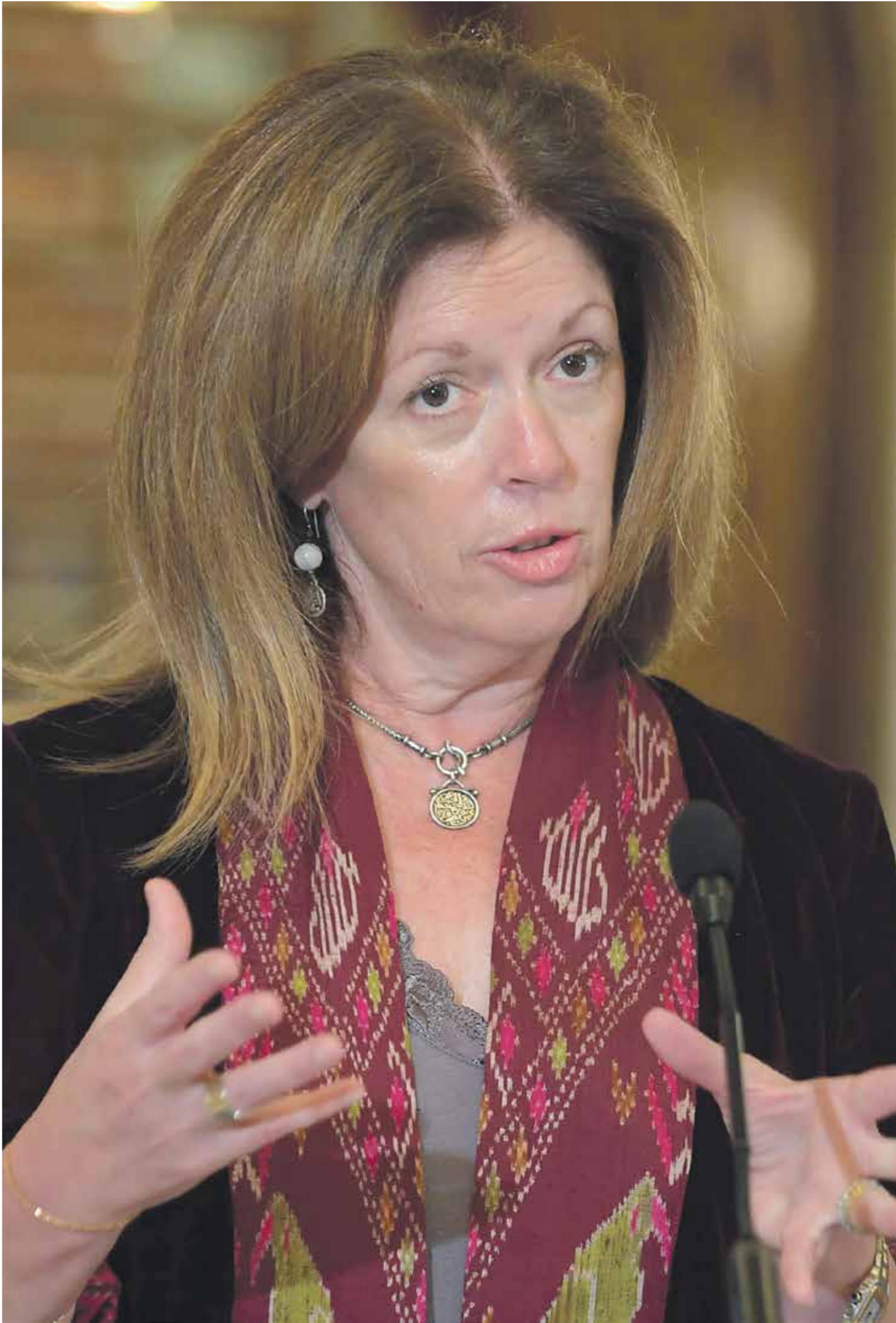
ووليامز، لربما الوقت ليس ممكنا بعد الآن لتخليص لخيرطراس برنس

وتحت إشراف وزير الدفاع في حكومة الوفاق صالح الدين التمرنوش، تحفظته على العملية الأمنية التي يعزّم باشاغًا إيطاليًا لدى الجرائح حتى يترجمها مهربي الوفود، والبشر والسحلن الخارجيين على القانون، وقال التمرنوش، في تصريح لتلفزيون الإييطالية.