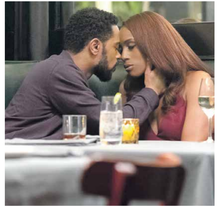
«صورة» رومانسية أو ارتباط عاقلات؟ (الملف الصحفي للشيخ)

يعرض الفيلم صوراَ جنين السيرة الشخصية للمصورة فيه صُور ورقية