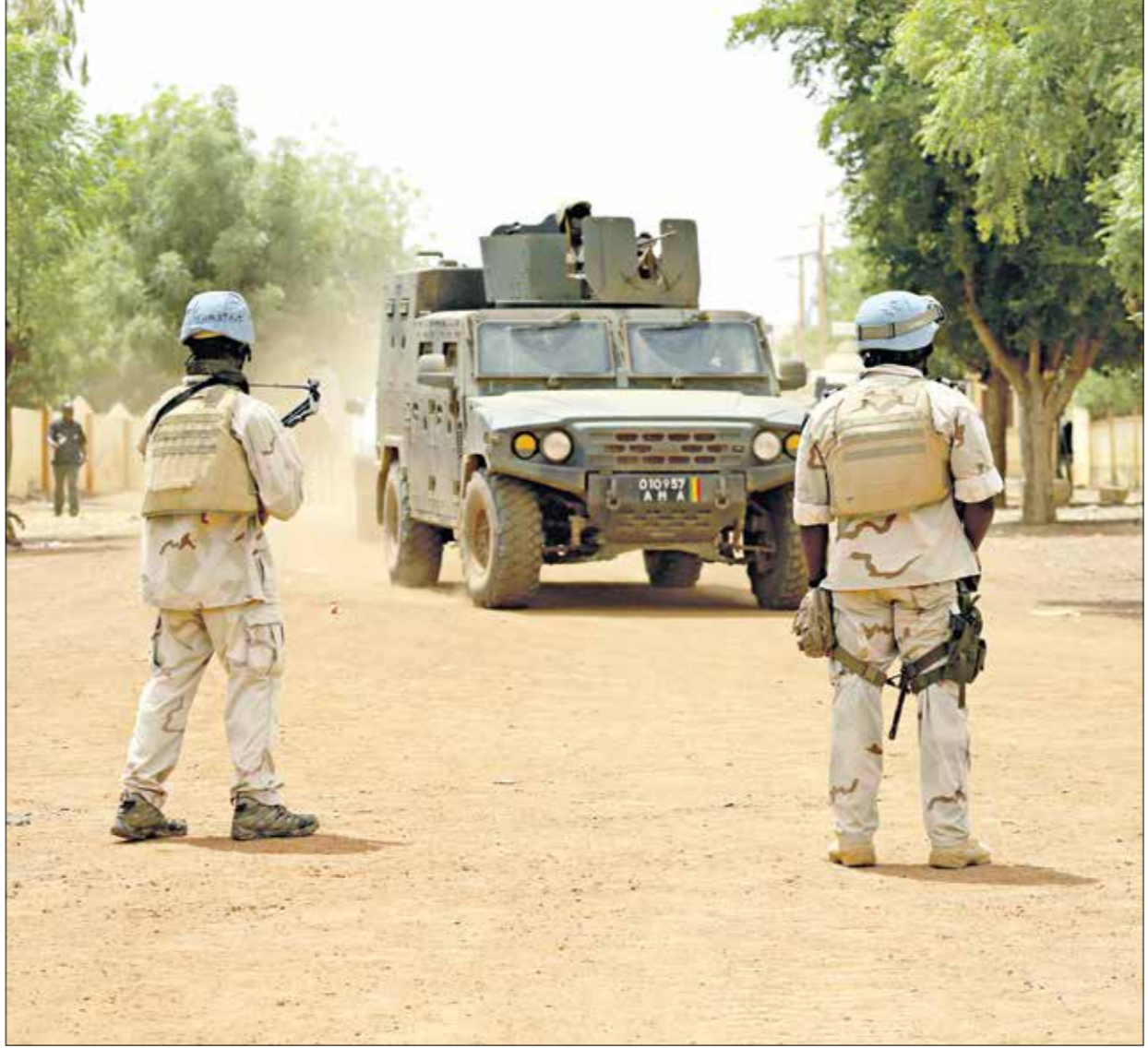
تجمع «مينوسوما» الـ 12 الف عسكري

ونكرت بعثة حفظ السلام التابعة للأمم المتحدة في مالي (مينوسوما)، في بيان أمس الخميس، أن مركبة لقوات حفظ السلام اصطدمت بعمود أسفلة، ثم تعرض الجنود لهجوم شنته مسلحون مجهولون في منطقة تمبوكتو، وعلّقت أن الانفجار والهجوم وقعوا خلال عملية أمنية على طول محور دوينتزا وتمبوكتو، على بعد 20 كيلومتراً شمالي مدينة بامابارا ماودي، وأضاف أن المهاجمين فروا من المكان بعد الهجوم، ونشطت في المنطقة جماعات تنبئ