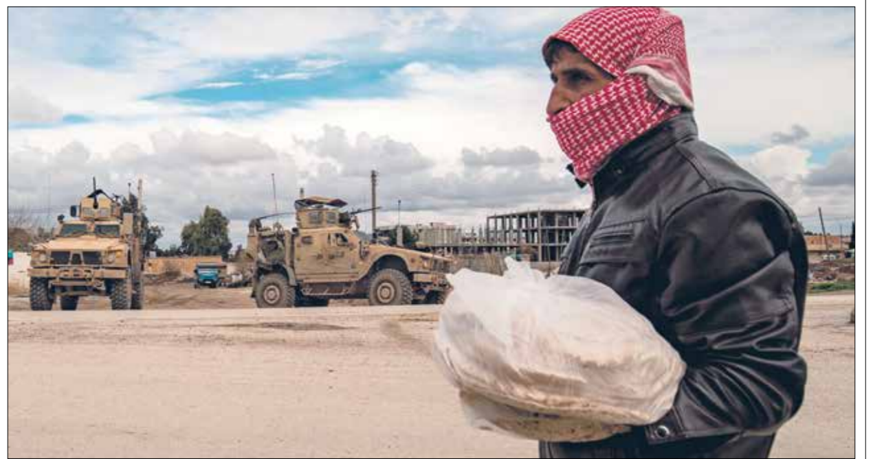
ارتفاع أسعار البقالة بنسبة 100%

حاجات الأسرة المؤلفة من خمسة أشخاص من الغداء فقط بنحو 376500 ليرة، موزعة على مكونات الغداء اليومي الضرورية لكل فرد، مع إضافة الزيت والمشروبات للعام الماضي، إلى 732 ألف ليرة حاليا، وفق مؤشرات «مركز قاسيون» في العاصمة دمشق، بعد تراجع سعر صرف الليرة مقابل الدولار، من 2270 ليرة مطلع أكتوبر/ تشرين الأول من عام 2020 إلى نحو 2900 ليرة حاليا في السوق السوداء. ويشير المركز السوري إلى أن معدل تكاليف المعيشة ارتفعت بنسبة 11% خلال الأشهر الثلاثة الأخيرة، وهي تكاليف سلة إنفاق الأسرة المكونة من خمسة أشخاص على الصناعات الأساسية «الغذاء، والسكن، والصحة والتعليم، والأثاث، والنقل والاتصالات»، مبيّنا أن تكاليف الغذاء والمشروبات الأساسية ارتفعت بمقدار الخمس، بين سبتمبر/أيلول 2020 ومطلع يناير/كانون الثاني الجاري وأصبحت