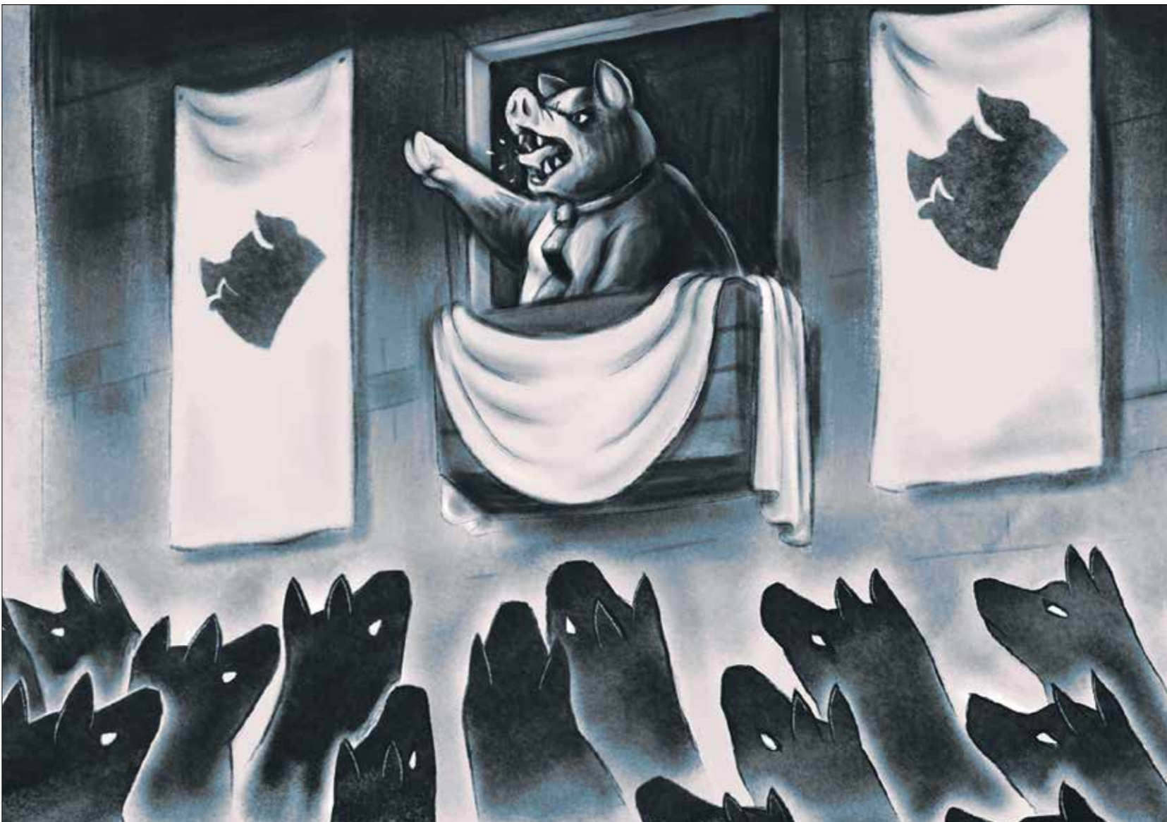
لثالث اللعبة بالكليسيات والصور النمطية المتعلقة بالحيوانات (فيسبوك)

صون قوانين المزرعة لا يحدث ذاك الفارق الجوهري دائما