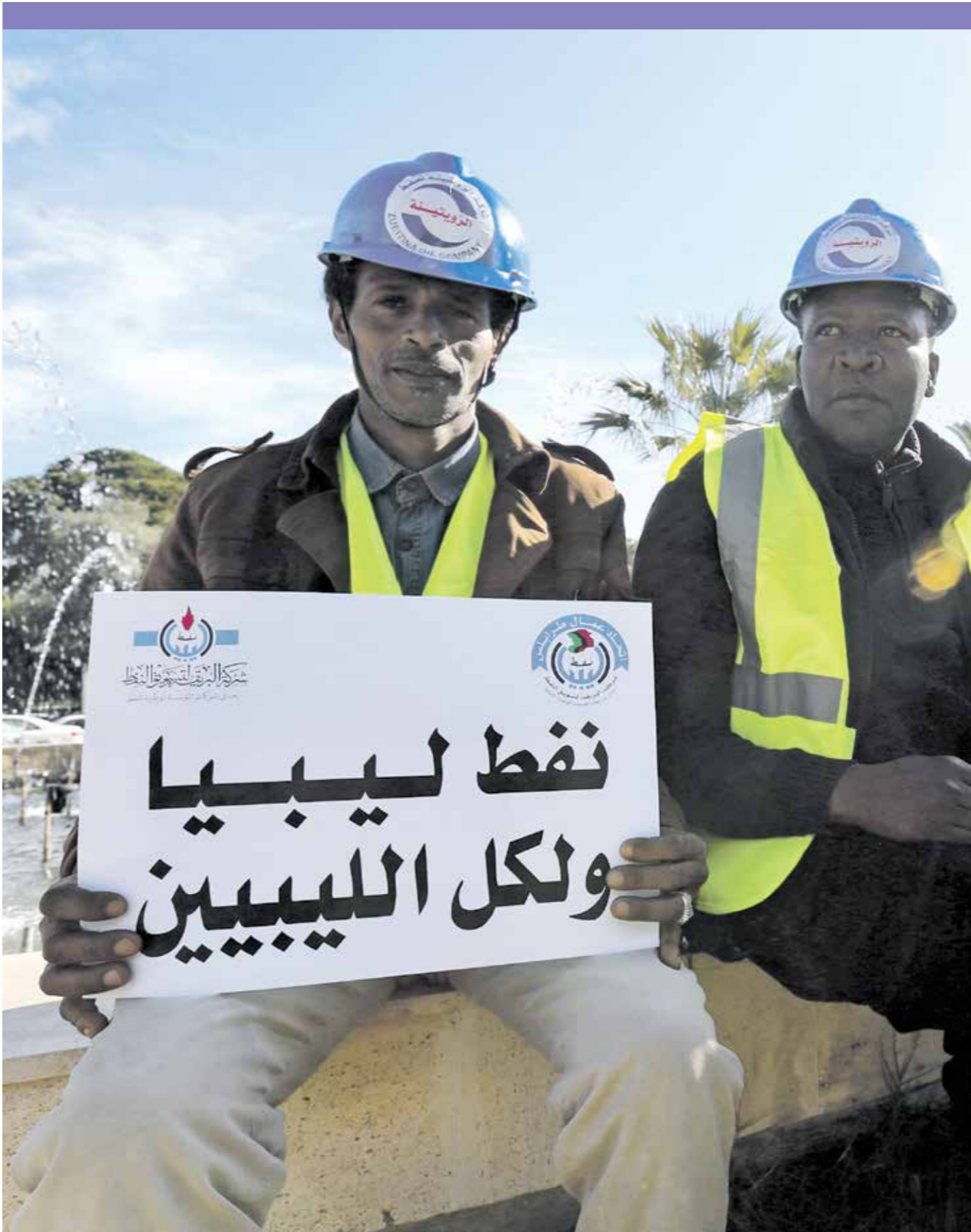
إيرادات النفط لعمود نحو 95% من الميزانية العامة للدولة

وتبدأ السنة المالية في ليبيا في أول يناير/ كانون الثاني وتنتهي في 31 ديسمبر/ كانون الأول من كل عام. ويأتي ذلك، بعد نحو خمس سنوات من الصراعات العسكرية والانقسام السياسي والمالي، الأمر الذي أدى إلى توزيع الإنفاق العام بين حكومة الوفاق الوطني في العاصمة طرابلس المحترق بها دوماً، والحكومة المؤقتة في شرق البلاد، مما نتج عن هذا الانقسام وجود أسعار صرف مختلفة في مناطق متعددة، وبلغ الدين العام 130 مليار دينار وعرّض النفوذ خارج القطاع المصرفي وصل إلى 55 مليار دينار. وأوضح بيان لوزارة المالية المقترحة.