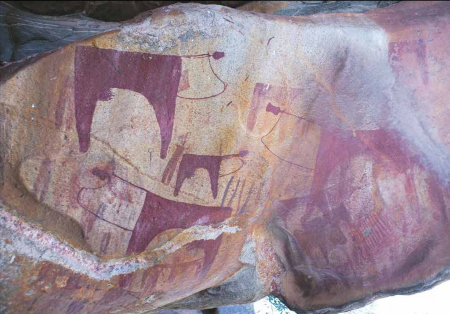
عرف سكان غرب افريقيا في العصر الحجري كيفية اختيار الحجر الجيد لصنع ادواتهم

من جهة أخرى، في دراسة صدرت العام الماضي، أجرتها جامعة غوتنغن، يقول الباحث ديريك هوفمان: «فعلياً، لم يتفق أي سلوك نفعله نحن الآن في حياتنا الحالية، لم يكن إنسان النياندرتال يفعلها. لا يوجد اختلاف كبير بين هذا الإنسان وبين الإنسان المعاصر الذي بدأ في العصر الحجري». بهذا، يبدو أن الافتراضات السابقة حول إنسان النياندرتال، وخصوصاً الاعتقاد بالغرابة العقلية المنخفضة له، بدأت تسقط واحدة تلو الأخرى، إذ تشير العديد من الأبحاث إلى أن أبناء عمومتنا المقربين كان لديهم نفس الشعور بظاهرة الفن مثلاً، كما هو لدينا.