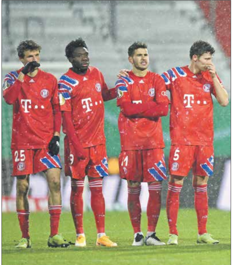
دهوك نجوم «البايرن» بعد الإقصاء الخامس

في المقابل أشرك البرتغالي أندريه فياش بوشاش النجم باييت أساسياً، بعدما جلس على دكة البدلاء في مباراتيه السابقتين في العام الجديد، وفي وقت أبقي على قائم ببيدوتو على قمة البدلاء ونقل فريق العاصمة بكل ثقته نهاية المباراة في محاولة لهز الشباك مبكراً بقيادة إيكاردى وسواطحه أنخل دي ماريا وكينيان مبابي، وقلعها إيكاردى عندما استغل كرة عرضية من مواطنه دي ماريا داخل المنطقة، فتأهبها برأسه ارتدت من الحارس ستيف ماناندلا والقائد الأيسر فتهيات أمامه مجدداً فتأهبها في الشباك (فرائس برس)