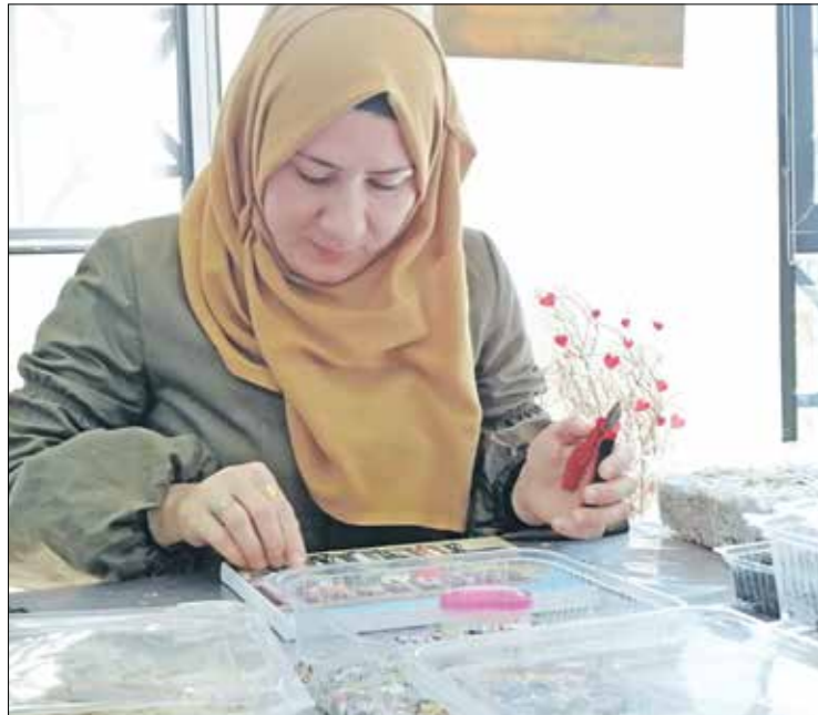
اعملها بنجزها الحترف (العربي الجديد)

أما بخصوص مشروع إعادة التدوير، فقول بيضاوي: «بدأنا بعد زيارتنا للعابرين بالزجاج والسيراميك، فعلمنا منهم أنّ هناك كميات كبيرة من هاتين المادتين تتجه إلى الإتلاف، فاختارنا أن نستخدم منها ونعيد البيطة، فصرنا نستخدمها في عملية تزيين اللوحات، تحديداً تلك التي تخصّص بالترات اللبنانية وبالبيدة اللبنانية وبالآثار اللبنانية، وبعد ذلك قررنا استخدام البلاستيك في التزيين، فذهبنا إلى مصنع معالجة البلاستيك، فأخذنا ما وصل منه مما أنهى مرحلة التفتيت والعقيم، وبما أنّه من فقايا العيوات الفارغة بأشكالها المختلفة، فإنّ المادة التي نأخذها متعددة الألوان». تتابع: «عندما نتجهن البلاستيك هذا، نفرز كل لون على حدة، كما نفرزه على أساس الأحجام المختلفة، أما العمل فيها فيعطي نتائج رائعة، كما نعمل بالسيراميك أيضاً». وعن سبب استخدامها الجلاستيك في الأعمال الفنية تلك، تقول: «السبب الأساسي في عملية إعادة التدوير، تخفيف كمية المخلفات، خصوصاً تلك التي في الوقت تفسد مستفيد منه في عملنا، كما أنّ ربة البيت