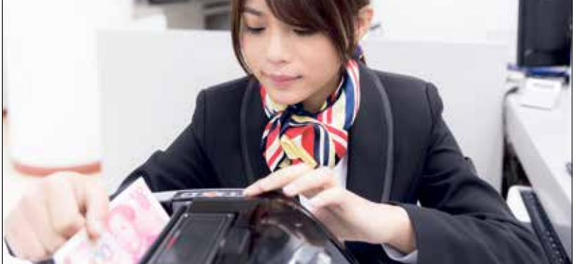
رفع وزن اليوان جاء بناء على تطورات التجارة الصينية عالميا

في 2021 إلى 7,59% من 7,33% والجنينة الياباني إلى 43,38% من 41,73%، فيما خفض وزن اليورو إلى 29,31% مقابل 30,93%، والين الياباني إلى 7,59% من 8,33% والجنينة