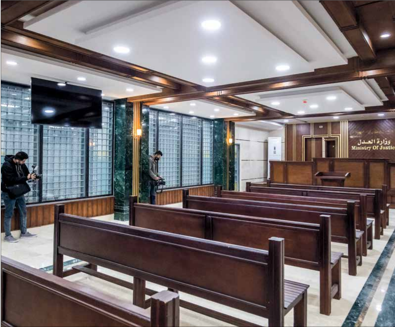
جدير الشاويح المصري الإعدام بوقت 105 جرائم حاد