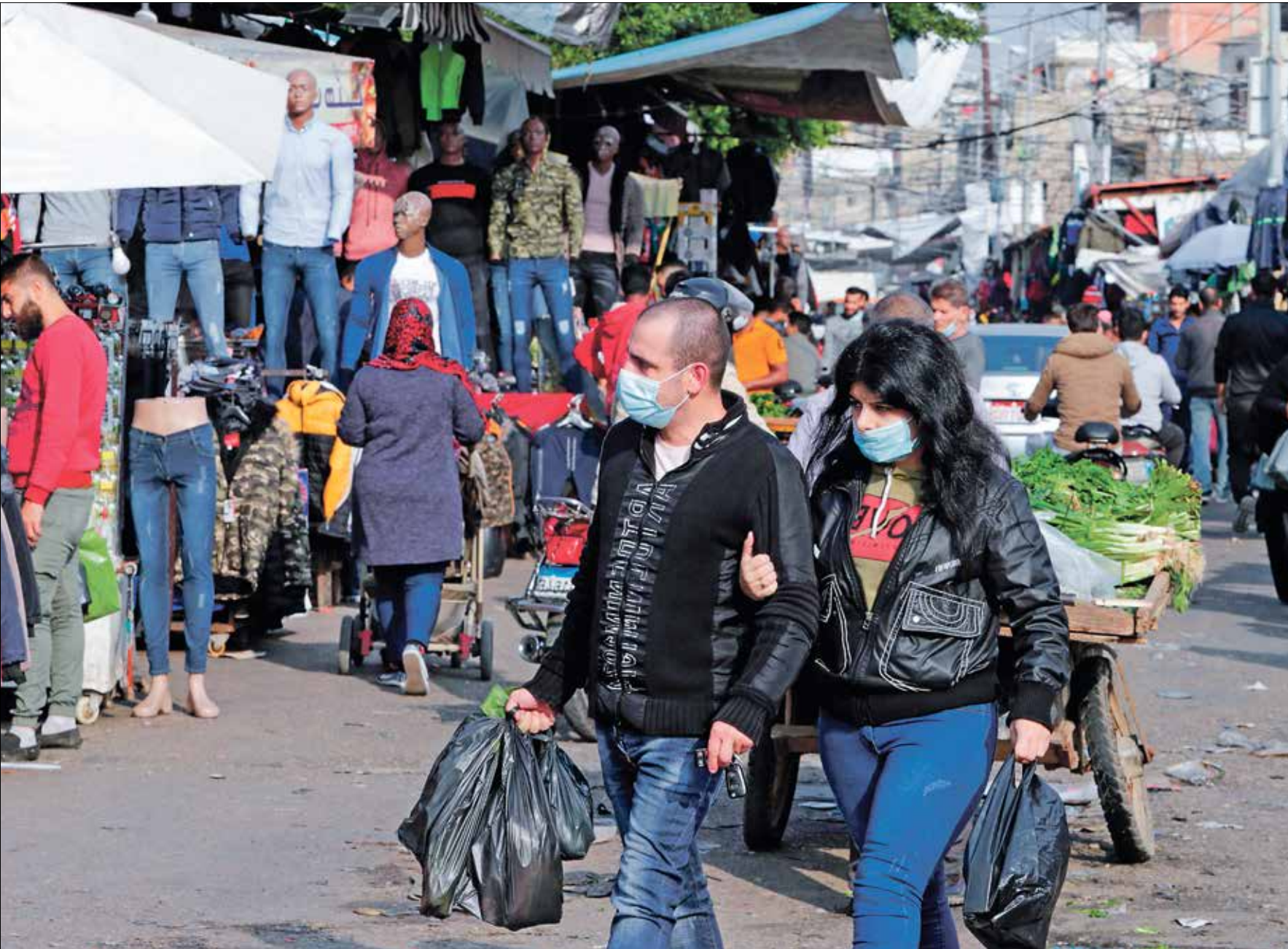
يحفل اللبنانيون السلطة الحاكمة مسؤولة بتدهور الوضع الاقتصادي

بحسب برو، لا تقف حدود الفساد عند هذا الحد بل تتعدى 200 ألف ليرة أسبوعياً.