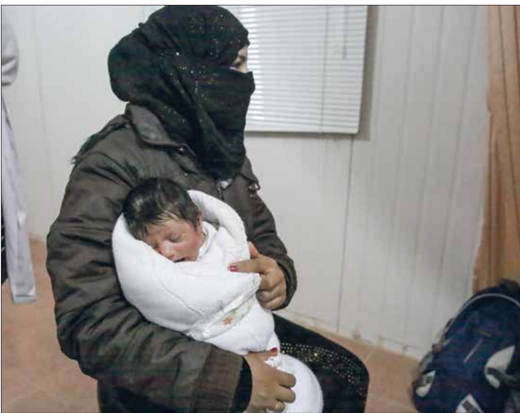
مخاطر كبيرة على امهات في الأردن