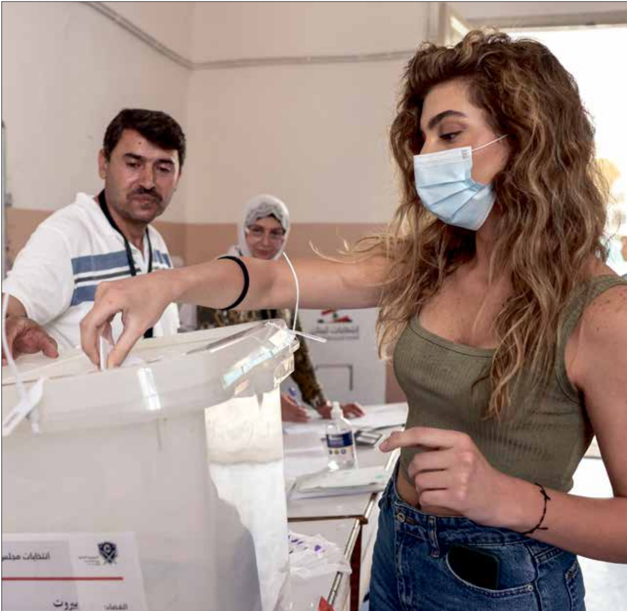
لبنانية تلصرع في بيروت امس اجوليف عبد فرانس برس)

لم يخل اليوم الانتخابي الطويل في لبنان من المشاهد المعتادة في استحقاقات، خصوصا لجهة الخروقات والإشكالات الأمنية، فيما كان الابرز ترهيب مراقبي الانتخابات، خصوصا في المناطق الخاضعة للثاني حزب الله وحركة أمل، من أجل تمرير مخالقاتهم