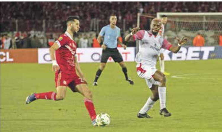
الوداد سجوخن النهائي على أرضه

وستحق الاهلي التاهل إلى المباراة النهائية، بعدما حسم التفوق المباشر على وفاق سطيف بنتيجة (2-6) بمجموع المباراتين، وفاز الاهلي ببارعة أهداف دون رد، ثم تعادل في الاياب بالجزائر (2-2)، واستحق الوداد التاهل إلى المباراة النهائية، وفقا للمواجهات المباشرة، بعدما فاز على بترو اتلتيكو بمجموع المباراتين (2-4)، بالفوز (1-3) ذهابا في أنغولا، ثم التعادل (1-1) في