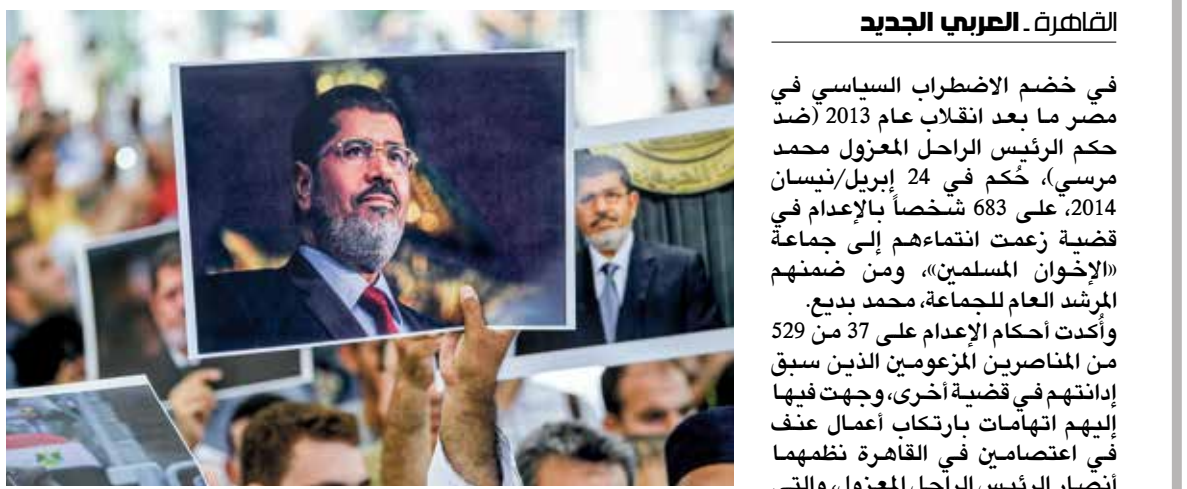
صدرت الأحكام بعد عزال الرئيس الأوحد محمد مرسي

صدرت أحكام بالإعدام بحق مئات الأشخاص في مصر في خضم مرحلة الاضطراب السياسي ما بعد انقلاب 2013. والتي خُفّ بعضُها إلى المؤبد أو السجن طويل الأمد، لكنها امتازت بحكم الشفافية