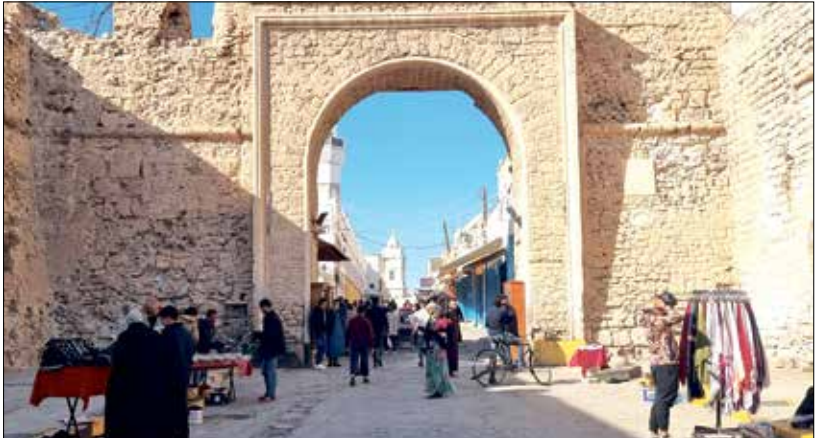
برتبة البيرورة ما سلتخط على اجتماعات القاهرة

وكانت وكالة «نونا» الإيطالية اللبنانية قد