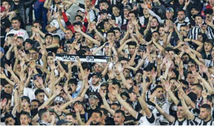
سطيف اخفق بالعودة في لقاء اليااب (فرانس برس)