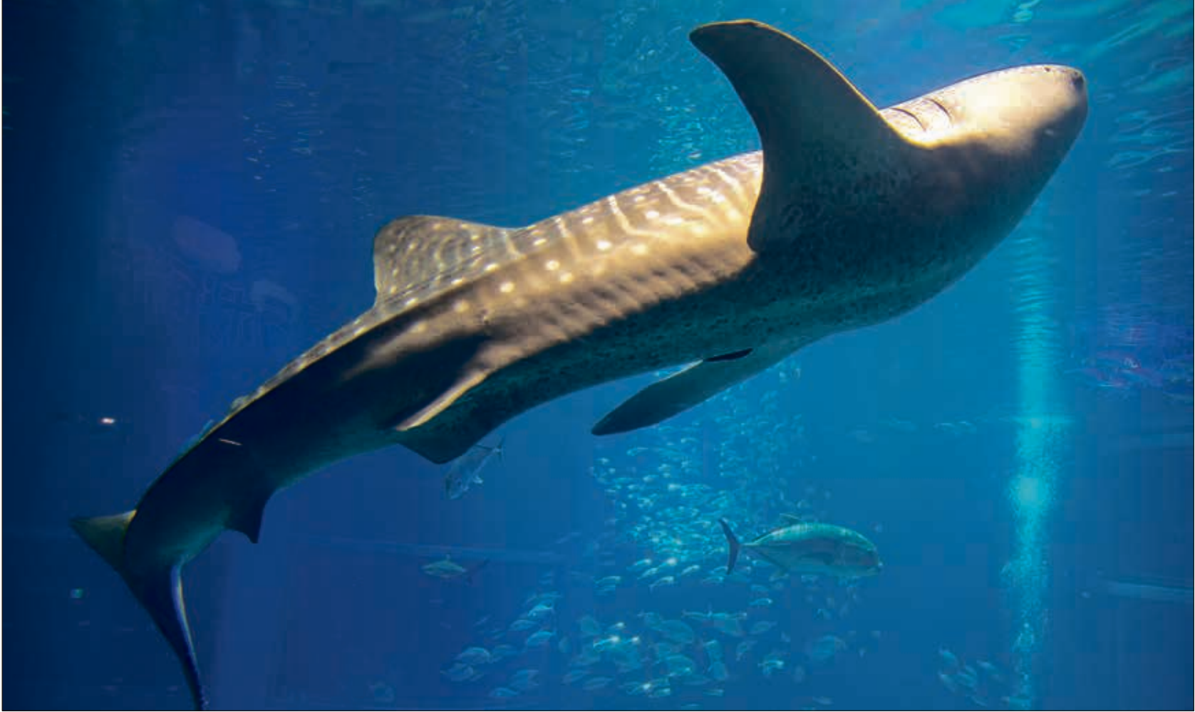
الشحن الصناعي يقيد حركة 90 بالمائة من هذه الأسماك

تعرف أسماك القرش الحوتية بحركتها البطيئة، وهذا ما يسهل اصطدامها بسفن الشحن الصناعي المنتشرة في المحيطات، الأمر الذي يسبب نفوقها وانخفاض أعدادها