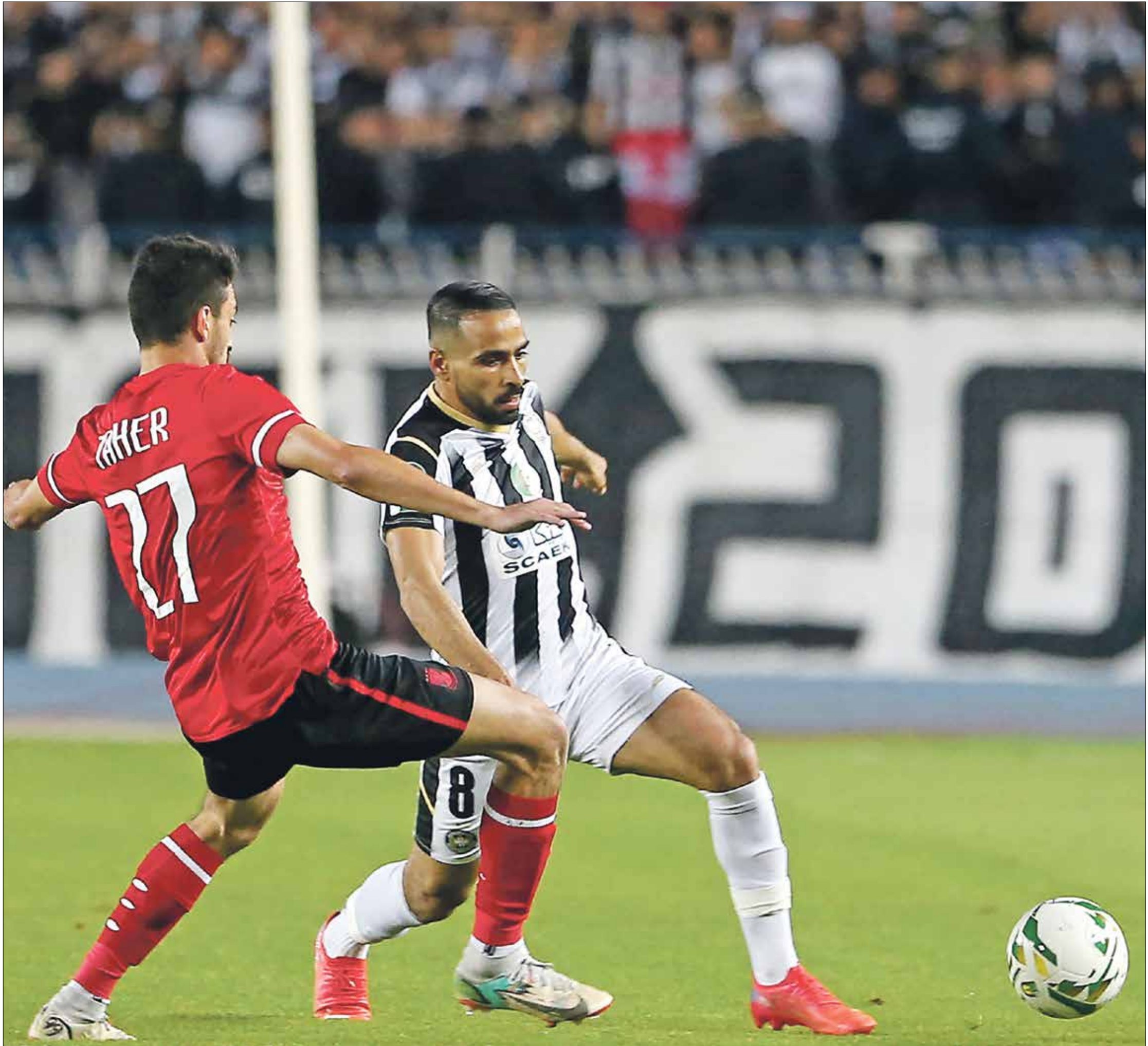
الاهلي تجاوز عقبة وفاق سطيف بنصف نهائي

وتقدم جيسلون موريريرا لبترو اتلتيكو، ورد أمين فرحان بالتعادل للوداد المغربي، واهدر العديد من الفرص السهلة، وخاصة في الشوط الثاني، وانهى اللقاء مستقيدا