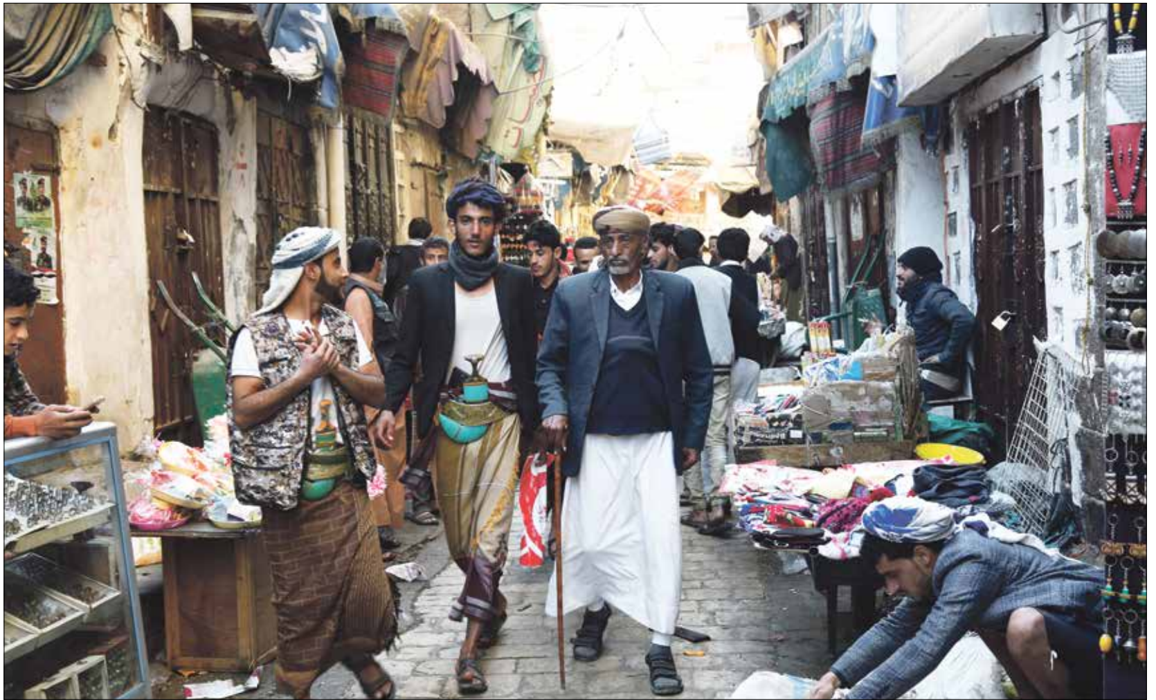
الانقسام الحاد بين طرفي الصراع قسم الناس والمجتمع

نسيج اجتماعي مفرّك وسط الحرب للحروب آثارها التي لا توفّر احداً، وفي اليمن، يخلف الصراع المستمر آثاراً عميقة في نفوس أهل البلاد، إلى أي معسكر انتموا أو لم ينتموا