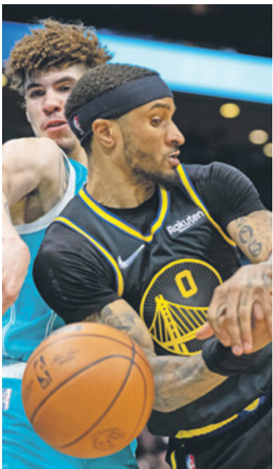
سقوط ووريورز للمرة الثانية هذا الموسم

وهذه الخسارة الثانية فقط لوريورز هذا الموسم مقابل 1 فوزا، ليبقى في الصدارة أمام فينيكس صنز الذي تفوق في الأسبوع نفسها على هيوستن روكتس (115-89)، وفي لوس انجليس، فني كليبرز بالخسارة الأولى بعد 7 انتصارات متتالية، بسقوطه على أرضه أمام شيكاغو بولز (100-99) بقيادة ديمار ديورزان الذي سجل 35 نقطة، 7 متابعات و5