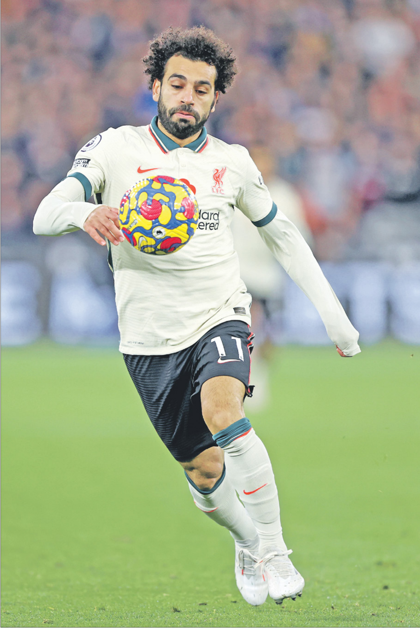
هل يتنق محمد صلاح إلى برشلونة ويرفض تجديد عقده مع ليفربول؟

كشفت صحيفة «ميرور» البريطانية عن أن مدرب فريق برشلونة الجديد، تشافي، يُفكر جدياً في التعاقد مع الجناح المصري محمد صلاح، مهاجم فريق ليفربول الإنكليزي، لكن المهمة لن تكون سهلة على الإطلاق، خصوصاً في ظل الوضع الاقتصادي الصعب للنادي «الكتالوني». ووفقاً للصحيفة، فإن رغبة تشافي ستواجه بحنكة إدارة «الريدز» في التعامل مع لاعبيه الذين يطلبون المغادرة، تماماً مثلما حصل في صفقة كوتينيو-برشلونة.