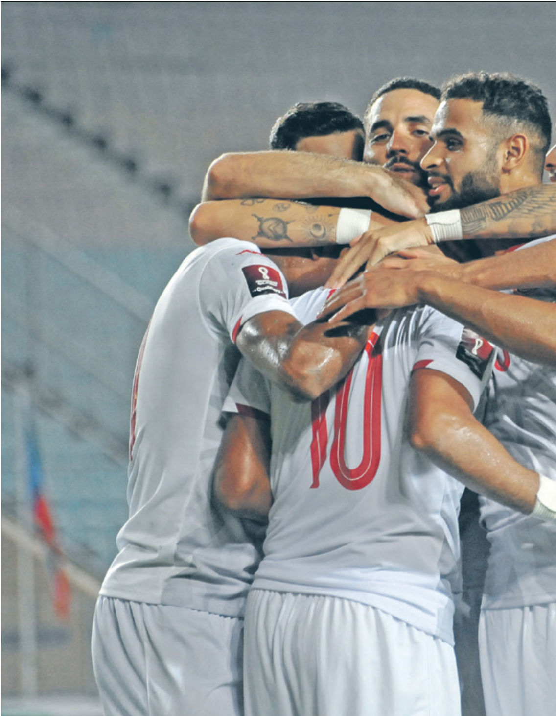
المنتخب التونسي لا يريد بطاقة التأهل

وفي المجموعة الثالثة، تنجح الإنظار نحو لقاء القمة الحاسم حين تلتقي نيجيريا صاحبة الـ12 نقطة مع الوصيف הראس