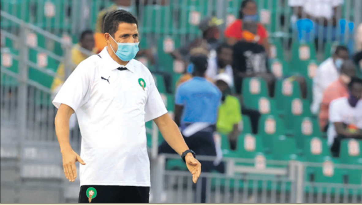
يطمح عموتة لقيادة المغرب صوب منصة اللقب (صوتان لصحافي/فرانس برس)