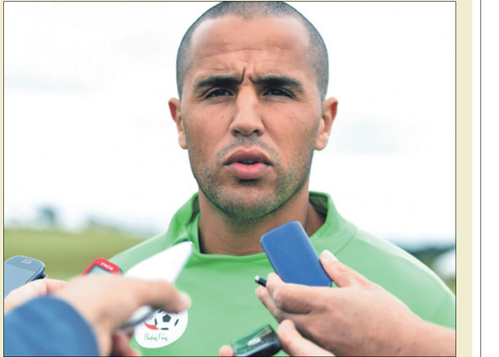
يتمتع رينار حصد بطولة مهمة في السعودية في البطولة