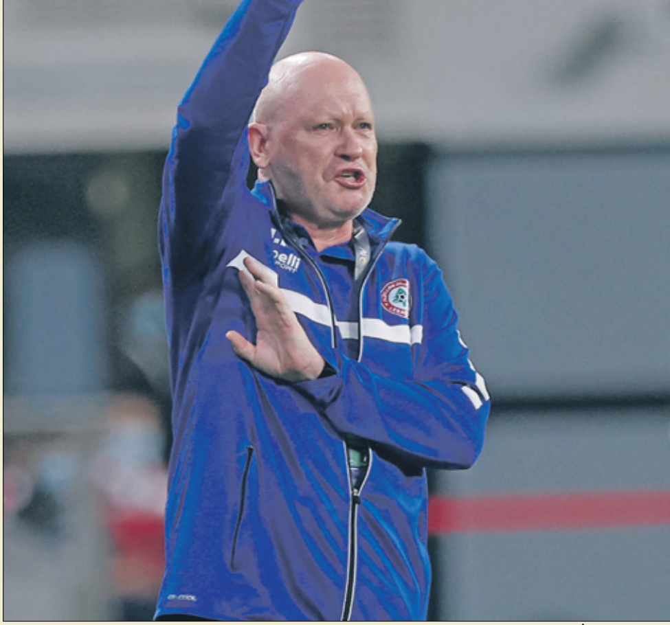
يتمتع إيفان هاشيك بمواصلته لتألقه الجيدة مع لبنان (الانطون)