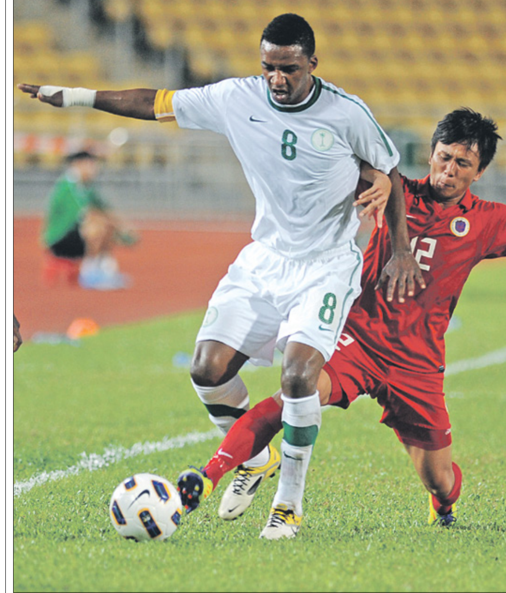
الأسطورة محمد نور (صوتان لصحافي/فرانس برس)