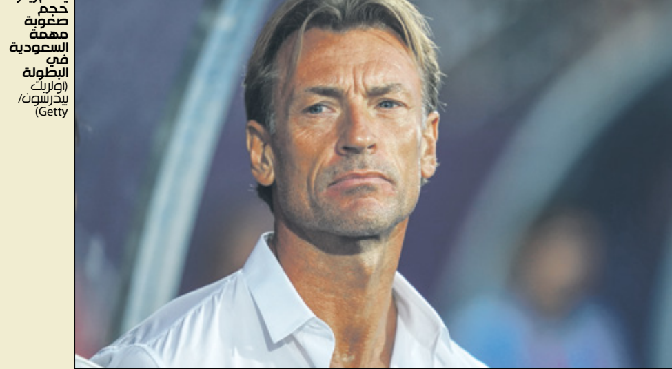
يطمح رينار حصد بطولة مهمة في السعودية في البطولة