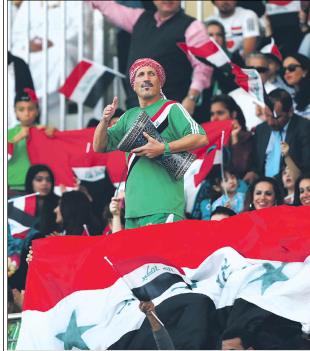
حقد منتخب العراق لقب النسخة الثانية من كأس العرب

استضافت الكويت النسخة الثانية من بطولة كأس العرب عام 1964، بمشاركة 5 منتخبات فقط، هي منتخب «الأزرق» صاحب الأرض، وليبيا، والعراق، ولبنان، والأردن، وذلك بنظامها القديم الذي يُعرف بـ«الدوري». واستطاع العراق حينها، تدشين مشاركته الأولى بكأس العرب عام 1964، بتحقيق لقبه الأول في المسابقة، بعدما تصدر جدول الترتيب، برصيد 7 نقاط، عقب فوزه، ب3 مواجهات، وتعادل في لقاء وحيد فقط. وحل في المركز الثاني، منتخب ليبيا، الذي جمع 6 نقاط.