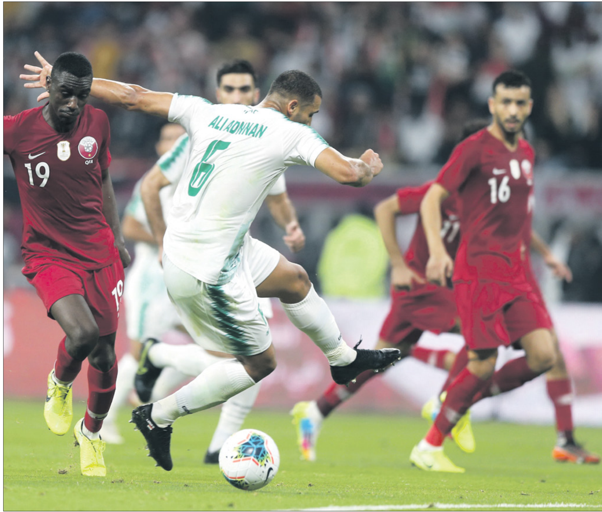
المنتخب القطري والعراقي في مجموعة واحدة

من اللحظات النادرة على مدار تاريخ كأس العرب كان تسجيل النجم السعودي محمد نور أول وآخر هدف ذهبي في المسابقة، وذلك في النسخة الثامنة التي أقيمت في البحرين عام 2002، وسجل نور الهدف القاتل الذي أطاح به أحلام منتخب البحرين في الدقيقة (94)