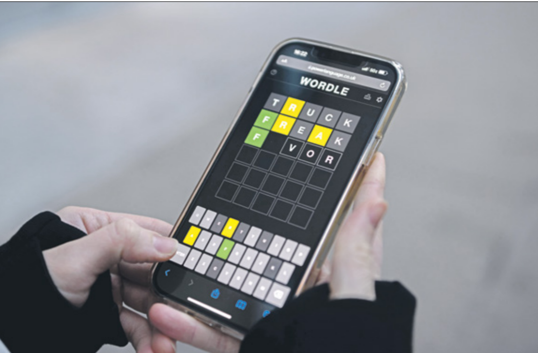
الرغم عدد مستخدميه اللعبة الكسبي