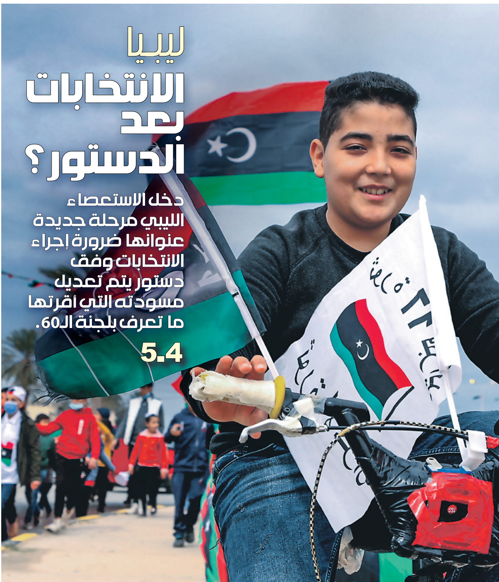
لا يزال دستور ما بعد الثورة موضع خلاف بين المكونات الليبية