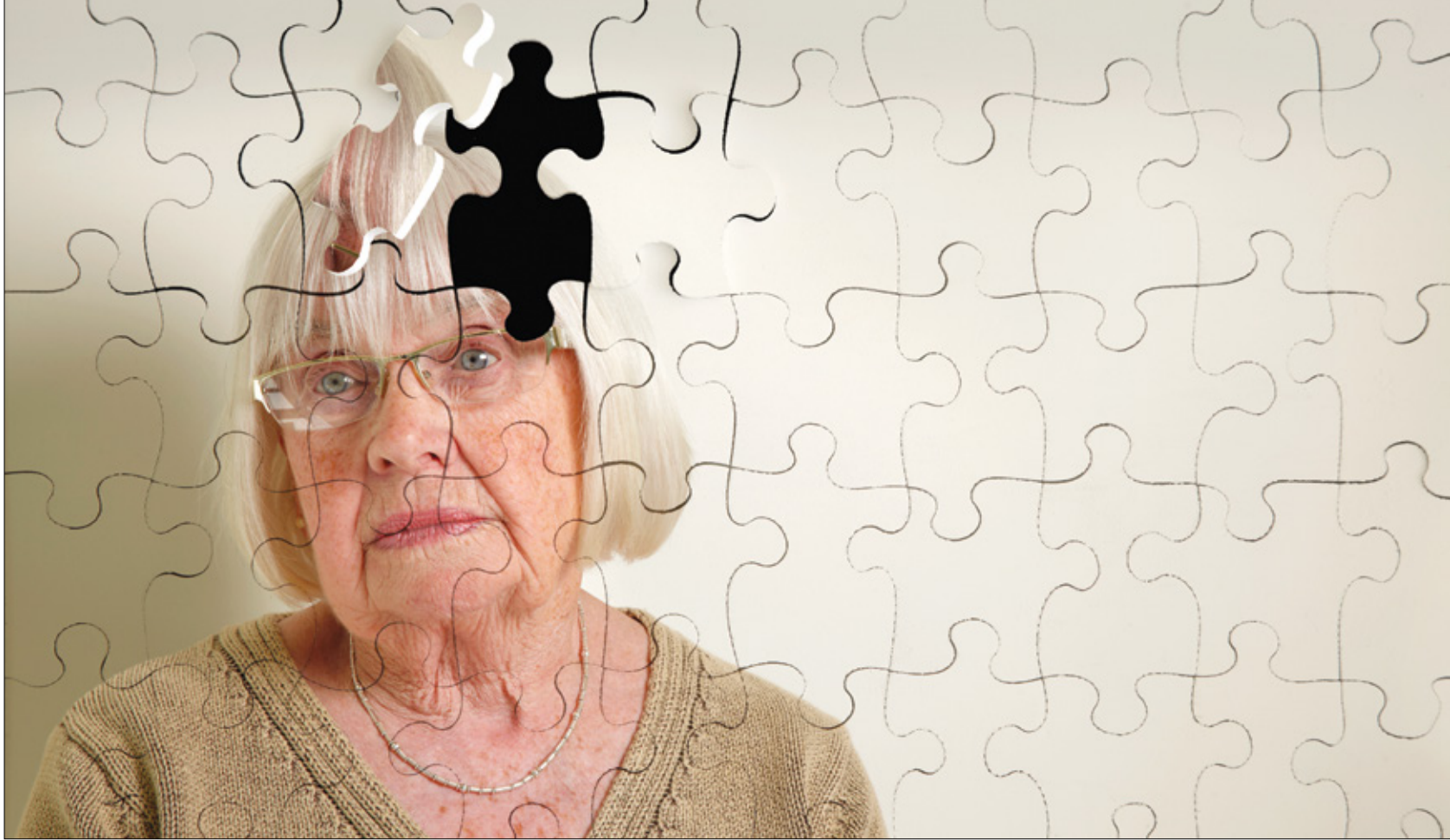
يعد الخرف حالياً السبب الرئيسي السابع للوفاة حول العالم

من المتوقع أن يشهد العالم ارتفاعاً مهولاً في الإصابات بالأمراض المرتبطة بالخرف في العقود الثلاثة المقبلة، بحسب دراسة أعدها فريق بحثي دولي متعدد التخصصات، ونشرت في مجلة «لانسيت»