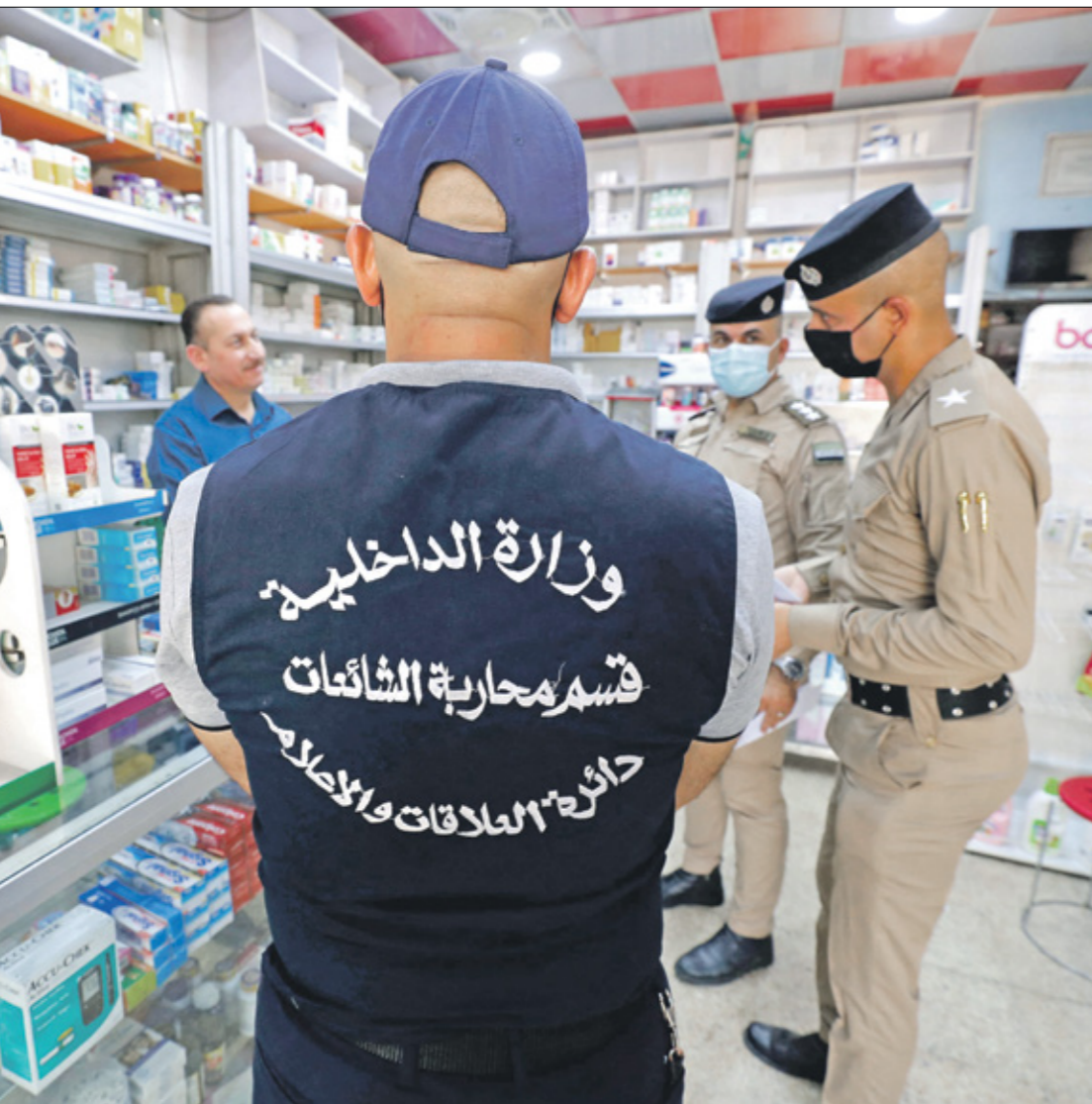
شرطة هيئة الإعلام والاتصالات على حملة هذه المواقع الحدّ الرقابي من (ربس)