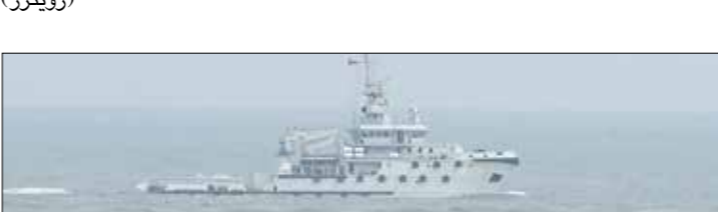
لحف الصين الشنطة العسكرية بالقرب من تايوان

وكتفت الصين نشاطتها العسكرية بالقرب من تايوان في السنوات القليلة الماضية، وحثت كمبرة شؤون البر الرئيسي بتايوان، وهو أعلى هيئة لوضع السياسات المتعلقة بالصين في الجزيرة، بكن في وقت سابق هذا الشهر على عدم تغيير الوضع الراهن، في المياه القريبة من الجزر التايوانية.