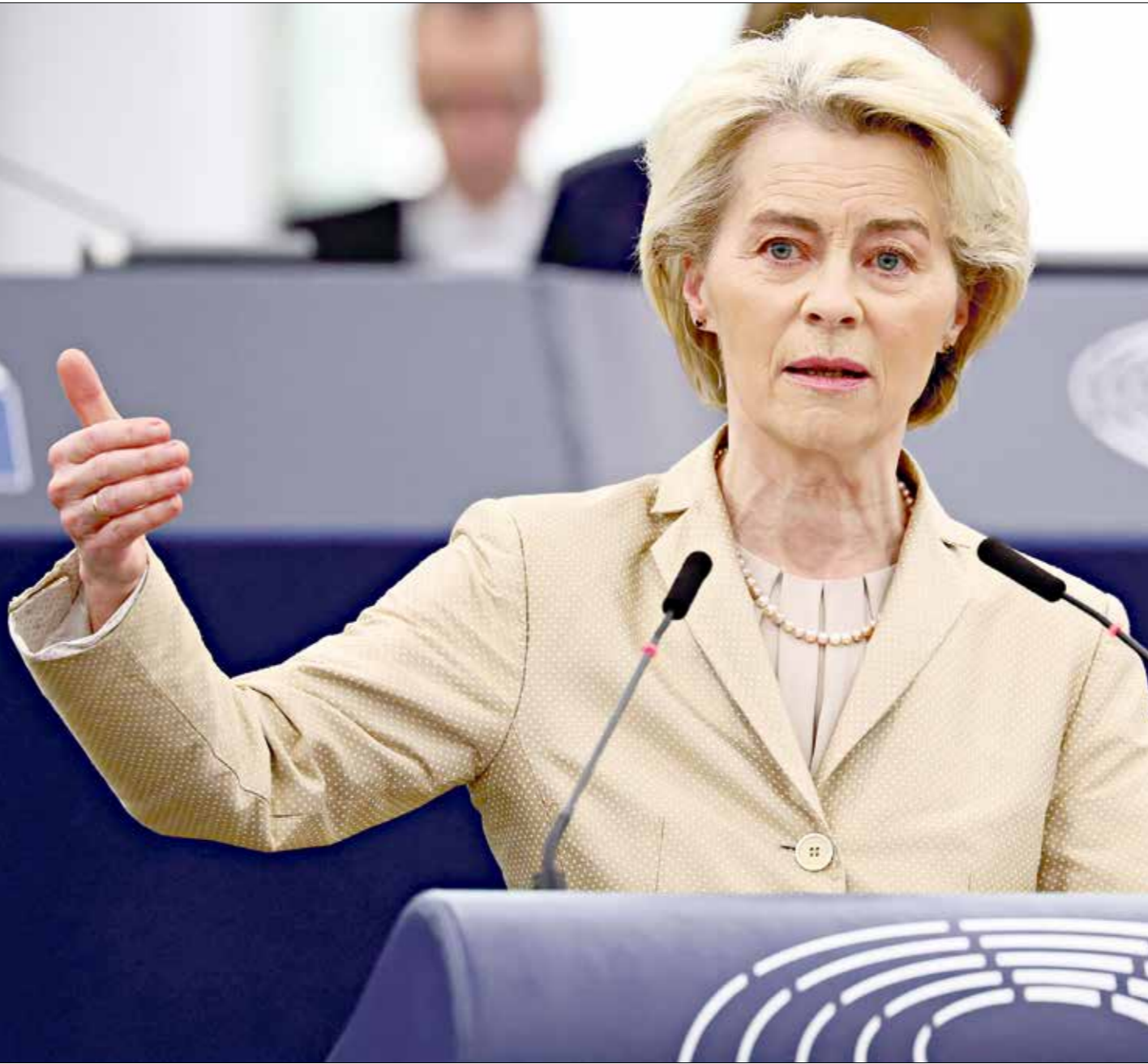
فون ديرلاين في مقر البرلمان الأوروبي، فبراير الماضي

يتعلق بالمجره بتسقينها النظامي وغير النظامي، لكن أكثر ما خلق خلافات خلال المحادث الاستخبارية الأوروبية، والتي أساءت توترها الغزو الروسي لأوكرانيا. المآخذ الثالث هو عدم نجاح برنامج سياسات الطاقة الخضراء، الذي خصصت له المفوضية الأوروبية عدة مليارات يورو، وهو لم يؤمن إلى اليوم الطاقة النظيفة على مستوى القارة. كما لم يحقق الخضراء، ولكنه بئر خلافات بين الدول الأعضاء، ويرب ذلك على نحو خاص في أهم بلدتي للاتحاد، فرنسا وألمانيا، رأس قاطرة الاتحاد، واتخذ باربوس على برلين استفادتها أكثر من المشروح. خلال ولاتها الأولى، قامت فون ديرلاين خطة موحدة، وكل دولة اتبعت سياسة خاصة مختلفة عن الآخرين، وبرزت عدة مواقف