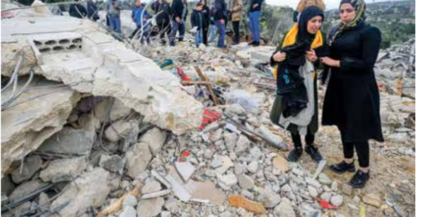
منزل مدمر في حولا. مارس الحالي

وقال «حزب الله»، في بيانات أمس السبت، عن عناصره «استهدفوا ثكنة راسم بصاروخي بركان وأصابوها إصابةً مباشرة. كما استهدفوا موقع الحدوداي