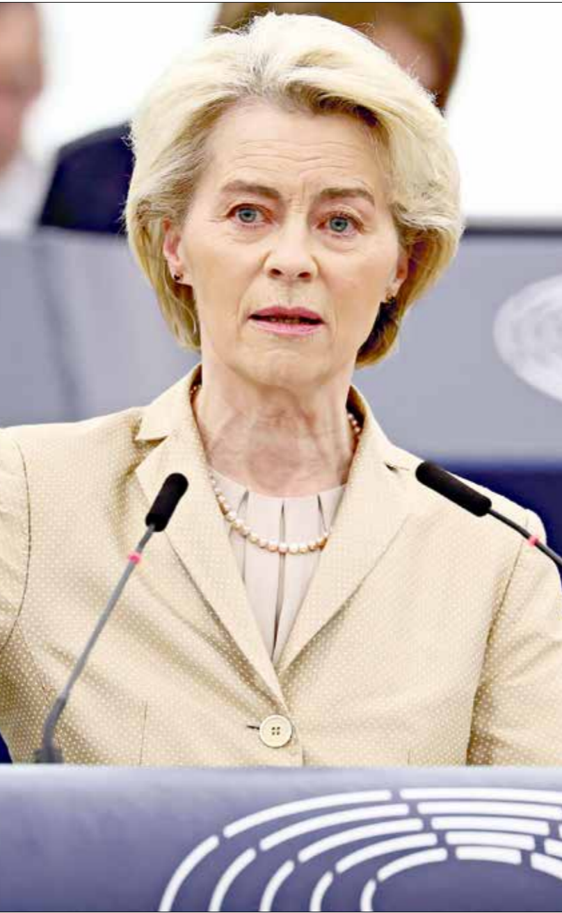
فون ديرلاين في مقر البرلمان الأوروبي، فبراير الماضي

وقبيل الانتخابات حث فريق نافالني أنصاره على الإدلاء بأصواتهم لأي مرشح غير بوتين، أو بإطلاقها خارج مرشحيه اثنين أو أكثر. كما اتصل بـ 15 مليون في صناديق المواطنين لبسؤالهم عن شكواهم ومحاوله تحريضهم ضد بوتين. وكان نافالني قد أعلن الحملة الهادئة خلال الصيف، وتم إجراء «عشرات الألاف» من المحادثات، وفق