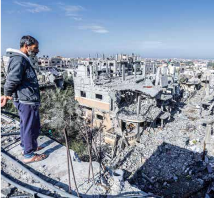
حول الاحتلال غزة (إم كلث من الصمار، احمد حسنة/Getty)