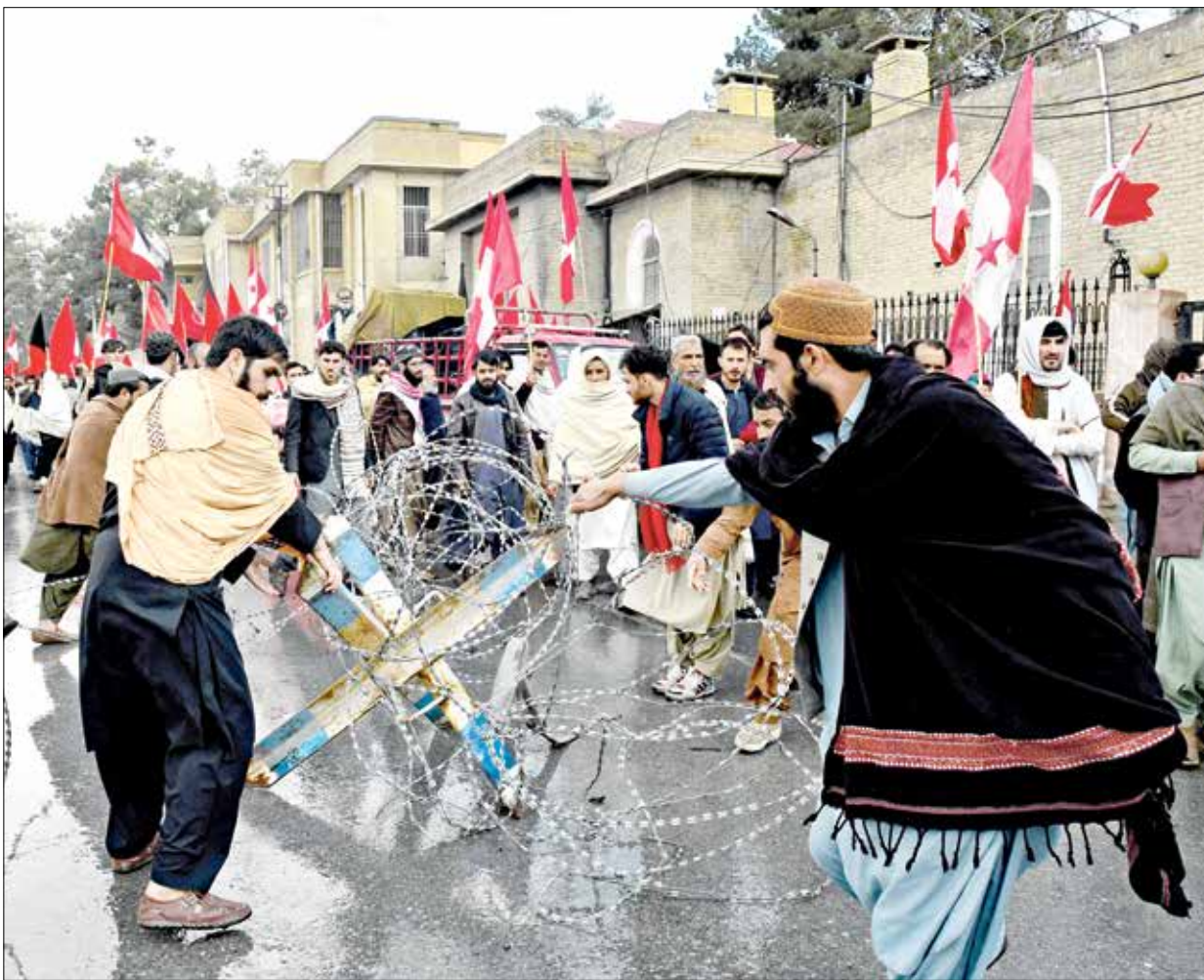
بشلوئيون يحتجون على الانتخابات بكويتا، فبراير الماضي

الوزراء، رغم أنها لم تحصل على أي مقعد في البرلمان المركزي في الانتخابات الأخيرة. أما بالنسبة إلى الأحزاب القومية، خصوصاً البشتونية المتمركزة على الحدود مع أفغانستان، فابرزها حزب عوامي القومي البشتوني، وحزب عوامي بقيادة محمود خان اجكزاي، الذي كان مرشح المعارضة لمنصب الرئيس الباكستاني، غير أن الحزبين لم يحصلوا على أي مقعد في البرلمان. وهو ما جعل زعيم حزب عوامي القومي البشتوني إميل خان ولي يحذر المؤسسة العسكرية من «مغبة ما فعلته»، وقال في بيان في 8 مارس الحالي إن «كل المؤسسات في باكستان عميلة تعمل تحت سيطرة المؤسسة العسكرية». ولفت إلى أن «ذنب الأحزاب القومية هو أن تلك الأحزاب تطلب حقوق القبائل وتسعى للحصول عليها من الموارد الطبيعية والوسائل الموجودة هناك، وهي ترفع ملف المختفين قسرياً من أبناء القبائل، ما جعل البعض يخشون منها، وبالتالي هي لجأت إلى إغلاق أبواب البرلمان في وجهها». وفي تعليق له على تهميش دور الأحزاب الدينية والقومية، قال المحلل السياسي