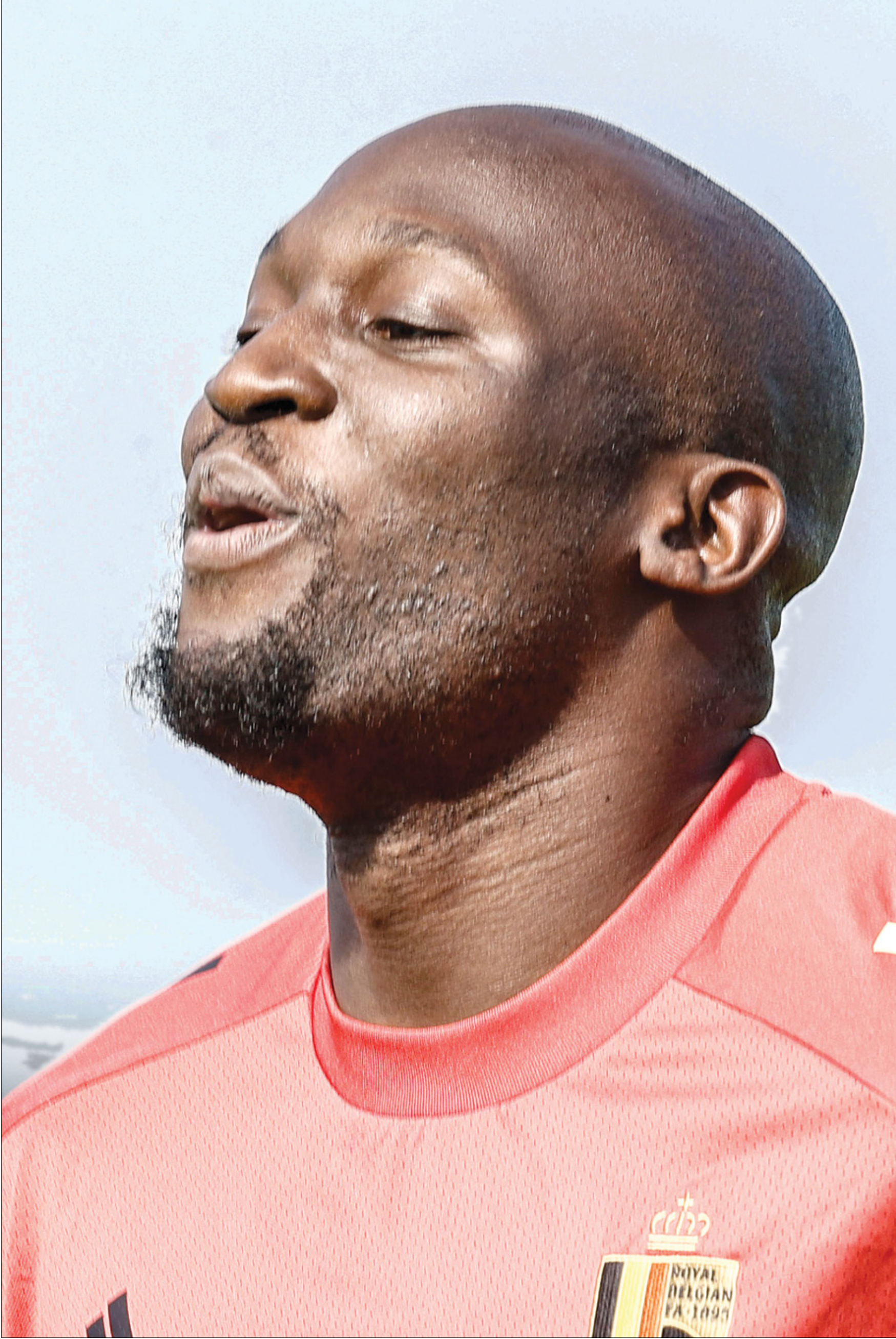
يسعى لوكاكو لاستعادة بريقه من خلال اللعب مع إنتر مجدداً

أكدت صحيفة «لاغازيتا ديلو سبورت» الإيطالية أن اتفاقاً قد حصل بين إنتر وتشلسي بشأن انتقال لوكاكو من العاصمة لندن في بريطانيا إلى مدينة ميلانو. وانتقل صاحب الـ29 عاماً إلى البلوز في الصيف الماضي مقابل 115 مليون يورو، وكانت التوقعات عالية للتألف هناك، لكن الأمور لم تسر كما هو مخطط لها، إذ سجل 8 أهداف في 26 مباراة بالدوري الإنكليزي، لكنه سيعود لإيطاليا التي تألف فيها بعقد إعاره.