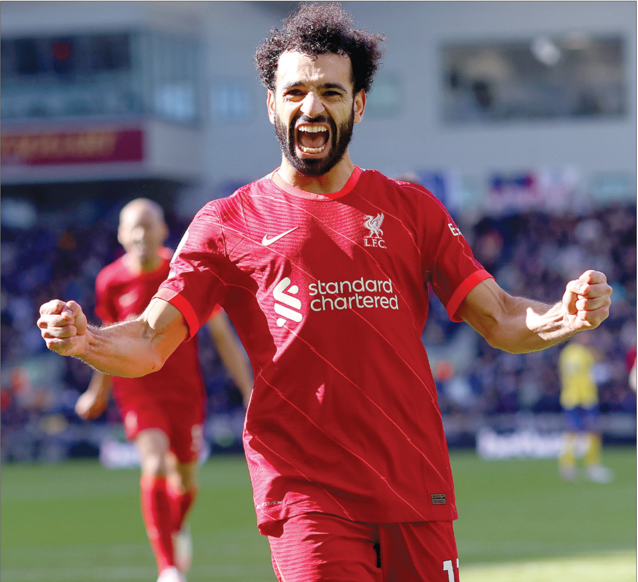
بدأ صلاح أحد أبرز نجوم ليفربول

2017)، مع 4 أندية لعب لها، بتصدرها بازل السويسري الذي بدأ معه مشواره وحقق معه لقب بطل الدوري السويسري مرتين الأعلى لأي لاعب مصري وعربي وأفريقي (2013، 2014)، وكذلك توج ببطولة الدوري الأم أفريقيا 2022 في الكاميرون التي حازت مصر فيها المركز الثاني.وبدا صلاح مسيرته الكروية برقم مالي متواضع، حينما انتقل من المفاولون العرب إلى بازل السويسري مقابل مليونين و200 ألف يورو في عام 2012، وارتفع سعره إلى 13 مليوناً و500 ألف يورو في عام 2014 عندما نجح نادي تشلسي في بورتصة انتقالات اللاعبين تضاعف عشرات المرات، فهو الآن يساوي (وفقا لسوق