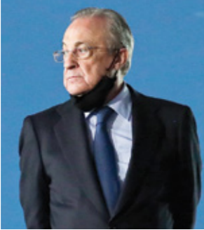
ليبرون جيمس قد يعود إلى فريقه السابق، كليفلاند كافالييرز ليعتزل هناك سنة (Getty)

أعلنت بطولة العالم للفورمولا 1 أن سباق جائزة أستراليا الكبرى الذي يقام في ملبورن سيمتصر حتى عام 2035. وبضمن الاتفاق الجديد بين أستراليا وبطولة العالم لسباقات سيارات الفئة الأولى والذي يسرى اعتباراً من عام 2025 إقامة سبقتي فورمولا 2 وفورمولا 3 للمرة الأولى اعتباراً من عام 2023. ويندرج سباق جائزة أستراليا الكبرى ضمن جدول بطولة العالم للفورمولا 1 منذ عام 1996. وأقادت بطولة العالم في بيان «في آخر عامين قام المروج باستثمارات كبيرة لتحسين الحلبة وسيتمتصر في تحسين التجربة العامة للجماهير والمشات خلال السنوات القادمة». وأضافت «هذا سيسجن تجربة الجماهير، ولكن أيضاً سيحدث من المنشآت للفرق مما يضمن السير الجيد للحدث خلال العقد القادم».