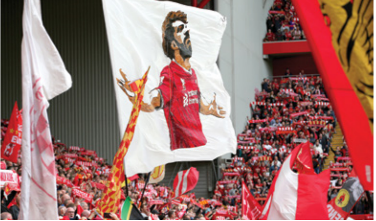
أصبح صلاح محبوب جماهير ليفربول

المنقضي وأنه موسمهم الخامس ولديه 193 مباراة يشغل عام في الدوري الإنكليزي برقعة تشلسي في تجربة قصيرة 2014 ثم ليفربول في 5 مواسم متصلة سجل فيها 120 هدفاً، بالإضافة إلى صناعة 52 هدفاً، ويضاف إلى هذه الجوائز جائزة أفضل لاعب في «البريميرليغ» لموسم 2017-2018، وكان أول لاعب مصري يتال هذا الشرف الكثير، ويتوج بلقب أفضل في الدوري، وهو ما يعنى فوز محمد صلاح بكل الجوائز الشخصية الكبرى، مثل الأهداف وأفضل لاعب، وكذلك أفضل صانع ألعاب، ونجم الموسم من جانب