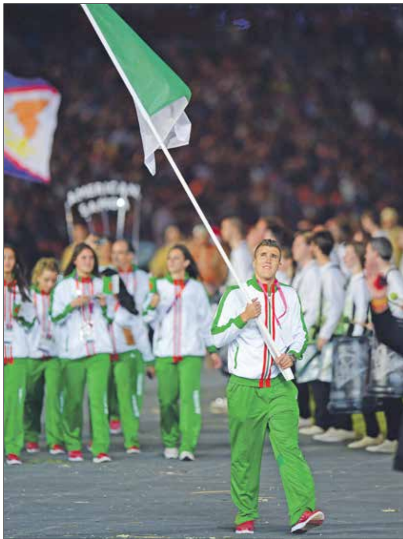
يشترك 40 رياضيا جزائريا في أولمبياد طوكيو