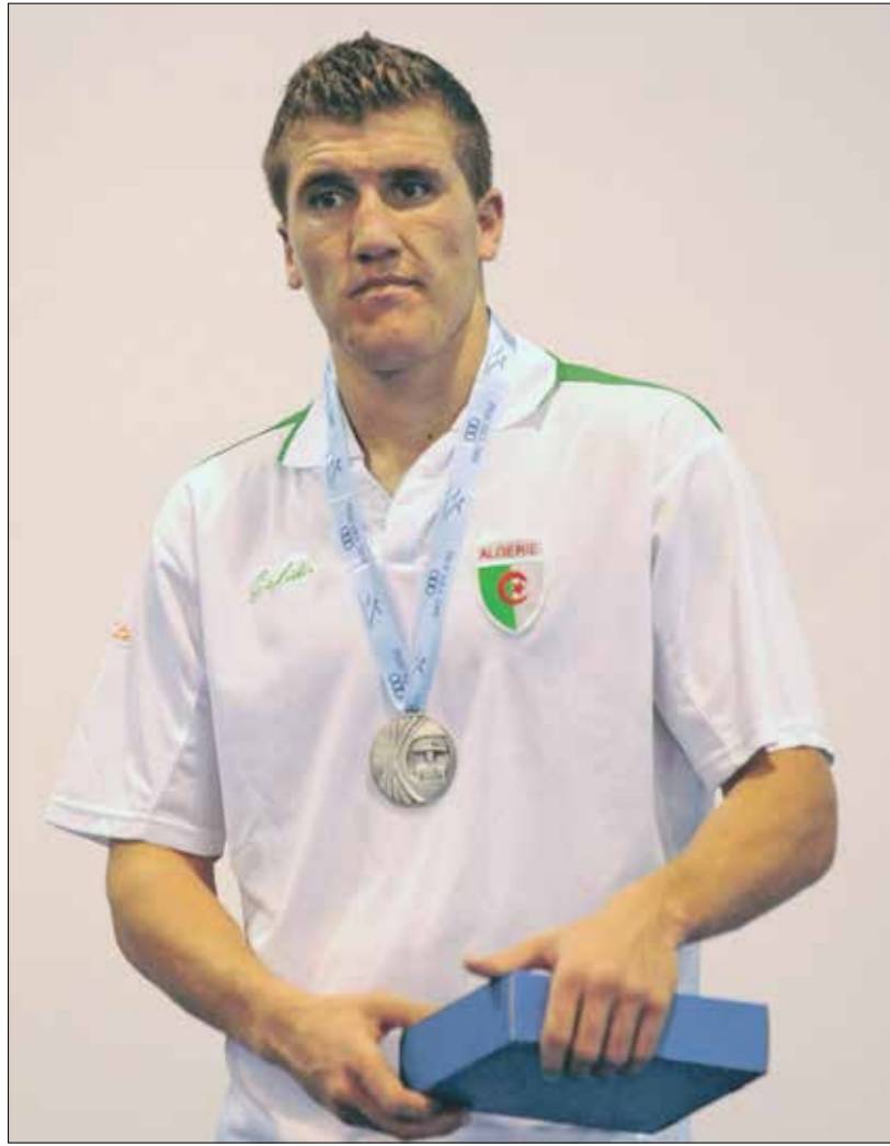
عبد الحفيظ بن شيلة متخصص في الملاكمة