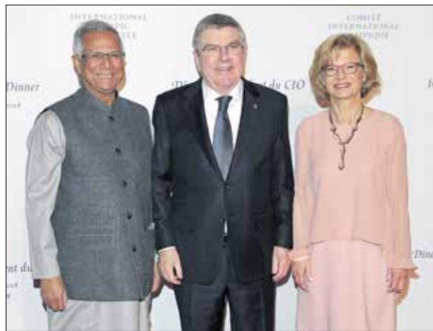
محمد بنس احتار جائزة نوبل للسلام 2006

البنغلادشي بنس يتسلم جائزة «لوريل الأولمبية» بفتح أولمبياد طوكيو لعام 2006، خلال حفل افتتاح دورة ألعاب طوكيو، في 23 يوليو/تموز الجاري، على جائزة لوريل الأولمبية، وهي جائزة أنشأتها اللجنة الأولمبية الدولية في عام 2016 تكريم الأفراد الذين يقومون بإنجازات لصالح التعليم والثقافة والسلام من خلال الرياضة. وأسس يونس، المعروف باسم «مصري الغفراء» لتطوير مفهوم القروض الصغيرة، «مركز يونس الرياضي لدعم الأعمال الاجتماعية» المرتبطة بالرياضة ومساعدة المنظمات والمجتمعات المختلفة على تنفيذ مبادرات في هذا المجال. يشار إلى أنه تم تقديم جائزة «لوريل» للمرة الأولى في حفل افتتاح أولمبياد ريو 2016، والتي أقيمت بالبرازيل، للطل الأولمبي الكيني كيب كينو، الذي يروج لتعليم الأيتام في بلاده.