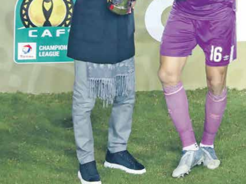
يسلمه لاعبي التضيق العربي توالياً

وأكد بيتسو موسيماي المدير الفني للاهلي جهويّة لاعبيه لخوض لقاء كايزر تشيفز، من أجل تحقيق الفوز، والتتويج للمرة العاشرة في تاريخ