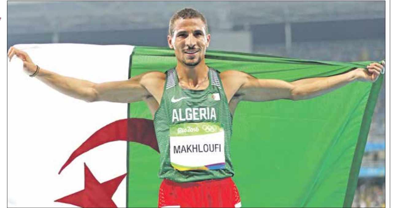
يعد العشاء توفيق مخلوفي، الاسم البارز في الجزائر

مخلوفي يحمل لواء التالق الجزائري بظلم العشاء الجزائري توفيق مخلوفي والمخصص في سباق 800 متر و1500 متر ضمن سباق الغاب القوي، هو الاسم البارز في الرياضة الجزائرية خلال السنوات الأخيرة، حيث كان هو الجزائري الوحيد المتوج بالميداليات الملوثة، في آخر نسختين من الألعاب الأولمبية. وحقق توفيق مخلوفي الميدالية الذهبية في تخصص 1500 متر في أولمبياد ريو عام 2016، قبل أن يعود في أولمبياد ريو عام 2020، ويحز في فضيتين في نفس التخصص وأخرى في سباق 800 متر، إضافة إلى إنجازات أخرى حققها في مختلف المنافسات الدولية والقارية، على غرار الميدالية الذهبية في البطولة الإفريقية للألعاب القوى سنة 2012. إضافة إلى توفيق مخلوفي، توجد أسماء أخرى تسعى إلى التالق في أولمبياد طوكيو، رغم أن رياضيين البلد لم يحققوا أي ميدالية خارج منافسات ألعاب القوى منذ أولمبياد بكين عام 2008، وبالضغط في رياضة الجودو وذلك بميدالية فضية فاز بها عمار بن خلف في وزن تحت 90 كغ، وأخرى برونزية في وزن 52 كغ كانت من نصيب المتسابقة صوريا حداد. ويعد عبد الحفيظ بن شيلة المتخصص في رياضة الملاكمة ضمن وزن 91 كغ أحد الأسماء المعول عليها للذهاب بعيدا في هذه المنافسة، ولم لا استرجاع هبة الجزائر في رياضة «السنبليل» بعد آخر ميدالية