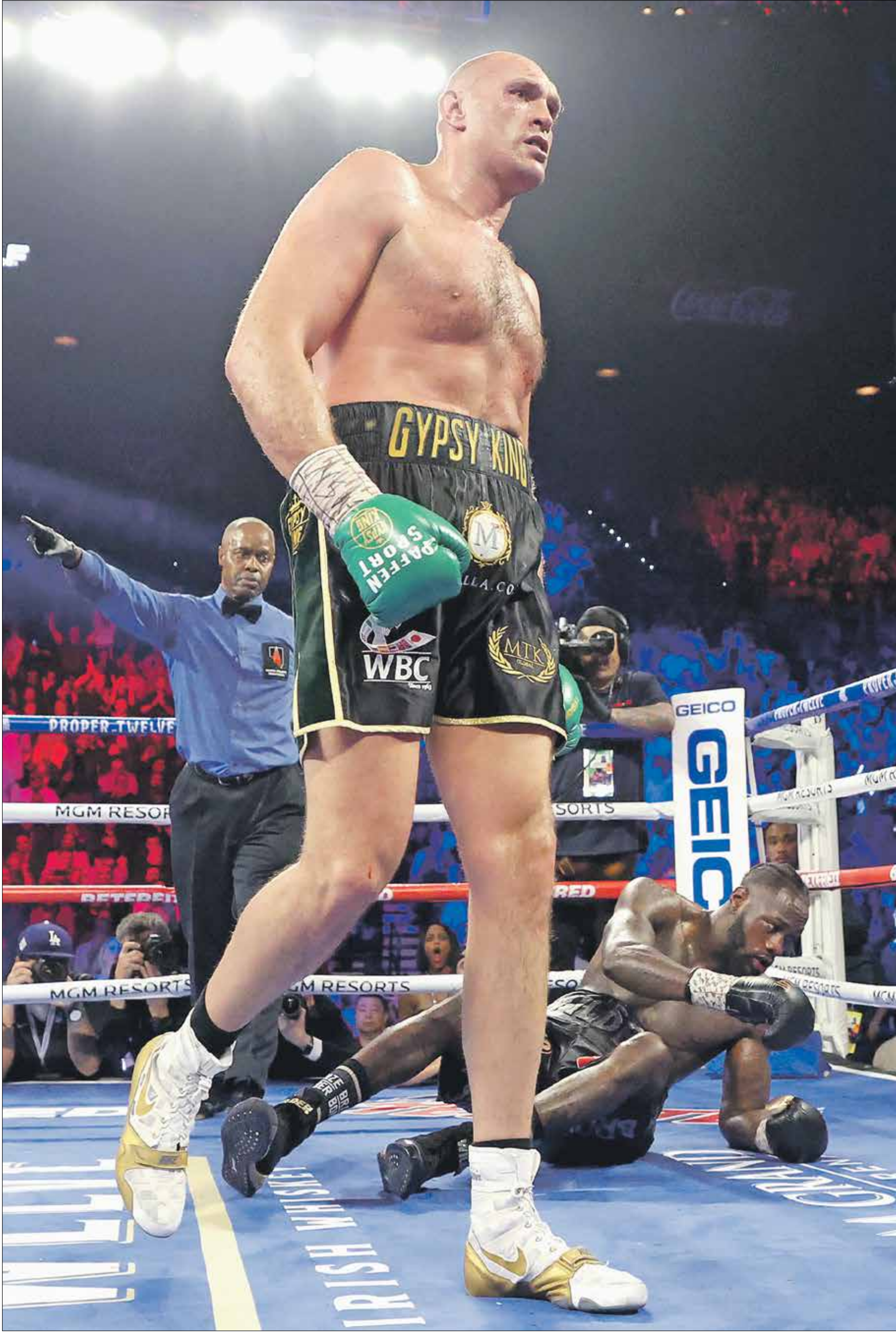
من النزاع الاخير الذي جمع نجمي الملاكمة

قرر مجلس الملاكمة العالمي تاجيك مواجهة الوزن الثقيل بين تايسون فيوري وديوناتي وايلدر، حتى التاسع من تشرين الأول/أكتوبر المقبل، بعد أن كانت إقامتها مقررة في 24 من شهر تموز/ يوليو الحالي. وأعلنت شركة «توب للنزال» المروجة للحدث تاجيك بعد إصابة فيوري بفيروس كورونا، مما اضطره للابتعاد عن الحلقات لفترة والغياب عن التدريبات، وهو ما سيعني إعادة التجهيزات للنزال من جديد.