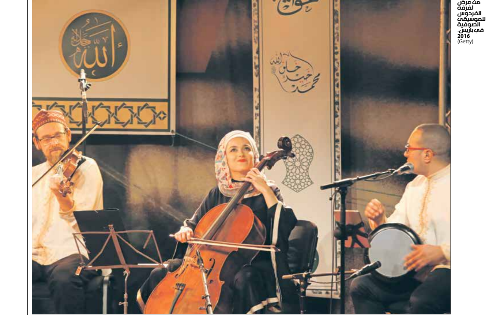
من عرض لفكرة للمسرحية الصوفية في باريس 2016