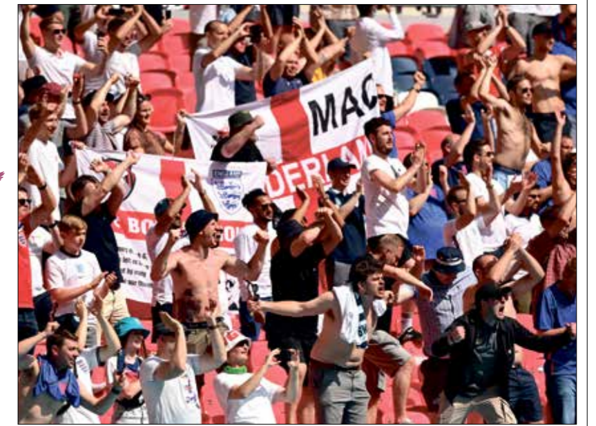
لريد جماهير إنكلترا وصول فريقها إلى الدور الـ16 بالبطولة

استمرت المناوشات بين جماهير منتخبى إنكلترا واسكتلندا، حتى عام 1966، عندما استطاع «الأسود الثلاثة» نيل لقب المونديال، ولم يتعرضوا لأي هزيمة في 19 مباراة متتالية، لكن البطولة الحلت في عام 1967 بلعب «ويمبلي»، شهدت مفاجأة من العيار الثقيل، عندما تغلبت اسكتلندا على إنكلترا.