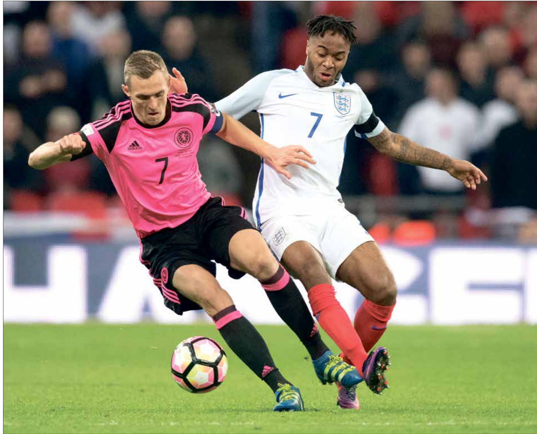
يلعب منتخب إنكلترا صوية المهمة أمام اسكتلندا

اقتحم مشجعو اسكتلندا ملعب «ويمبلي»، ومزقوا الشباك واعمدوا الرمي، عقب الفوز على «الأسود الثلاثة» في بطولة بريطانيا. وستكون المواجهة اليوم الجمعة، هي المباراة رقم 113 بين منتخب إنكلترا وخصمه التاريخي اسكتلندا، حيث حقق «الأسود الثلاثة» 48 انتصاراً، مقابل 41 لمنتخب اسكتلندا، فيما تعارلوا في 24 مباراة، بينهما ثلاثة من دون تسجيل الأهداف. بدوره، يرى النجم رحيم ستيرلينج مهاجم منتخب إنكلترا، أن المواجهة أمام اسكتلندا مجرد «مباراة أخرى» في يورو 2020 رغم الحديث والتوقعات الدائرة حولها، بقوله لأنه أحد هدفين في رمي اسكتلندا. لقد