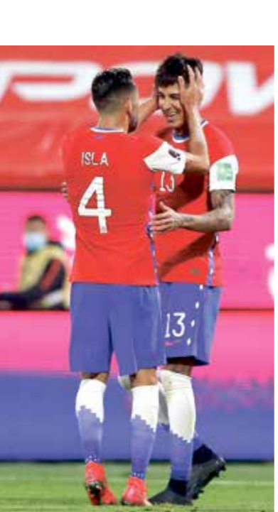
تشيلي تعويض التعادل أمام الأرجنتيين في الجولة الأولى.

وسبق أن تواجه المنتخب التشيلي مع بوليفيا في 37 مباراة سابقة (30 فوزاً تشيلي مقابلين 10 تعادلات و7 انتصارات لمنتخب بوليفيا)، في وقت فاز المنتخب البوليفي في مباراة واحدة فقط في آخر 15 مواجهة خلال السنوات الماضية، كما