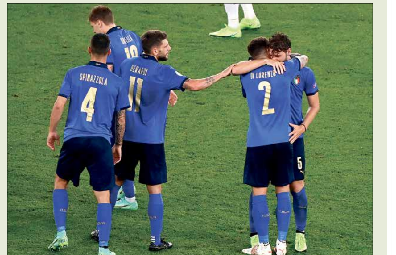
إيطاليا أول المتأهلات للدور التالي