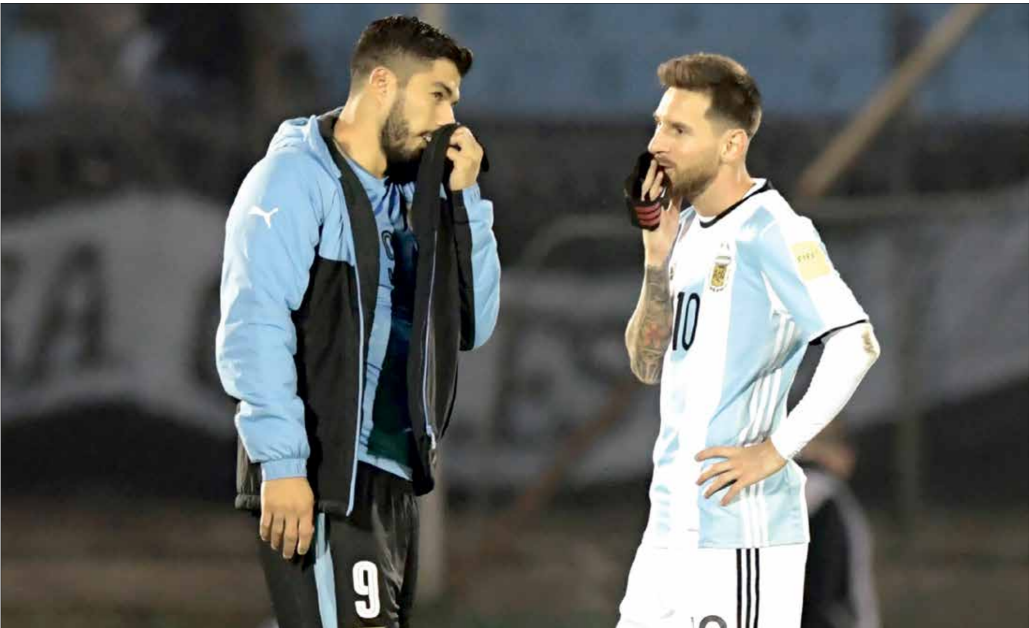
مواجهة نارية منتظرة بين ميسي وسواريز في مباراة من بطولة كوبا اميركا.

واحد من أعظم أساطير الكرة الأرجنتينية في الملاعب الدولية، وعليه سيحاول كل نجوم المنتخب الأرجنتيني مساعدة النجم، ليونيل ميسي، من أجل رفع الكأس هذا الصيف وتحقيق أول لقب دولي مع «كوبا اميركا» عام 2021، فسكسبون يتخّم بلعبون في أفضل الدوريات الأوروبية، المؤكد خوض ميسي سنواته الأخيرة مع الأرجنتين، إذ من المُمكن أن يلعب في بطولة كأس العالم 2022، في قطر، وبعدها ربما سيغدة جداً برفع ميسي الكأس.