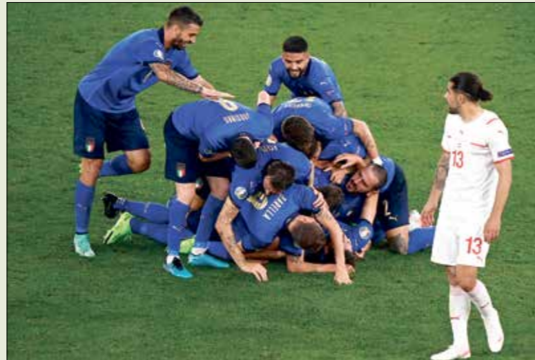
منتخب إيطاليا فتح مسطويات ملتحه