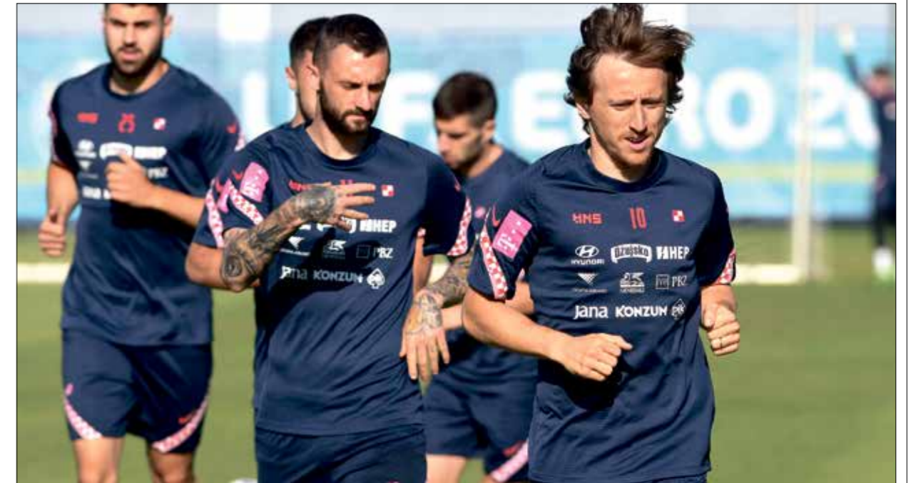
تتمتع كرواتيا على نجومها ضد تشيكيا