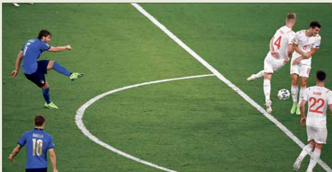
لوكاتيللي تالف خلال لقاء سويسرا