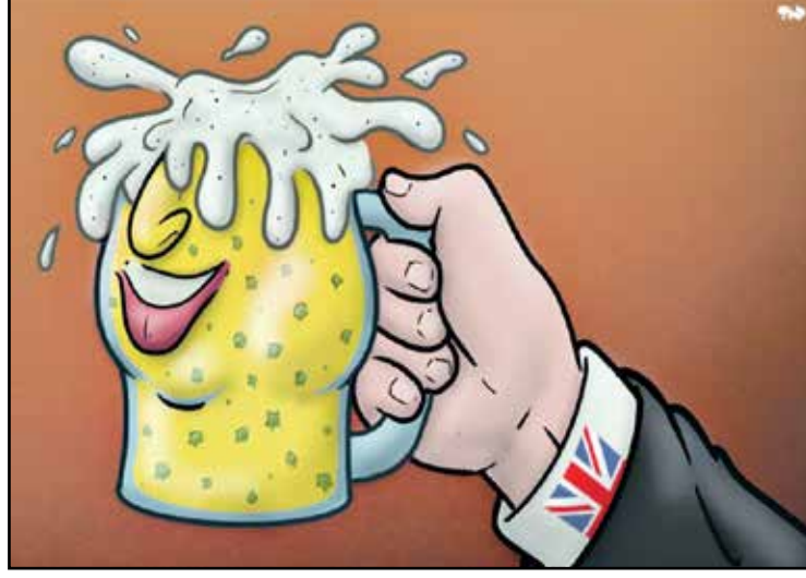
بوريس كانت الحفلات ذو الراس الرغوي (تايرد رويادز)

كل ذلك أوغر صدر فرج على توقيع كتاب التنازل عن الحكم باسم الزعيم الذي يطرد الآن صاغراً خارج القصر، غير أن الطرد سرعان ما تطور إلى حمل الزعيم إلى القبر حيناً عندما قرر «الممثل الشخصي» له أن ينتحر مبتسماً. غير أن الطرد سرعان ما تطور إلى حمل الزعيم إلى القبر حيناً عندما قرر «الممثل الشخصي» له أن ينتحر مبتسماً.