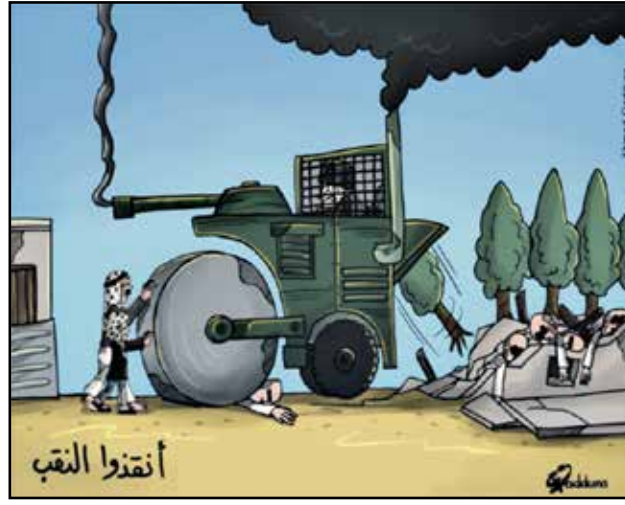
النقب الصامد في وجه الاحتلال