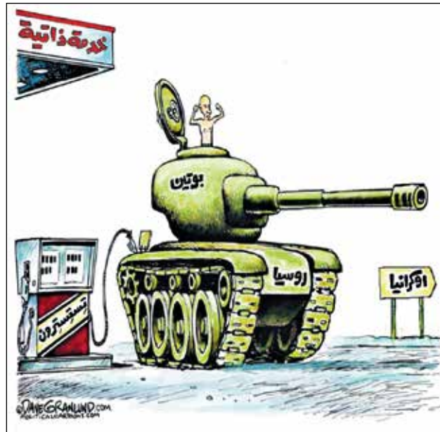
ديف غرانلوند/كيغل كار تونز