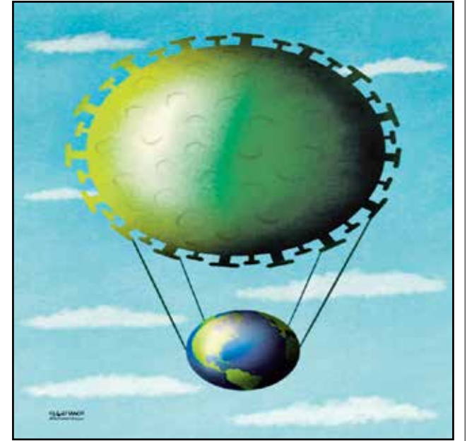
العالم تسيره جانحة كورونا