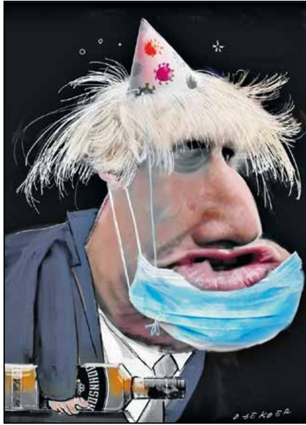
بوريس الأشك المحتفل بكمامة وقبعة (لوك دو تشمخر)