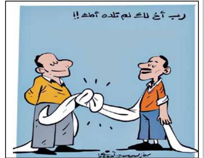
أخوة الفقر في مصر