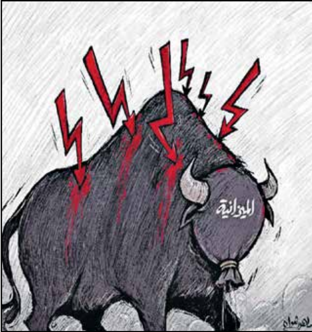
الميزانية في الكويت (الجريدة الكويتية)