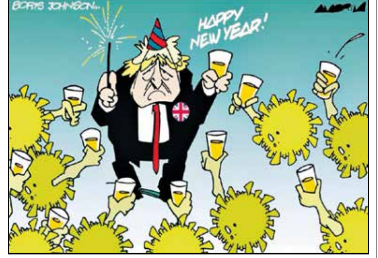
بوريس يفرح الأقداح ويحتفل مع فيروسات كورونا (اموريم)