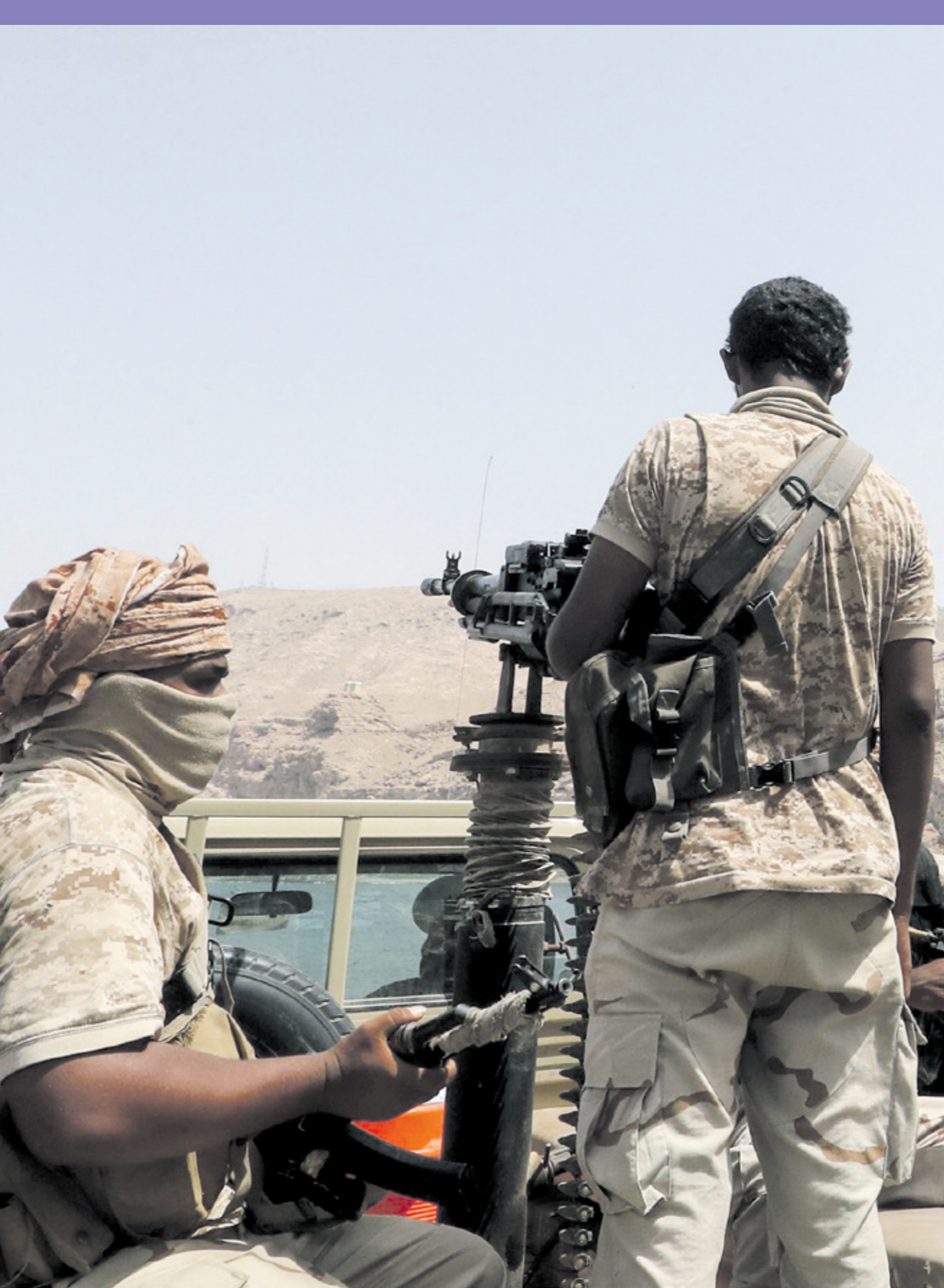
انضمام اول طيبي في موانئ وثروات اليمن لتهريب اكريم صهيبي(مركز لرس)

نحو 14 مليار دولار خلال السنة المالية الحالية التي تنتهي في 31 مارس/ آذار 2021، وإذا وافق البرلمان على قانون الدين قدمة العلاج في الخارج إلى 50%، فضلا عن الشواب، فيما تسعى الدولة أيضا إلى بيع أصول تخص صندوق النفطية على خلفية صندوق الأجيال القادمة كأحد الحلول المطروحة لتحويل العجز، كما سيتم دراسة وقف استقطاع نسبة الـ 10% التي تذهب إلى صندوق احتياطي الأجيال. ومن المقرر أن تصوت لجنة الشؤون المالية والاقتصادية بمجلس الأمة (البرلمان) على قانون الدين العام، الذي يسمح للسلطات بطرق أسواق الدين العالمية، قبل عرضه على البرلمان خلال الأسابيع القليلة المقبلة.