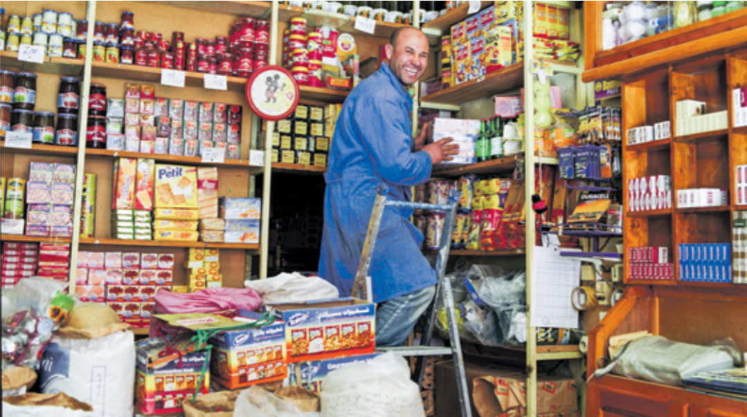
محلات البقالة تضم تسهيلات عديدة للمستهلك