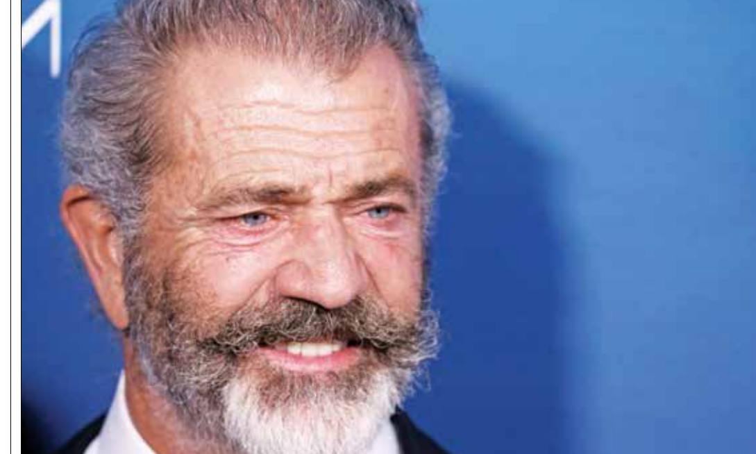
غيبسون تلقى العلاج ببقار بعدجسيفير المسجحد في الصلاح من الازبوا

لبناني طوني شلهوب عن «اسابيع شاقة» فضاءها هو وزوجته الممثلة الأميركية بروك ادايس، بعد تشخيص إصابتهما بمرض «كوفيد -19»، الذي يسببه فيروس كورونا الذي قُعد لع دور في التسلسلة الجزيئية «مونك» Monk.