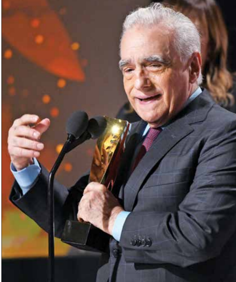
يسرد سكورسيزي سير شخصيات عادية عبر بوبص رساله السينمائية

بعد استئناف تصوير بعض الأعمال الدراميّة والسينمائيّة التي توقّفت بسبب جائحة كورونا، وانتهاء تصوير أعمال أخرى، أُنضحت الخريطة الدراميّة لرمضان عام 2021.