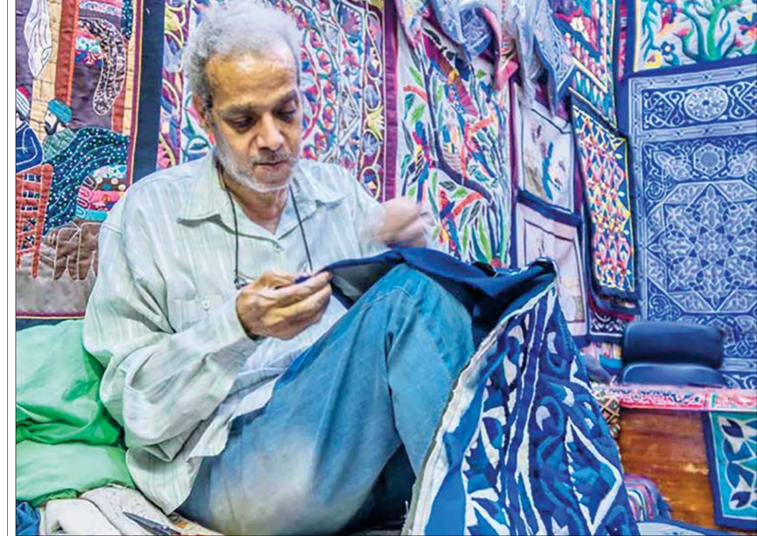
صور لرصد حياة الناس وأعمالهم وأدائهم وهم يزارون مصمم الوبئة العربي (الحديد)