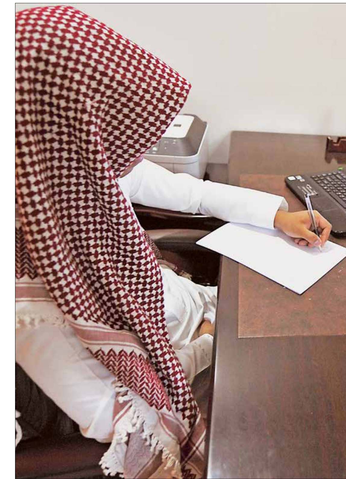
استهدفت الرياض الناشطين والمعارضين عبر «تويتر»

وتتولى السفارتان السعودية والإماراتية في الولايات المتحدة الأميركية والمملكة المتحدة محاولة تحييد جزء كبير من الصحافيين ومنعهم من مهاجمة الرياض وأبوظبي وإثارة مشكلات حقوق الإنسان داخلهما، أو التستر على قضايا الفساد السياسي، أو حثهم على مهاجمة قطر وتركيا وخصومهما في المنطقة. وعمدت المملكة إلى تشويه النسخة العربية من صحيفة «ذي إنديبنذنت» البريطانية، محولة إياها إلى صحيفة سعودية صفراء، فيما حوّلت الإمارات «سكاي نيوز العربي» التي تملك حق بث نسختها العربية إلى قناة إماراتية شبه رسمية من دون أي استقلالية.