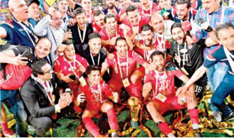
النجم الساحلي يحذ صيفا على شبيبة القيروان