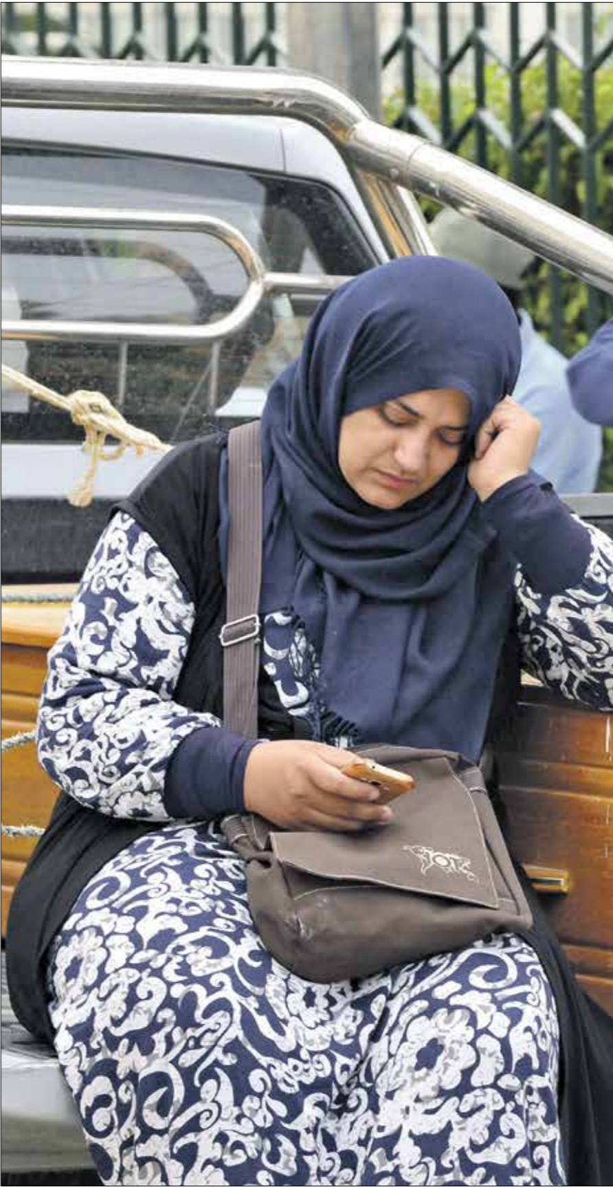
لكيف فريضها بسبب عرف أحد قوارب الهجرة

وفي هذا الإطار، يترجم النائب الأول لرئيس مجلس شورى المفتين في روسيا، مفتي مقاطعة موسكو، روشان عباسوف، قرار