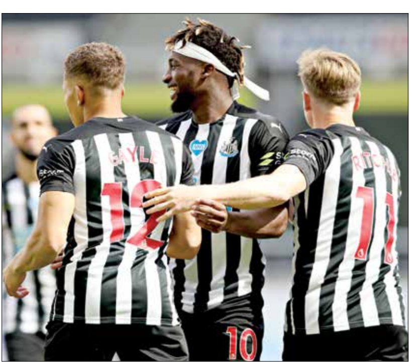
يستعد نيوكاسل للموسم القادم من الدوري الإنكليزي

وأشارت المنظمات إلى ضرورة اعتماد «البريميرليغ» والاتحاد الإنكليزي لكرة القدم، حقوق الإنسان في جميع أعماله، وضرورة إعادة تقييم محاولة صندوق سيادي سعودي شراء نادي نيوكاسل.