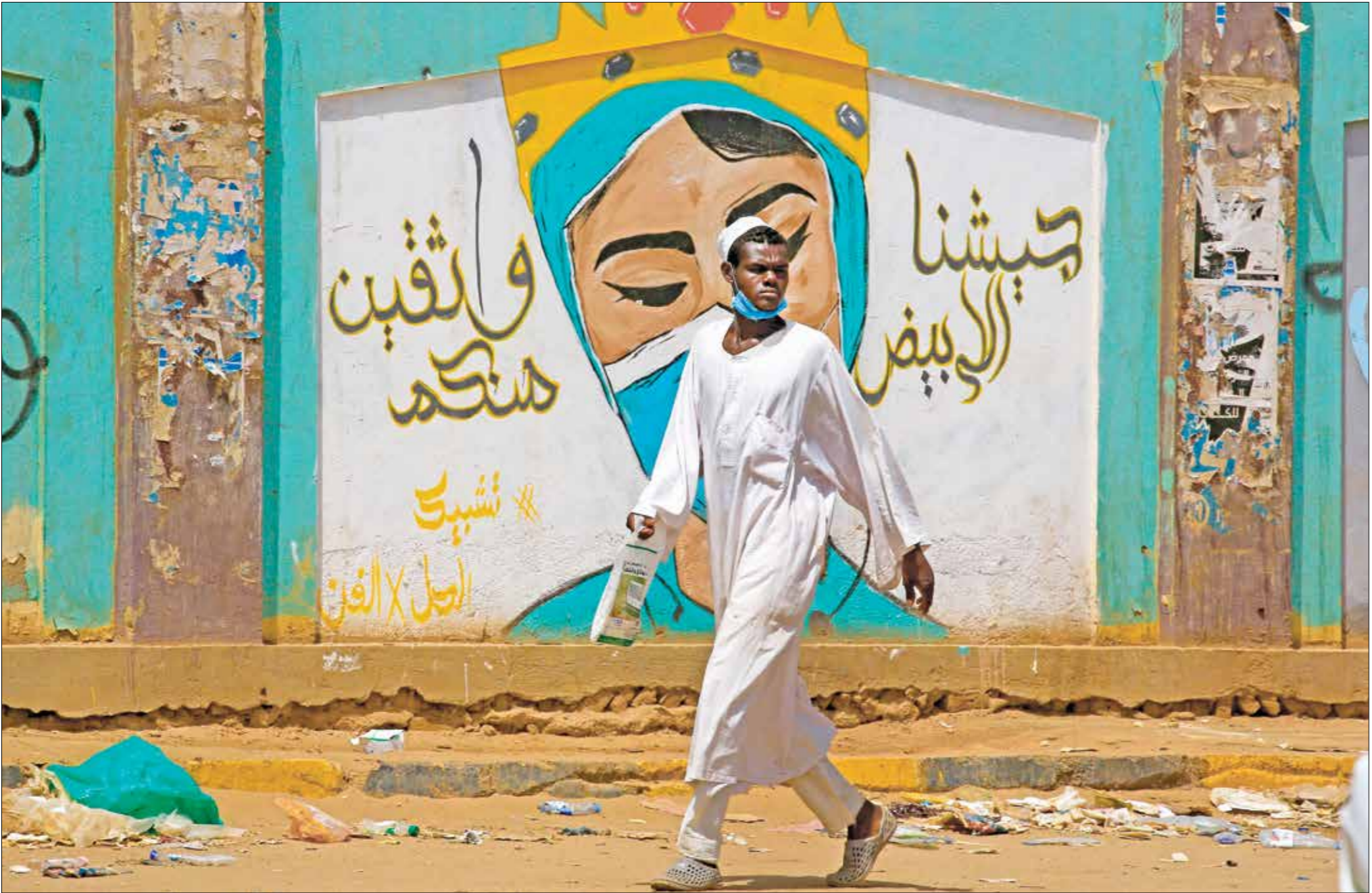
جائحة كورونا ماقت من احتياجات المشاهي لالوكسجين

تتفاقم أزمة اسطوانات الأوكسجين التي يحدث عنها ذوو المرض السودانية، مع تزايد اعداد المصابين بكورونا، في ظل عدم إعادة مواطنين للعبوات التي يحتفظون بها كاحتياطي، خشية من حدوث طارئة لأحد أفراد الأسرة مع تفشي الفيروس