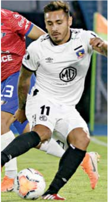
ليبره جيمس بيودونجور التحفيظ فور

كحامل للقب مونديال البرازيل 2014، وعلى الرغم من ذلك لم يستطع الفوز في دور المجموعات سوى على السويد بينما خسر أمام المكسيك وكوريا الجنوبية، وتابع نوبر الذي يواصل التحضير مع الفريق البافاري لمواجهة آياب ثمن نهائي دوري الأبطال أمام تشيلسي الإنكليزي المكسيك قدمت اداءً جيئاً أمامنا، وعملوا على مفاجأتنا من خلال الهجمات المبتدئة، في المقابل أكد الحارس الألماني صاحب الـ34 عاماً أن في بداية مسيرته الاحترافية كان يرغب في اللعب في مركز خط الوسط وليس كحارس مرمى. يُذكر أنها المرة الأولى منذ سنوات طويلة التي يخرج فيها المنتخب الألماني من دور المجموعات، وسار على طريق كل الأبطال السابقين الذين توجهوا باللعب وخرجوا من الدور الأول في النسخة الموندبالية التالية.