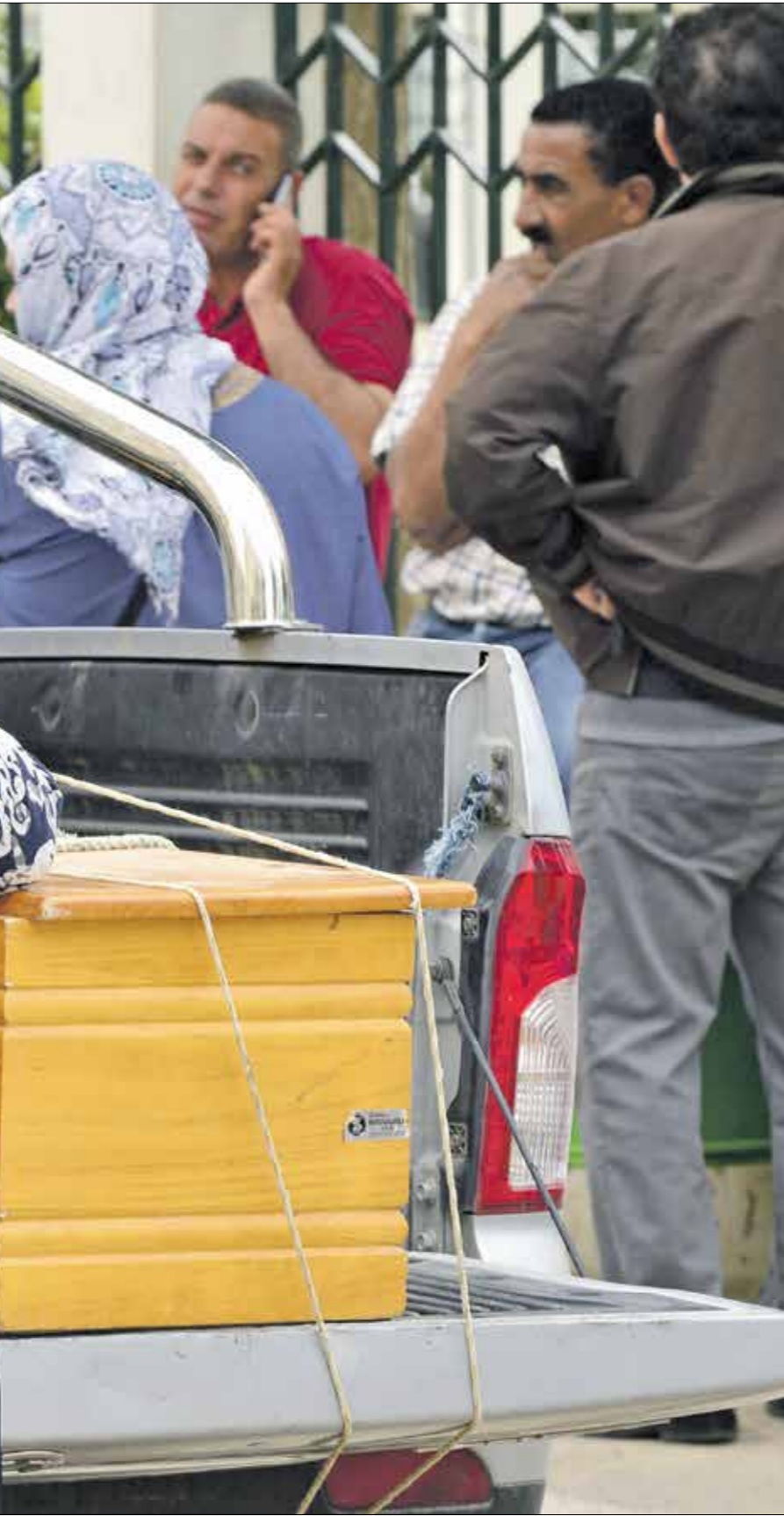
لكيف فريضها بسبب عرف أحد قوارب الهجرة

تتحذّر راضية لـ «العربي الجديد» عن الصعوبات التي تعرضت لها إبان فترة الحجر الصحي بسبب توقفها عن العمل وبالتالي خسارتها مصدر رزقها، وهذا زج وجهها بصفة مستمرة في موضوع الهجرة كعائلة، مؤكدة أن مغادرة البلاد بشكل أو بآخر هو الحل الوحيد لإنقاذ أطفالها الثلاثة وضمان مستقبلهم، ولا