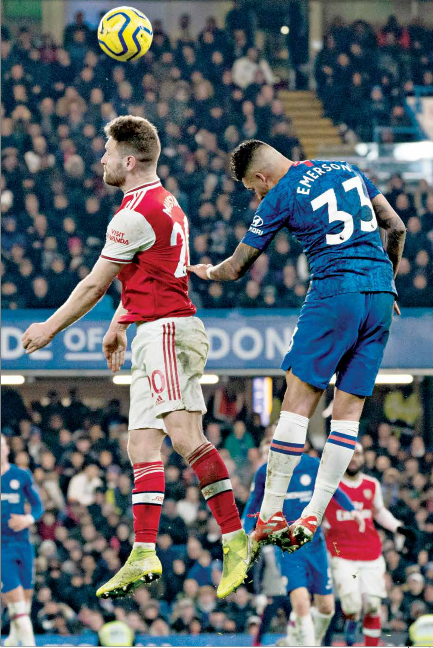
تشيلى مرساح للترويج مع المبارد بولك لقب محلي

يلتقي ارسنال وتشيلسي اليوم السبت في نهائي كأس الاتحاد الإنجليزي في مباراة قوية ومنتظرة بين مدربين شابين سبق وانا واجها بعضهما في فرانك لامبارد (البلوز) وارتيتا (المدفعية). ويسعى المدربين لتحقيق اللقب المحلي الوحيد هذا الموسم، في وقت سيكون اللقب رقم 14 في البطولة لارسنال في حال فوزه واللقب التاسع لتشيلسي في حال التتويج.