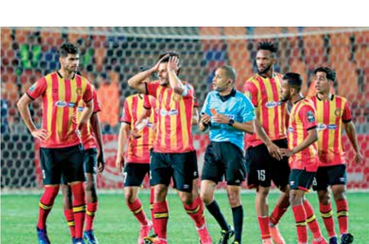
النجم المرشح البريز للجزر باللعب اتحاد دسوق

تترقب الجماهير عودة الدوري التونسي الممتاز لكرة القدم، مساء السبت، لإكمال الأسابيع المتخلفة من الموسم الحالي 2019-2020، بعد أن توقفت المنافسات في منتصف شهر مارس/آذار الماضي بسبب انتشار فيروس كورونا في البلاد، وجاءت كل التحاليل التي خضع إليها اللاعبين والأجهزة الفنية والإدارية والحكام والأسابيع الماضية، سلبية، وأبخت سلامتهم من فيروس كورونا بعد عمل جيد قامت به اللجنة الطبية للاتحاد التونسي