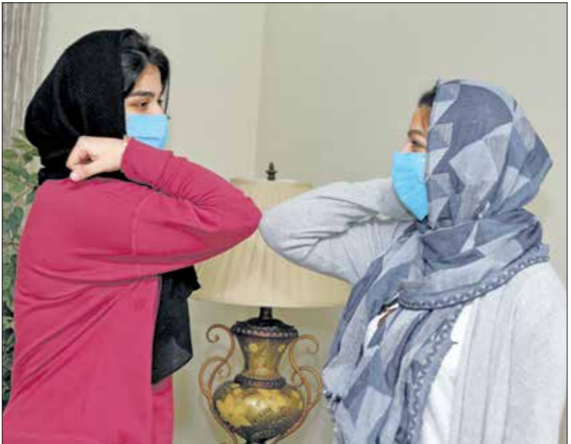
يجب مراعاة التوصيات الصحية للوقاية من كورونا خلال زيارات الصيد

فيهم؛ يجب ألا ننسى ما يميّز به مرضى كورونا والمشتبهه فيهم أو حتى المرضى الآخرون من ظروف نفسية وجسدية صعبة، وهم يقضون العيد بمعزل عن البشر، ويصارعون الإهم وحزנם الشديد بمرور العيد. لكن يمكننا التخفيف عنهم من طريق الاتصال بهم والتوافق عنهم إذا كان ذلك ممكنا بالنسبة إليهم، أو الدعاء لهم والاتصال بعائلاتهم للأطمئن.