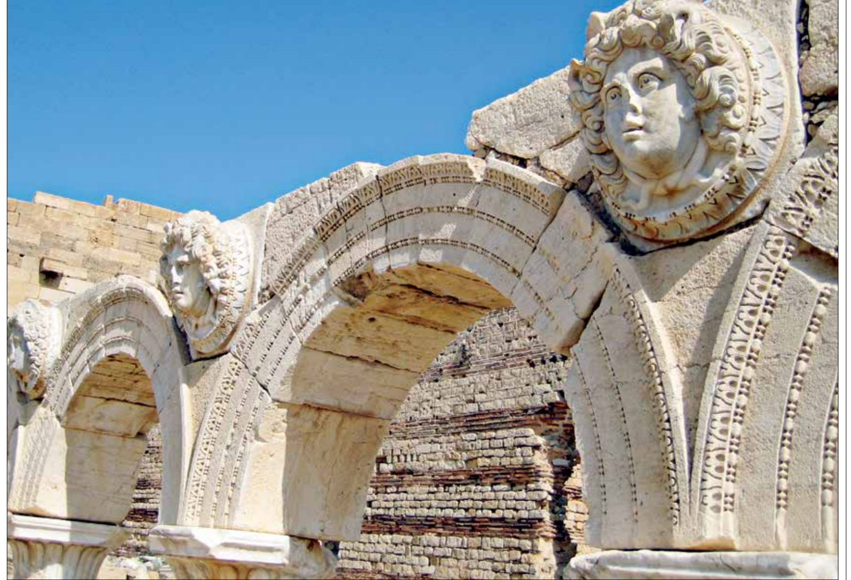
افواس ضمت اعصدة من ليديا او ليديا ليبيا (ويكيبيديا)

شارك فريق مانشستر سيتي الإنكليزي برفقة شركة «XYLEM» المتخصصة في تكنولوجيا المياه في حملة توعية للتخدير من نقص المياه في جميع أنحاء العالم. ومن خلال فيلم قصير وقال بنزيمة بعد فوزه بجائزة «لاعب خمس نجوم» التي يمنحها المشجعون «الفريق في حالة جيدة والآن لدينا وقت للعمل، نرغب في مواصلة تقديم نفس المستوى الذي ظهرنا به في الدوري وأن نفوز على مانشستر سيتي».