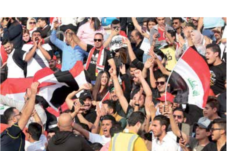
الجماهير العراقية تلم بلوغ منتخبها مونديال قطر

الذي اربك تحضير المنتخبات العراقية، التي تنتظرها استحقاقات مختلفة البرزها التصنيفات الآسيوية المزدوجة المؤهلة لمونديال قطر 2022، وأمم آسيا 2023. ومن المقرر أن يعاود المنتخب العراقي الأول لكرة