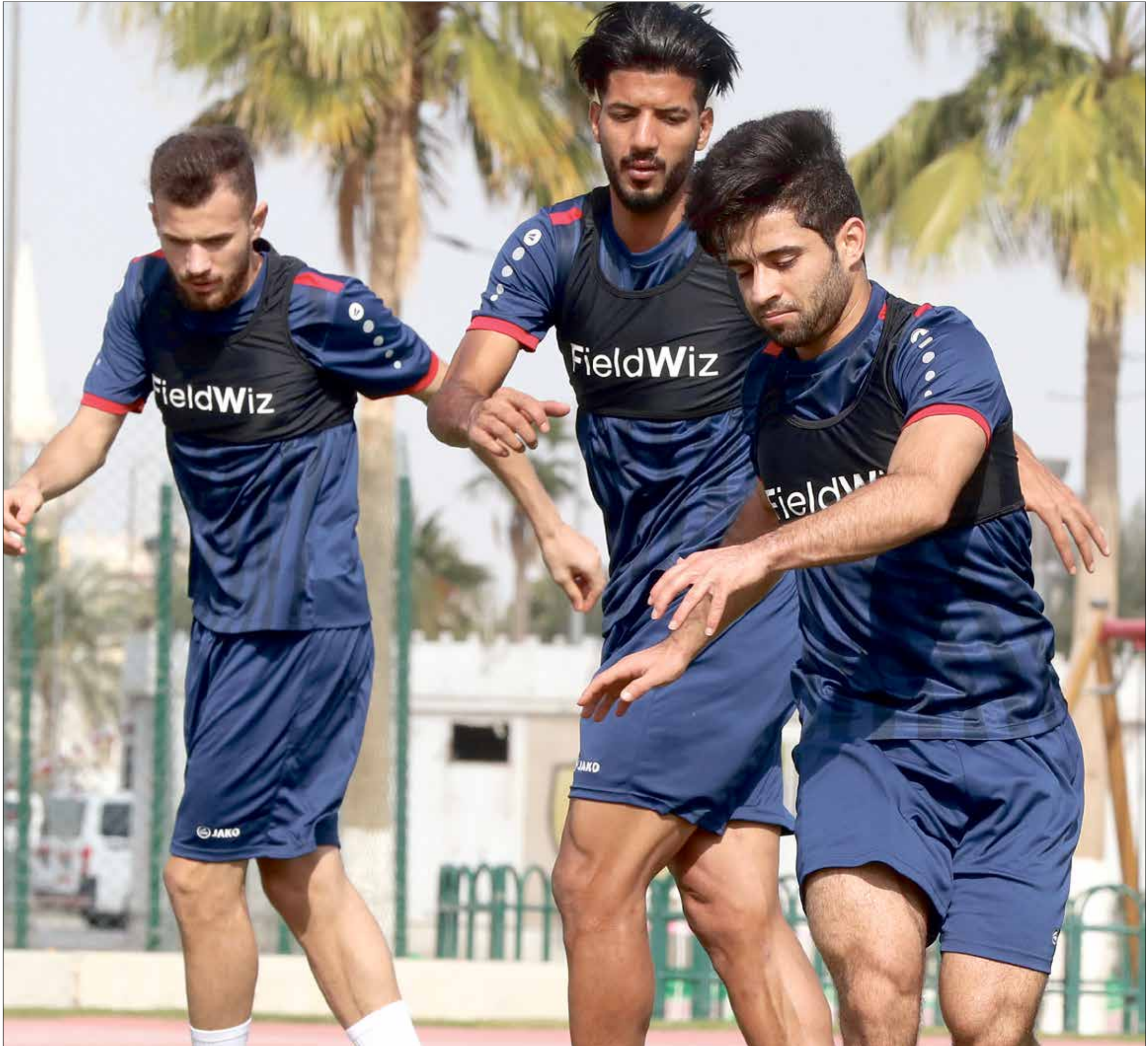
المنتخب العراقي يستعد للصفقات المزدوجة