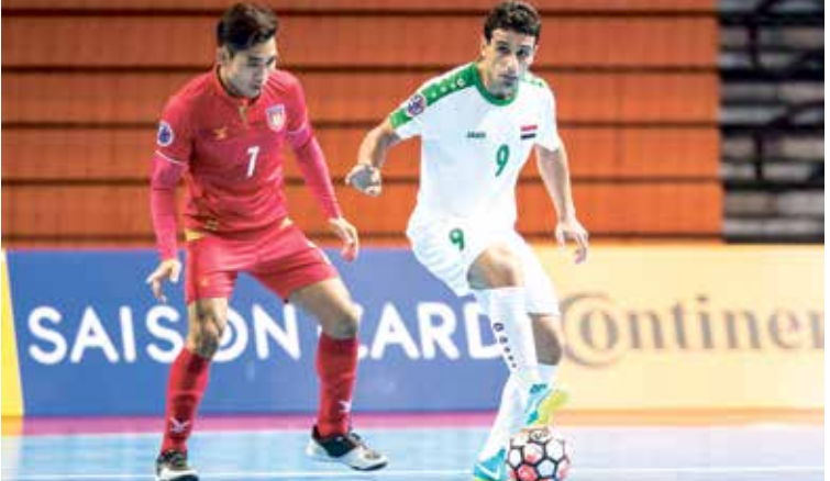
منتخب العراق للصالات سيخوض أول بطولة منذ أزمة كورونا

لخوض المباراة، بعد أن كشفت الفحوصات الطبية التي أجراها الأخير، عن إصابة عدد من لاعبيه بفيروس كورونا، الأمر الذي قد يربك تحضيراتهم للصفقات الآسيوية. وستكون المباراة في موعدا المحدد بالثامن من شهر أيلول/ سبتمبر المقبل في ملعب فرانسو حريزي بمحافظة أربيل.