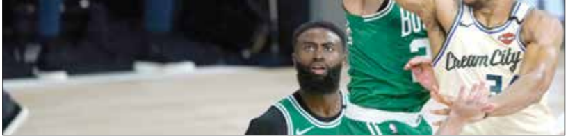
ميلووكي ياكس تحف فوزا بعدما بعد العودة

فرض نجم آخر نفسه بقوة في المباراة الأولى بعد العودة، هو جيمس هارذن، لاعب هيوستن روكتس. وقاد هارذن، أفضل لاعب في الدوري لموسم 2017-2018، فريقه إلى الفوز على دالاس مافريكس (153 - 149) بعد التمديد، بتسجيله 49 نقطة، مع تسع متابعيات وخماني تمريرات حاسمة.