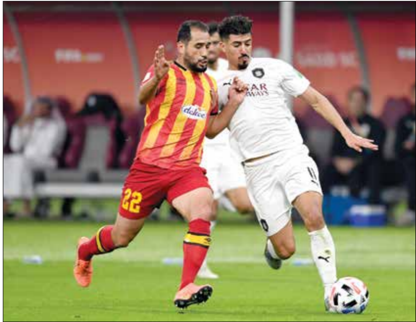
السد شارك في مونديال النخبة الخبز

يخطط نادي السد القطري للمنافسة على الألقاب المحلية ومسابقة دوري أبطال آسيا، لذا عمد إلى إبرام سلسلة من التعاقدات مع نجوم كبار لتعزيز صفوفه بالمرحلة القادمة