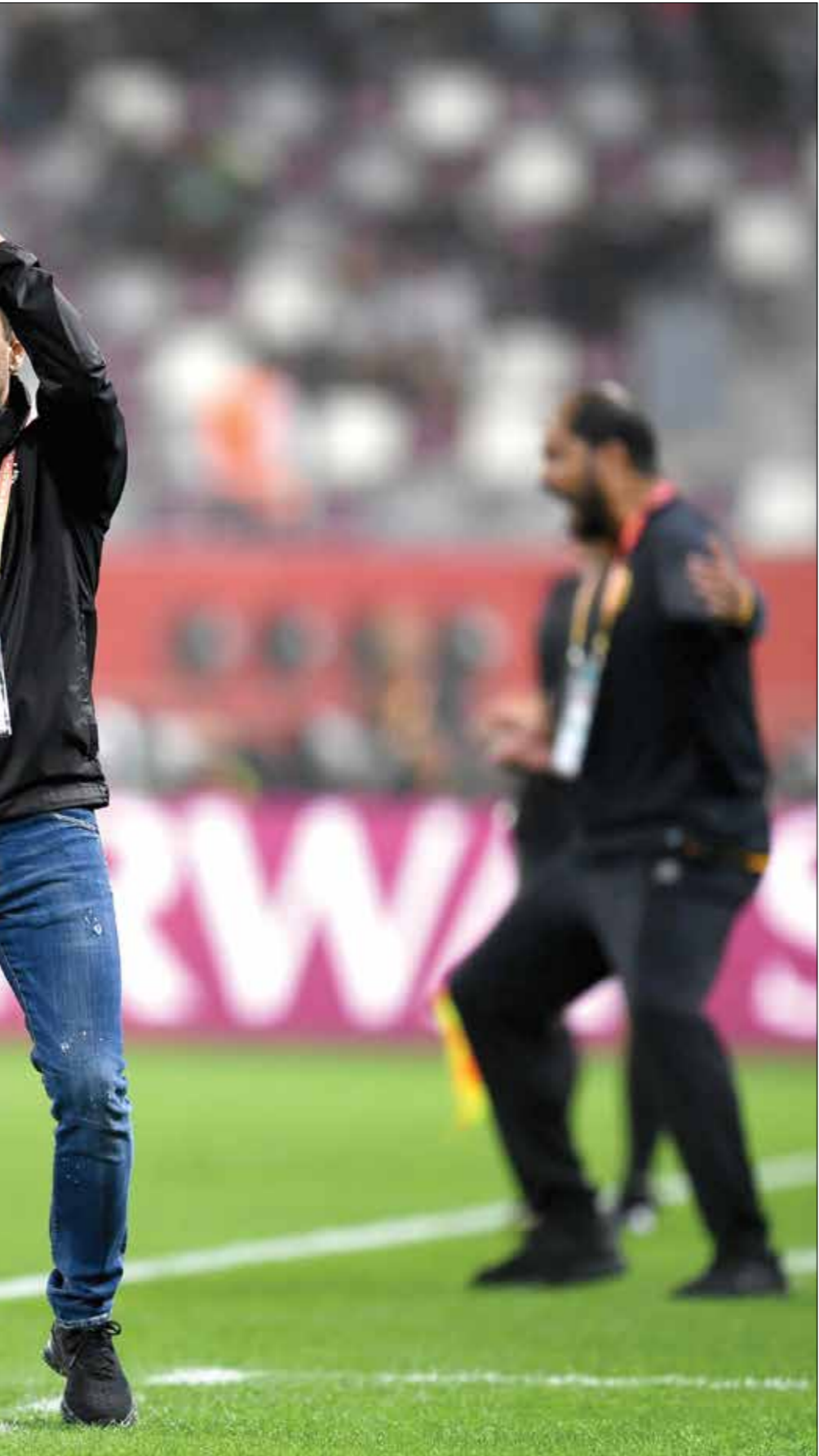
لسانغ اعلن تصافيه من كورونا