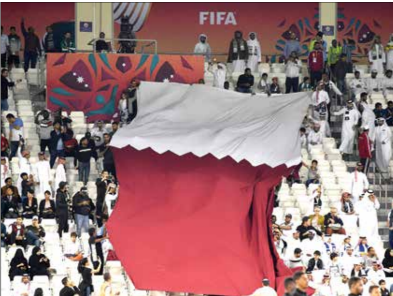
السد يمتنع بقاعدة جماهيرية كبيرة