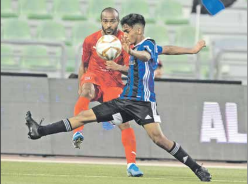
يتسكع السيلية بأمل المنافسة على البطاقة السوداء