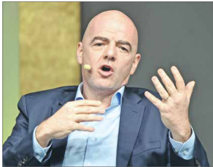
إنفانتينو رئيس الاتحاد الدولي لكرة القدم سيخضع فيمنه بجدا عن القرار

لاوبر وإنفانتينو بين عامي 2016 و2017 في الصحافة، بما في ذلك عن طريق «فوتبول الضحافة» لعدة أشهر بسبب طريقة تعامله مع تحقيقات فضيحة الفساد في الاتحاد الدولي والتي عرفت باسم «فيفاغيت»، وتم الكشف العديد من الشخصيات النافذة في عالم كرة القدم من الأخلاقيات