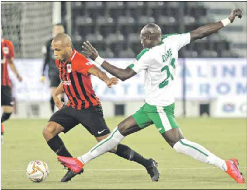
يعتمد الريان على نجمه الجزائري ياسين إبراهيمي