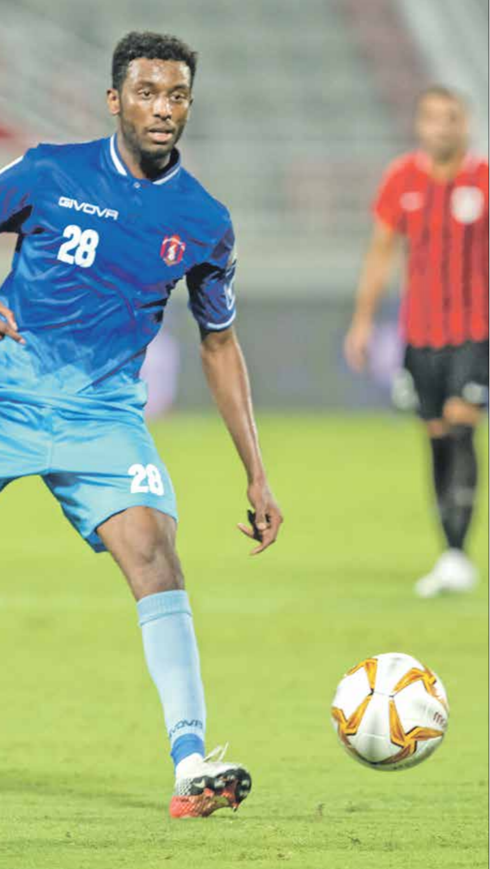
يخيم شبح الهبوط على نادي السيلية

ويملك نابولي أعلى نسبة استحواذ في منافسات «الكالتشو» بمتوسط 59% كما نفذ أكبر عدد من التمزيات التي تتولى مسؤولية في البطولة بواقع 22 ألفاً و 877 تمريرة دقيقة، متفوقاً على البطل يوفنتوس، وكل هذه الأرقام وفقاً لموقع فريق برشلونة الإلكتروني.