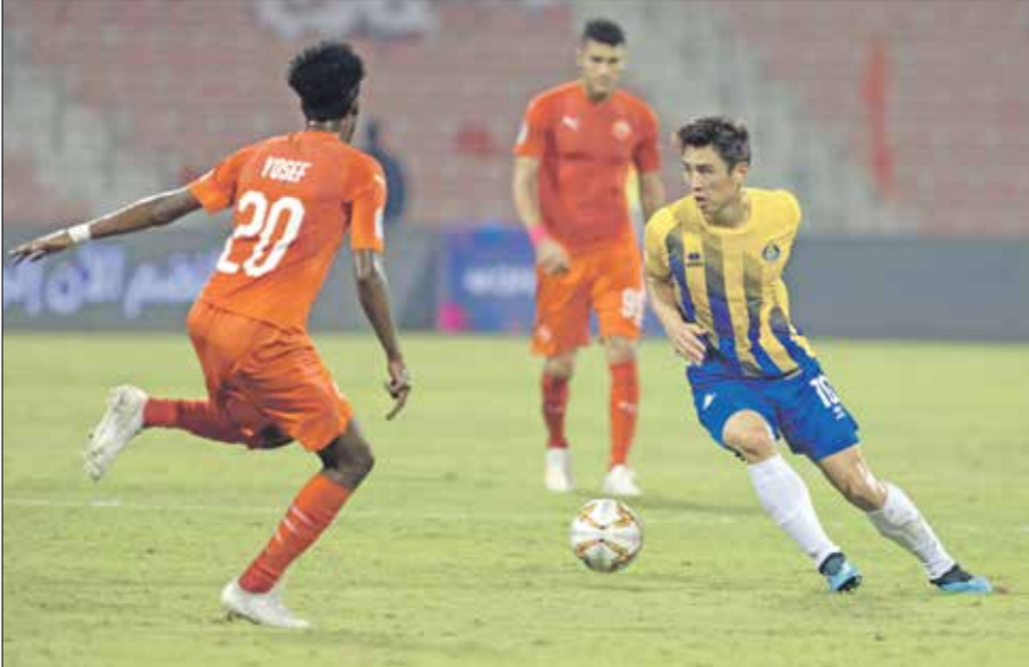
يطمح الغرافة للبقاء في المرتبة الرابعة

لهم الأمل في المنافسة على لقب الموسم الحالي، بدوره يطمح نادي الغرافة إلى الفوز على منافسه الخور في الأسبوع العشرين من دوري نجوم قطر، ونسيان الخسارة المؤلمة أمام الدحيل، لأن الفريق يواصل البقاء ضمن الأربعة الكبار، بعدما جمعد برصيده عند 31 نقطة، ولا يريد زئيف المزيد من النقاط. لكن الغرافة يعلم جيدا، أنه يواجه منافسة عنيفة من قبل ناديي العربي والسيلية، كونهما يحتلان المركزين الخامس والسادس