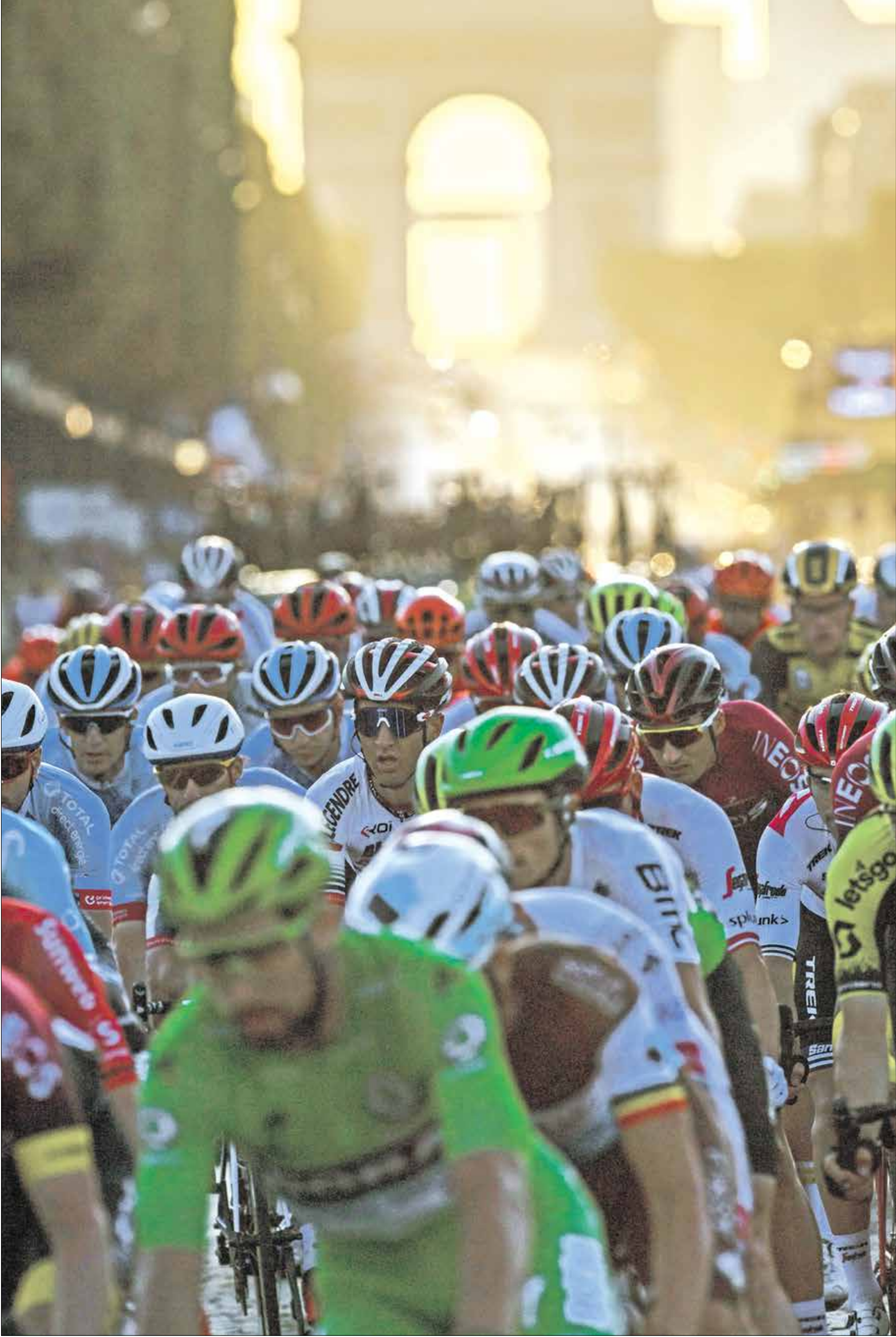
لم تنجح مساعي انطلاق السباق

كشف المنظمون الدنماركيون أنه تقرر تأجيل انطلاق سباق فرنسا للدراجات «الانطلاق الكبير» من الدنمارك إلى عام 2022. وتوصل المسؤولون عن تنظيم بداية السباق الشهير إلى اتفاق مع منظمة أموربي سبورت المسؤولة عن تنظيم السباق في فرنسا، يقضي بتأجيل استضافة الدنمارك أول ثلاثة أيام من السباق الكبير.