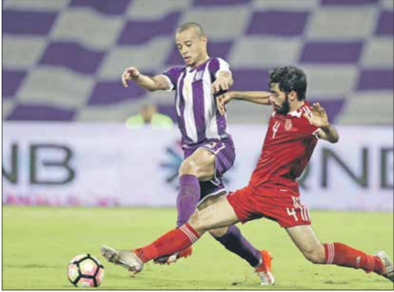
يريد العربي مواصلة التلحاح الجيدة في الدوري (تالو/الشرق) Getty