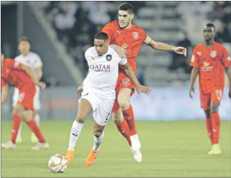
تلتظ السد مواجهة قوية امام الدحيل

تترقب الجماهير الرياضية القمة المرتقبة في الأسبوع العشرين من دوري نجوم قطر بين نادي الدحيل و منافسه السد، وأُعيِن الجميع على تحقيق النقاط الثلاث من أجل اللقب