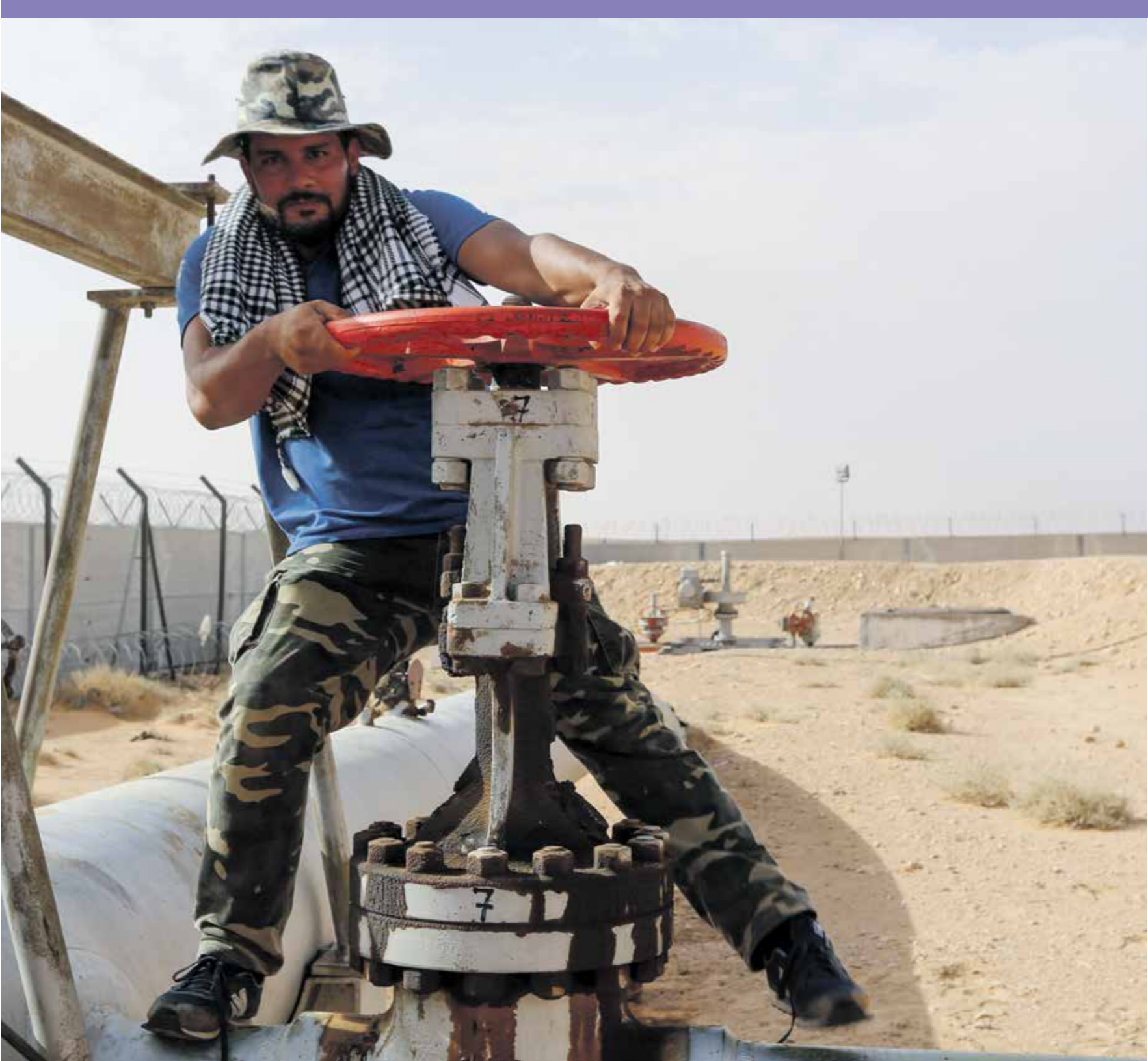
الأساق المحلي منالأمبود لا كيمبوا لصاحبيات التوسيب تلمضي لتحريرفرايس برين

إلى تخفيف الإغعاء في ظل تداعيات أزمة كورونا، ولا يشعر المواطنون بتراجع أسعار السلع والخدمات، ورغم تراجع التضخم لمدة شهر متوالية، وسجل التضخم في تونس تراجعها للشهر الثالث على التوالي إلى مستوى 5,4 في المائة خلال شهر أغسطس/ آب الماضي، بعد أن كانت في مستوى5,7