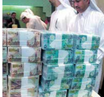
ارتفاع ودائع القطاع الخاص في البنوك بـكبرم خصمفرايس برين