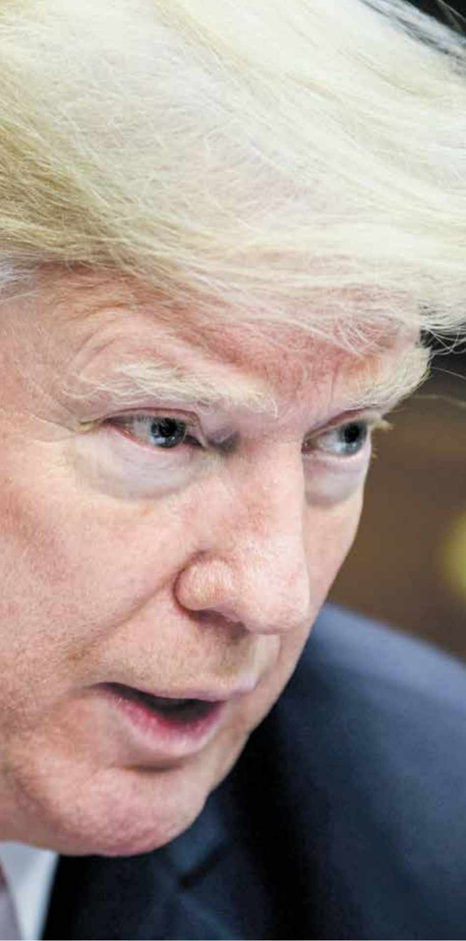
المواجهة بين بكين وواشنطن لم تنته، وشانغ ترايب

وحسب سينغ يك، رفعت المصافي الصينية كذلك مخزوناتها إلى 180 مليون برميل. وتستورد الصين نحو 70% من احتياجاتها