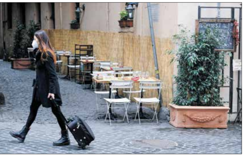
محاطع ربما خالية من الزائت

وإدى الصراع المستمر في ليبيا منذ عام 2011 إلى تكرار توقف إنتاج النفط في عدد من أهم حقول ليبيا النفطية، ولم يسلم من ذلك حتى حقل الشراة، الأكبر في البلاد، إذ قامت مليشيات مدعومة من قبل الجنرال حفتر بسد صمام خط الأنابيب الذي يربط حقل الشراة بمرافأ الزاوية النفطى، في تسبب في إغلاق الحقل. ودفع المؤسسة الوطنية للنفط إلى إعلان حالة الفاقة القاهرة بشأن عمليات في منطقة رأس لانوف، كما الإغلاقات المتكررة للمنشآت النفطية لليبيا ما يتجاوز 135 مليون دولار منذ عام 2014. كذلك تضررت خزانات النفط جراء المعارك في أكثر من موقع، ما أدى إلى تدمير نحو 3 خزانات نفطية في منطقة رأس لانوف، كما تضررت خزانات النفط في البريقة، وسط ليبيا، ويبدو صراع بين المصدق الكبير محافظ البنك المركزي الليبي ومصطفى صنع الله رئيس شركة النفط الوطنية الليبية، إذ يتهم الكبير صنع الله بإخفاء نحو 3,2 مليارات دولار من إيرادات النفط وعدم إيداعها في حسابات البنك المركزي.