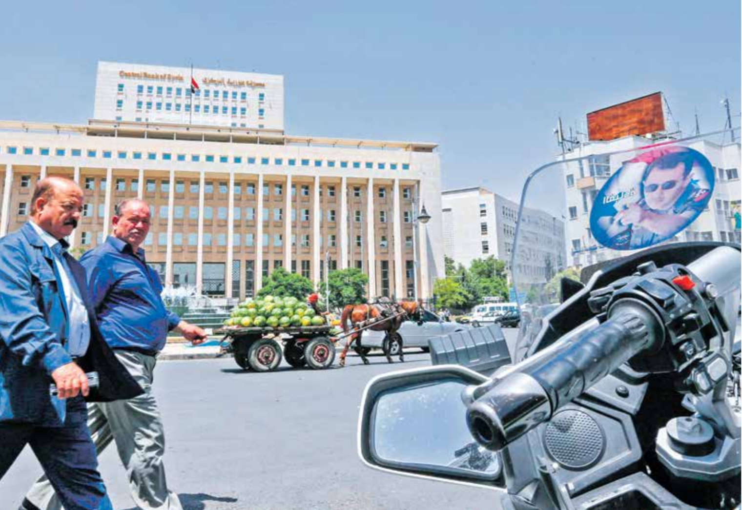
المصرف المركزي السوري، ضم كميات كبيرة من الدولارات في السوف في الأيام الأخيرة لبيع بقلوبفرايس برين

ارتفاع سعر العملة المحلية إلى 2600 ليرة مقابل الدولار