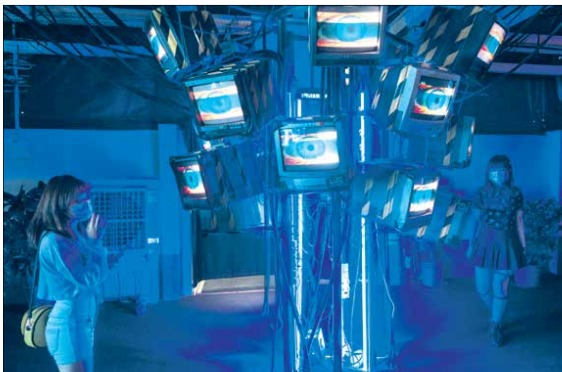
رقابة في مكان

تشويه السمعة: في أكتوبر/تشرين الأول الماضي، كشفت تقارير أنه تم إنشاء صور عارية مفبركة لأكثر من 100 ألف امرأة من صور وسائل التواصل الاجتماعي