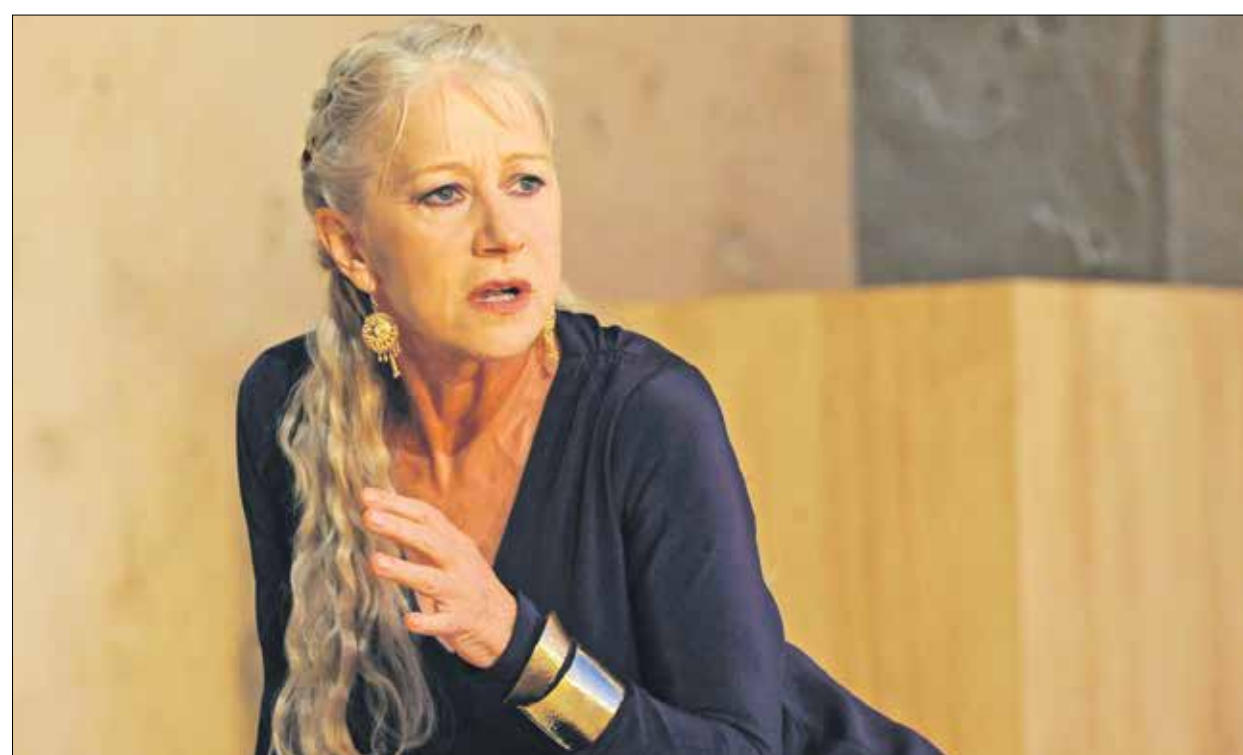
تضم المسرحيات اصملا لهيلين ميرين (يمين/جيتي)

مجال الإنتاج الثقافي، ودعا التقرير إلى توفير حوافز وتسهيلات ضريبية للقطاع، أبرزها خفض نسبة الضريبة على القيمة المضافة على الذّاكر في السنوات الثلاث المقبلة، وكانت المسارح البريطانية، البالغ عددها نحو 1100، تستخدم نحو 290 ألف