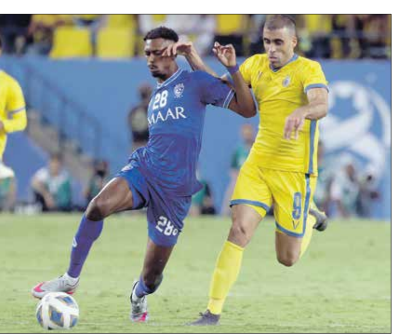
النصر والهلال يسعيان لتلاعبة بطلتهما وحصد اللقب

مضيقاً «قبلت التحدي لأن الهلال لديه إمكانيات عالية»، ستكون الأضواء مسلطة على اللقاء، والتي جعلتها بعيدين عن المنافسة أيضاً على اللقب، وبالتحديد الأهلي الذي يبقى لقب كأس الملك هو الأمل الوحيد له في أوقات موسمه. وقد تكون هذه المواجهة الأخيرة بين فهد بالمل، وسيحاول الفريقان تعويض