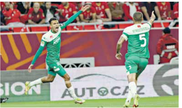
الرجاء حقق الفوز على وفاق سطيف

المثيرة تصوير من داويز ألفرمة في المجموعة الأولى برصيد 4 نقاط، والرجاء المغربي مستصراً للمجموعة الثانية بـ 3 نقاط، والترجي التونسي متصدراً للمجموعة الثالثة بـ 3 نقاط، وأخيراً بترو اتلتكو الأنغولي متصعداً للمجموعة الرابعة بـ 4 نقاط. وتوتعت ردود الأفعال الخاصة بالمدرسين والمسؤولين في مختلف الأندية العربية عقب نهاية الجولة الثانية، ما بين سعادة وإرتياح بنتائج التي تم تحقيقها، واحباط شديد لآخرين من النزف، وقال الفرنسي باتريس كارتيرون، المدير الفني للژیالك أتادل بصعوبة مع ساغرادا سيرساا الفونين