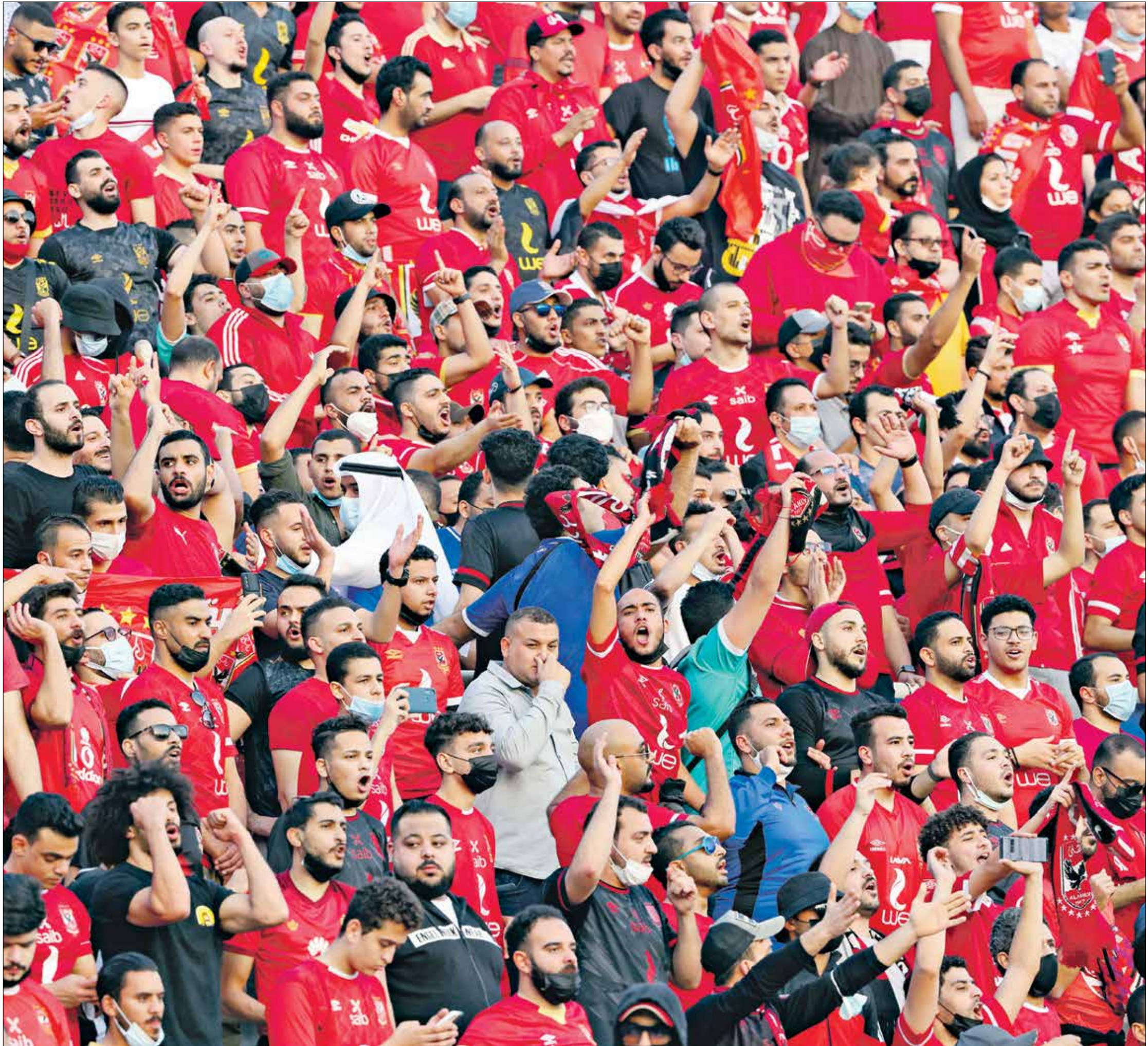
الأملين المصري اكثف بالتعادل مع الهلال السوداني

ومن جانبه، أكد جواو موتا، المدير الفني للهلال السوداني، حزنه على التعادل مع الأهلي المصري، وقفدان نقطتين على ملعبه في سياق المجموعة الأولى، وقال: «قدمنا مباراة رائعة، كنا الأكثر تنظيما في الملعب،