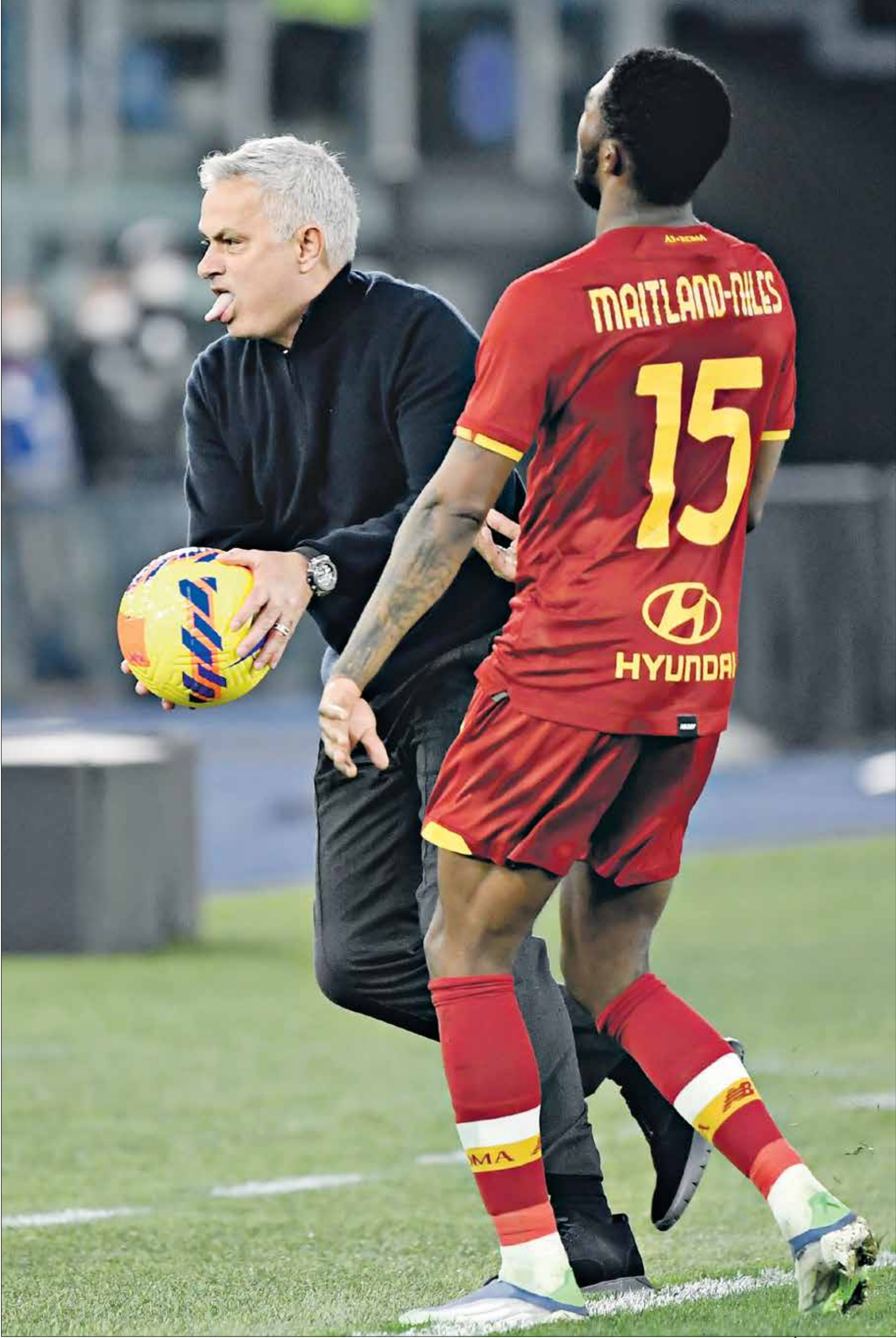
مورينيو فقد اعصابه وطرد للمرة الثانية هذا الموسم