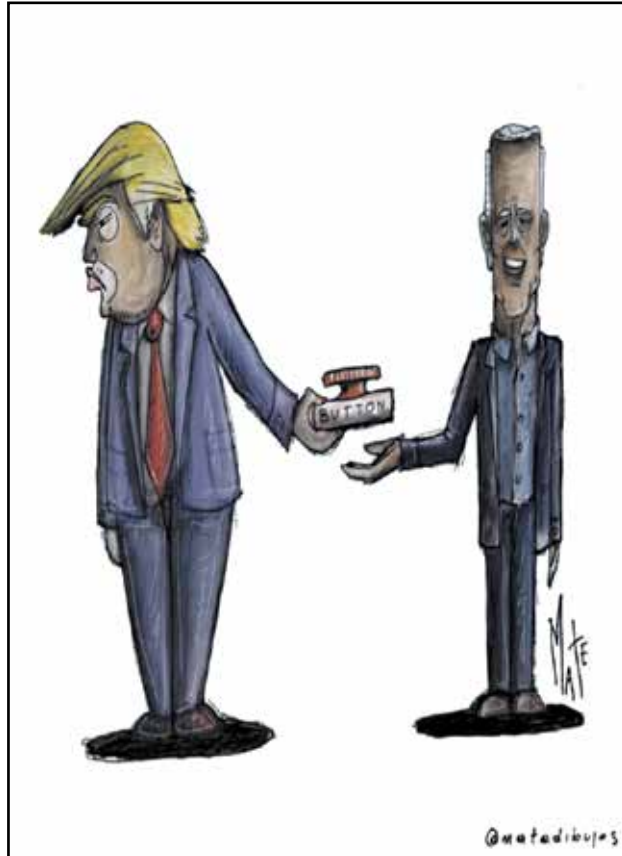
ترامب المهرج الحزين يسلم الزر النووي لبايدن (ماتياس ليخيدا، كار تون موفمنت)