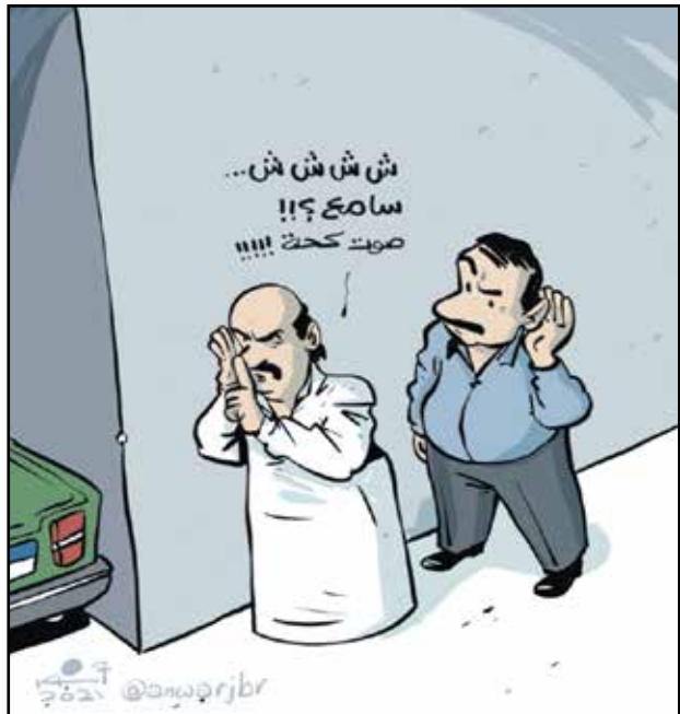
رعب كورونا في مصر