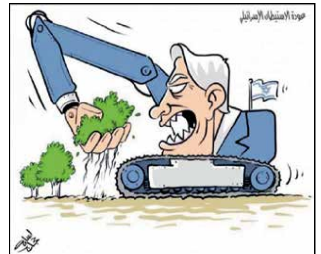
الاستيطان الإسرائيلي (اسامة حجاج، فيسبوك)