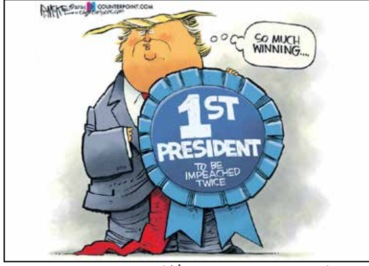
ترامب مع شهادة أول رئيس أميركي في التاريخ يُخثّ عزله مرتين (ريك ماكاي، كيغل كار تونز)

عندئذ، خرج الزعيم من الاجتماع محموشاً، وكان أول أمر أصدره: «يخصّص اللقاح كله للمعارضين المحكومين بالإعدام».