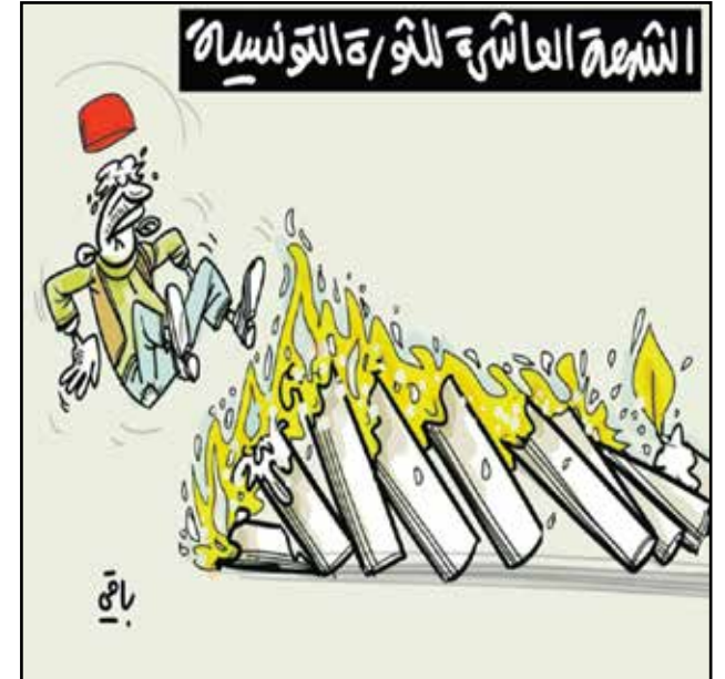
الشمعة العاشرة للثورة التونسية تشعل ثورة