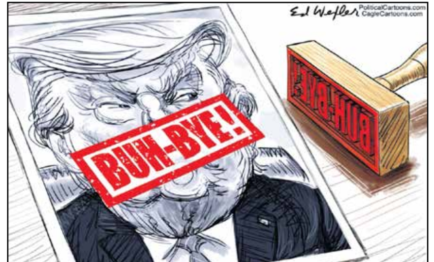
وداعاً للتم الجعد المجوف (اد واكسلار، كيغل كار تونز)

حفل مشهد الرسوم الساخرة عالمياً بوداعية ساخرة لحبيب رسامي الكاريكاتير وملهمهم الأول في السنوات الأربع الماضية، الرئيس الأميركي المنتهية ولايته دونالد ترامب. فمن خلال شكله وفعله وقوله وعمله، قدم الألف الأفكار الساخرة بطبيعتها لرسامي الكاريكاتير، وعلى كثرة مبغضي هذا الرئيس البرتقالي، فإن رسامي الكاريكاتير سيفقدون ترامب حتماً. إليكم باقة منتقاة من رسومات كاريكاتير تصف نهاية ولاية ترامب.