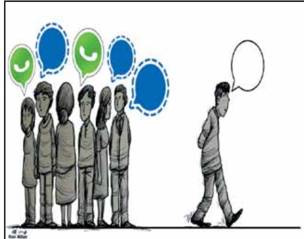
ما بين واتساب وتيلغرام (هاني عباس، فيسبوك)