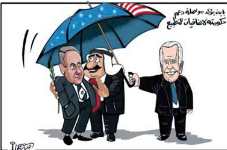
جو بايدن يواصل دعم اتفاقيات التطبيع