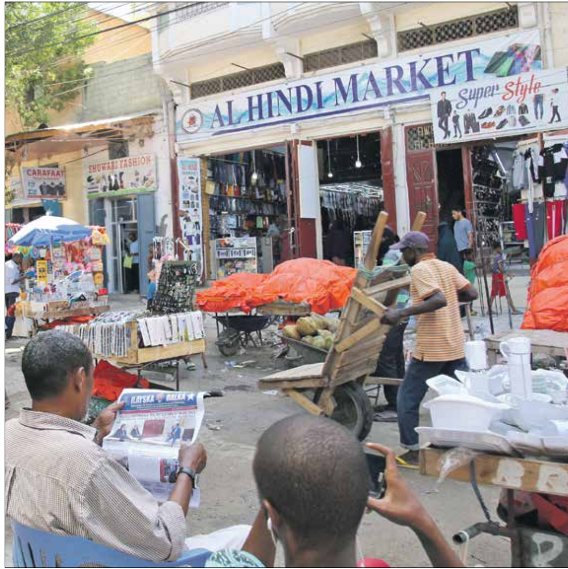
لم يعد للإعلام التقليدي مكان في خطابات المرشحين، خاصة الصحف الورقية

يُذكر أن الصومال من بين أوائل الدول الأفريقية التي دشنت فيها الإعلام الإلكتروني عام 1998؛ كما انتشرت خدمة الإنترنت بشكل واسع؛ إذ باتت متاحة في القرى والأرياف. وبيع الغيغابايت GB الواحد بدولار أميركي، هذا إلى جانب سرعة الإنترنت التي تتماز بها الخدمة في الصومال، بفضل المنافسة بين شركات الاتصال المملوكة من القطاع الخاص. وبحسب مراقبين، فإنه من الممكن أن تشهد مواقع التواصل الاجتماعي في المرحلة المقبلة حملات إعلامية مكثفة وعباية انتخابية. لكن البعض يحذرون من إمكانية أن تنسرب أخبار وحملات مغرضة ضد بعض المرشحين للانتخابات، وهو ما قد يؤدي إلى بروز نزاعات واستقطاب حاد بين المرشحين، مما يؤدي بدوره إلى مشاكل سياسية وأمنية في البلاد قبل أن تبدأ المعركة الحقيقية للانتخابات.