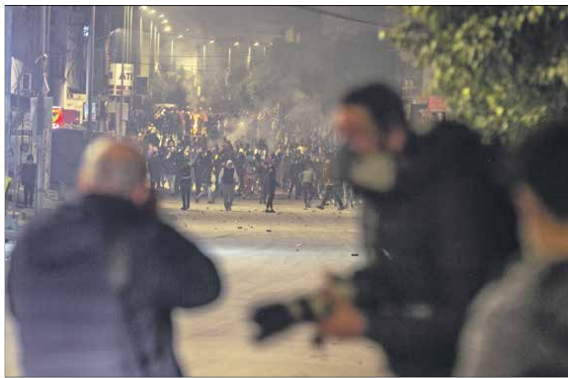
منه الاحتجاجات في حي التضامن في العاصمة التونسية

تشهد العديد من المدن التونسية منذ أيام تحركات احتجاجية ليلية نتجت عنها صدامات بين الشباب المحتج والأمن التونسي أدت إلى إيقاف العديد من المحتجين أو «المشاهدين». وساد انقسام في التسمية والتغطية وفي ردود الفعل على الأحداث. الإعلام التونسي الذي كان كعادته حاضراً في تغطية الأحداث بصورة آنية ويومية، كان عرضة للانتقادات. إذ أثارت التغطية ردود فعل متباينة من قبل بعض الأحزاب السياسية والوجوه السياسية المعروفة في تونس، مثل رفيق عبد السلام، وزير الخارجية التونسية الأسبق في حكومة الترويكا الذي اعتبر أن تغطية هذه الأحداث من قبل وسائل الإعلام التونسية ومراسلي وسائل الإعلام العربية والأجنبية لم تكن موضوعية بل منحايزة «للمشاهدين والفوضويين». وهو رأي شاركه فيه بعض الناشطين في «ائتلاف الكرامة»، ومنهم النائب محمد العفاس، الذين اعتبروا أن «التغطية الإعلامية زادت في توتر الأجواء»، خاصة من طرف مراسلي بعض القنوات العربية، وخاصة قنوات «العربية» و«سكاي نيوز» و«العغد»، ووسائل الإعلام المحلية مثل القناة الأولى بالتلفزيون الرسمي التونسي وإذاعة «شمس أف أم». النقابة الوطنية للصحافيين ردت في بيان لها، نشرته الاثنين، على هذه الانتقادات الموجهة للصحافيين التونسيين والتي شاركت فيها صفحات عدّة على مواقع التواصل الاجتماعي المحسوبة على بعض الأطراف