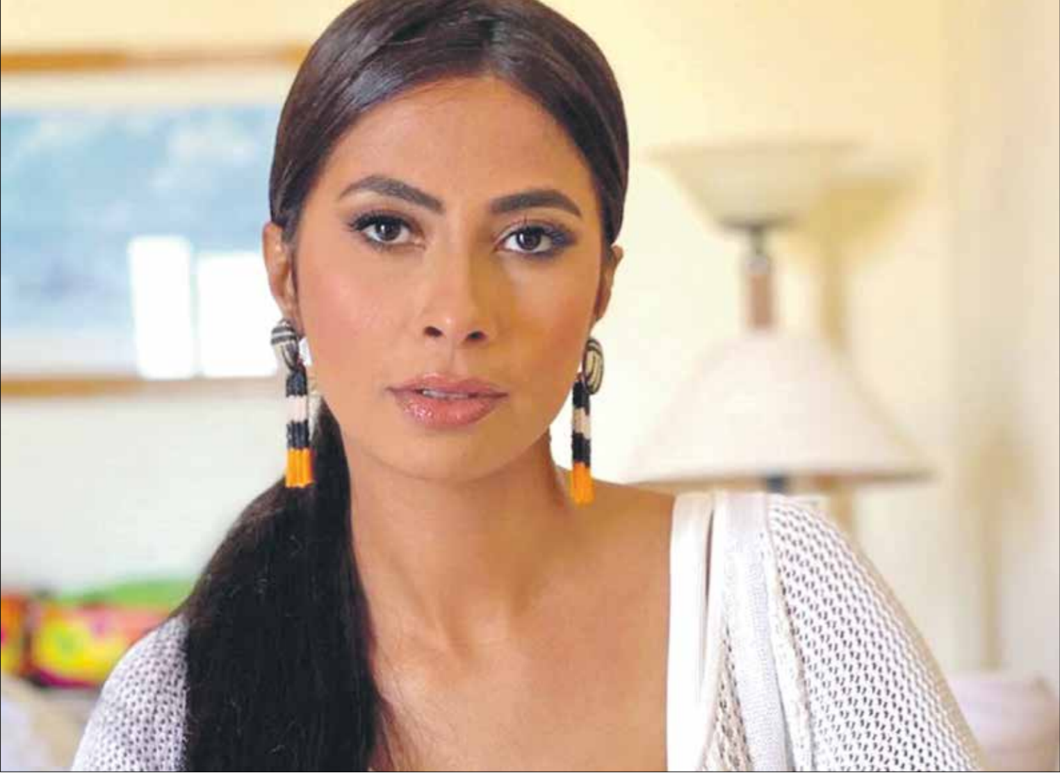
تعود روبى ربيع إلى قضاء يومين بتصنع ستاغيلات (ميسونلا)

كما تُصمّر السلسلة على إظهار العنف في المجتمعات الهيسبانية، وهذا، فلنغد إلى المشهد السابق إلقاء القبض على راميريز من قبل السكان المحليين، حقيقةً، استطاع النظام أن يجعل اهالي الأحياء أمتداداً ومعاونين له؛ لأنه، عبر وسائل إعلامه، اعتمد خطاباً يصمّر