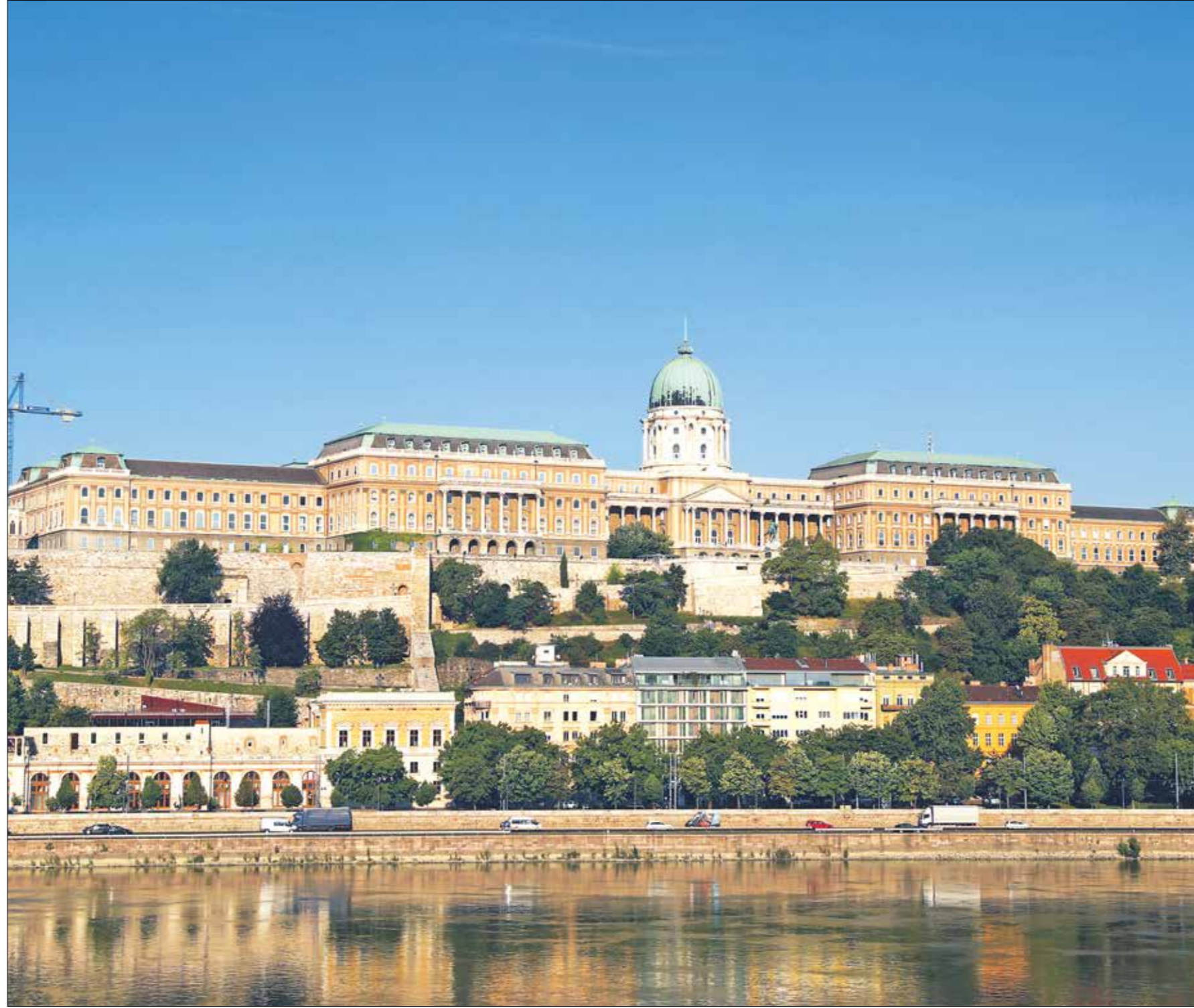
قصر «بودا» من المعالم السياحية المُتميزة في بودابست