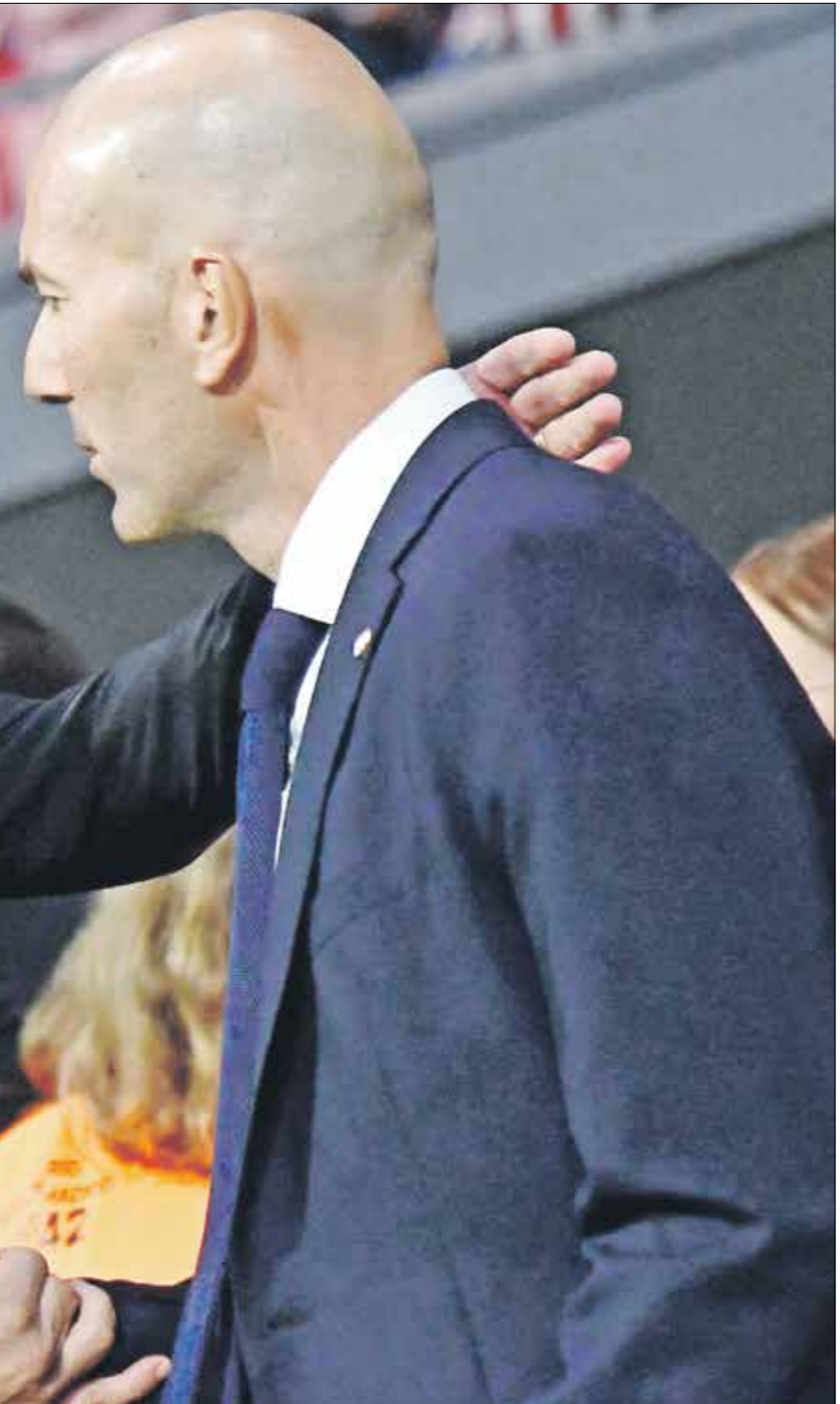
لويس سواريز، مدرب ريال مدريد

يعد أنطونري تايلور أحد أشهر الحكام في القارة الأوروبية. بعدما فرض نفسه في الدوري الإنكليزي الممتاز، وأصبح يشرف على إدارة أقوى الواجهات في «البريميرليغ». خلال السنوات الماضية، ما جعله يدخل إلى دوري الأبطال، وغيرها من المسابقات الكبيرة. بدأ الحكم أنطونري تايلور حياته مع كرة القدم في عام 1995. عندما كان يلعب مدافعا لأحد الأندية الصغيرة في إنكلترا، ويرافق والده لشاهدة المباريات. ولأحظ حكم إحدى الواجهات وأحب القيام بدوره. لذلك أصر على دخول هذا المجال الصعب. وانطلق تايلور في رحلته مع التحكم. عندما كان يدبر الواجهات بين أندية الهواة، واستطاع صقل مهارته بشكل كبير. لأنه أحب كرة القدم بطريقته الخاصة، التي يرغب بها بأن يصبح حكما وليس لاعبا، مما دفعه إلى الاستماع لجميع النصائح والملاحظات من قبل الجميع وبخاصة من والده. وتدرج تايلور في إدارة الواجهات بدوريات الهواة، حتى وصل إلى «البريميرليغ» في عام 2010، عندما أصبح حكما رسميا لمباريات دوري الإنكليزي الممتاز. وأشرف على مواجهة فولهام التي فاز فيها على بورنسموث بهدف نظيف في شهر فبراير/ شباط من نفس السنة.