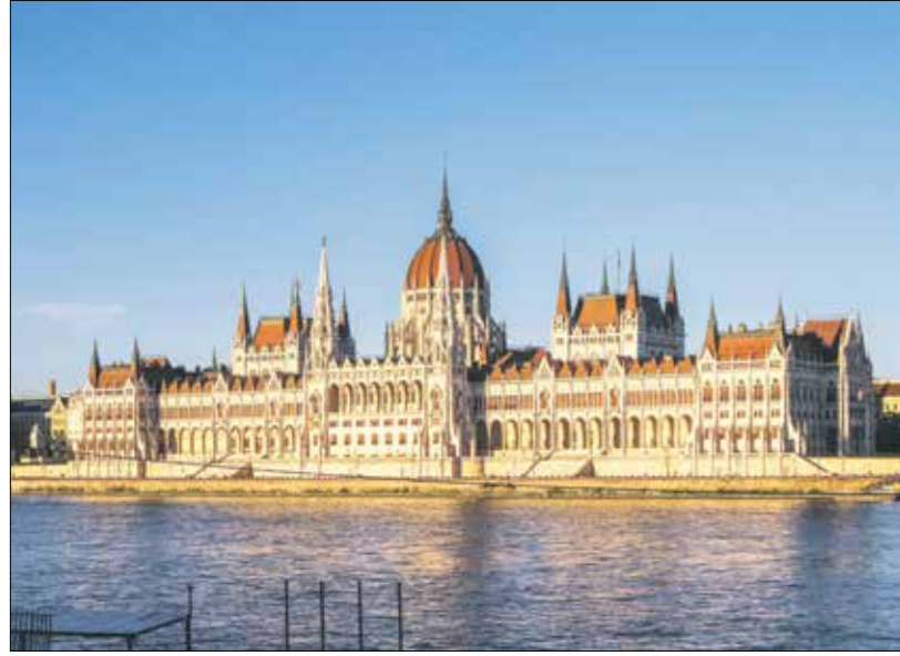
قصر البرلمان المجرى