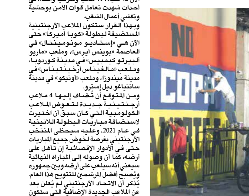
ائضا كولومبيا من استضافة المباريات

وأعلن إعادة جدولة مباريات البطولة، بما في ذلك المباراة النهائية، التي كان من المقرر أن تقام في أربعة ملاعب في الدولة الواقعة على جبال الأنديز. وأكد اتحاد «كونميبول» أن النسخة من 47 البطولة ستقام في الموعد