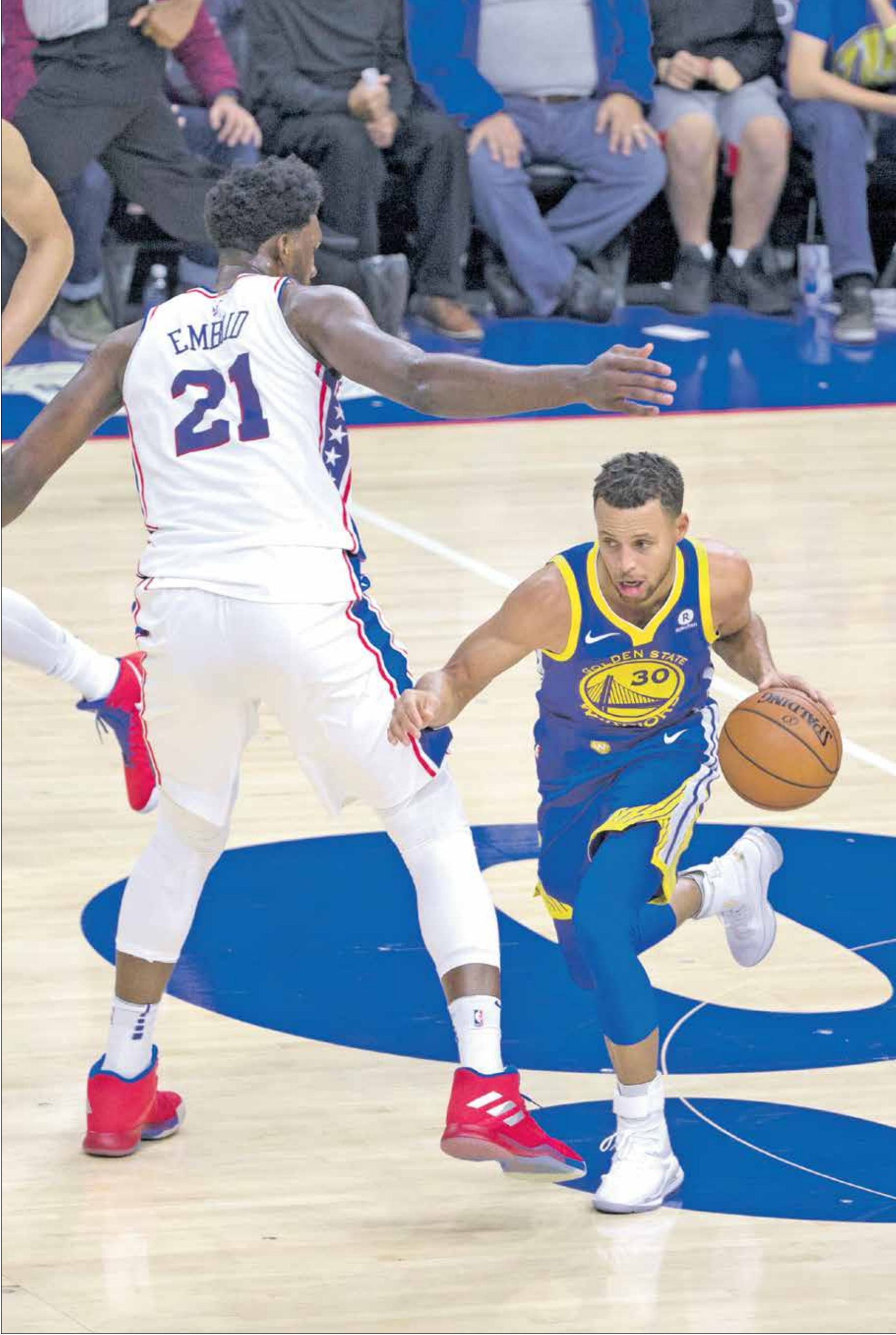
هل يحصد كورن الجائزة في عام 2021؟

اختير ستيفن كورن كأفضل لاعب في الدوري المنتظم لكرة السلة الأميركية للمحترفين ضمن لائحة ضمت الصربي نيكولا يوكيتش والكامبروني جويك إمبيد في أول ترشيح لهما على جائزة «أفضل لاعب» لموسم 2020-2021، وذلك بحسب ما أعلنت رابطة الدوري.