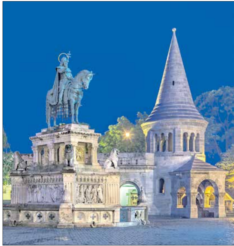
جسر «الصيداي» الشهير على نهر «الدانوب»

كل السكك تؤدي إلى بودابست، وهناك ثلاث محطات أساسية للقطارات وهي «بودابست» والذي يبعد عن وسط المدينة حوالي 20 كيلومتراً، وإلى جانب المطار الرئيسي هناك مطارات بدلية، مثل (مطار فيينا ومطار براتيسلافا)، والاتصال بين بودابست والنقل بعيداً عن وسط المدينة، والتي تُسهل أيضاً عملية النقل من الملب إلى كل أحياء المدينة.