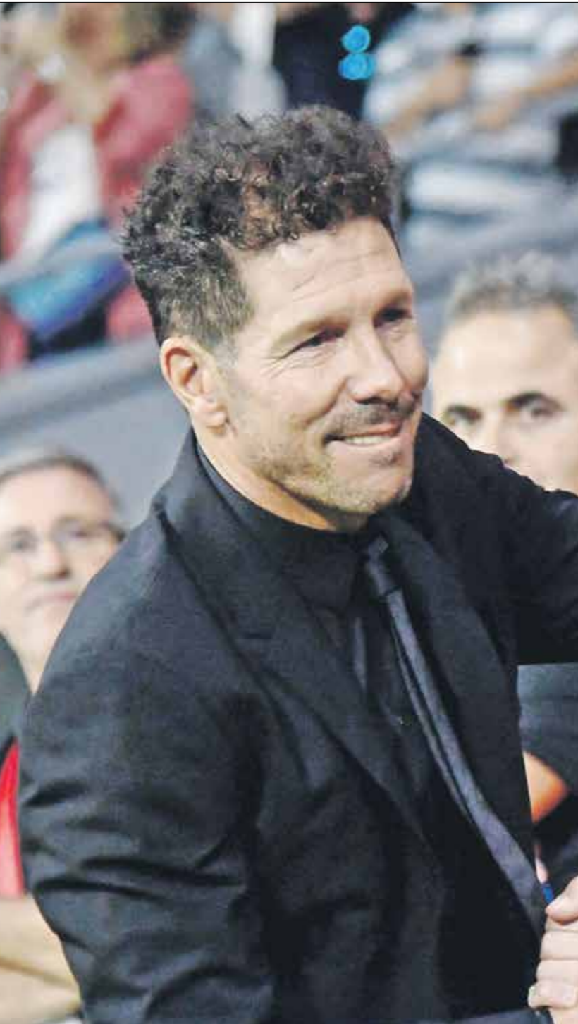
لويس سواريز، مدرب ريال مدريد

قد تشهد تجمعات جماهير الريال بحال تتويج فريقهم. قبرت السلطات الإسبانية التحضر لاحشواء نزول الجماهير إلى الشوارع والساحات، وذلك لمنع التجمعات الكبيرة في ظل استمرار جائحة كورونا في البلاد والعالم.