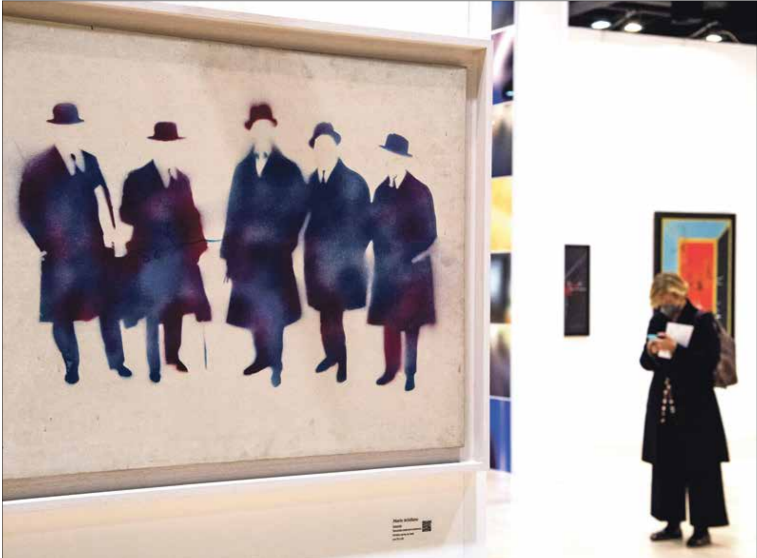
يقام الحدث في صيد لوفولا

يمكن اختصار واقع المسلسلات العربية الفصيرة بموضوع واحد، هو «الجريمة» حكايات عربية تسعى بكل ما أوتيت من طاقة إلى مناصرة منصّة «تفليكنس» التي تعمل على مجموعة خاصة من هذا النوع، يتجه المبتجون في العالم العربي دائماً إلى محاولة في تقليد الغرب، والعمل على مناصرة هذا المعلق بقوّة. وفي الماضي، حاول بعض المنتجين العرب الاستمرار بأفلام «الأكشن» في إطار مكرّر لمفارقة الأقدام الأميركية التي لا تزال تستخدم على الأسلوب لجهة الحضور والتفاعل في جميع أنحاء العالم. لم يعط الجمهور العربي النّقة كاملة لمنجّي الأفلام، بخلاف ما هو حاصل اليوم، قبل سنوات، دخل المتابعون إلى عالم المصنّات، ومتابعة أبرز الإنتاجات الفنّيّة والترفيهية هناك مقابل اشتراكات مالية شهرية وسنوية تعزّز حضورها. النوع من المعروف وتفاعل الناس مع عالم الإنترنت، وتاهب العالم العربي لدخول