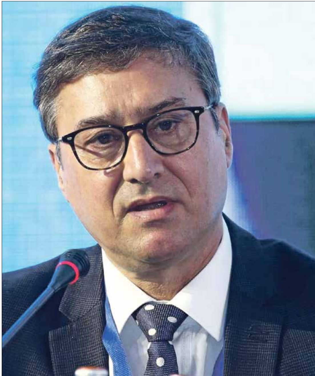
عمله في جريدة الاتحاد الاشتراكي ثم كمراسل لوكالة الأنباء الإسبانية (العربي الجديد)

من الطبيعي أن يكون الأمر على هذه الشاكلة، ونحن في السنوات الأولى لهذه التجربة، وعلينا أن نثبت أنها مؤسسة تقدم قيمة مضافة للصحافة، في المغرب. ورغم ظروف التأسيس، حيث لم تكن تتوفر على مقر وإمكانات، وكنا مكبلين الأيدي بغياب نظام داخلي، يسمح لنا بالعمل، ورغم أننا بعد تجاوز هذه العقبات، واجهنا ظروف الجائحة، إلا أن المجلس تقدم في العديد من الواجهات، من بينها حرصه على تنظيم الولوج للمهنة، حيث تطور باستمرار ضبط شروط الحصول على بطاقة الصحافة، كما أنه اتخذ قرارات وأصدر أحكاماً في قضايا معروفة عليه، في الأخلاقيات والمنازعات بين الصحافيين ومالكي المؤسسات، ونظم المجلس عشرات الورش التدريبية في مختلف المدن المغربية، كما أنجز دراسات حول القطاع، تهم الصحافيين والمقاولات، وهو مقبل على تفعيل اتفاقيات للتعاون مع منظمات مغربية ودولية، تشمل مجالات اختصاصه، وهناك العديد من الأمثلة التي يمكن تقديمها، في مبادئ العمل الإشتعاعي، أهمها الندوة الدولية التي نظّمها بطنجة، في نوفمبر/ تشرين الثاني 2019، لأهم مجالس الصحافة في العالم.