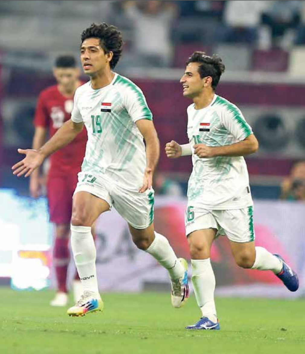
مطلب المراف حصد لقب كأس العرب 4 مرات