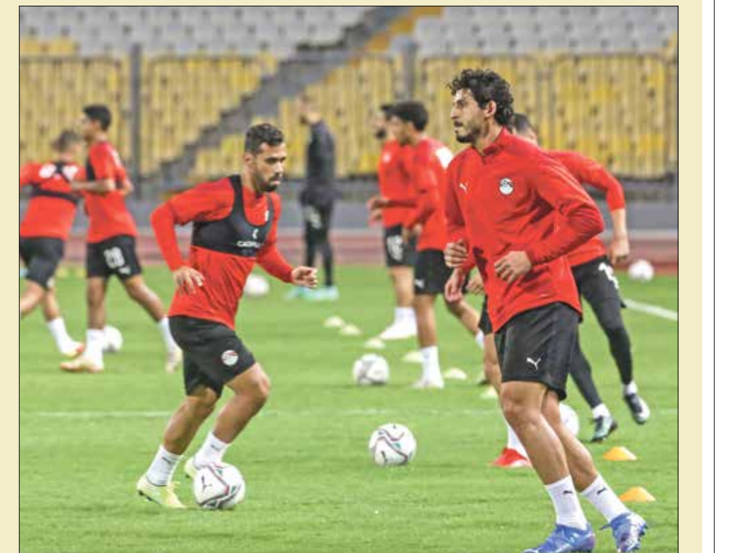
لجوم كثر استلحموا من قائمة كأس العرب