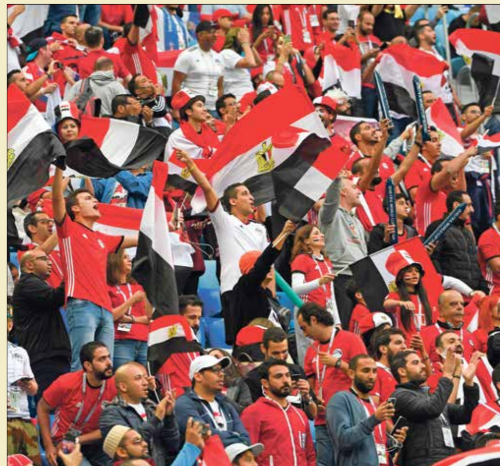
الحماهير المصرية سحضر بقوة في كأس العرب

نجم كرة قدم عراقي لعب في مركز المهاجم، تواجد ضمن قائمة «أسود الرافدين» ببطولة كأس العرب 2012، التي أقيمت في السعودية، ونجح في حصد وصافة ترتيب الهادفين برصيد 3 أهداف. مثل نادي الإسماعيلي المصري، وانتقل بعدها للعب في نادي الشارقة في