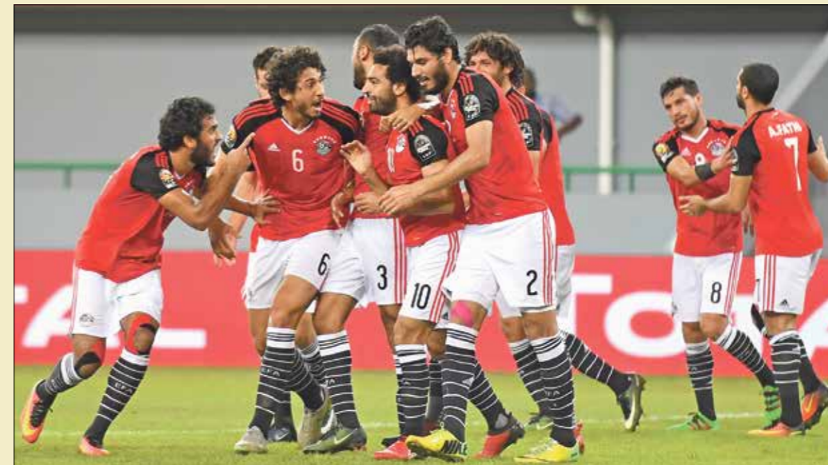
مطلب مصر بلغ التصفيات النهائية للمونديال