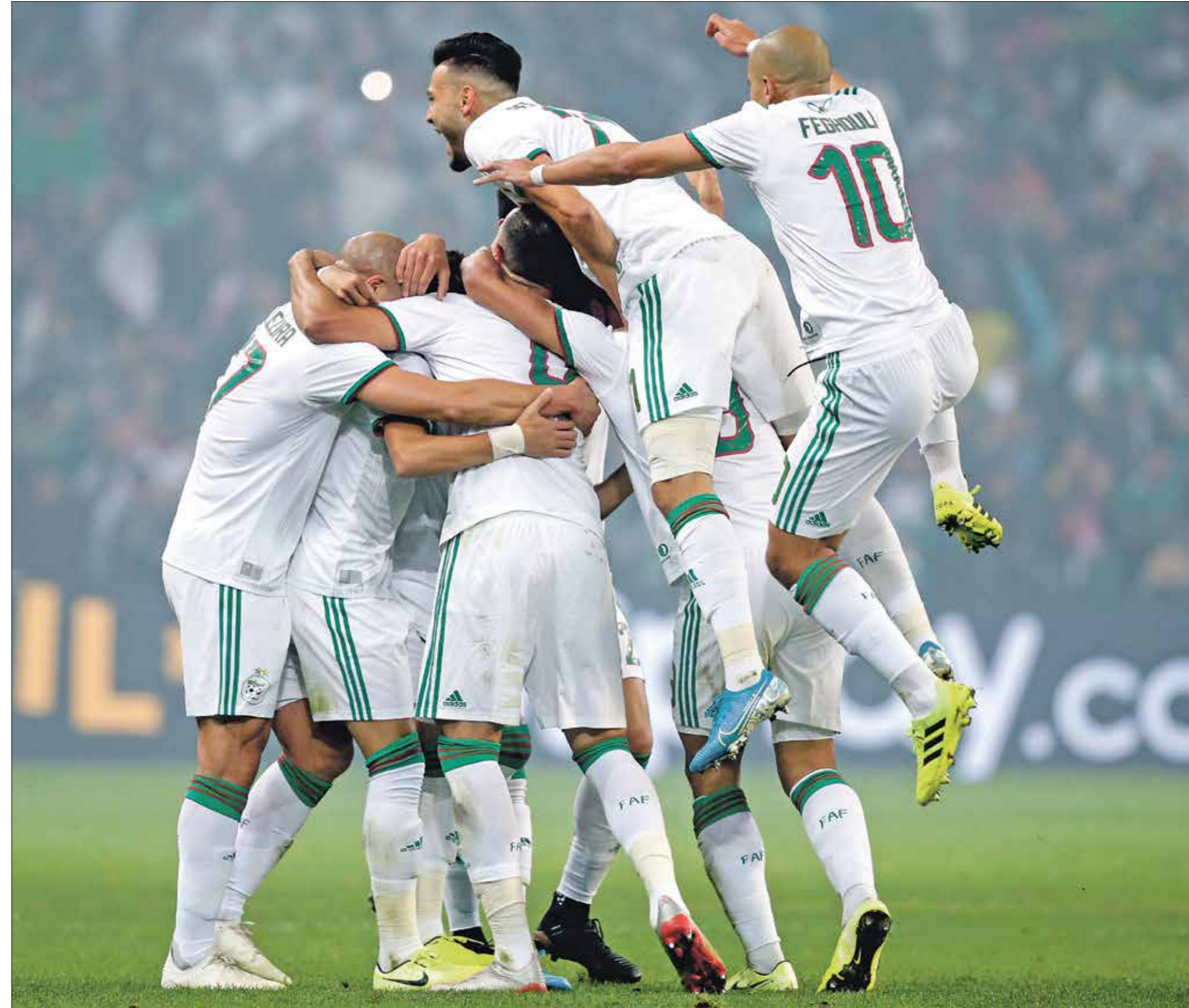
منتخب الجزائر يعتبر المرشح الأبرز للقب

الجزائر من المنتخبات المرشحة مع مصر بقوة للذهاب بعيداً