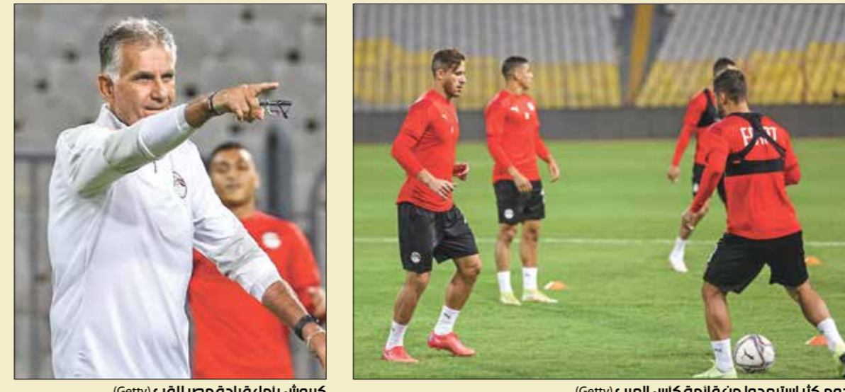
لجوم كثر استلحموا من قائمة كأس العرب