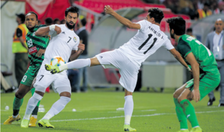
الزوراء يتناول العودة للنسكة الصحيحة

يلتقي الزوراء، مع غريمه التقليدي القوة الجوية، في كلاسيكو الكرة العراقية، في مواجهة تقام اليوم الإثنين على ملعب كربلاء الدولي، وتأتي لحساب الجولة الرابعة من عمر مسابقة الدوري الممتاز، ويدخل الجوية المواجهة وهو في أفضل حالاته، كونه يتصدر الترتيب برصيد 9 نقاط، بعد أن حقق 3 انتصارات متتالية في الجولات والتقدم في ترتيب المسابقة. ويبدأ الزوراء بحسب القمعة، كون «النوارس» لا يمررون بالوقت جميلة، حيث جمعوا 5 نقاط فقط