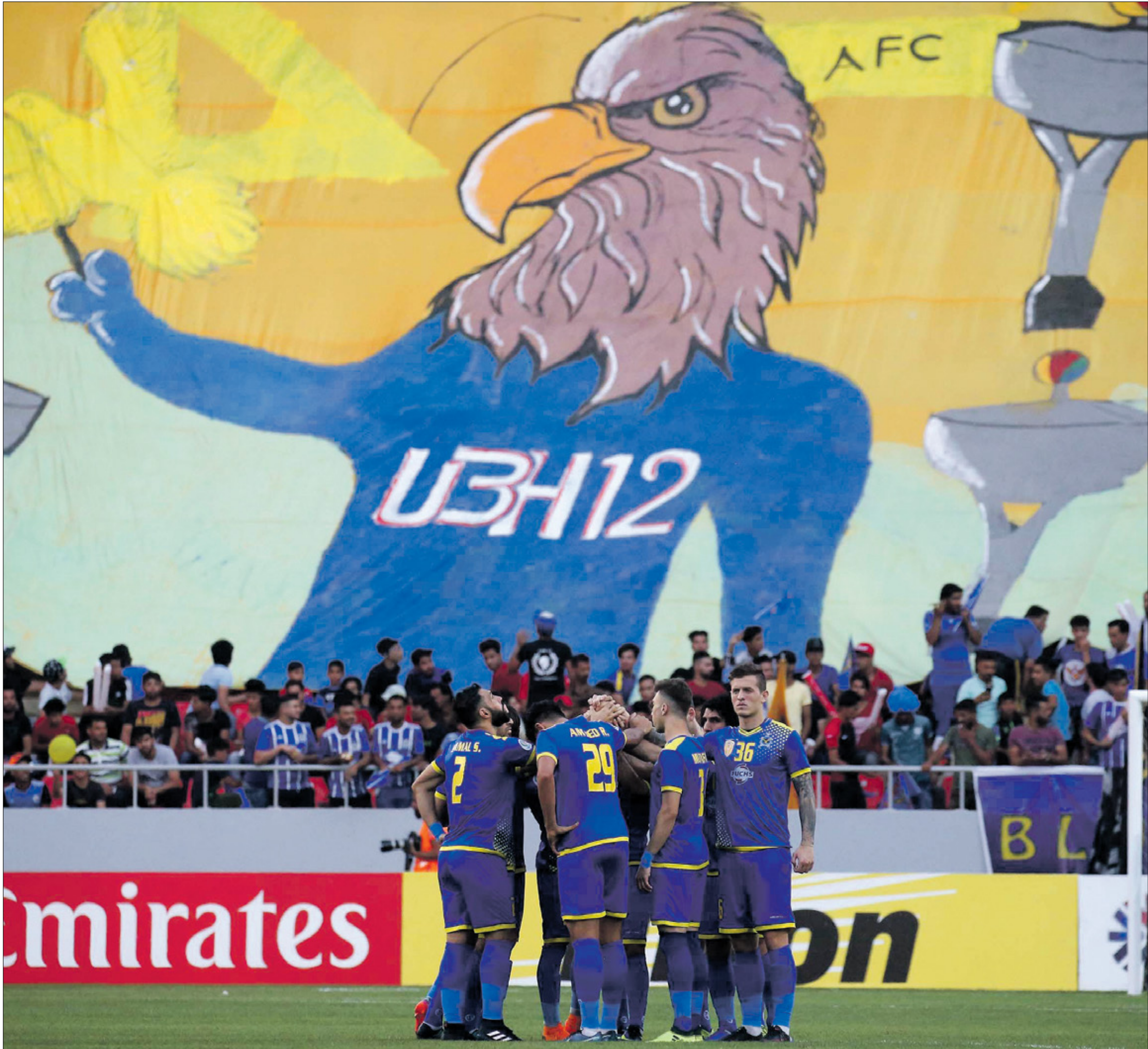
الجوية يلصق ترتيب الدوري العراقي