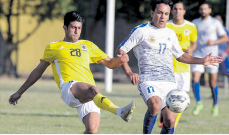
الجوية يصانق مع بعض الفتيات