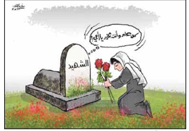
الأم السورية شهيدة من ضحايا الحرب (موقف فانت، سيريا تي في)