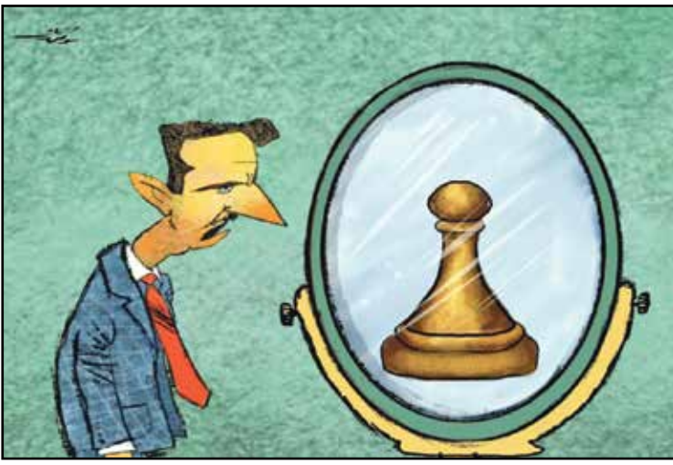
بشار الأسد يرى حقيقته في المرأة (موقف فانت، فيسبوك)