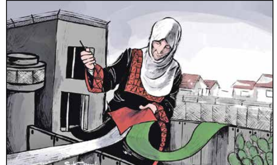
الأم الفلسطينية تجمع شتات شعبها (محمد سباعة، فيسبوك)

بمناسبة عيد الأم المصادف هذا الأسبوع، أبدع عديد من المبدعين الكاريكاتيريين رسومات في تكريم الأم العربية وتمجيد قيمتها الإنسانية العالية، وركز عدد منهم على أمهات الأسرى والمعتقلين وما يعانينه كأمهات مكلومات يفقدن فلذات أكبادهن، علاوة على رسومات أخرى تركز على أهمية الأم كلبنة أساسية في بناء الأسرة وفي تربية الأطفال.