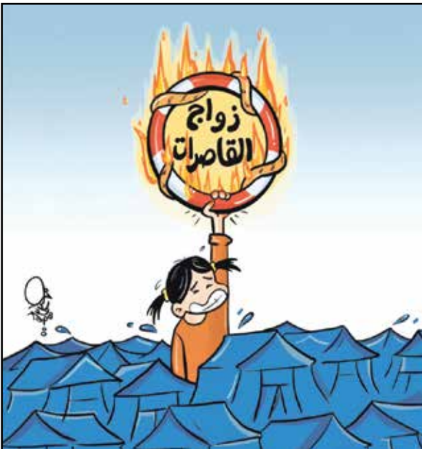
من ينفذ اللاجئ من زواج القاصرات؟ (ناصر إبراهيم، تويتز)