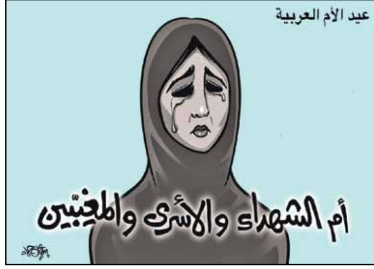
أم المعتقلين والأسرى في حداد وحزن (اسماعيل حماد، توفيق)

بالطبع، لم يكن الزعيم على استعداد للتنازل عن قرار حظر التجوال، الذي رأى فيه فرصة لتقييد حركات المعارضة والبطش برموزها، لكنه في المقابل، كان يبحث عن مخرج يحفظ عليه هيئته. وفي خضم هذه «الثنائية القطبية» التي أوشكت على تمزيقه، جاءه الإنقاذ من كبير مستشاريه لشؤون السجون، الذي اقترح إجراء تعديل طفيف على مرسوم الحظر، ليصبح: «عطفاً على قرارنا رقم مليار وأربعة وستين، ولأسباب إنسانية بحتة، تستثنى السجون من قرار حظر التجوال».