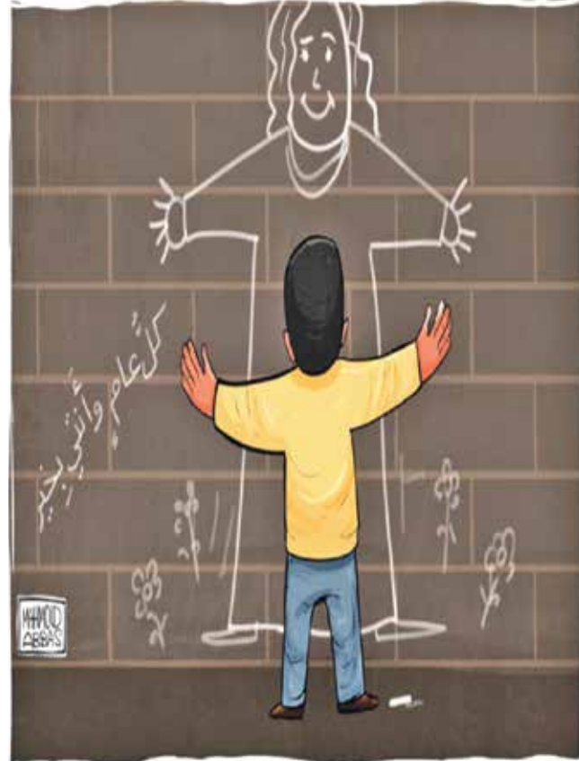
طفله الشوارع يفتقد أمه المرسومة في خياله