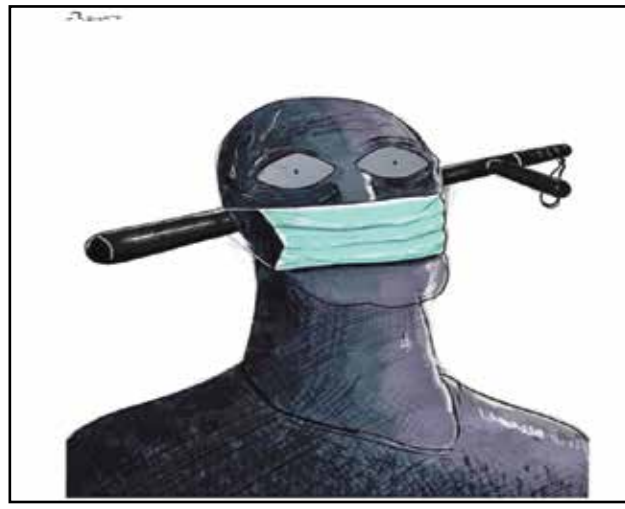
فجع محتجب الأردن في زمن كورونا (رافات الخطيب، فيسبوك)